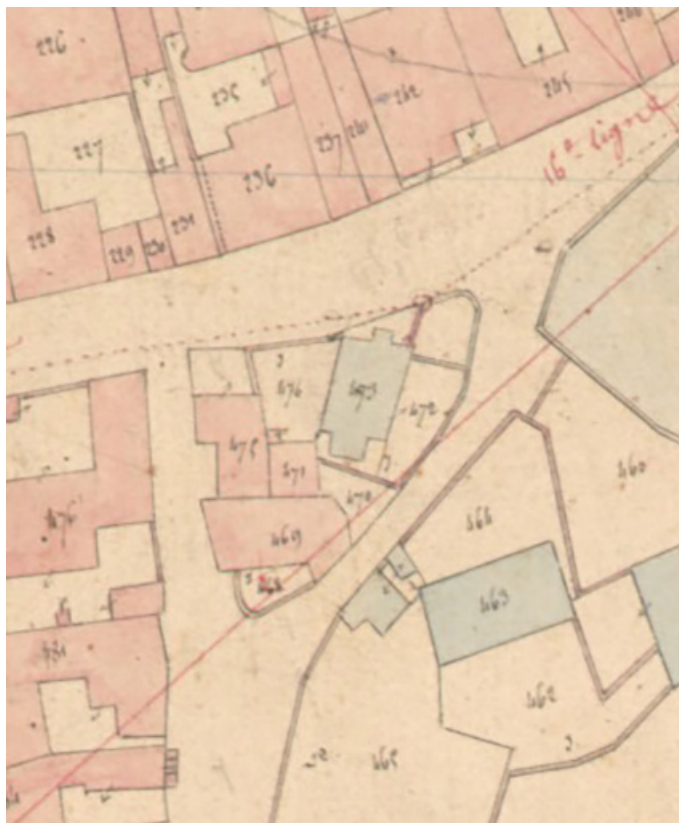
Extrait de l'Atlas parcellaire (1836) du cadastre de la commune de Scey-sur-Saône-et-Saint-Albin. 70, Scey-sur-Saône-et-Saint-Albin, 24 rue de l' Église