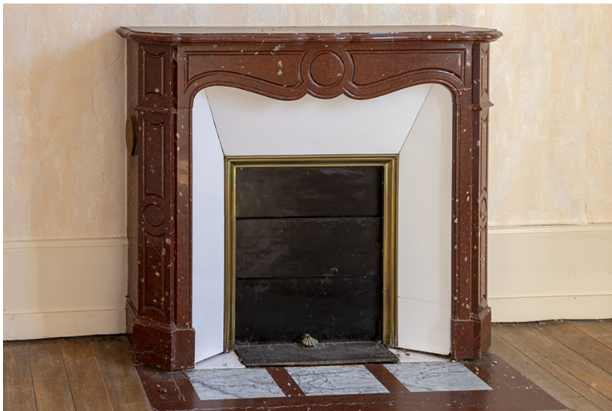
Cheminée dans une chambre, premier étage. 70, Scey-sur-Saône-et-Saint-Albin, 13 rue Hugot