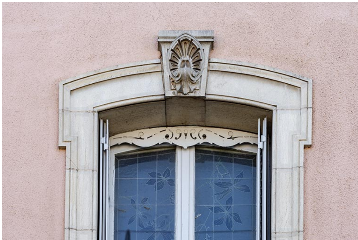
Fenêtre avec clé de voûte, façade antérieure. 70, Scey-sur-Saône-et-Saint-Albin, 13 rue Hugot