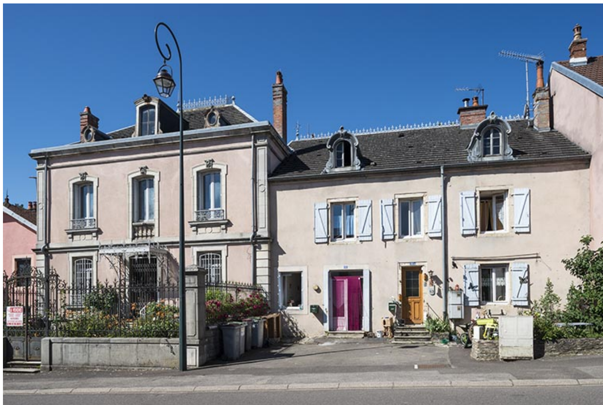
Au centre, la maison située sur l'ancienne parcelle 98 section D du cadastre napoléonien. 70, Sceaux-sur-Saône-et-Saint-Albin, 13 rue Hugot