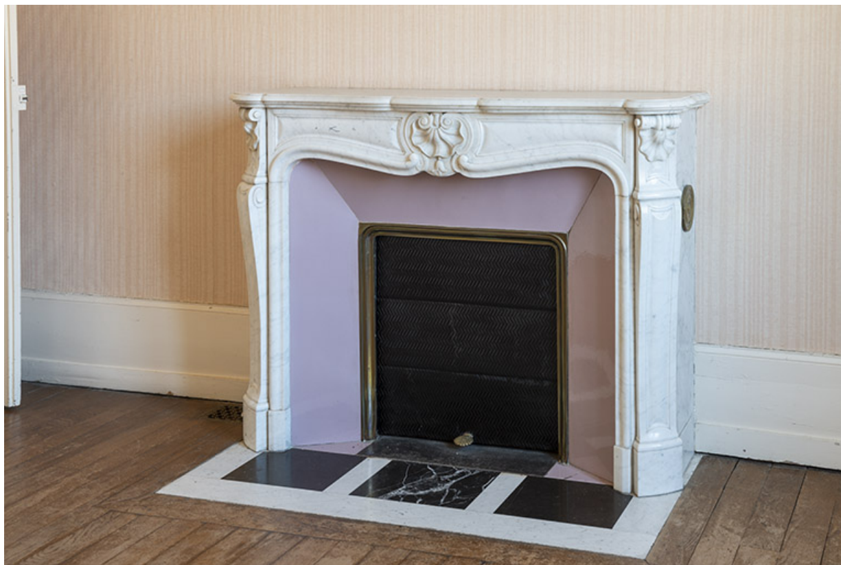
Cheminée dans une chambre, premier étage. 70, Scey-sur-Saône-et-Saint-Albin, 13 rue Hugot