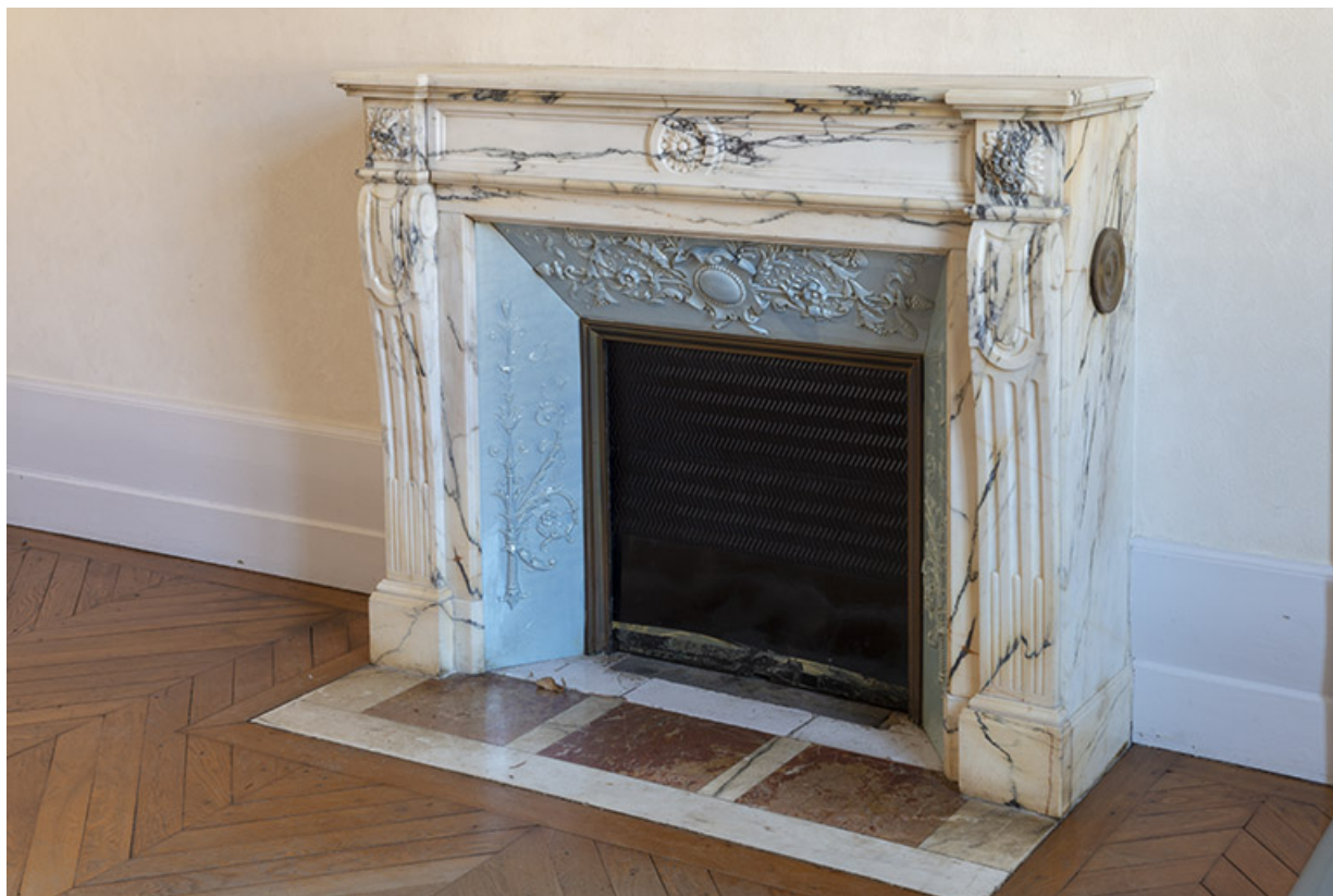
détail de la cheminée en marbre, rez-de-chaussée.

70, Scey-sur-Saône-et-Saint-Albin, 13 rue Hugot