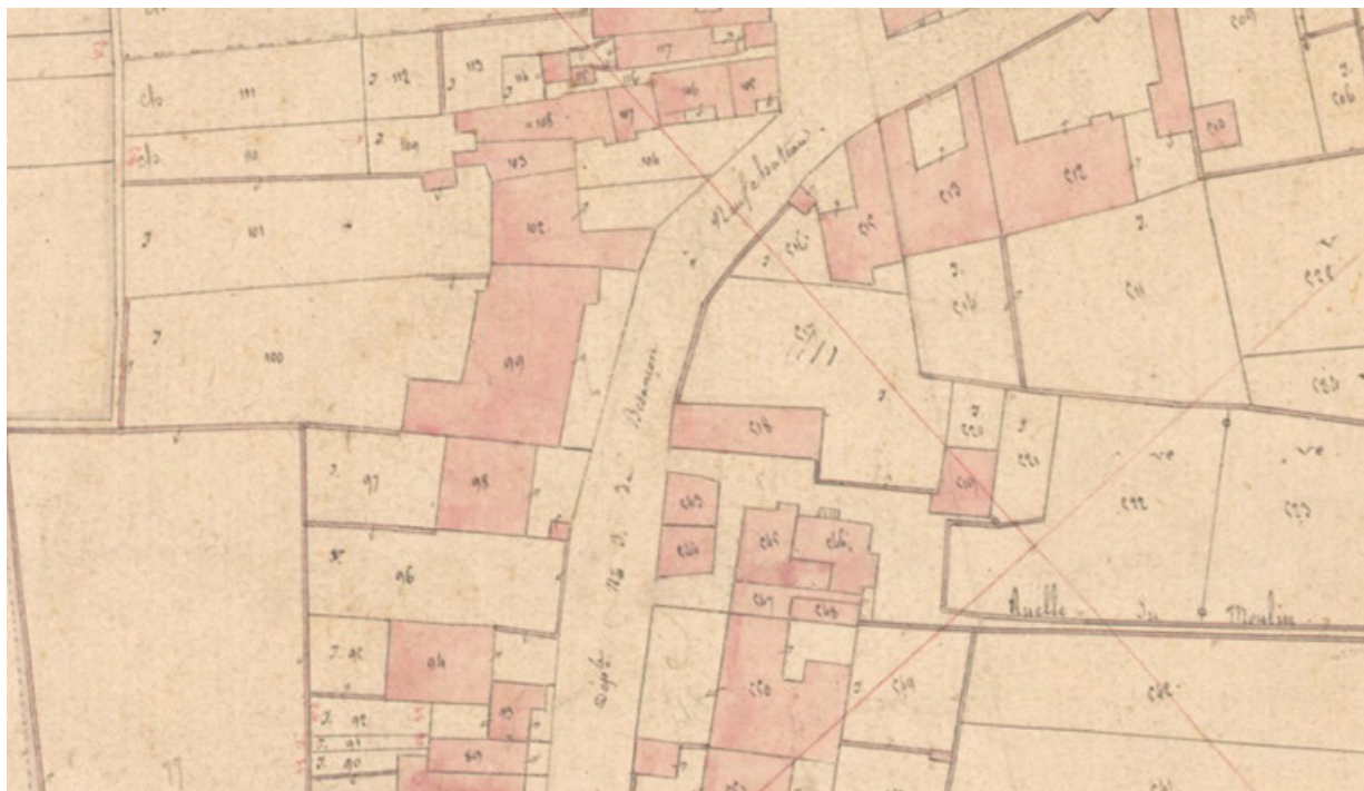
Extrait de l'Atlas parcellaire (1836) du cadastre de la commune de Scey-sur-Saône-et-Saint-Albin.

70, Scey-sur-Saône-et-Saint-Albin, 13 rue Hugot