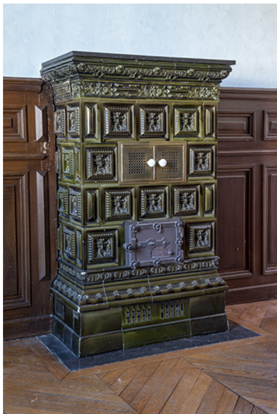
Le pôle dans la salle, rez-de-chaussée.

70, Scey-sur-Saône-et-Saint-Albin, 13 rue Hugot