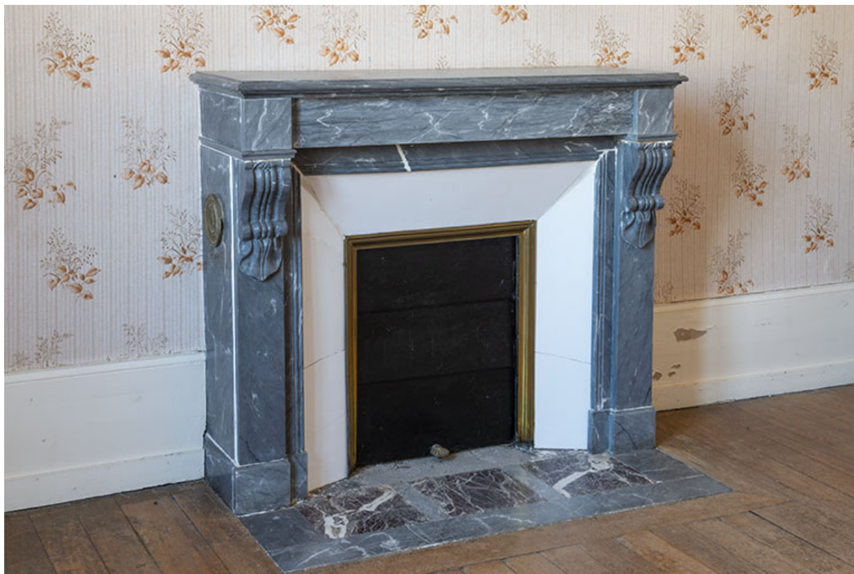
Cheminée dans une chambre, premier étage. 70, Sceaux-sur-Saône-et-Saint-Albin, 13 rue Hugot