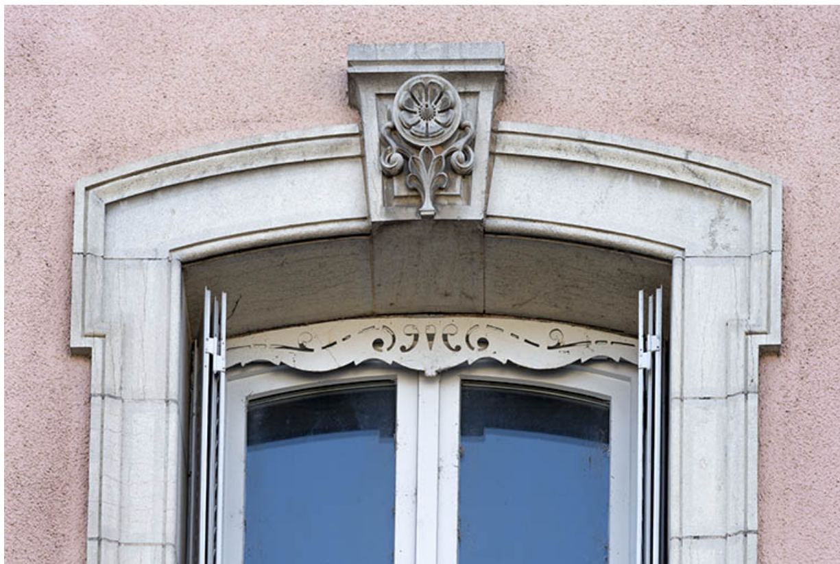
Détail d'une clé de voûte, façade antérieure.

70, Scey-sur-Saône-et-Saint-Albin, 13 rue Hugot