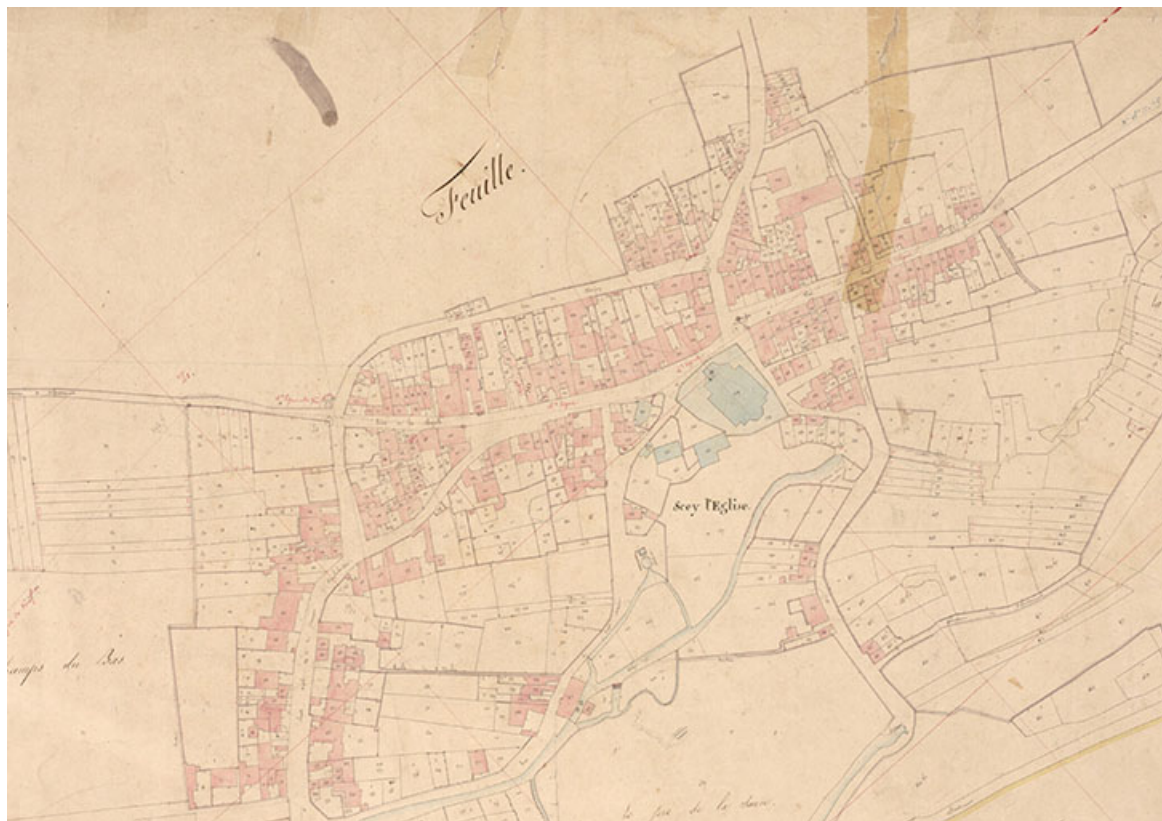
Extrait de l'Atlas parcellaire (1836) du cadastre de la commune de Sceaux-sur-Saône-et-Saint-Albin. 70, Sceaux-sur-Saône-et-Saint-Albin