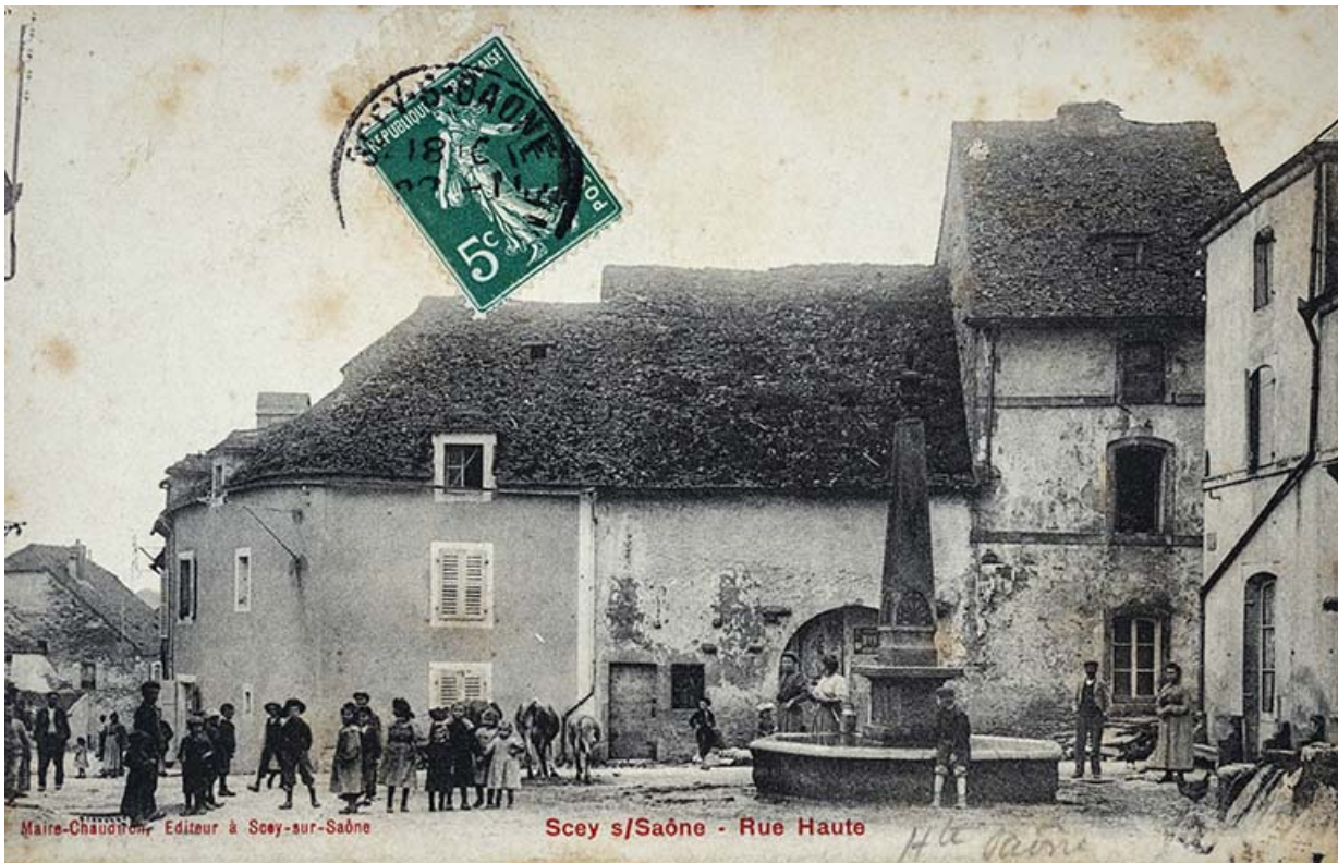
Rue de la Croix de pierre, carte postale. 70, Scey-sur-Saône-et-Saint-Albin