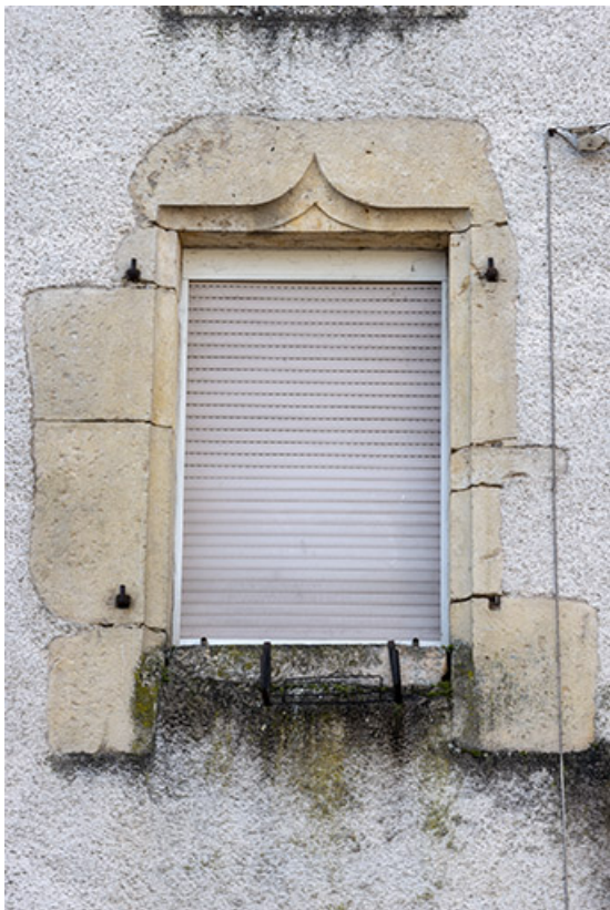
Fenêtre avec linteau en accolade.