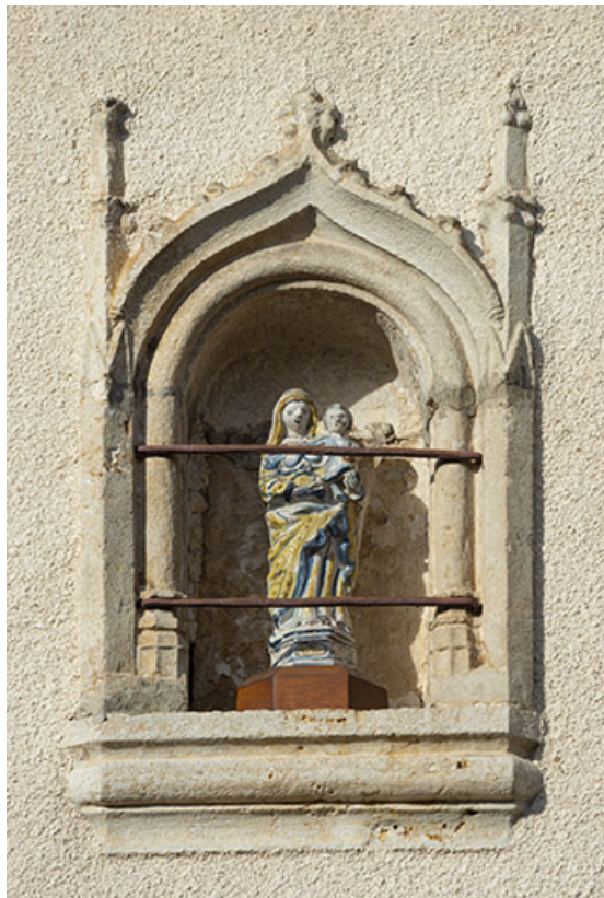
Détail de la niche et de la Vierge.