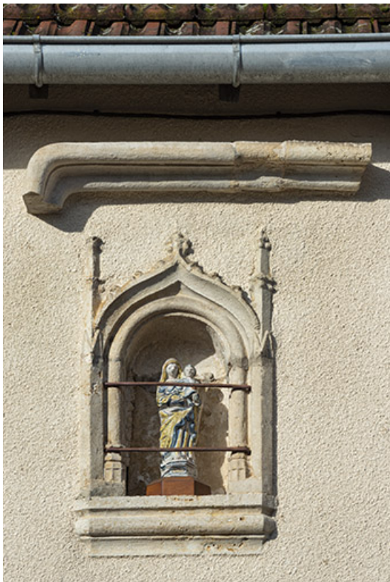
Niche et statuette surmontées d'un fragment de corniche.