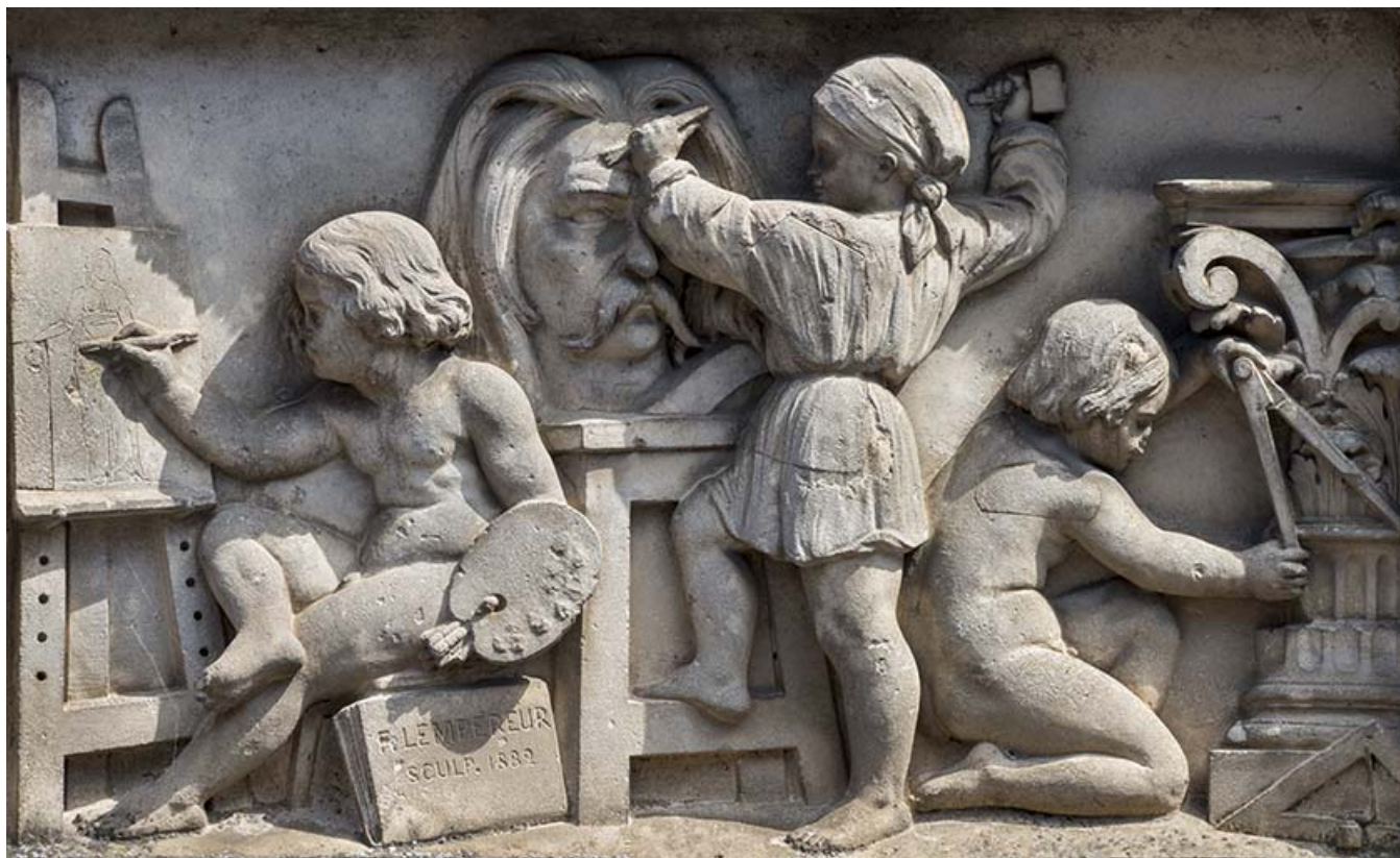
Maison Lempereur, rue de l'Eglise : détail du linteau de la porte d'entrée.

70, Scey-sur-Saône-et-Saint-Albin, 20 rue de l'Église