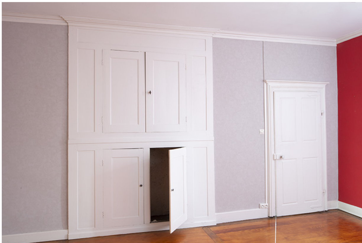
Salle à manger, rez-de-chaussée du presbytère. 70, Sceaux-sur-Saône-et-Saint-Albin