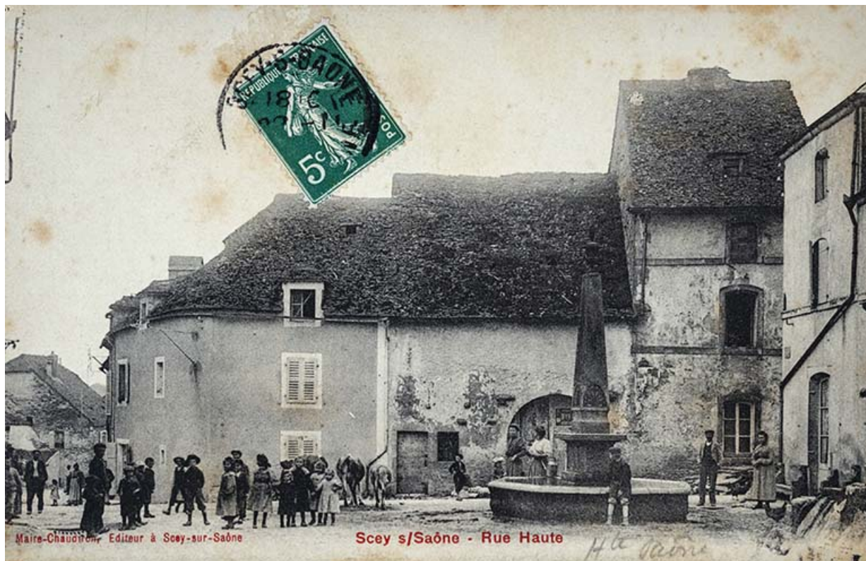
Rue de la Croix de pierre, carte postale.