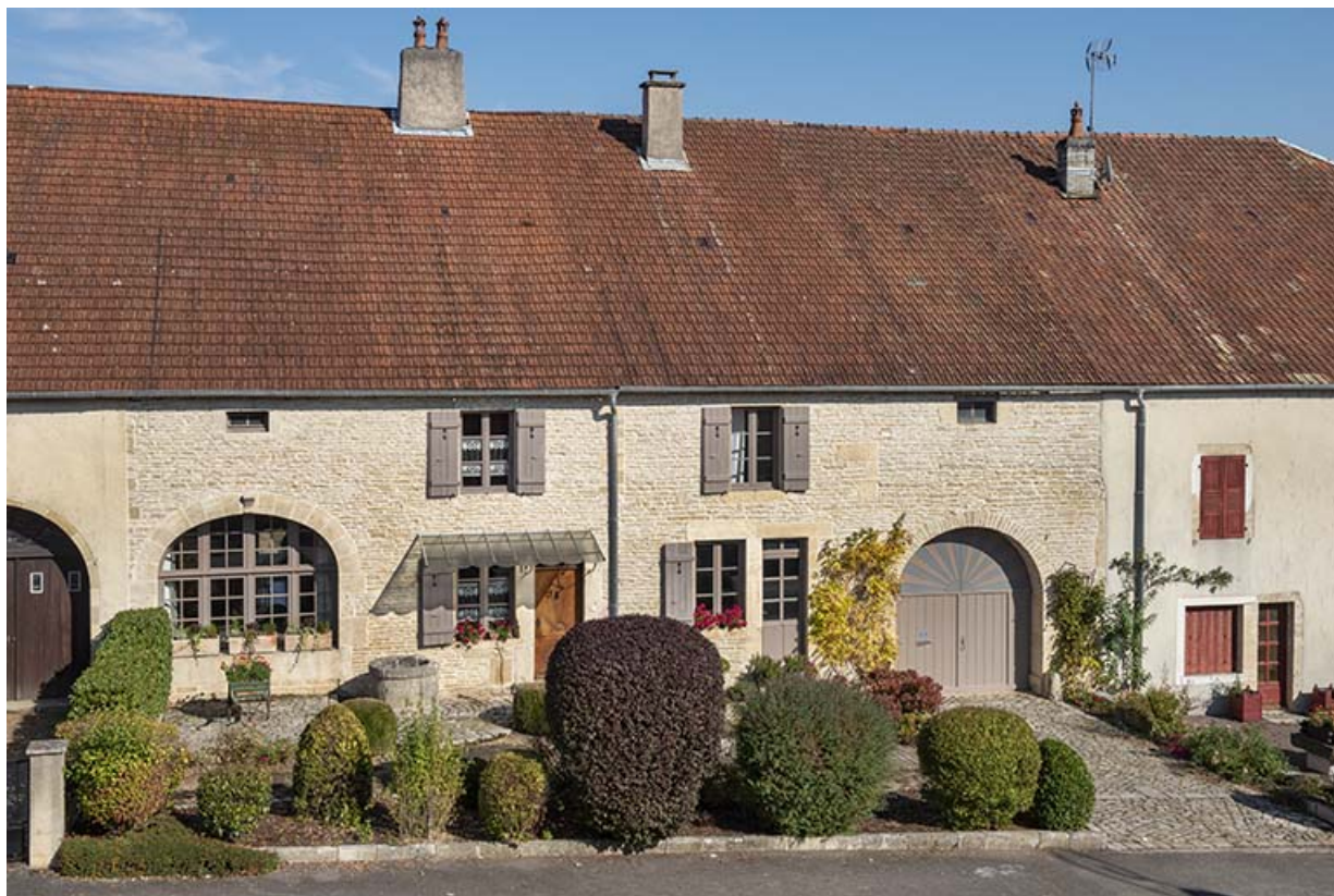
Anciennes fermes, rue Hugot. 70, Scey-sur-Saône-et-Saint-Albin