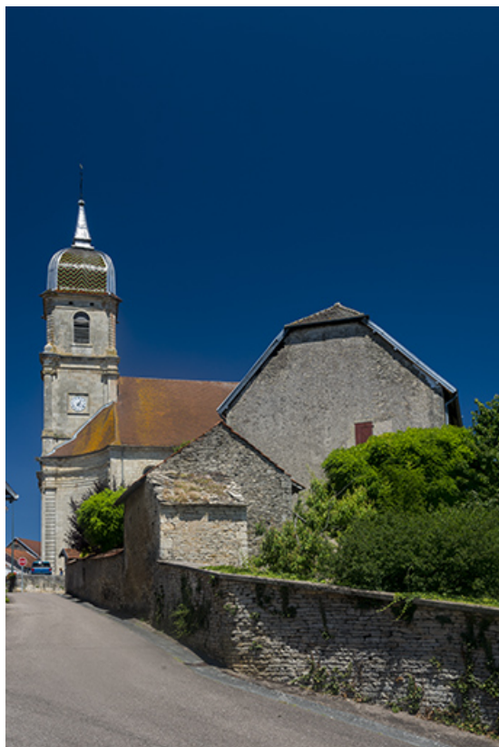
Le clocher de l'église et la rue de l'Eglise.