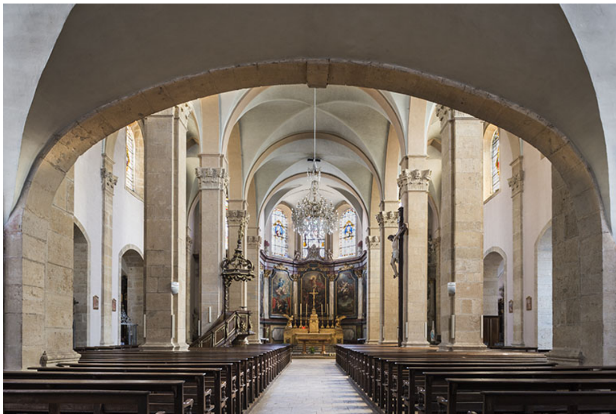
Nef, vue en direction du chœur.

70, Scey-sur-Saône-et-Saint-Albin rue de l'Église