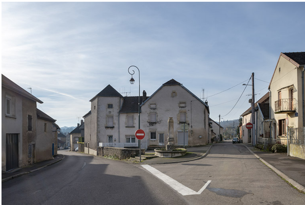
Petite place à l'intersection des rue de l'Eglise et de la Chapelle.