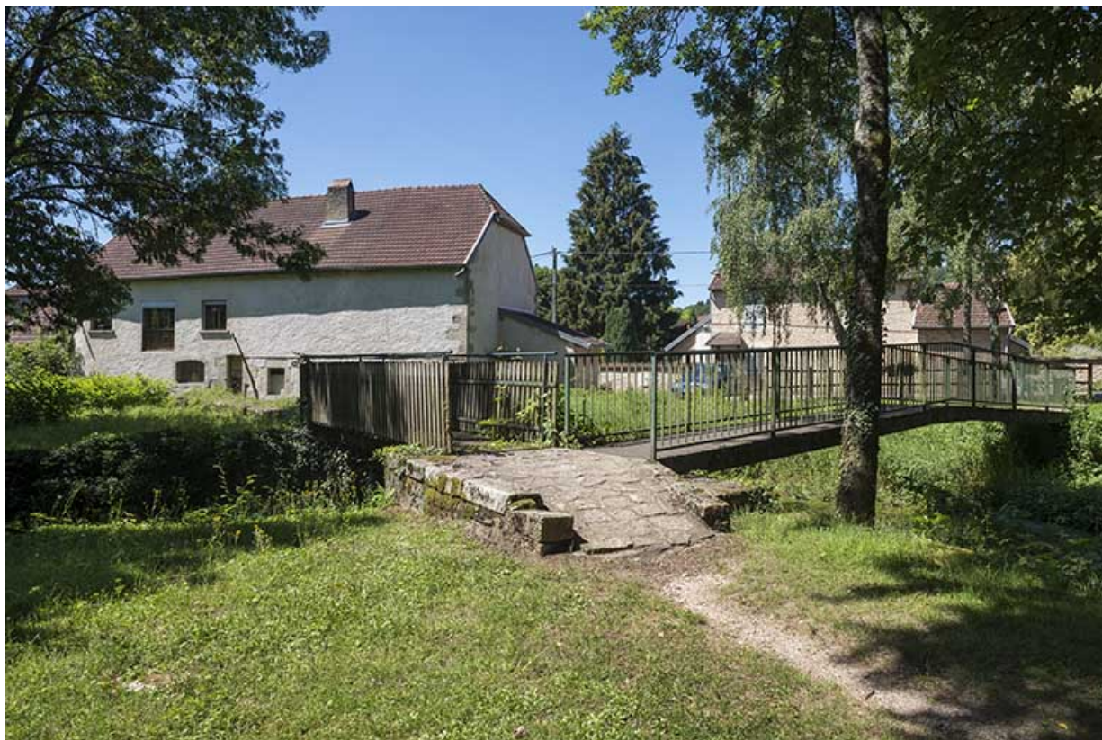
L'ancien moulin, rue du Petit Moulin.

70, Scey-sur-Saône-et-Saint-Albin, 10 rue du Petit Moulin