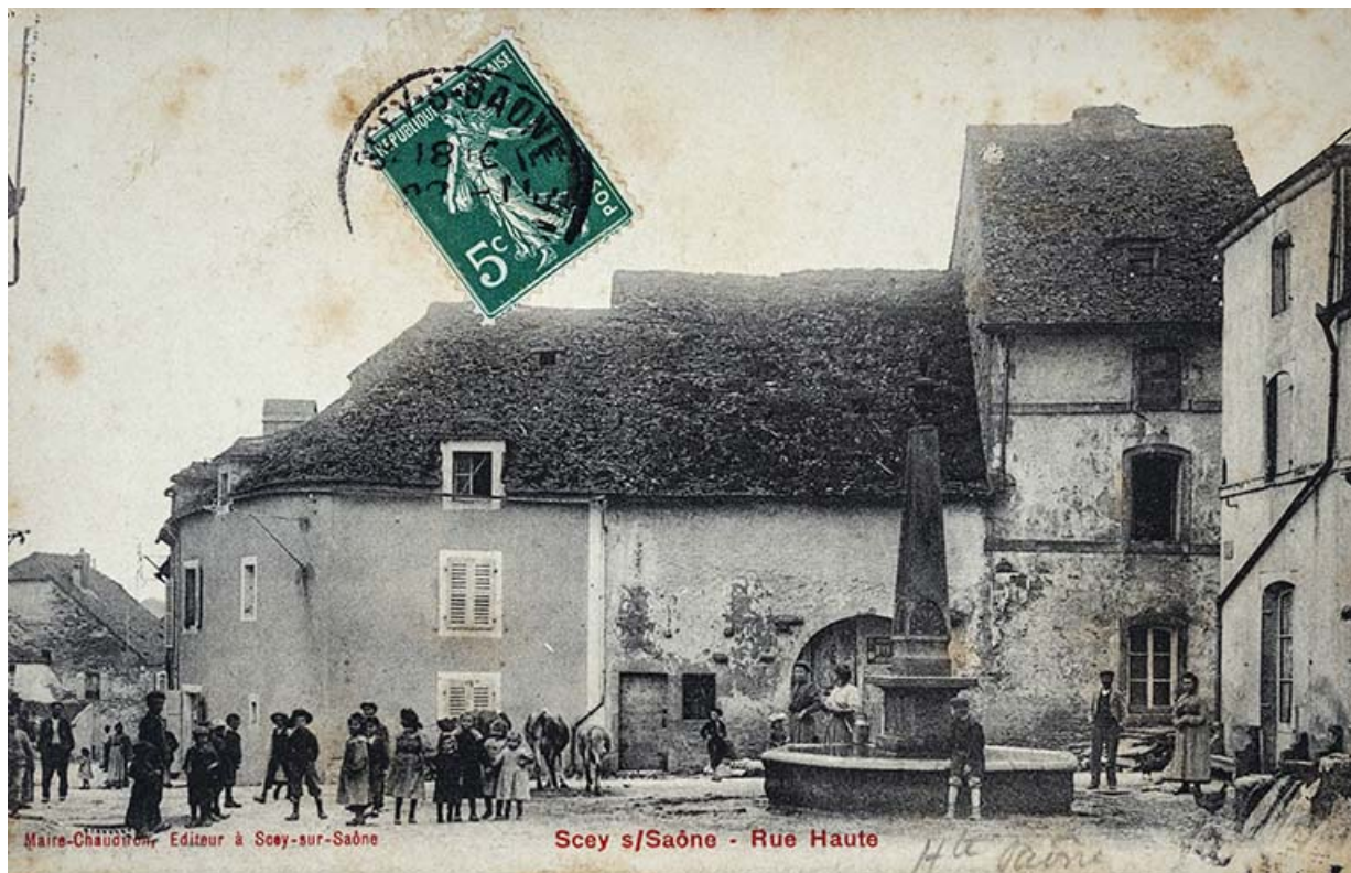
Rue de la Croix de pierre, carte postale.