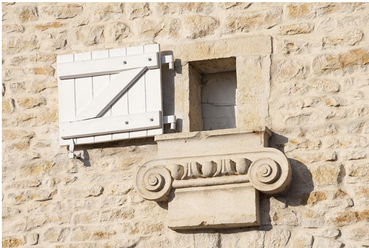
Chapiteau à volutes utilisé en emploi.