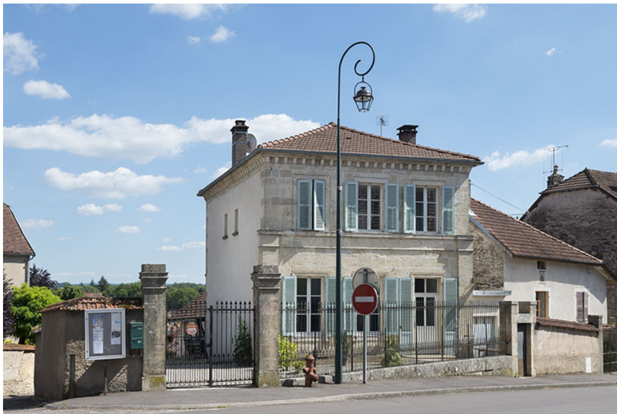
Ancienne école des filles, rue de l'Eglise. 70, Scey-sur-Saône-et-Saint-Albin