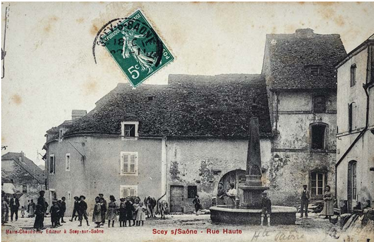
Rue de la Croix de pierre, carte postale. 70, Scey-sur-Saône-et-Saint-Albin