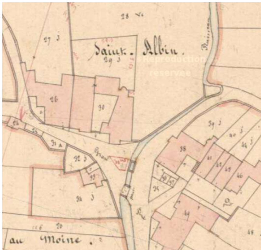
Plan de situation de 1836.

70, Scey-sur-Saône-et-Saint-Albin place Flamand