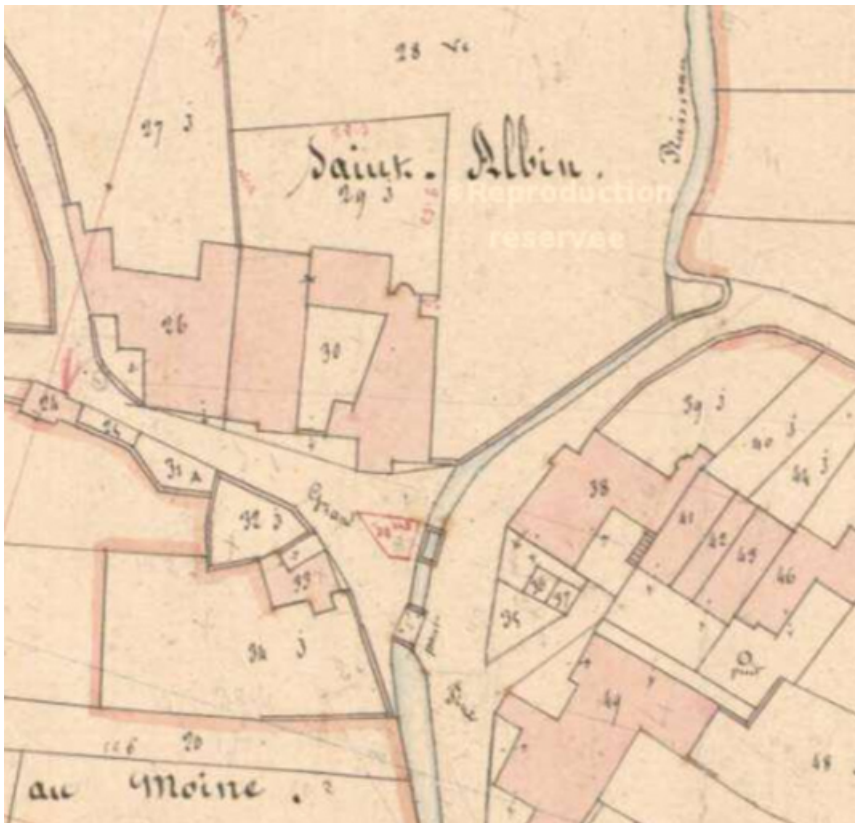
Plan de situation de 1836.

70, Scey-sur-Saône-et-Saint-Albin place Flamand