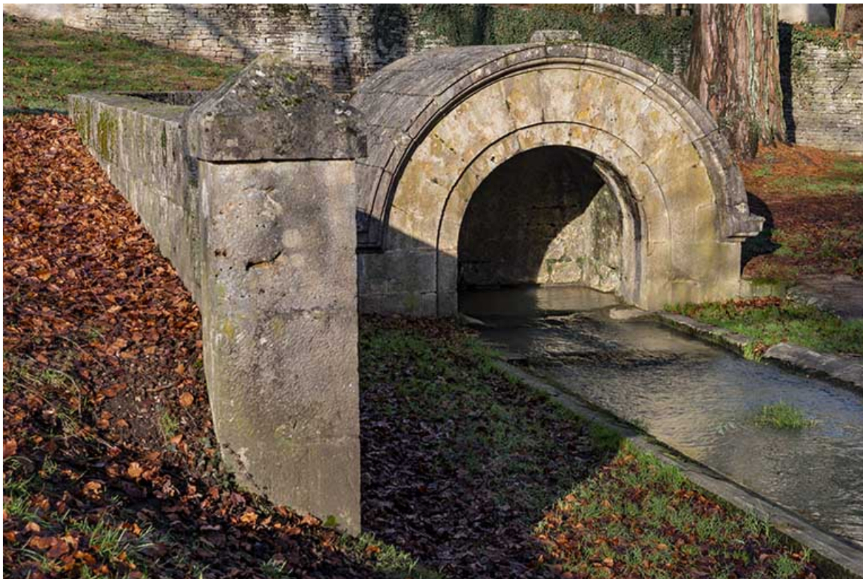
Mur de soutènement, vue depuis le sud.

70, Scey-sur-Saône-et-Saint-Albin rue de la Fontaine Larie