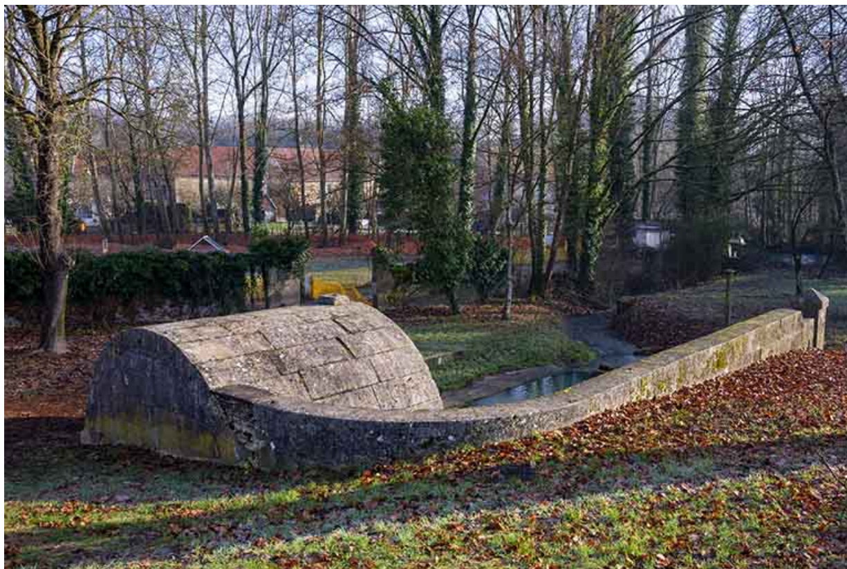
Mur de soutènement, vue depuis le nord.

70, Sceaux-sur-Saône-et-Saint-Albin rue de la Fontaine Larie