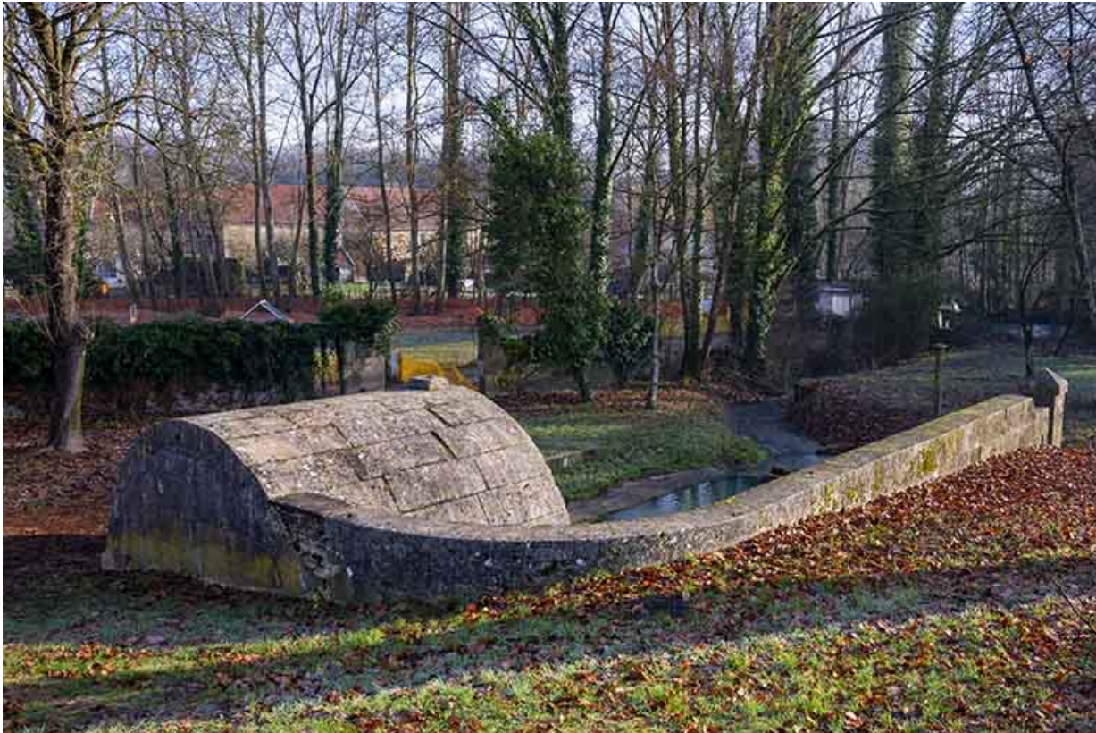
Mur de soutènement, vue depuis le nord.

70, Scey-sur-Saône-et-Saint-Albin rue de la Fontaine Larie