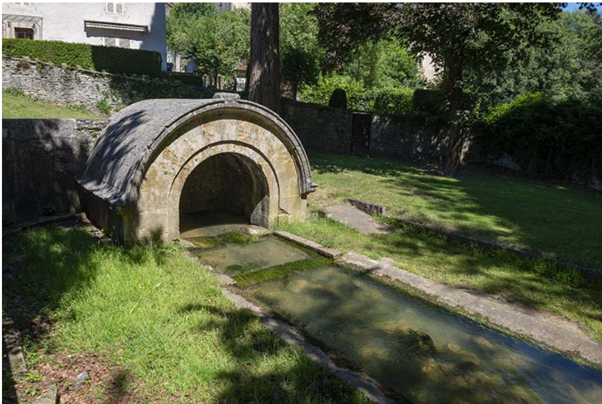
Vue d'ensemble, depuis le sud-ouest.

70, Scey-sur-Saône-et-Saint-Albin rue de la Fontaine Larie