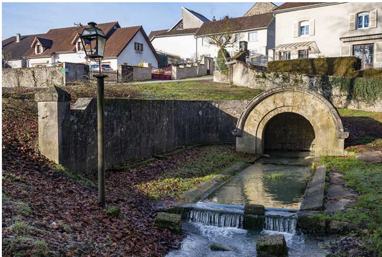
Vue d'ensemble, depuis le sud-est.

70, Scey-sur-Saône-et-Saint-Albin rue de la Fontaine Larie