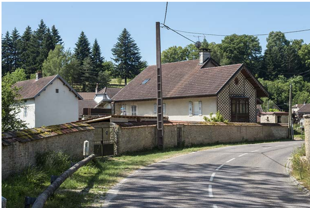
Entrée du hameau, route de Rupt-sur-Saône. 70, Sceaux-sur-Saône-et-Saint-Albin