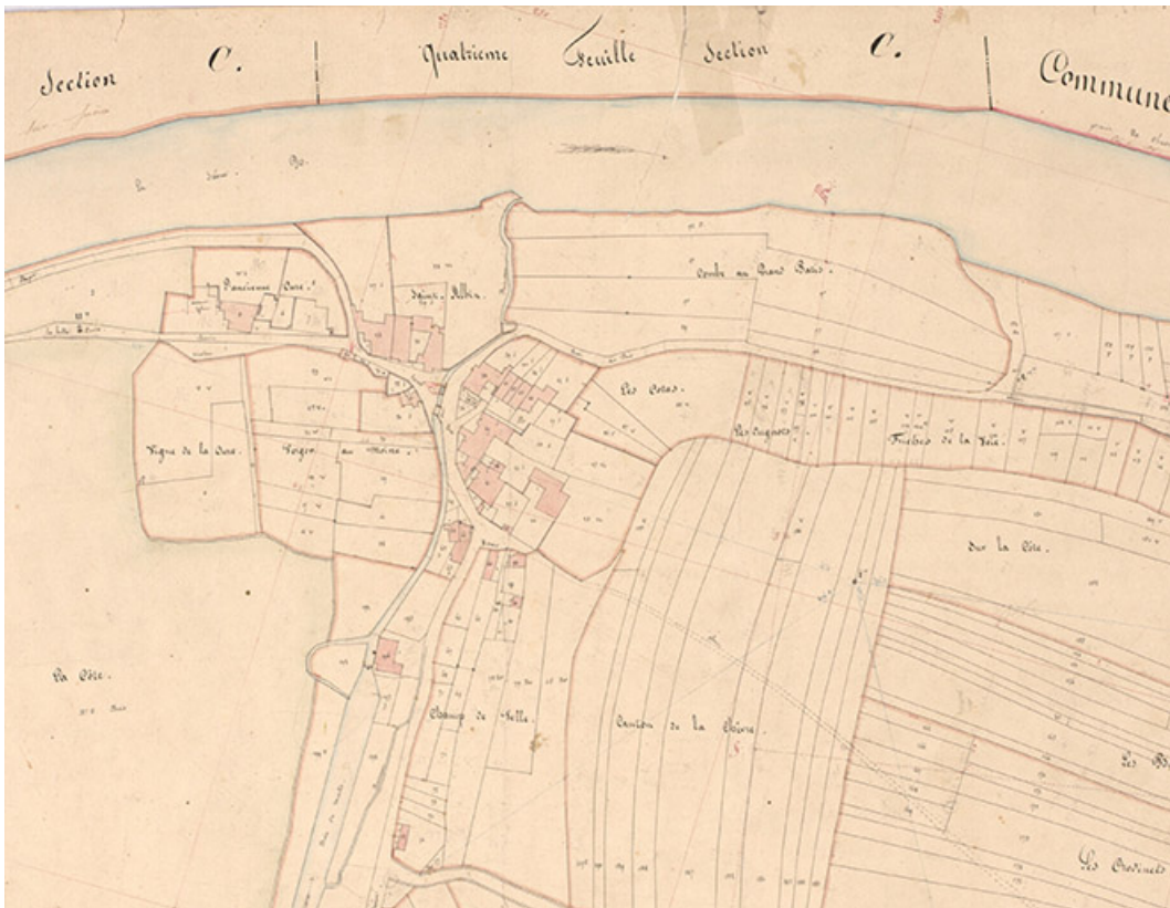
Extrait de l'Atlas parcellaire (1836) du cadastre de la commune de Scey-sur-Saône-et-Saint-Albin. 70, Scey-sur-Saône-et-Saint-Albin