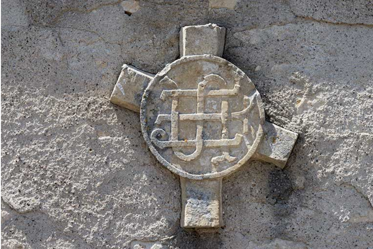
Clef de voûte de l'ancienne église de Saint-Albin incorporée dans un mur. 70, Scey-sur-Saône-et-Saint-Albin