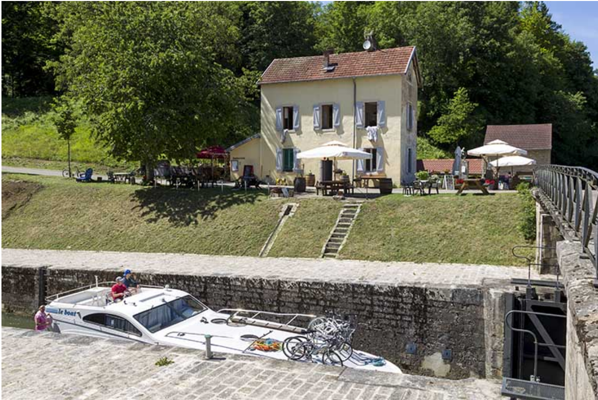
Entrée amont du tunnel Saint-Albin.