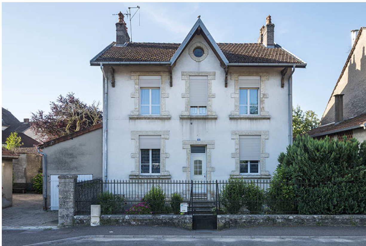
Maison n°10, vue de face.

70, Sceaux-sur-Saône-et-Saint-Albin rue du Pont de la Balance