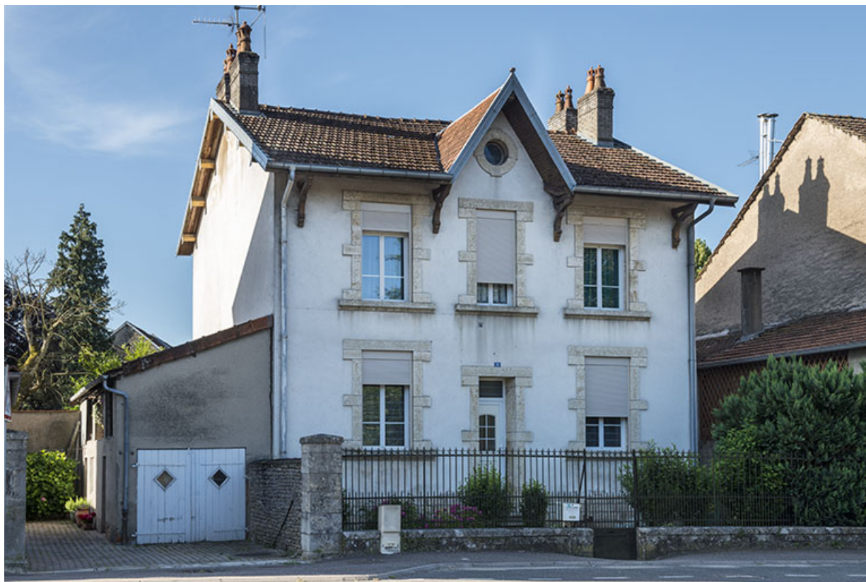
Maison n°10, vue de trois-quarts droit.

70, Sceaux-sur-Saône-et-Saint-Albin rue du Pont de la Balance