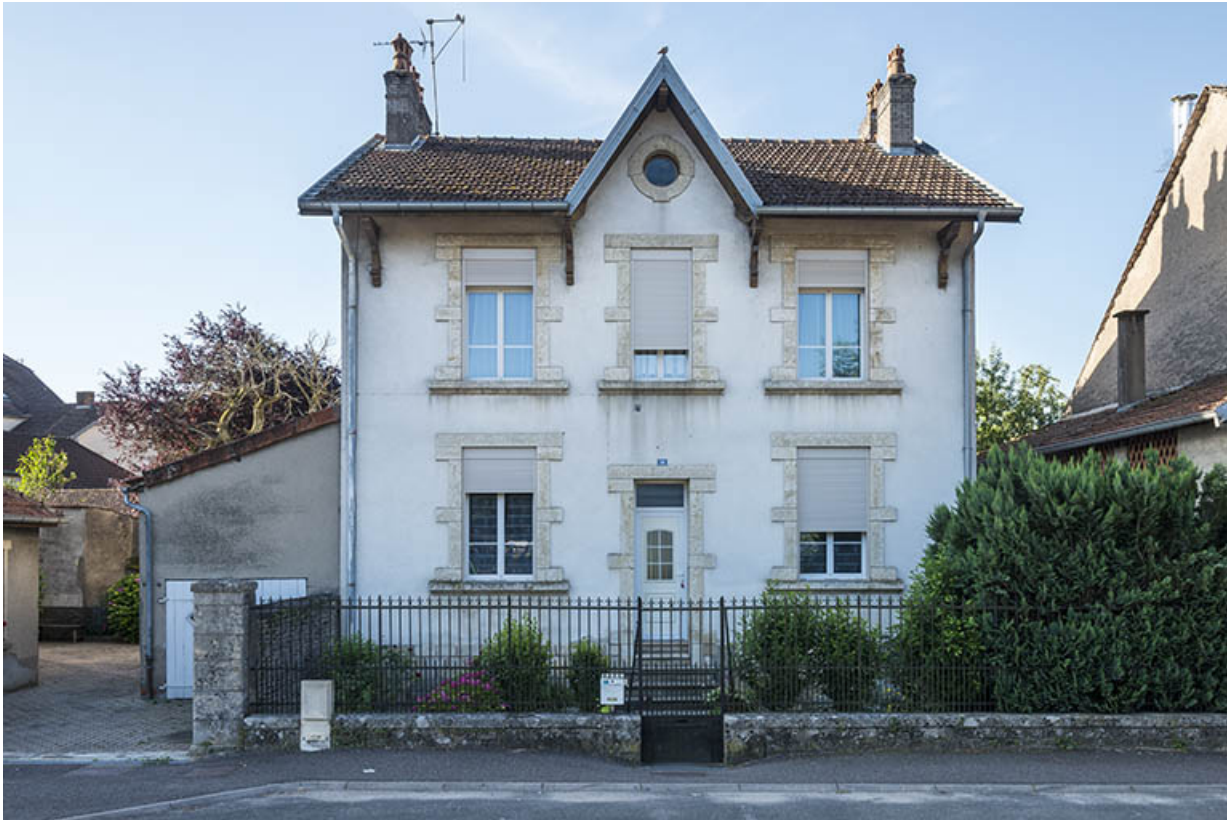
Maison n°10, vue de face.

70, Scey-sur-Saône-et-Saint-Albin rue du Pont de la Balance