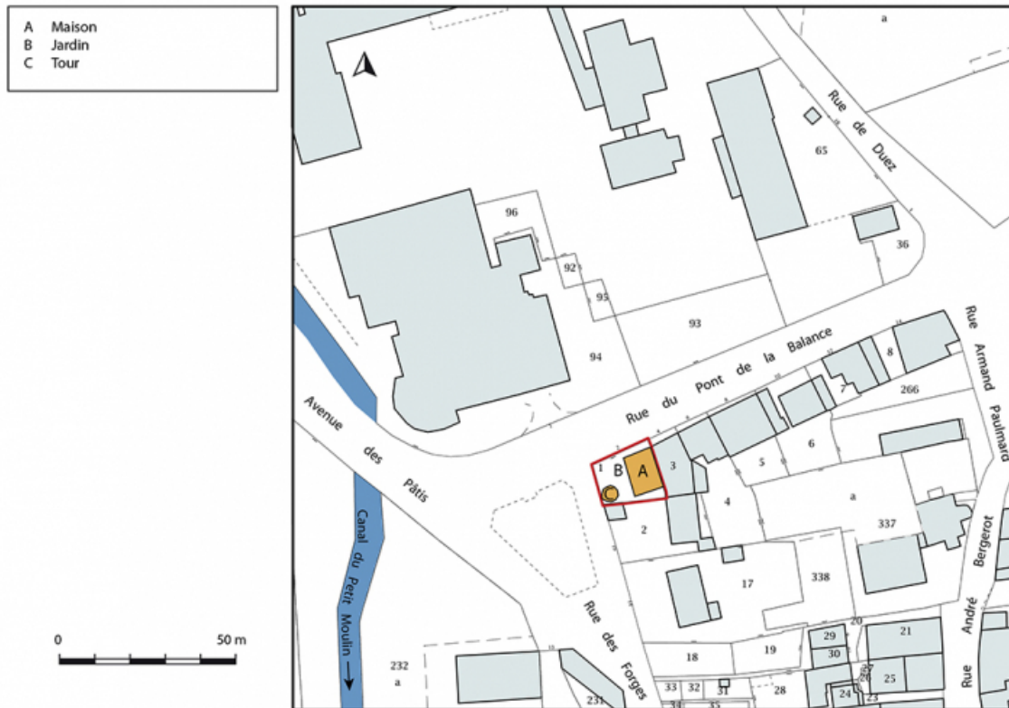
Plan-masse et de situation. Extrait du plan cadastral, 2019. 70, Sceaux-sur-Saône-et-Saint-Albin, 2 rue du Pont de la Balance