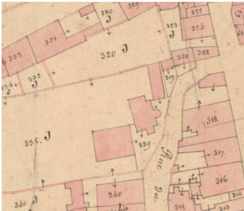
Plan de situation en 1836.

70, Scey-sur-Saône-et-Saint-Albin, 6 rue André Bergerot