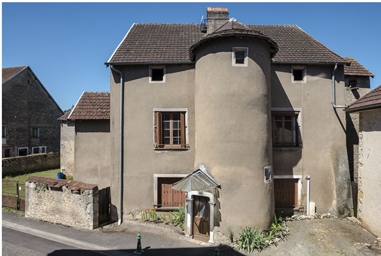
Élévation sur la rue André Bergerot, vue de face.

70, Scey-sur-Saône-et-Saint-Albin, 6 rue André Bergerot