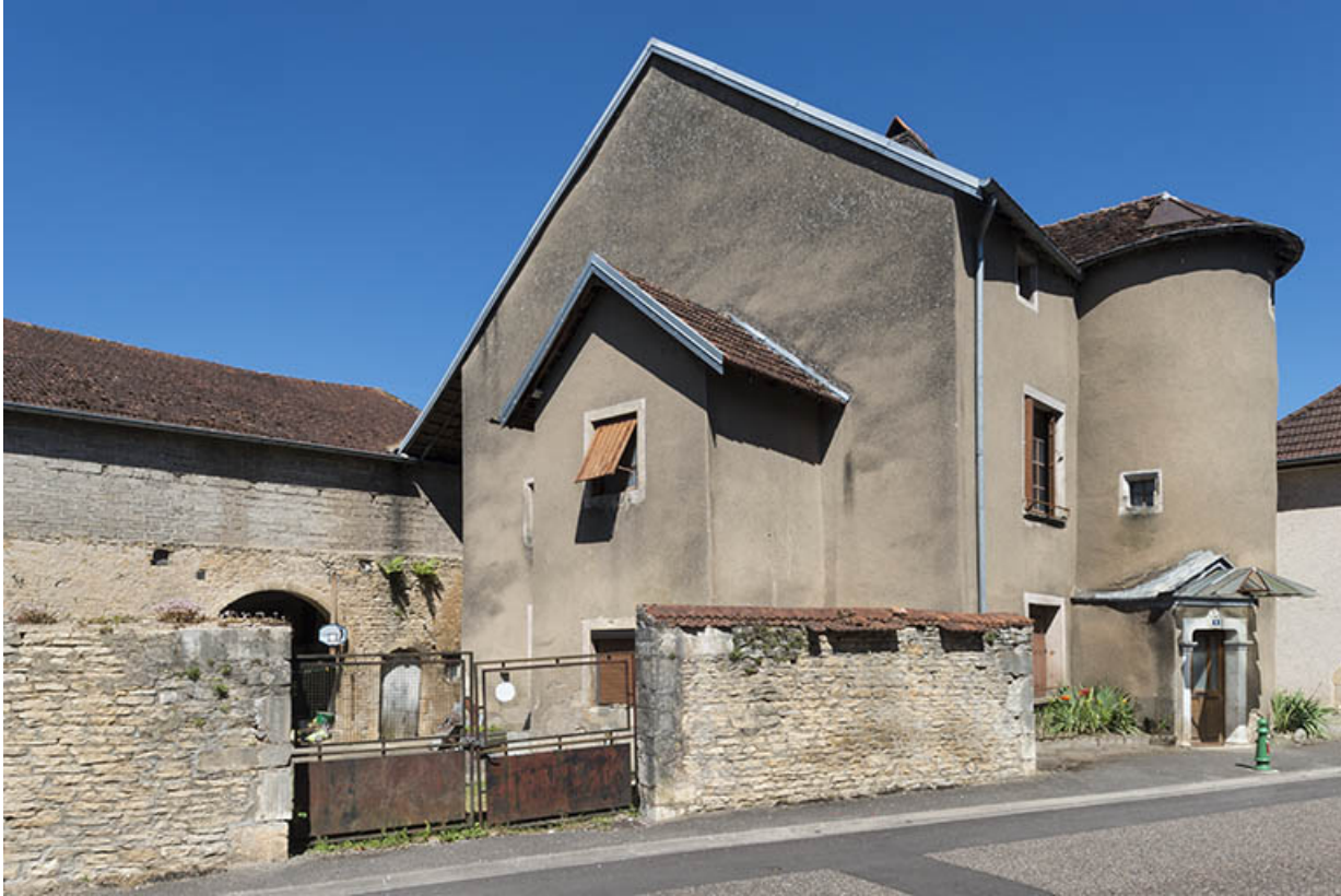
Élévation sur la rue André Bergerot, vue de trois-quarts.

70, Scey-sur-Saône-et-Saint-Albin, 6 rue André Bergerot