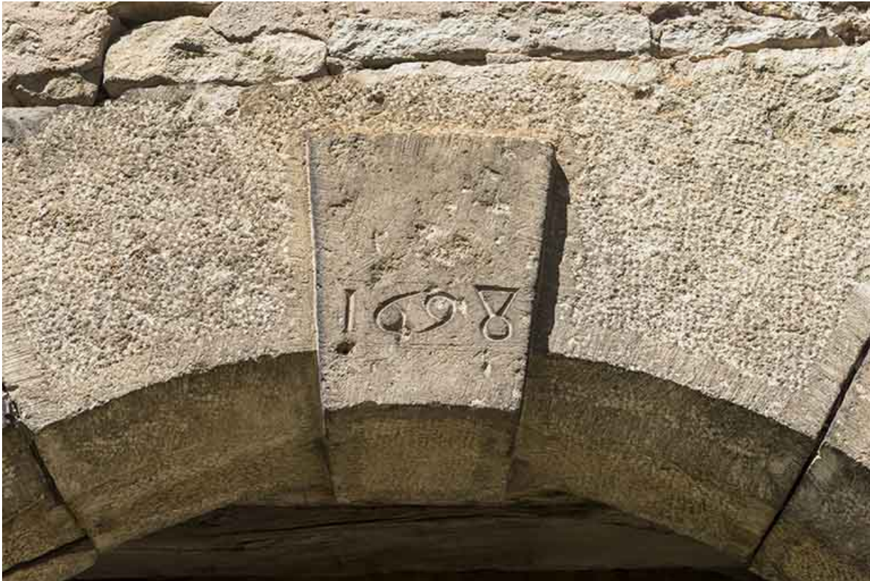
Date gravée (1698).

70, Scey-sur-Saône-et-Saint-Albin, 6 rue André Bergerot