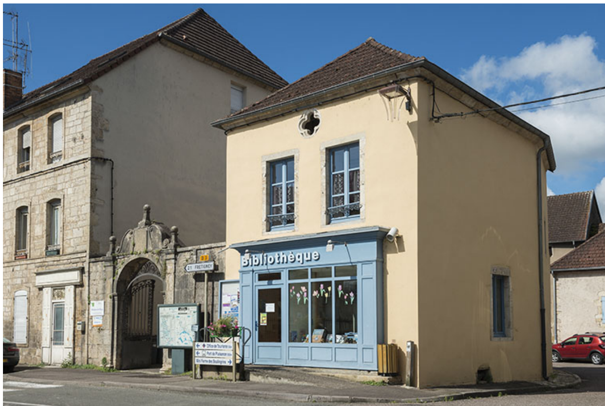
Élévation sur la rue Armand Paulmard, vue de trois-quarts.

70, Scey-sur-Saône-et-Saint-Albin, 6 rue Armand Paulmard