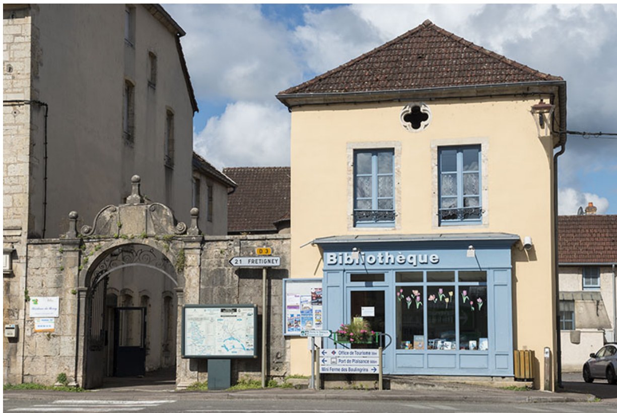
Élévation sur la rue Armand Paulmard, vue de face.

70, Sceaux-sur-Saône-et-Saint-Albin, 6 rue Armand Paulmard