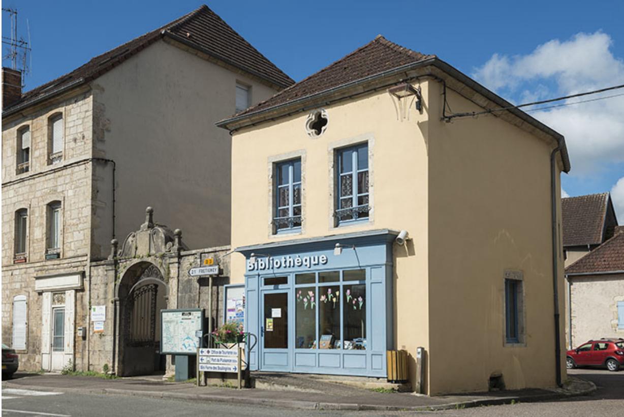
Élévation sur la rue Armand Paulmard, vue de trois-quarts.

70, Scey-sur-Saône-et-Saint-Albin, 6 rue Armand Paulmard