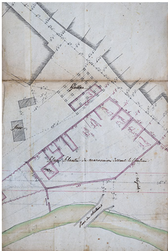
Plan de masse en 1781.

70, Scey-sur-Saône-et-Saint-Albin, 34 rue Armand Paulmard