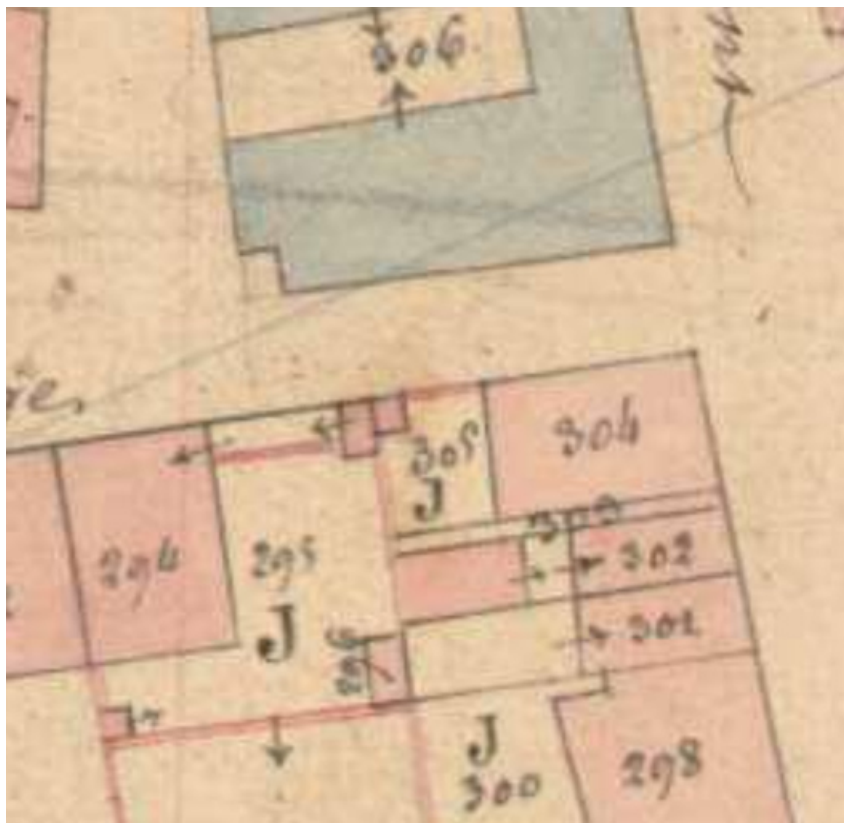
Plan de masse en 1836.

70, Scey-sur-Saône-et-Saint-Albin, 34 rue Armand Paulmard