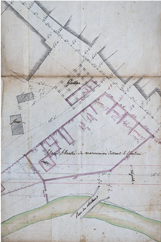
Plan de masse en 1781.

70, Scey-sur-Saône-et-Saint-Albin, 34 rue Armand Paulmard