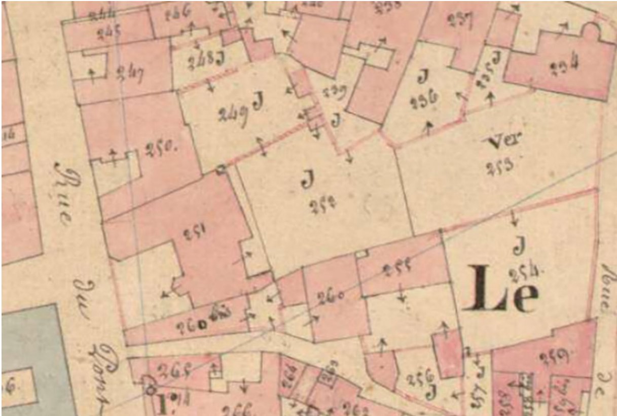
Plan de situation en 1836.

70, Scey-sur-Saône-et-Saint-Albin, 21 rue Armand Paulmard