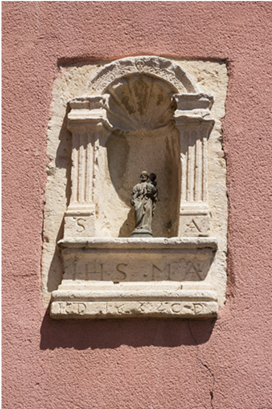
Niche sculptée datée de 1682.

70, Scey-sur-Saône-et-Saint-Albin, 21 rue Armand Paulmard