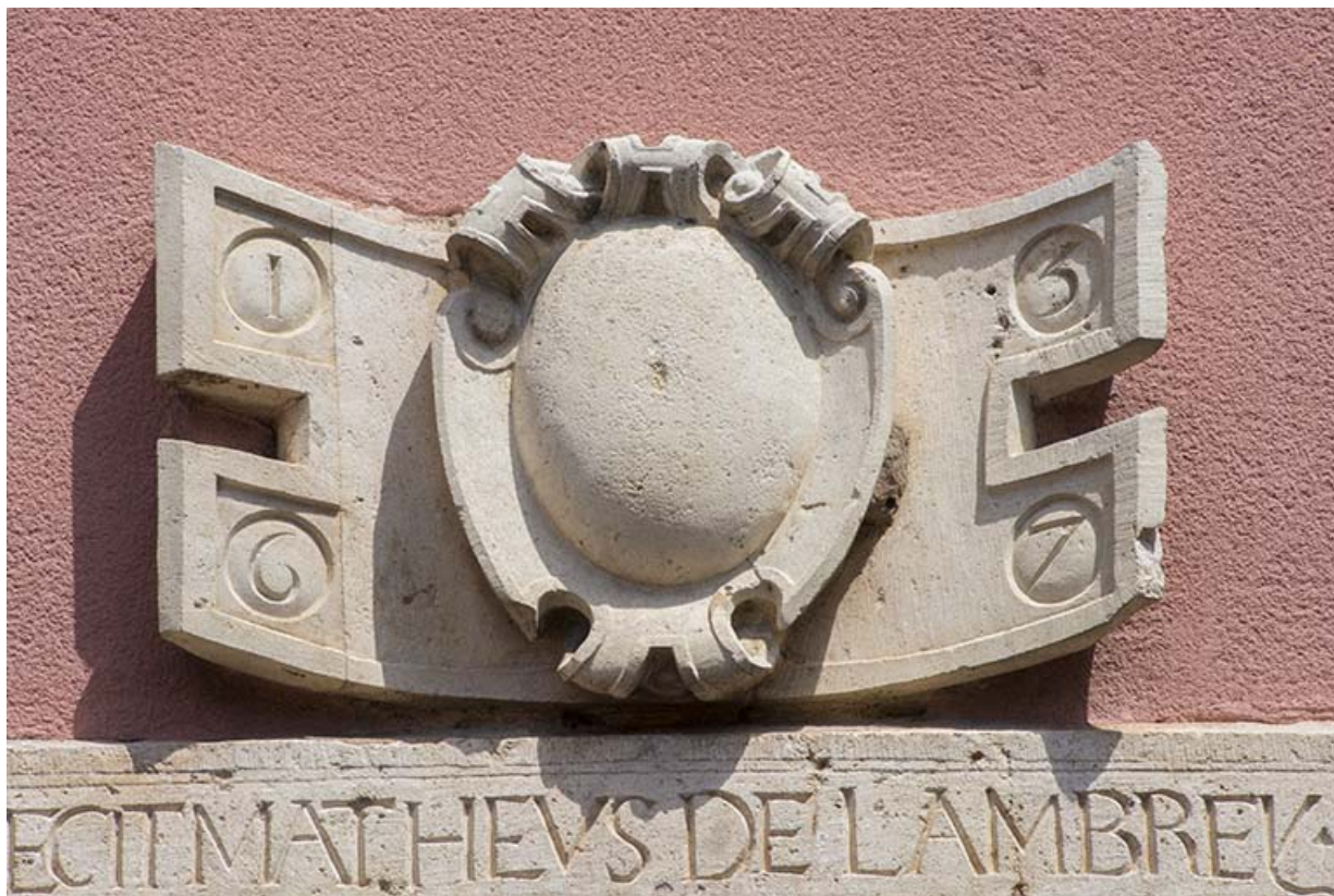
Linteau et relief sculptés datés de 1567.

70, Sceaux-sur-Saône-et-Saint-Albin, 21 rue Armand Paulmard