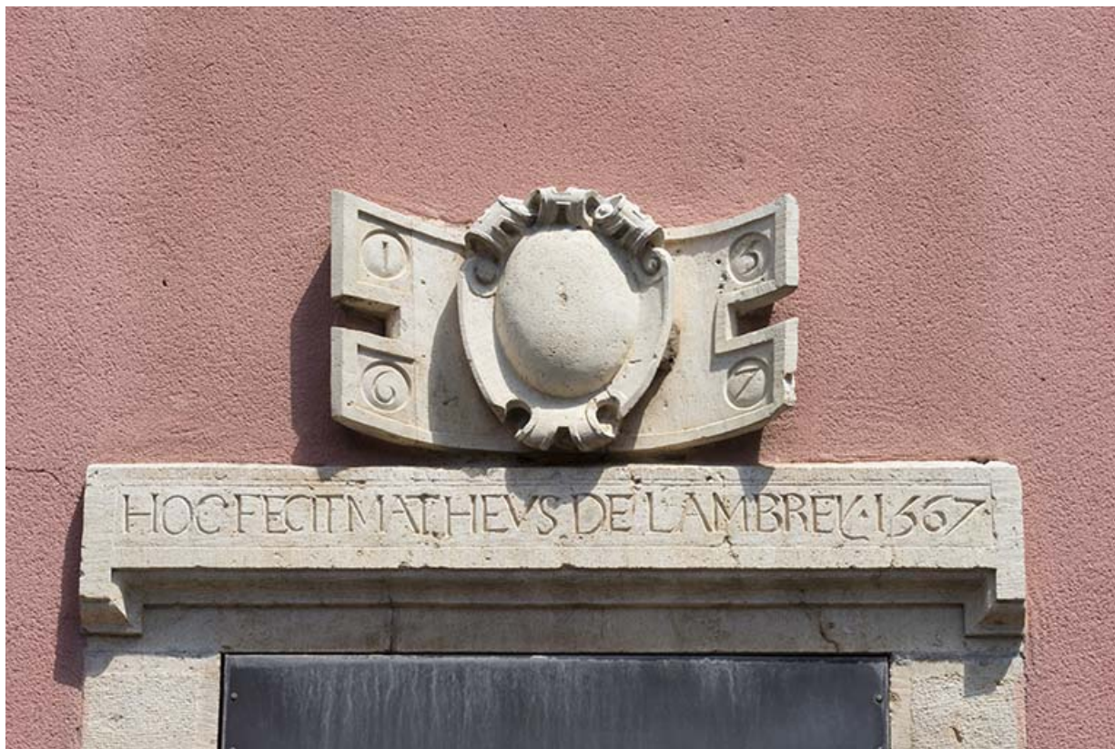
Linteau et relief sculptés datés de 1567.

70, Sceaux-sur-Saône-et-Saint-Albin, 21 rue Armand Paulmard