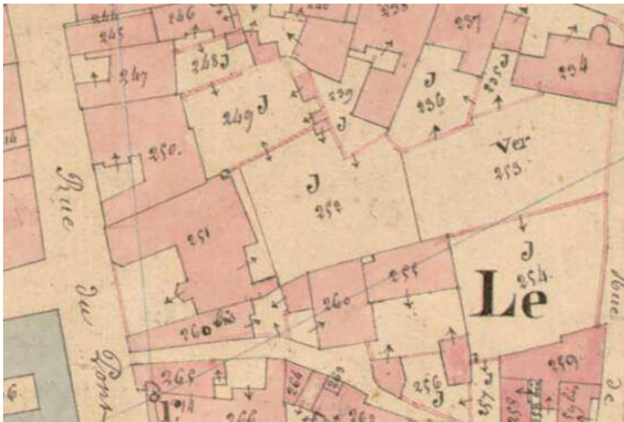
Plan de situation en 1836.

70, Scey-sur-Saône-et-Saint-Albin, 21 rue Armand Paulmard