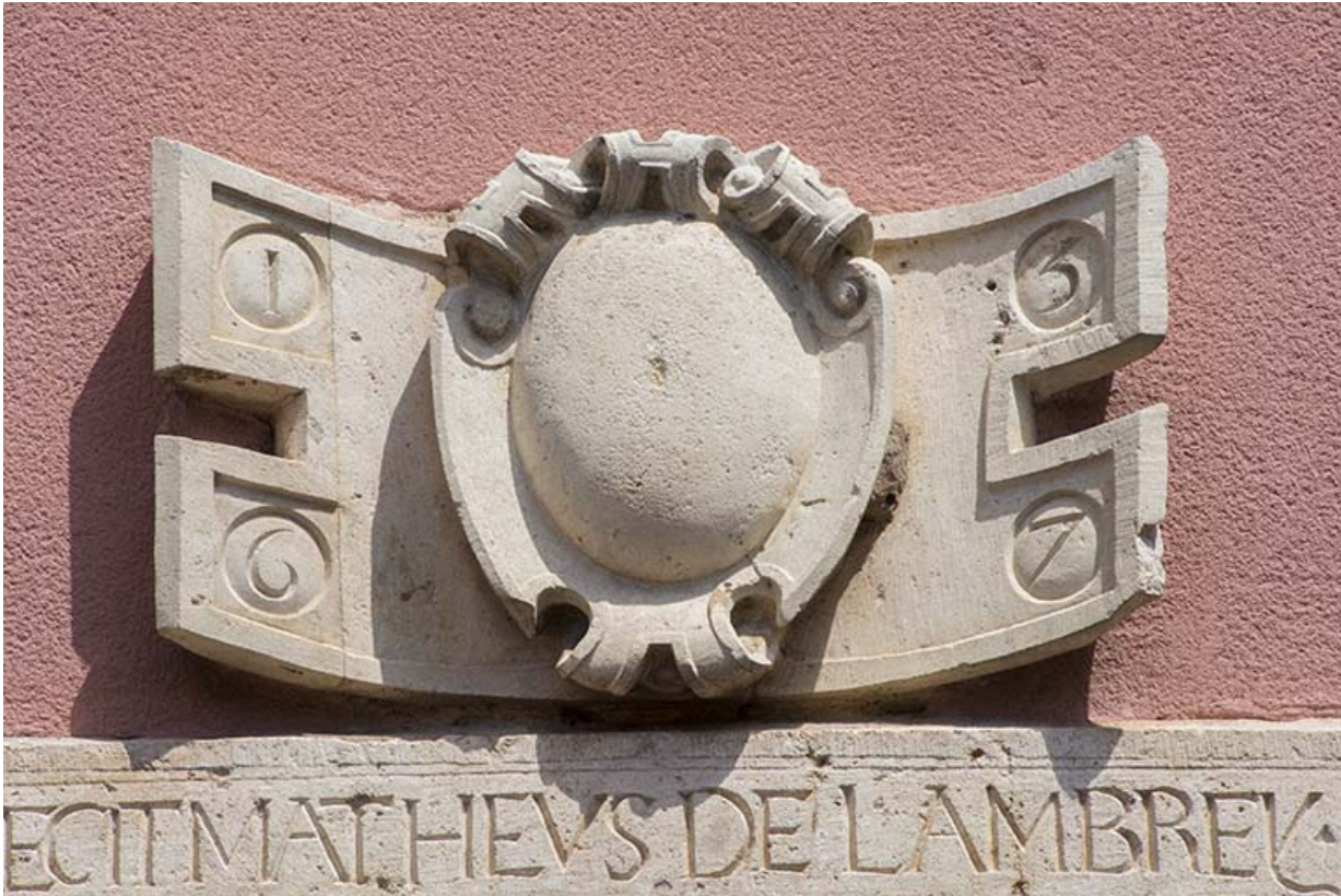
Linteau et relief sculptés datés de 1567.

70, Scey-sur-Saône-et-Saint-Albin, 21 rue Armand Paulmard