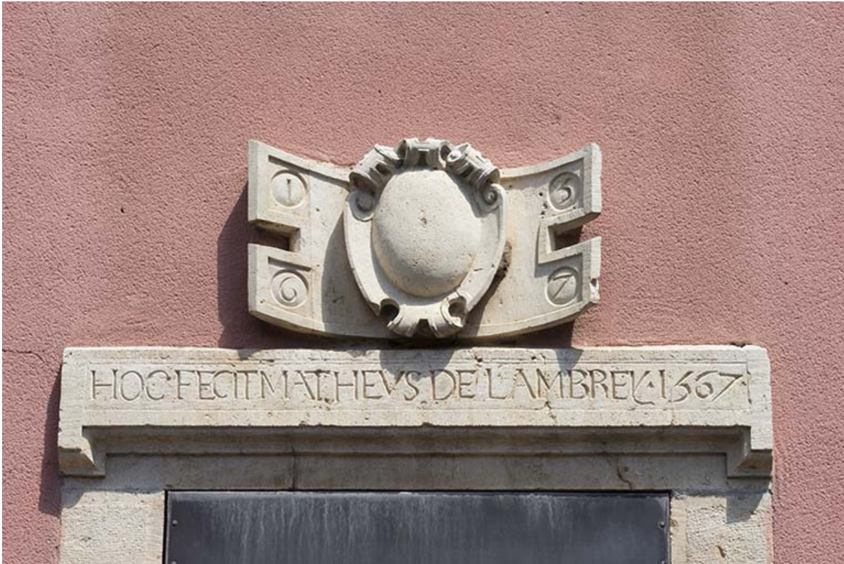
Linteau et relief sculptés datés de 1567.

70, Scey-sur-Saône-et-Saint-Albin, 21 rue Armand Paulmard