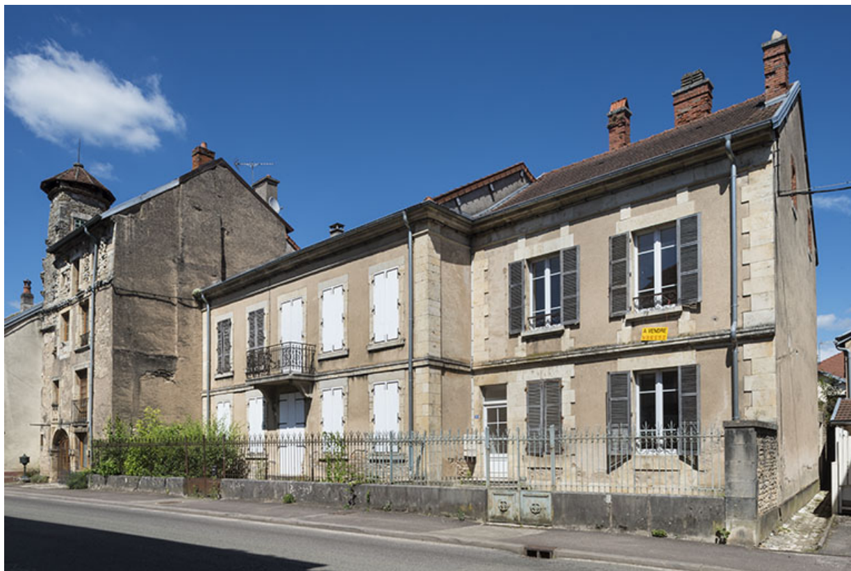
Élévation sur la rue Armand Paulmard, vue de trois-quarts.

70, Scey-sur-Saône-et-Saint-Albin, 29-31 rue Armand Paulmard