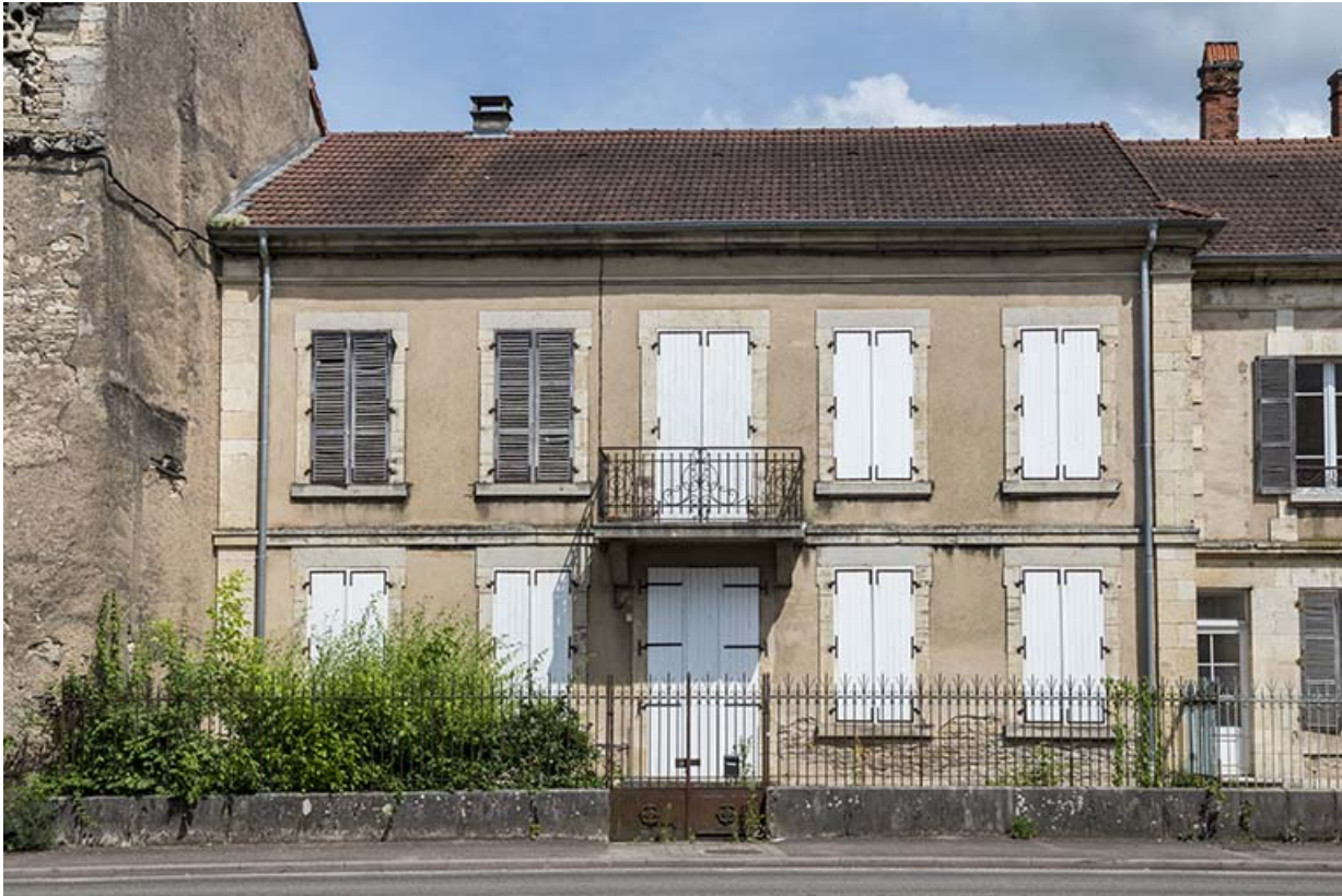
Élévation sur la rue Armand Paulmard, vue de face.

70, Scey-sur-Saône-et-Saint-Albin, 29-31 rue Armand Paulmard