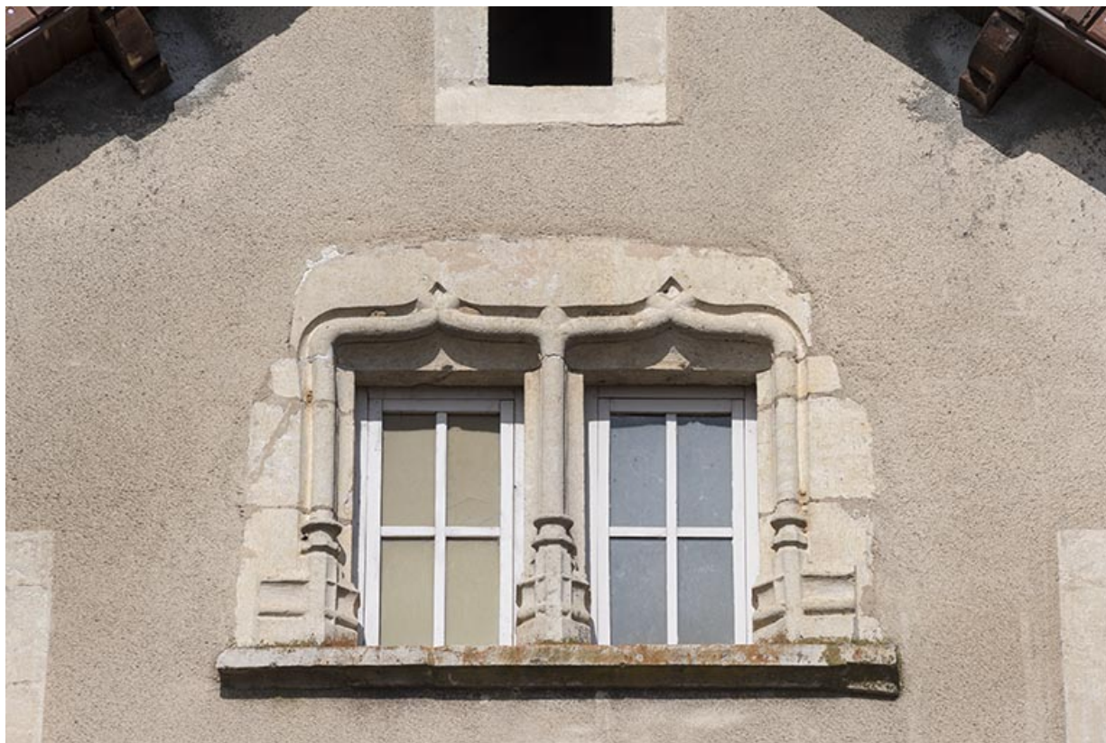
Baies jumelées surmontées d'arcs en accolade, vestige d'un édifice plus ancien utilisé en remploi.

70, Scey-sur-Saône-et-Saint-Albin, 29-31 rue Armand Paulmard