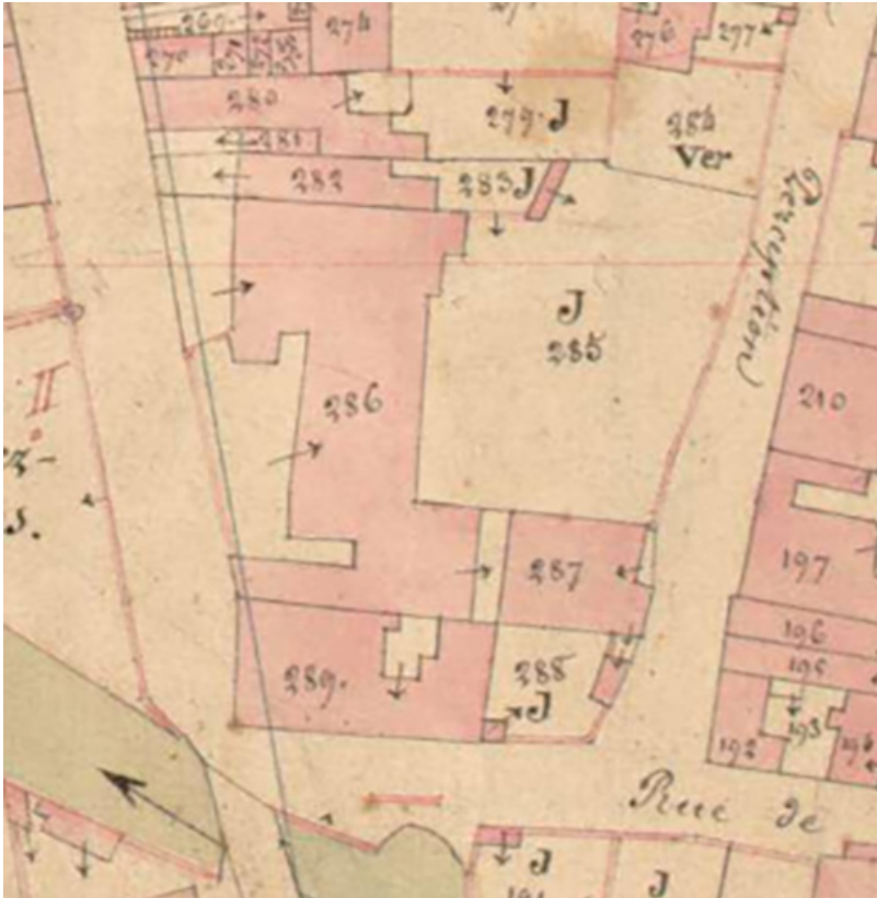
Extrait de l'Atlas parcellaire (1836) du cadastre de la commune de Scey-sur-Saône-et-Saint-Albin.

70, Scey-sur-Saône-et-Saint-Albin, 39 rue Armand Paulmard