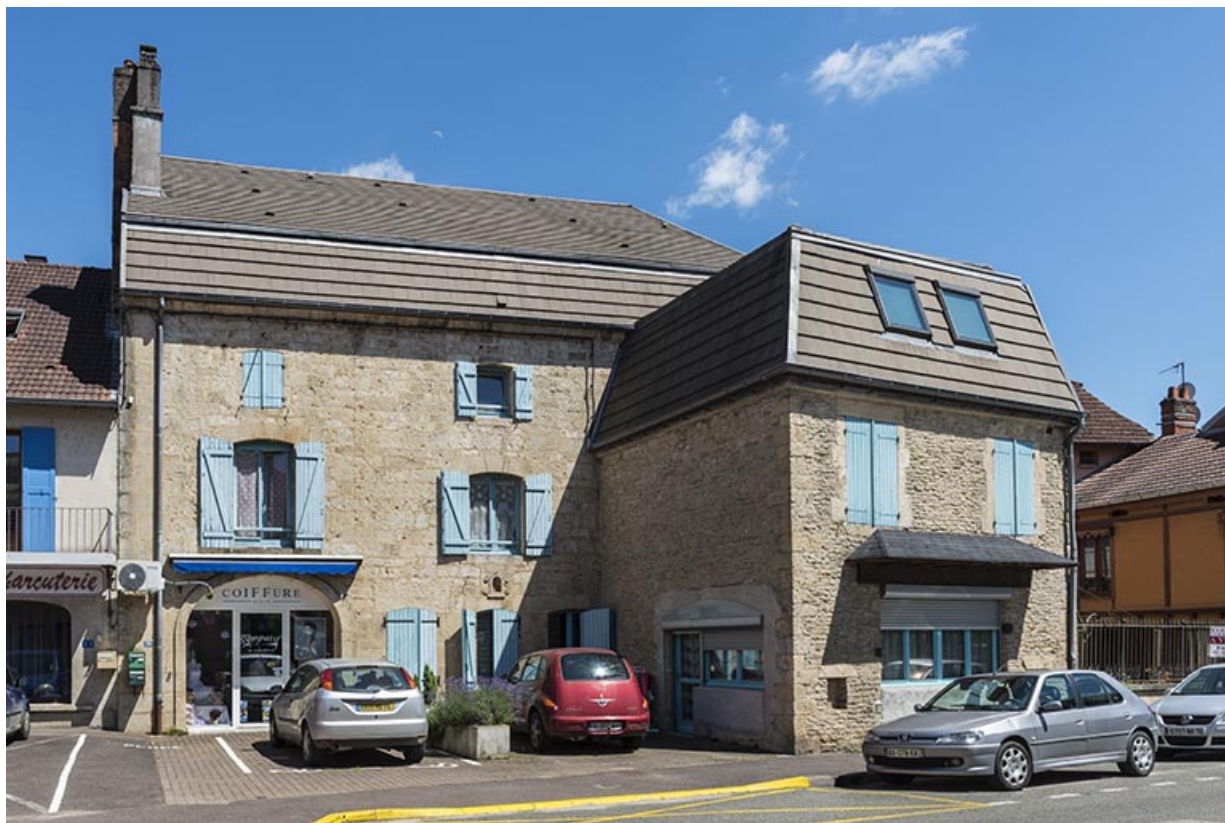
Élévation sur la rue Armand Paulmard.

70, Sceaux-sur-Saône-et-Saint-Albin, 39 rue Armand Paulmard