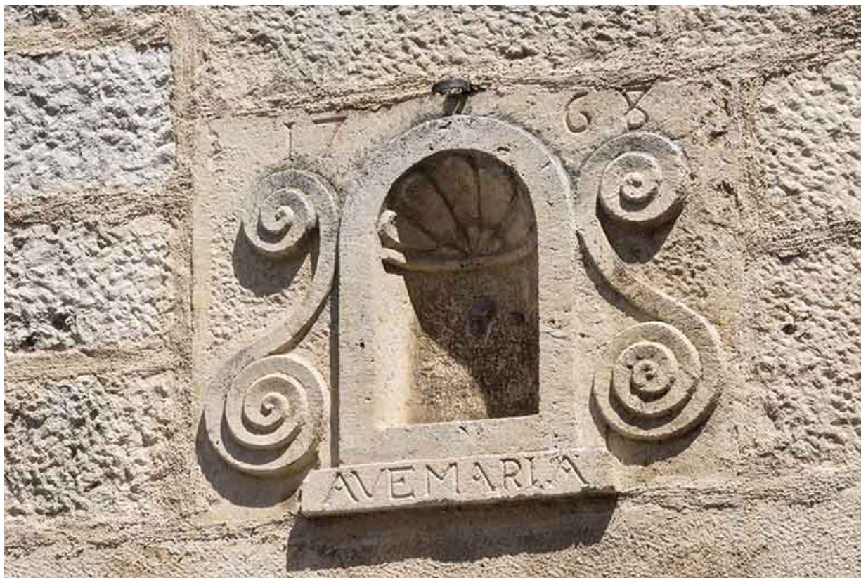
Niche encadrée de volutes.

70, Scey-sur-Saône-et-Saint-Albin, 39 rue Armand Paulmard