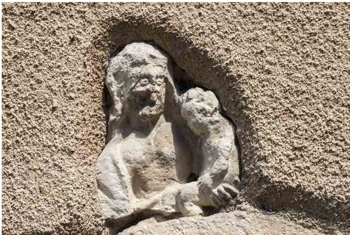
Vierge à l'Enfant.

70, Scey-sur-Saône-et-Saint-Albin, 45 rue Armand Paulmard