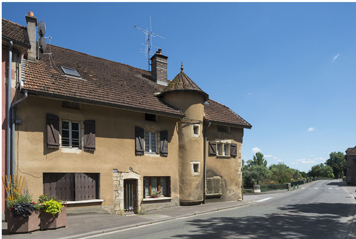
Élévation sur la rue Armand Paulmard, vue de trois-quarts.

70, Scey-sur-Saône-et-Saint-Albin, 45 rue Armand Paulmard