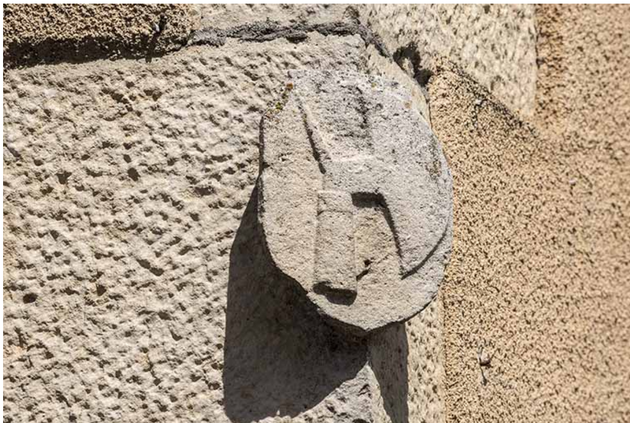
Hache à bûcher.

70, Scey-sur-Saône-et-Saint-Albin, 45 rue Armand Paulmard