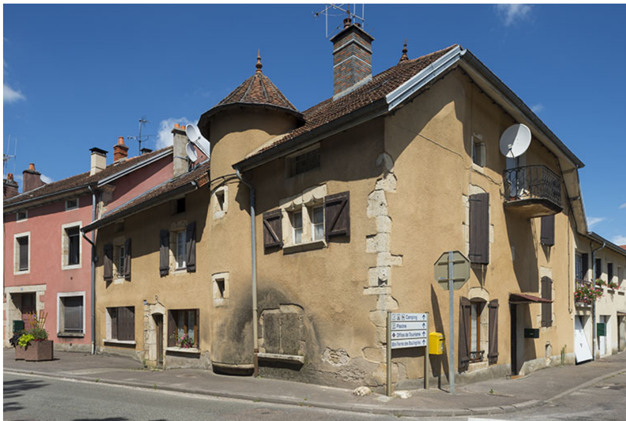
Élévation générale au croisement de la rue Armand Paulmard et de la rue d'Enfer.

70, Scey-sur-Saône-et-Saint-Albin, 45 rue Armand Paulmard