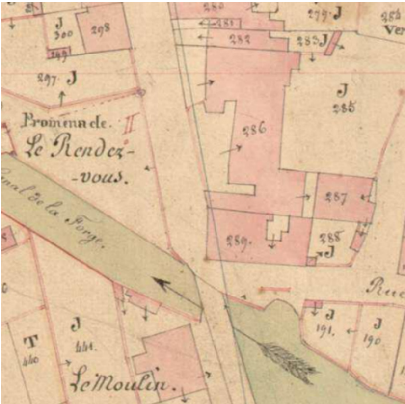
Plan de situation en 1836.

70, Scey-sur-Saône-et-Saint-Albin, 45 rue Armand Paulmard