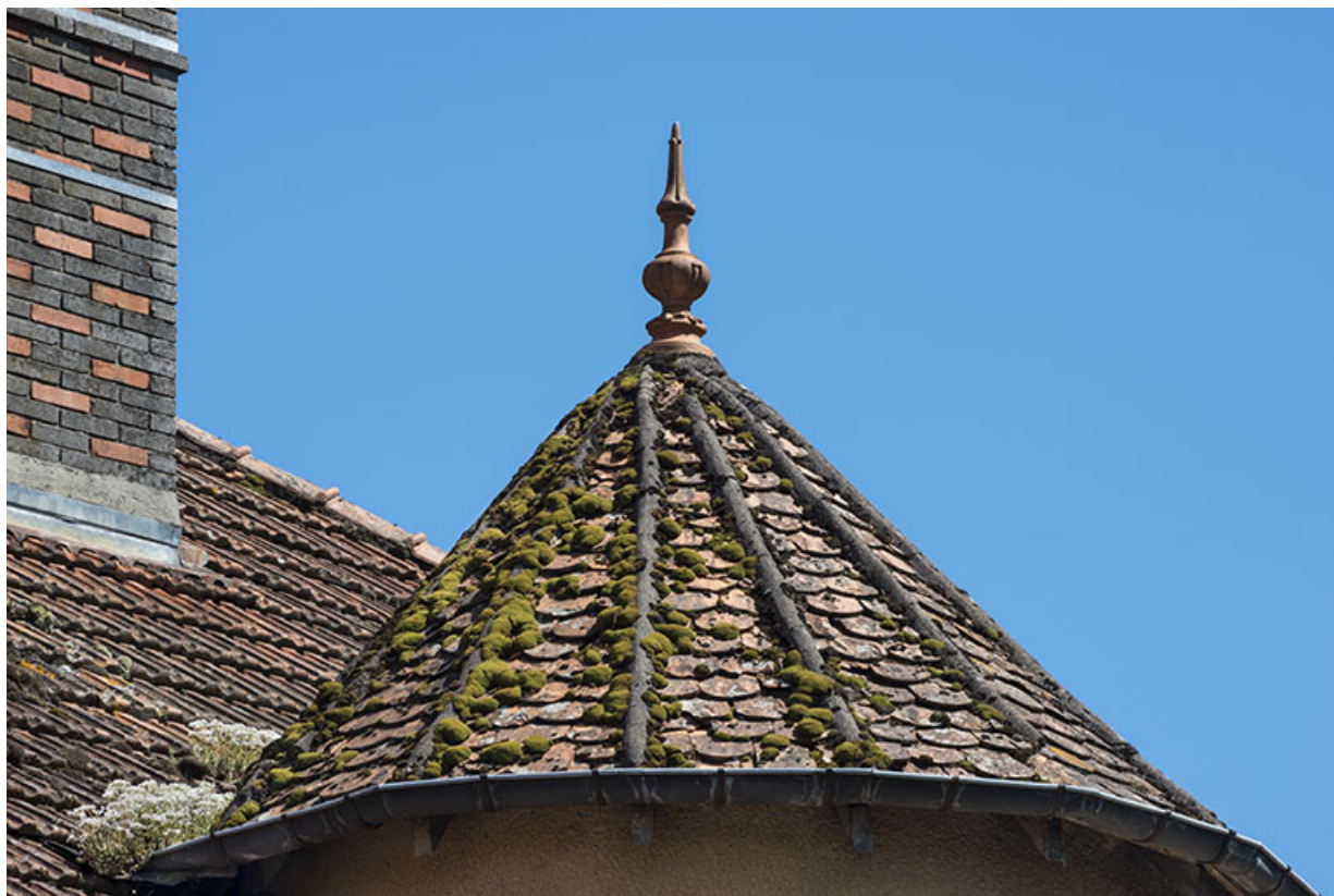
Toit conique nervuré de la tour demi-hors-œuvre.

70, Scey-sur-Saône-et-Saint-Albin, 45 rue Armand Paulmard