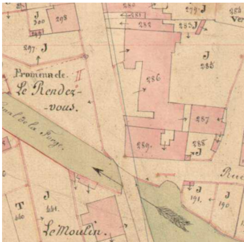
Plan de situation en 1836.

70, Sceaux-sur-Saône-et-Saint-Albin, 45 rue Armand Paulmard