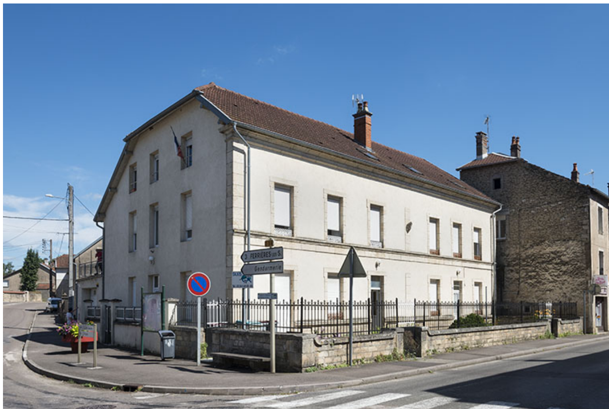
Élévation sur la rue Armand Paulmard, vue de trois-quarts.

70, Sceaux-sur-Saône-et-Saint-Albin, 13 rue Armand Paulmard