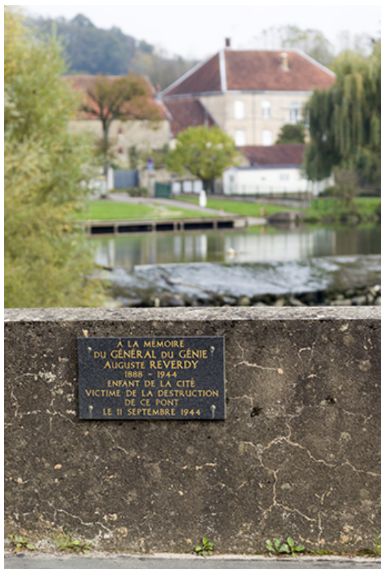
La plaque commémorative en l'honneur du Général Reverdy, et en arrière plan, sa demeure. 70, Scey-sur-Saône-et-Saint-Albin