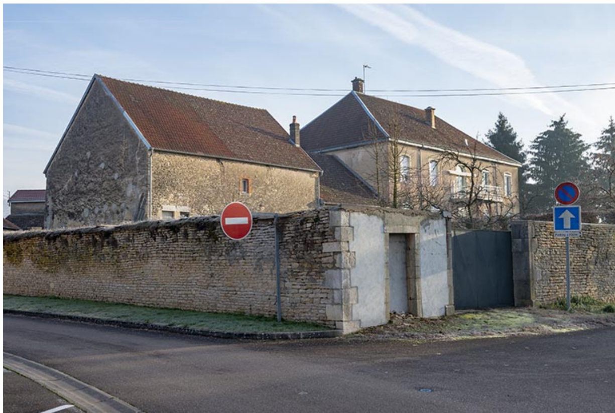
Vue de trois-quart depuis la Grande rue du Bourg.

70, Scey-sur-Saône-et-Saint-Albin, 2 route de Ferrières