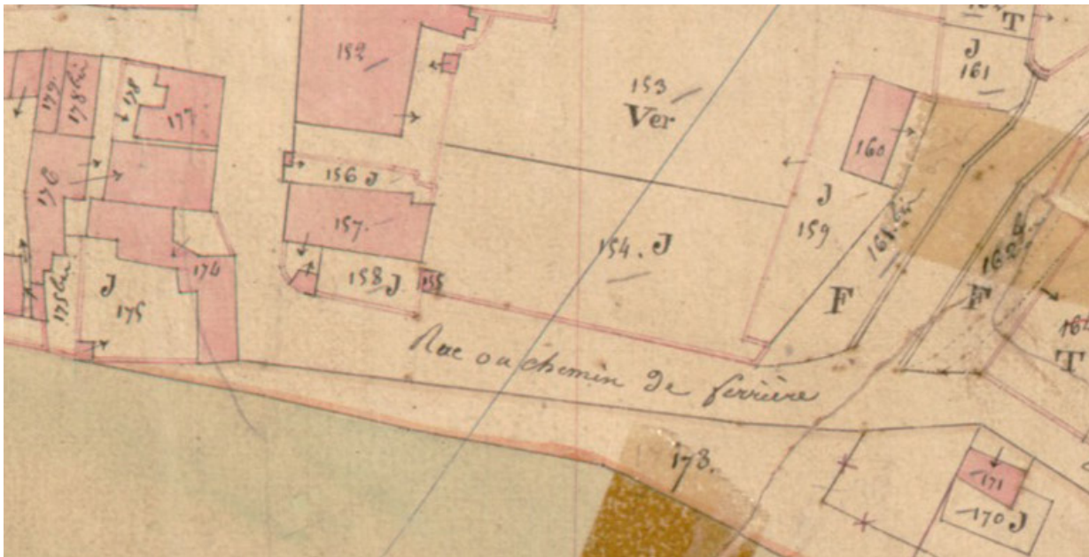
Extrait de l'Atlas parcellaire (1836) du cadastre de la commune de Scey-sur-Saône-et-Saint-Albin.

70, Scey-sur-Saône-et-Saint-Albin, 49 Grande rue du Bourg