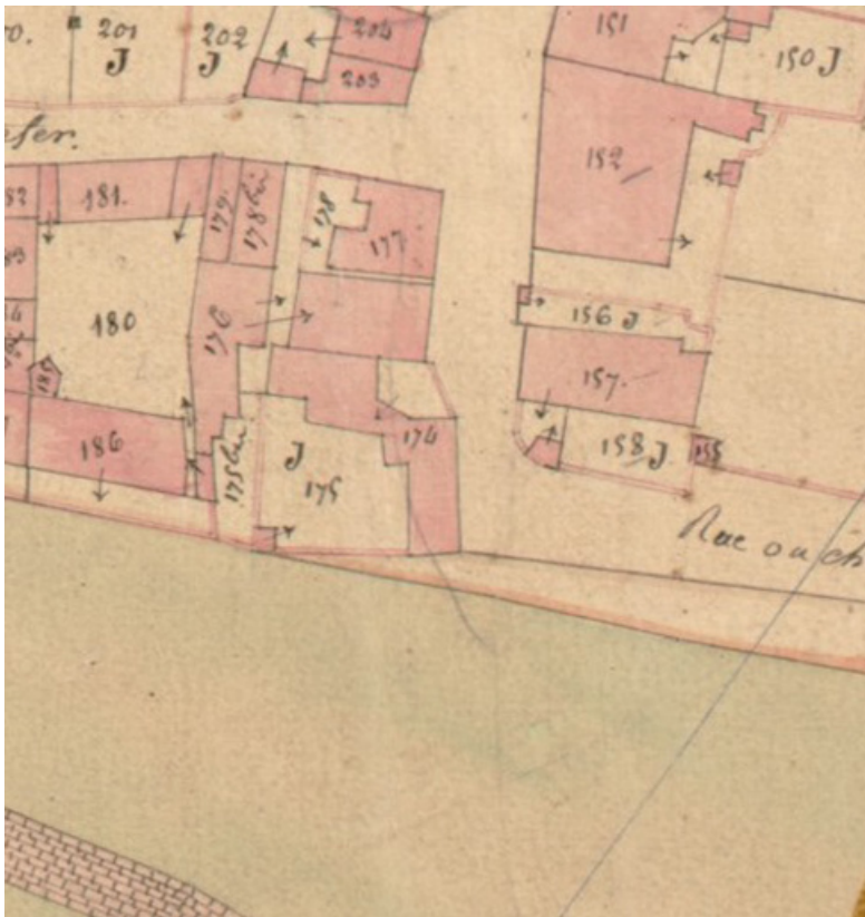
Extrait de l'Atlas parcellaire (1836) du cadastre de la commune de Scey-sur-Saône-et-Saint-Albin. 70, Scey-sur-Saône-et-Saint-Albin, 32 Grande Rue du Bourg