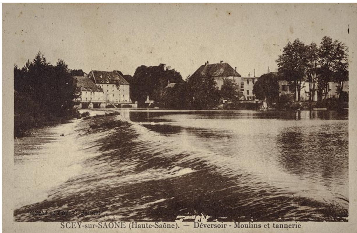
La Saône et l'ancienne tannerie (bâti sur la berge, partie droite), carte postale. 70, Scey-sur-Saône-et-Saint-Albin, 32 Grande Rue du Bourg