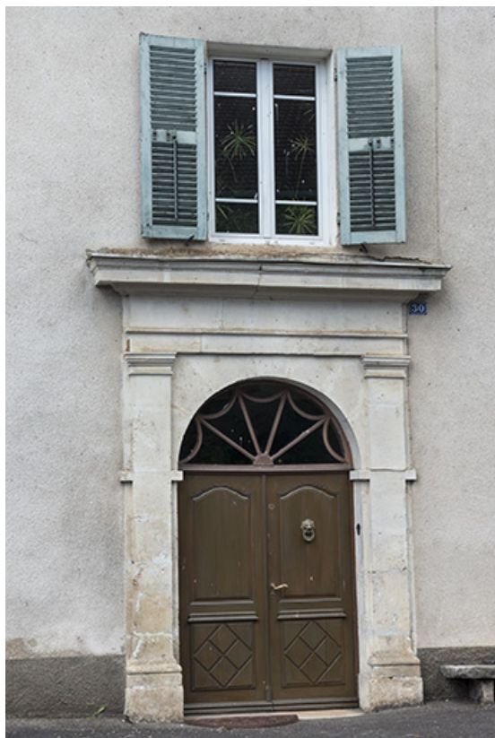
Façade antérieure : détail de la porte d'entrée.

70, Scey-sur-Saône-et-Saint-Albin, 30 Grande Rue du Bourg