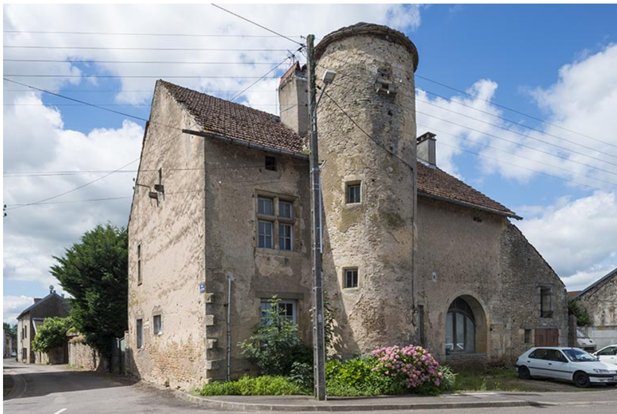
La façade antérieure : détail de la tour et de la fenêtre à meneau.

70, Sceaux-sur-Saône-et-Saint-Albin, 16 Grande rue du Bourg