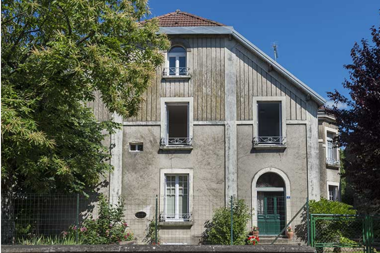
Maison côté rue de la Perception.

70, Sceaux-sur-Saône-et-Saint-Albin, 10 rue Mécorne