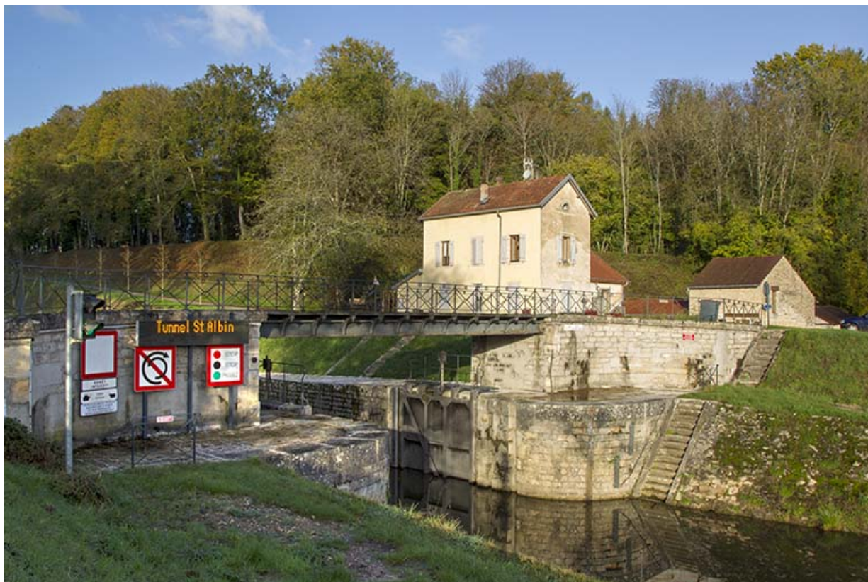
L'entrée du canal et la maison du barragiste.