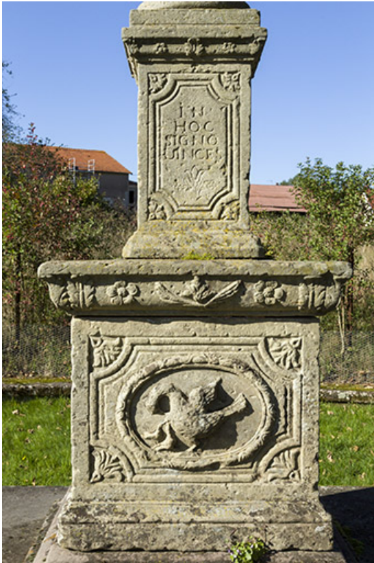
La base et le bas de la croix.

70, Passavant-la-Rochère place Dieu, lieudit : la Rochère