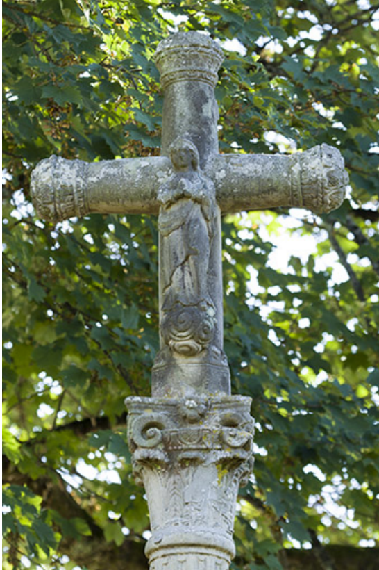
Haut de la croix avec la Vierge.

70, Passavant-la-Rochère place Dieu, lieudit : la Rochère