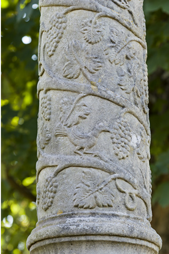
Grappes de vignes en bas-relief sur la croix.

70, Passavant-la-Rochère place Dieu, lieudit : la Rochère