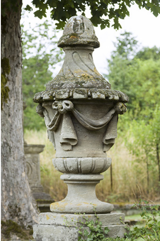
Pot à feu présent sur le site du calvaire.

70, Passavant-la-Rochère place Dieu, lieudit : la Rochère