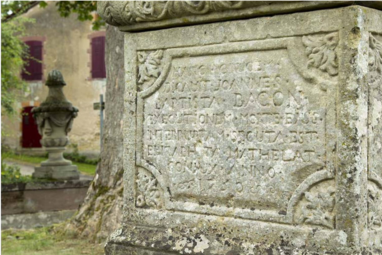
Inscriptions gravées sur une des parois de la base.

70, Passavant-la-Rochère place Dieu, lieudit : la Rochère