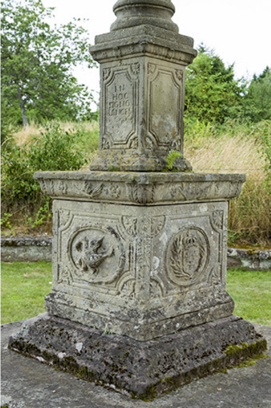
Base du calvaire.

70, Passavant-la-Rochère place Dieu, lieudit : la Rochère