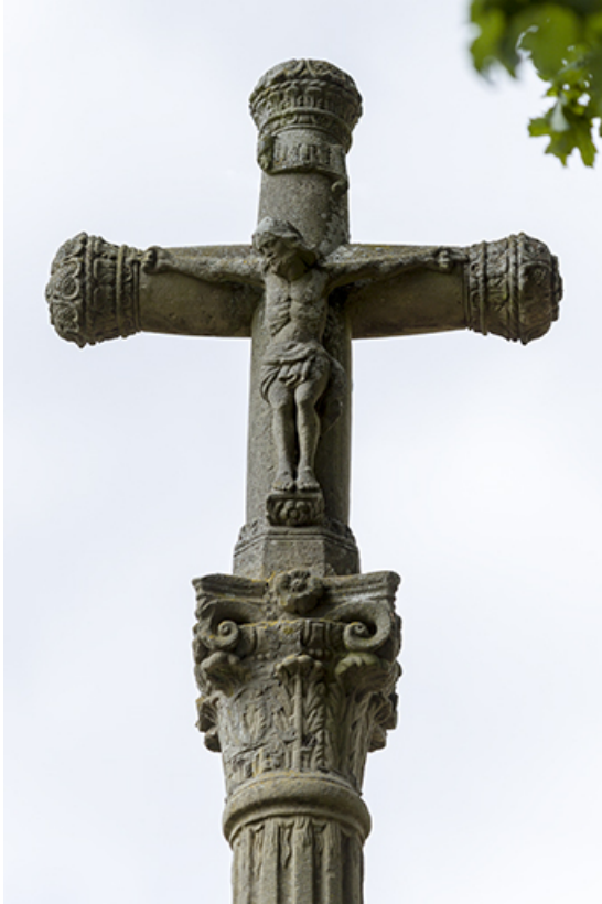
Le haut de la croix avec le Christ crucifié.

70, Passavant-la-Rochère place Dieu, lieudit : la Rochère