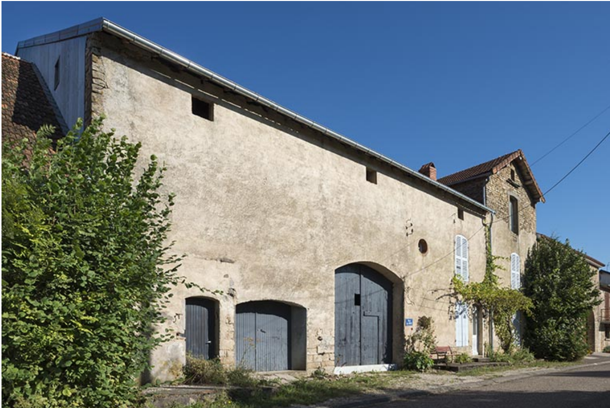
Vue générale depuis le sud-ouest.