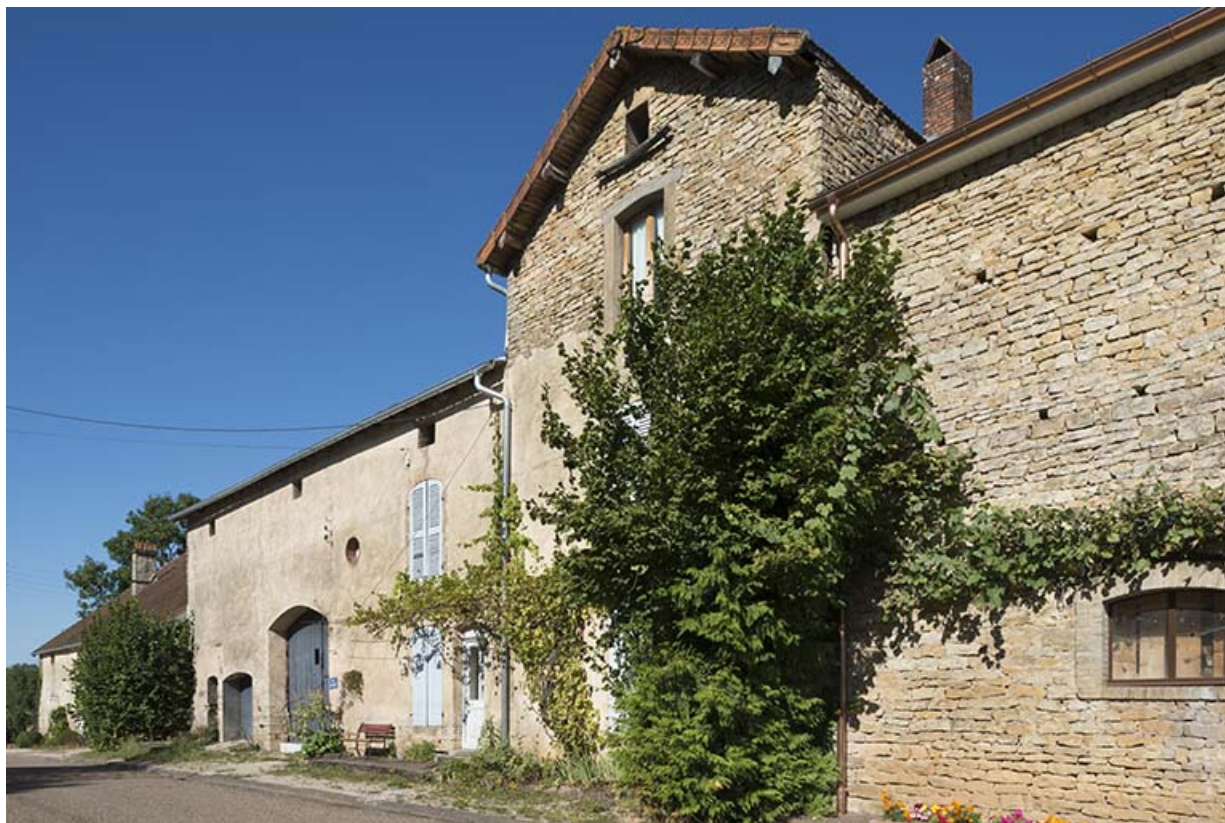
La façade antérieure.