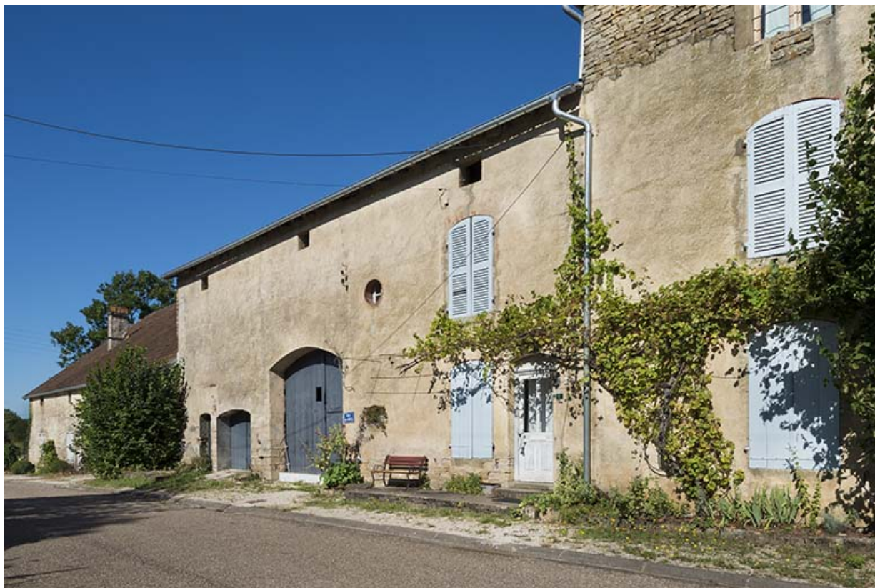
Vue générale depuis le nord-ouest.