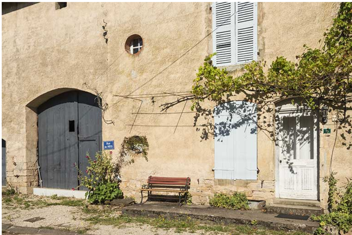
les travées de l'habitation et de la grange.