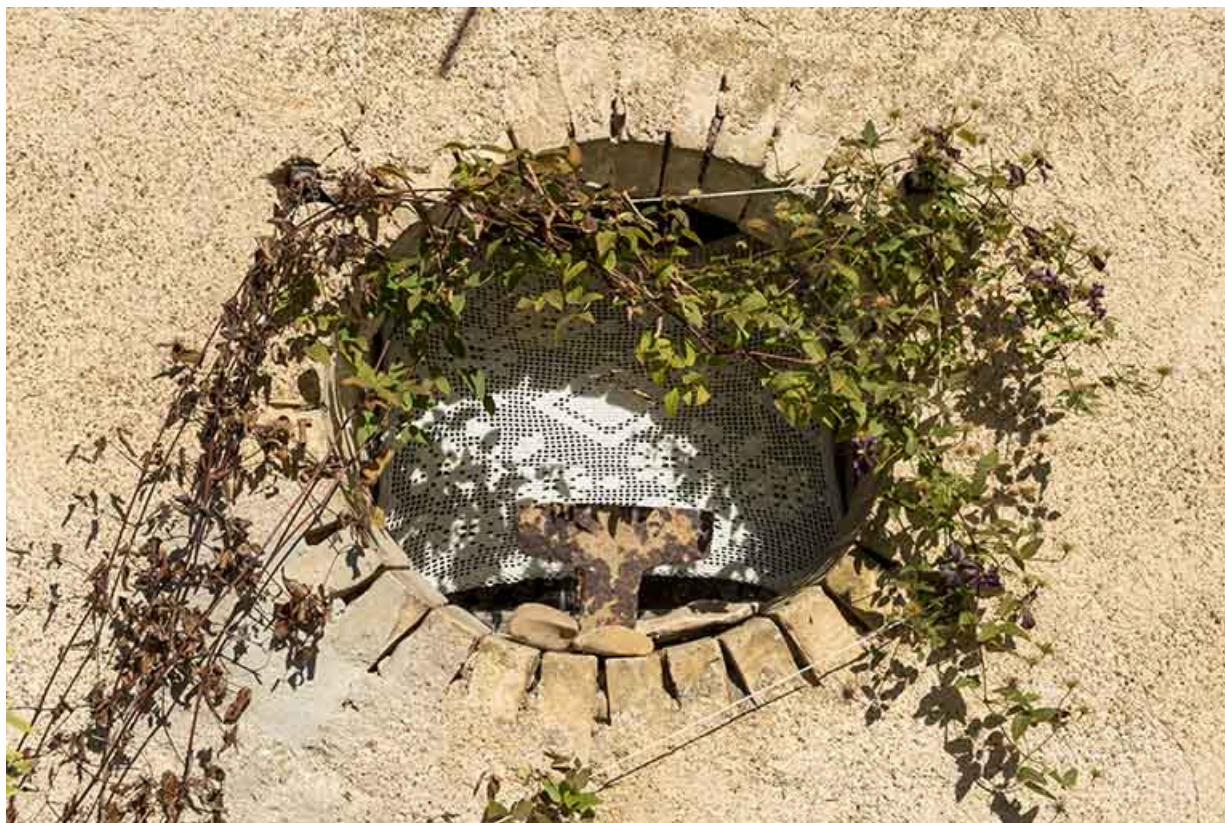
Détail de l'oculus.