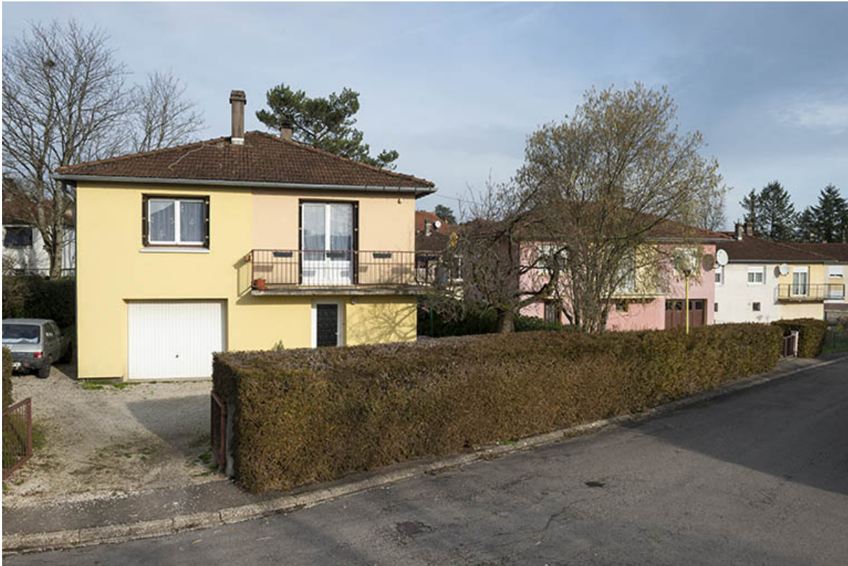
Maison avec balcon au niveau de l'étage carré. 70, Port-sur-Saône