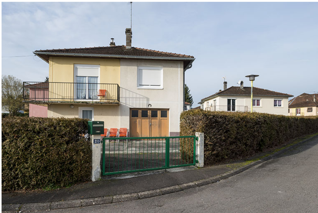
Façade antérieure d'une des maisons.