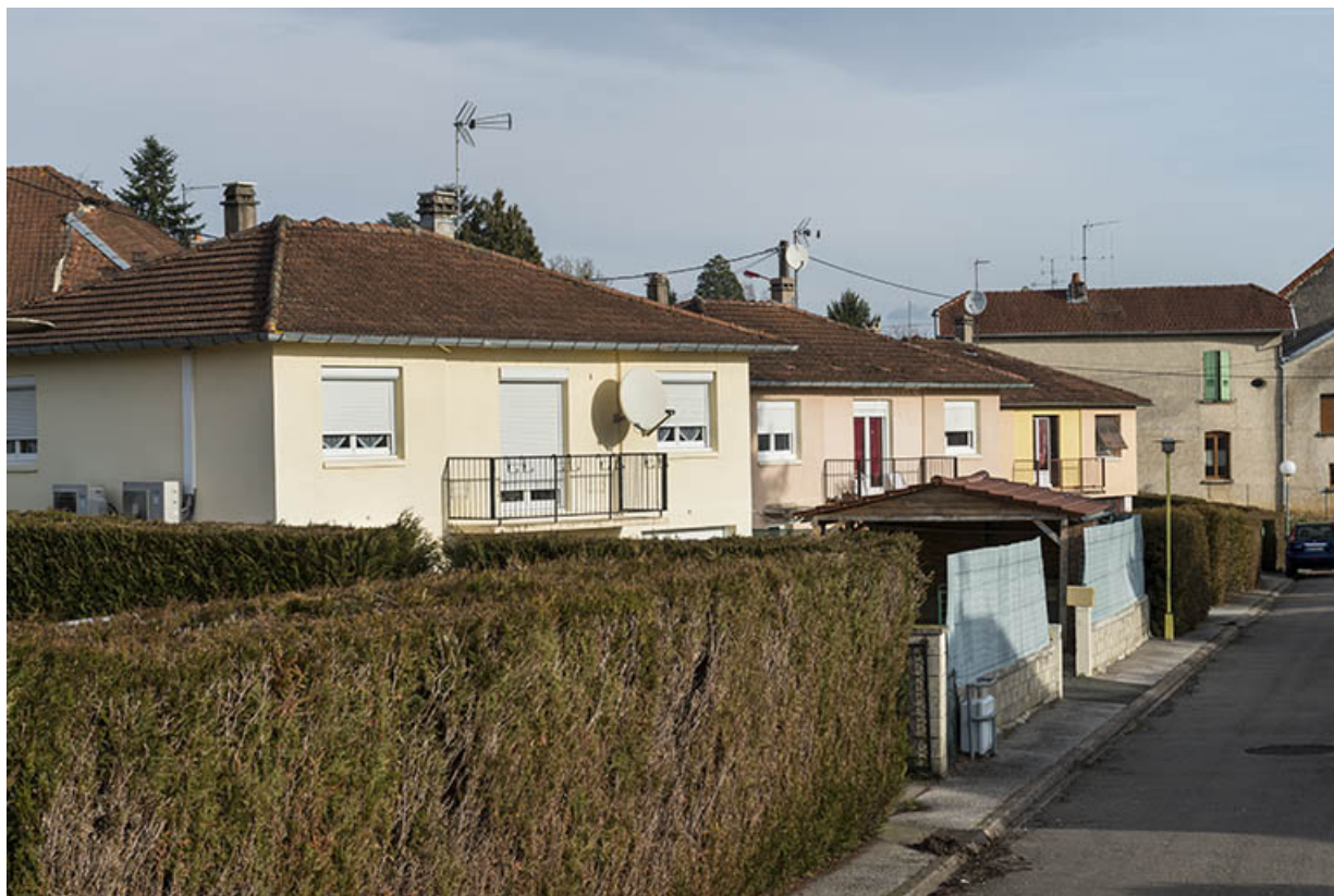
Alignement de Maisons Selam.