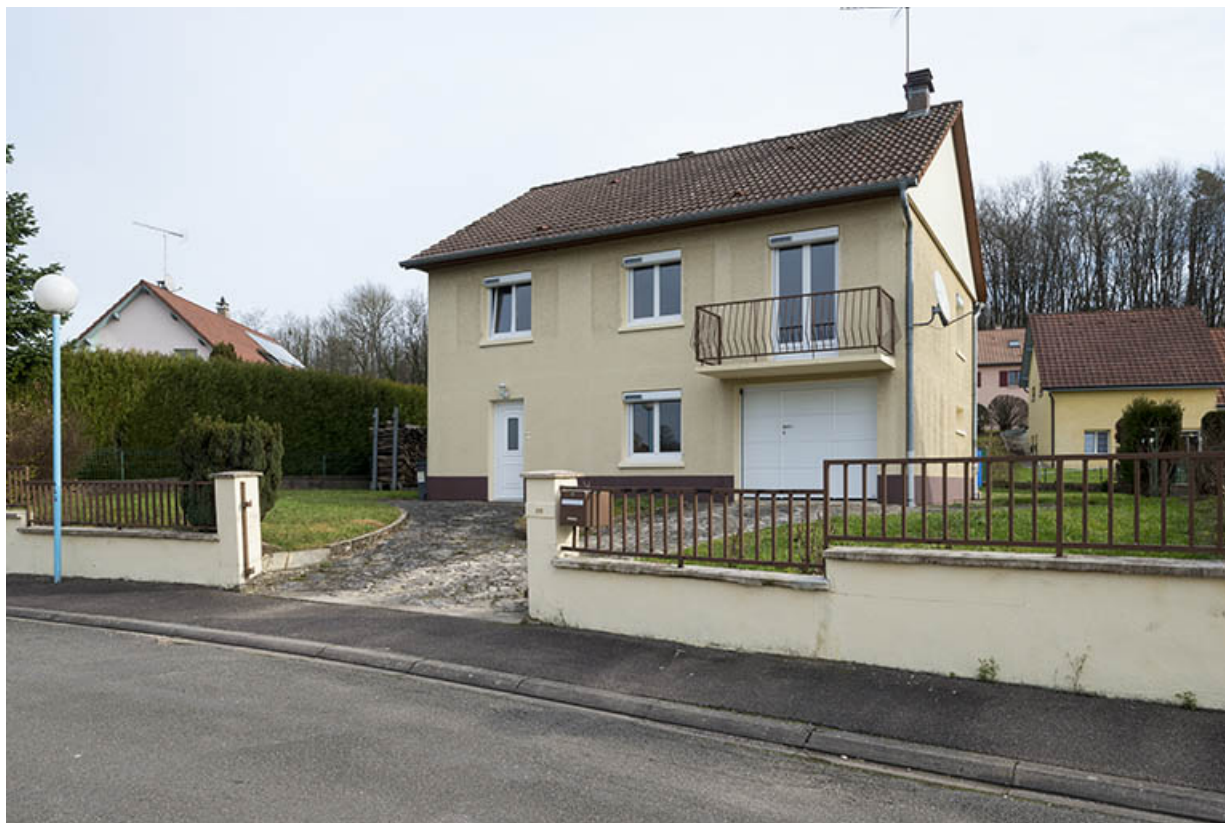
Maison Selam, lotissement des Montants. 70, Port-sur-Saône