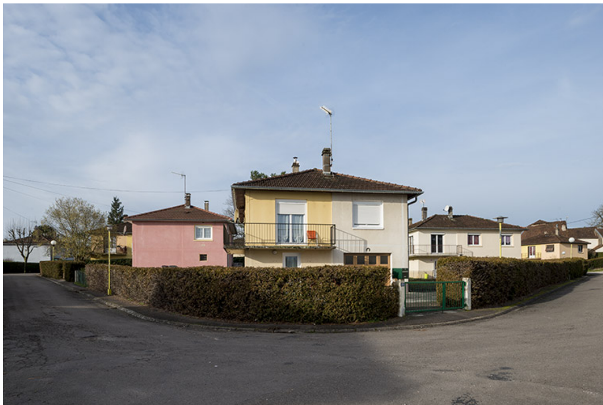
Lotissement, avenue du Plein Soleil. 70, Port-sur-Saône