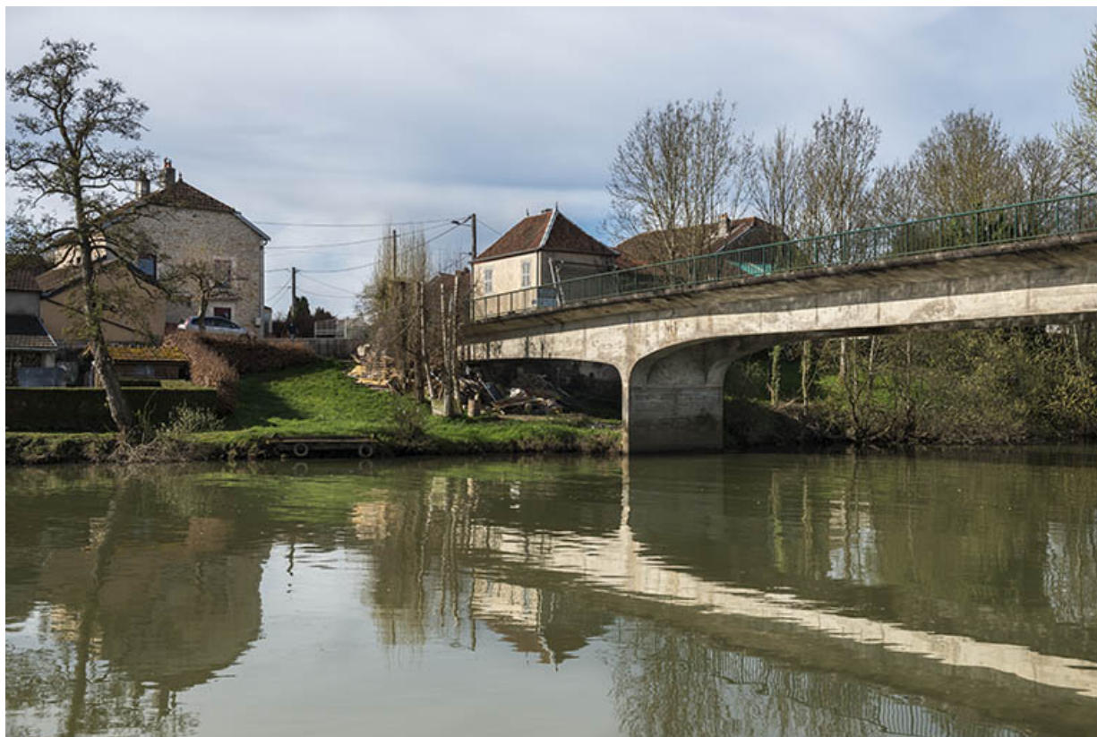
Le pont et le hameau en arrière-plan.