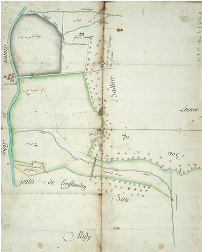
Plan représentant la Saône et l'écart de Port-d'Atelier, 18e siècle. 70, Purgerot