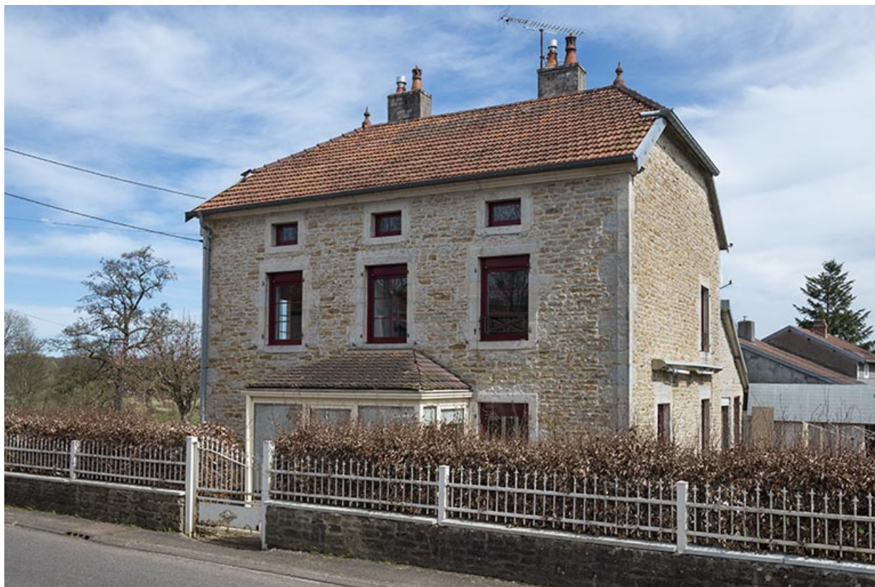
Maison de Jean Biot, commanditaire de la chapelle bâtie au 19e siècle. 70, Purgerot