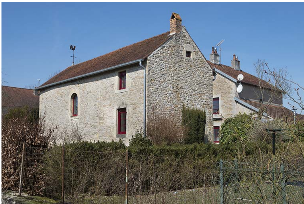
La chapelle, vue de trois-quart.