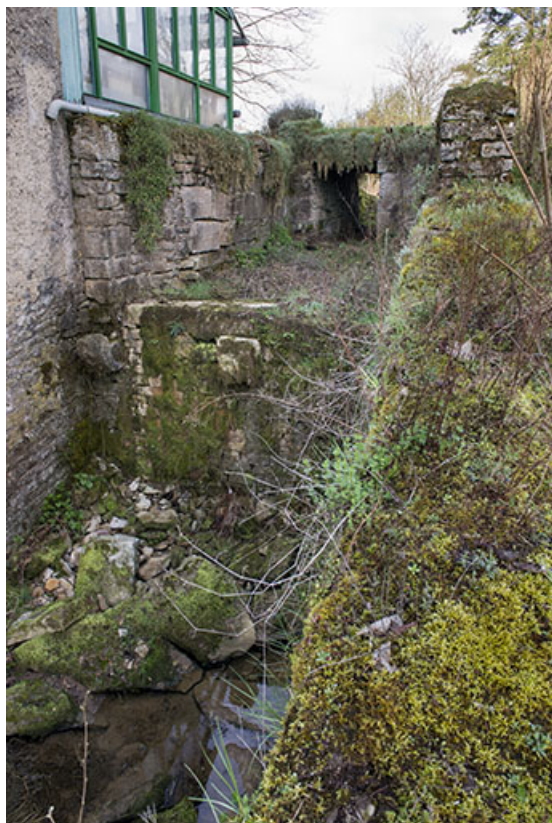
Le bief et la chute d'eau, moulin Guyot.