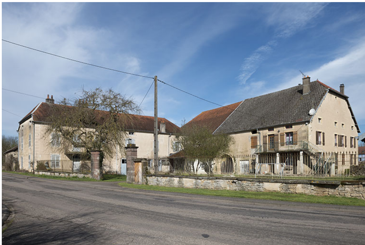
La maison Cardot, négociant au 19e siècle. 70, Purgerot