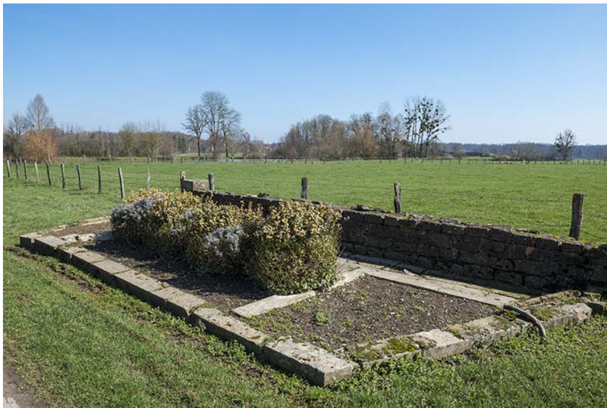
Fontaine, rue du Bac à Port d'Atelier. 70, Purgerot