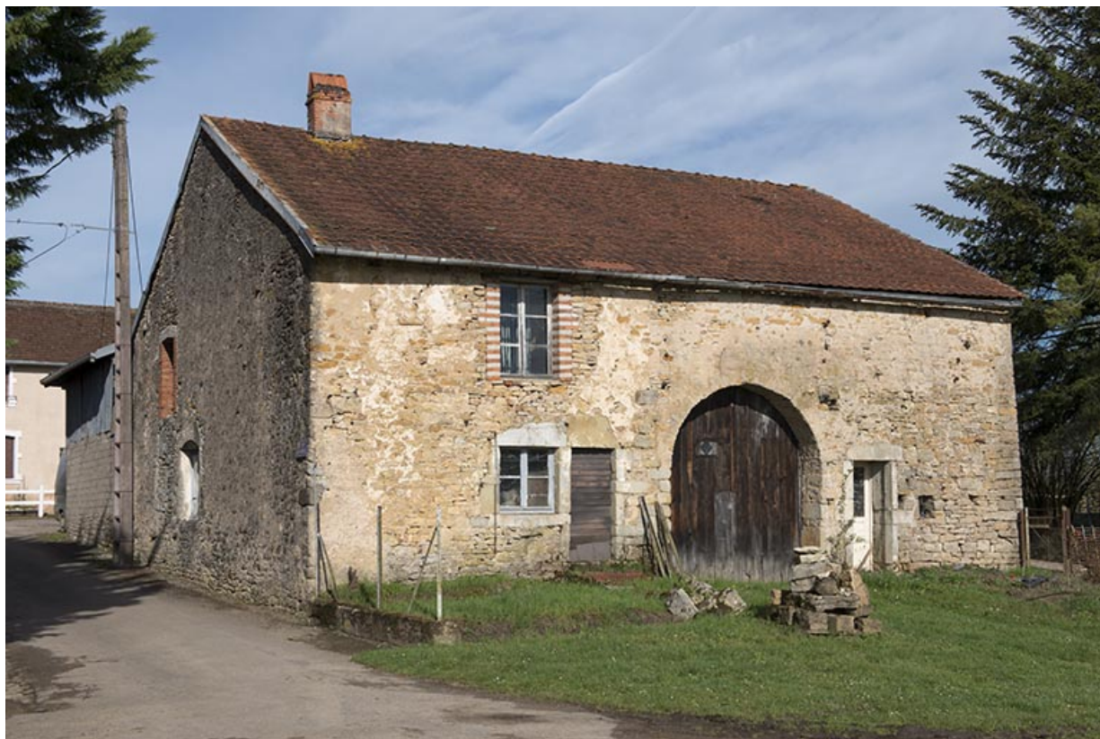
Ferme, rue du Bac. 70, Purgerot