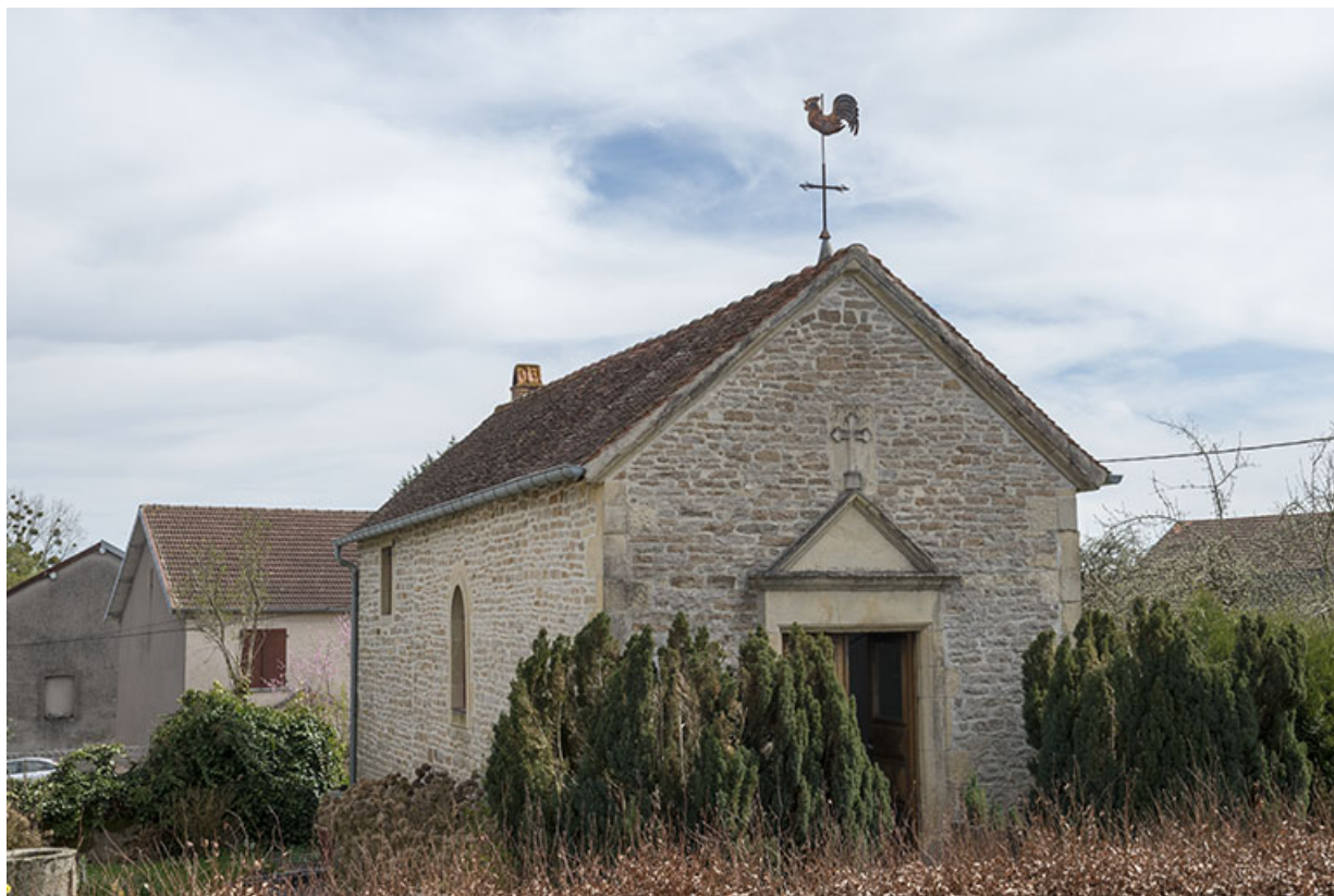
La chapelle. 70, Purgerot