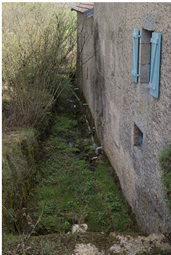
Bief de dérivation, moulin Guyot.