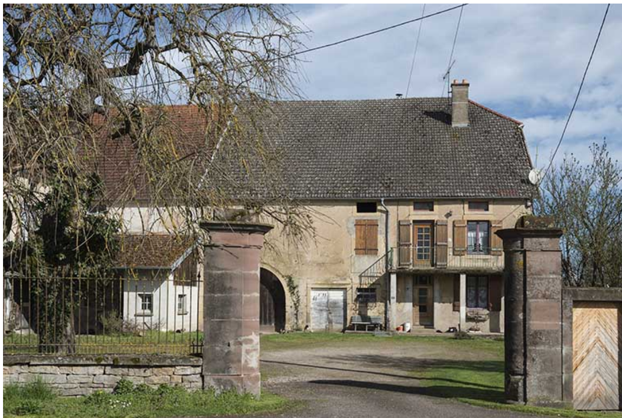
Les piliers du portail d'entrée et la maison en arrière-plan. 70, Purgerot