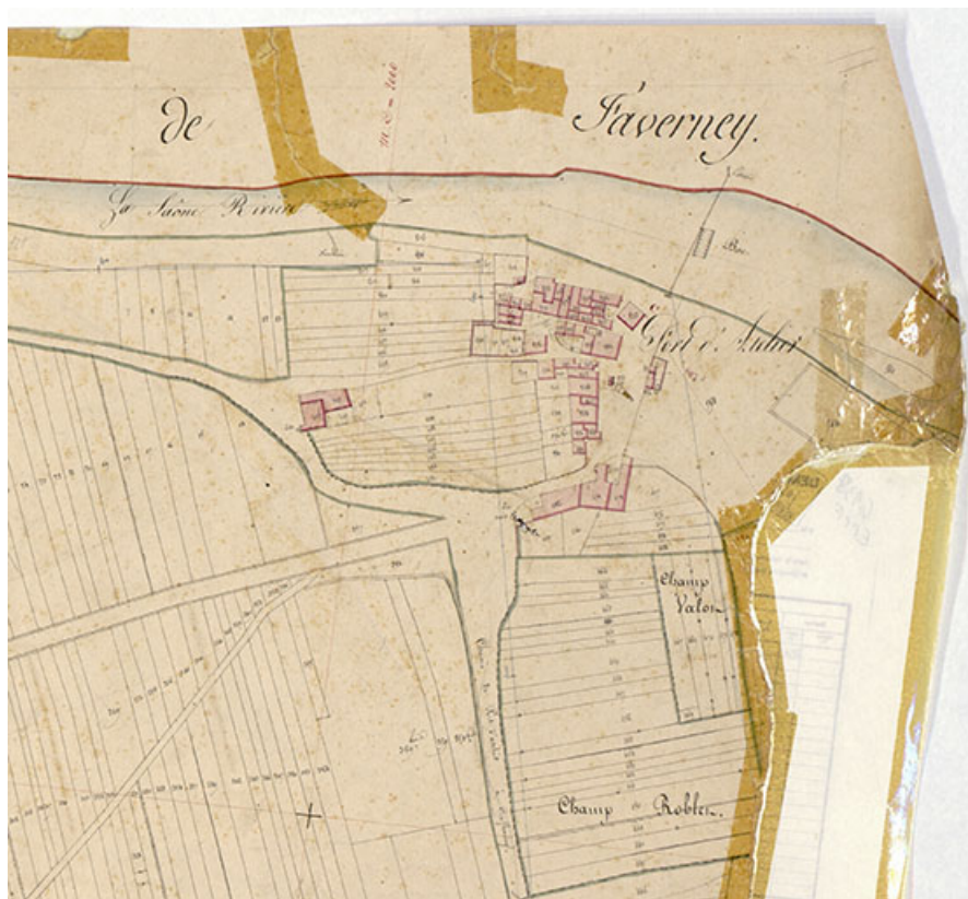
Plan de l'écart extrait du plan cadastral, 1826. 70, Purgerot