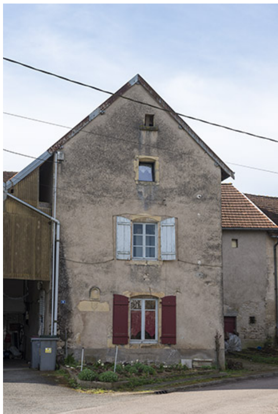
Détail sur les baies du mur pignon.