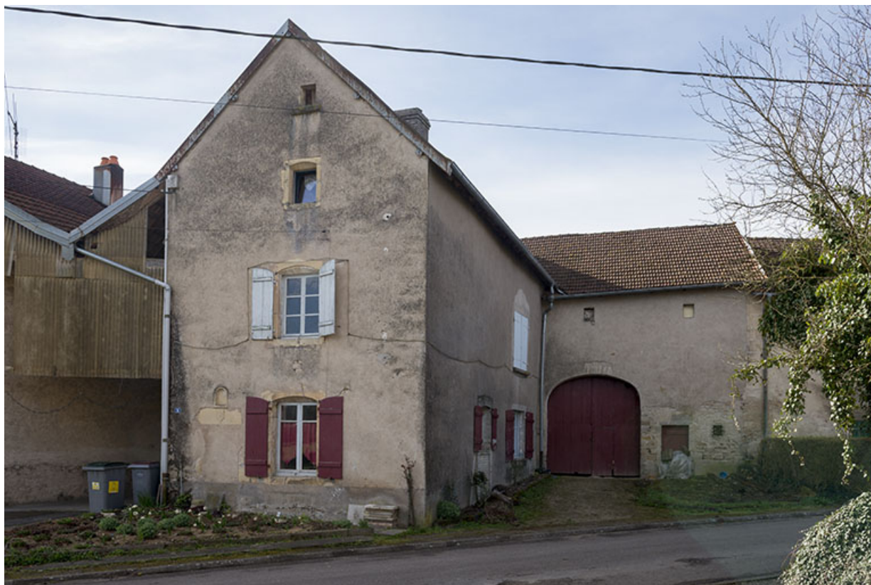
Ferme en équerre, rue du Bac. 70, Purgerot