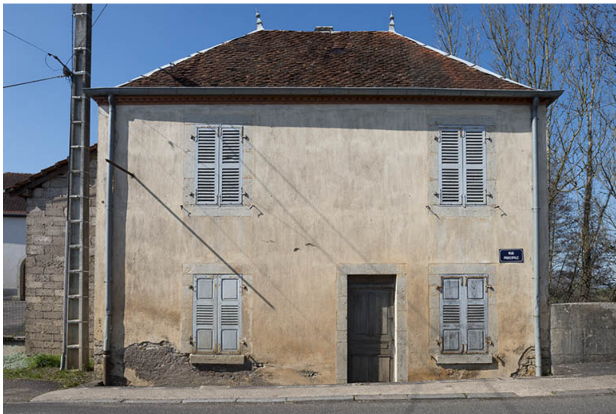
La maison abritant la personne chargée de percevoir le péage du pont. 70, Purgerot