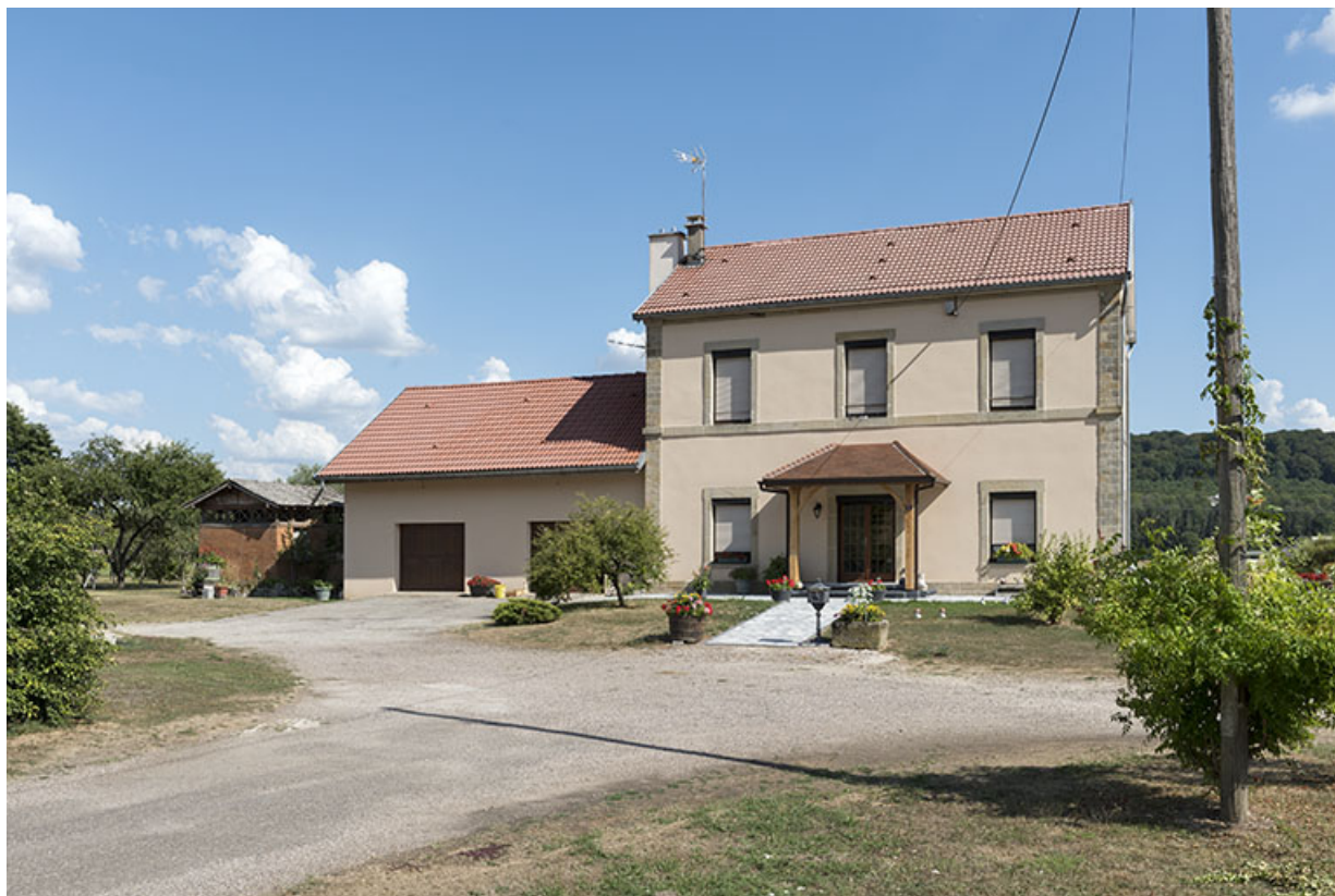
Façade antérieure de l'ancienne gare.