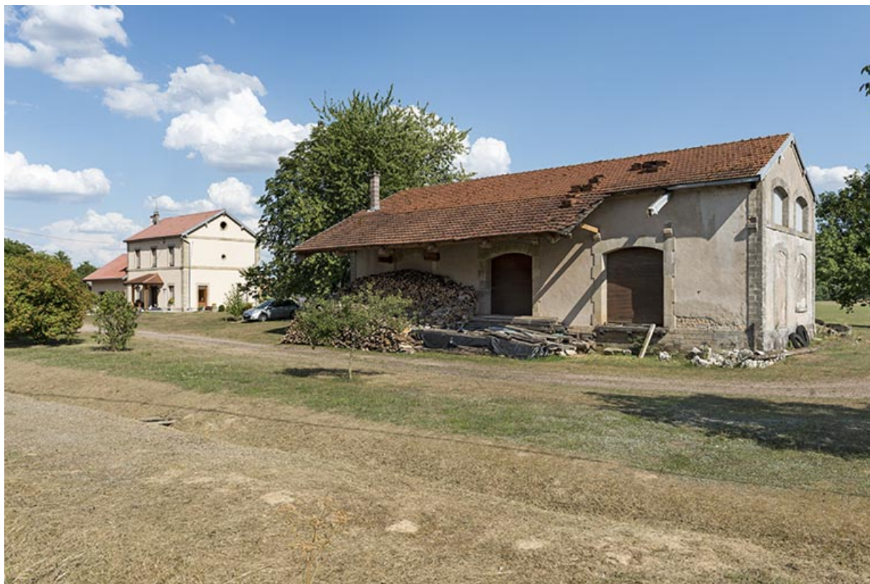
Vue générale du site de l'ancienne gare avec l'entrepôt commercial au premier plan. 70, Aisey-et-Richecourt