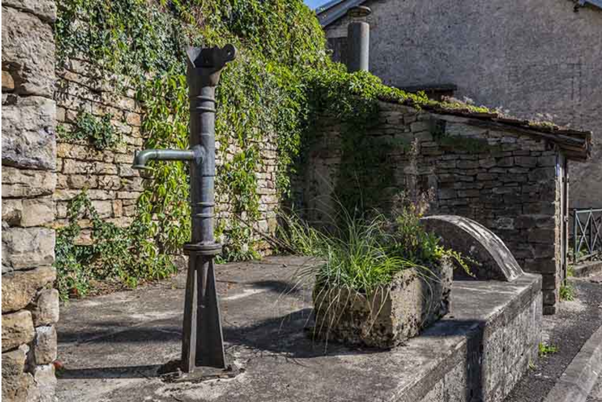
La pompe en fonte.