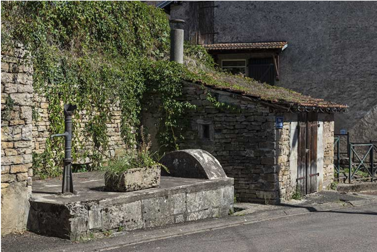
Vue depuis le haut de la rue.