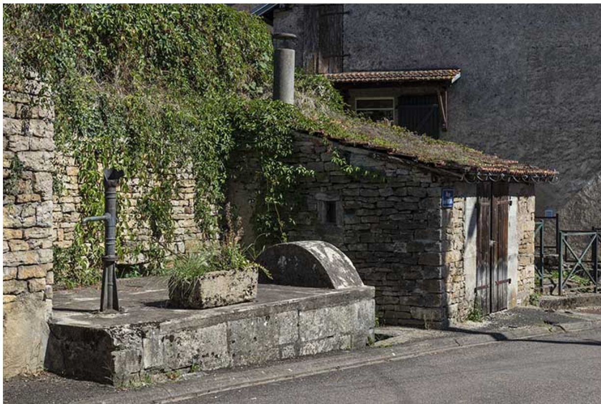
Vue depuis le haut de la rue.