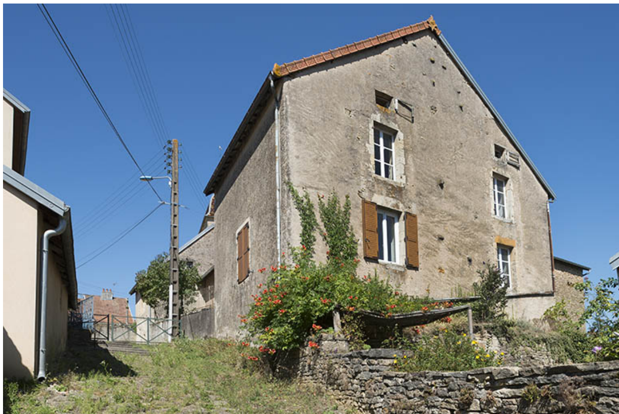
Le mur pignon côté sud.