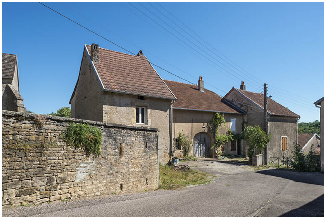
Vue depuis la rue avec le retour du mur de l'ancien cimetière.