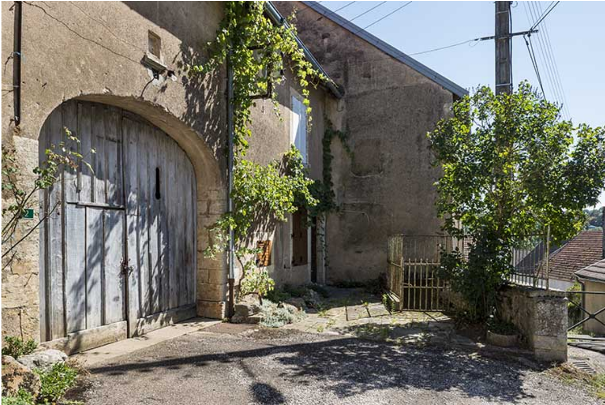
La porte cochère et l'accès vers une des maisons.