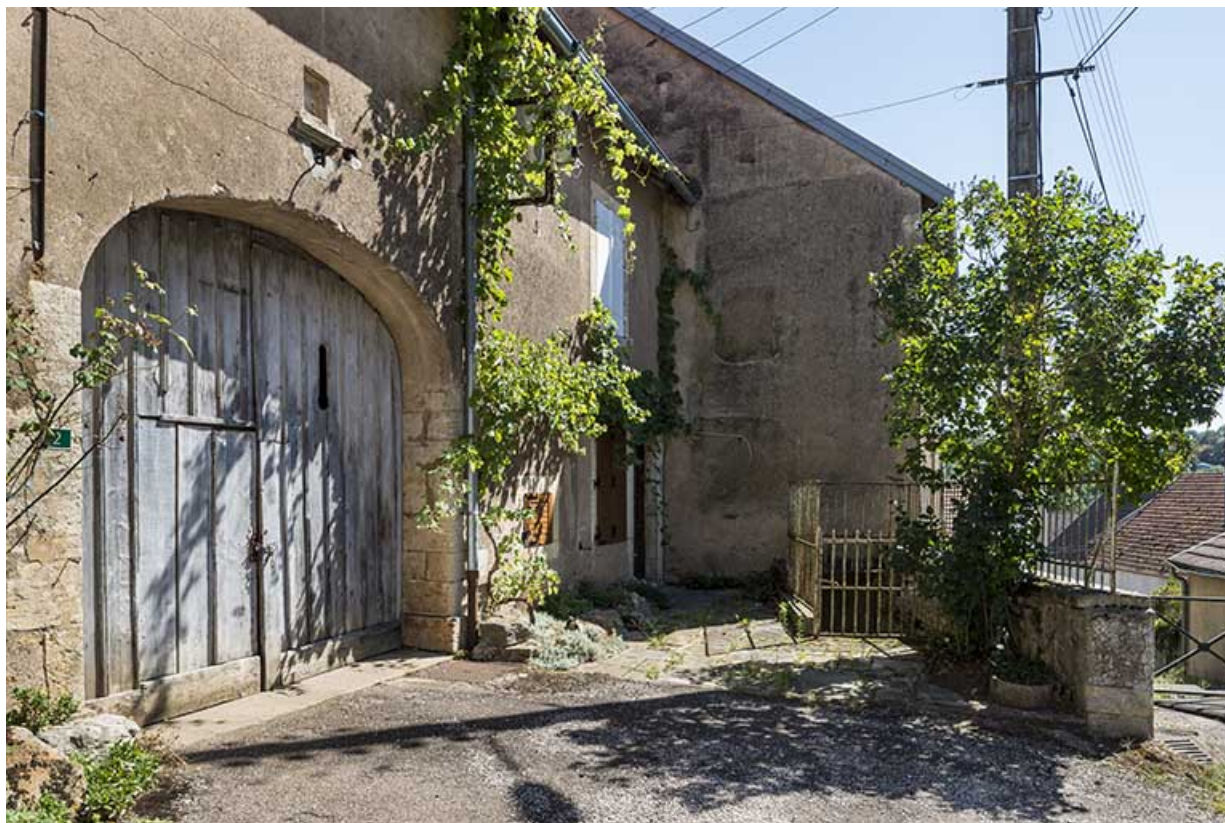
La porte cochère et l'accès vers une des maisons.