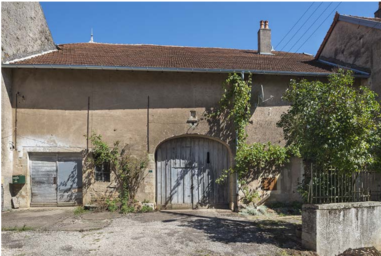
La porte cochère de la grange.