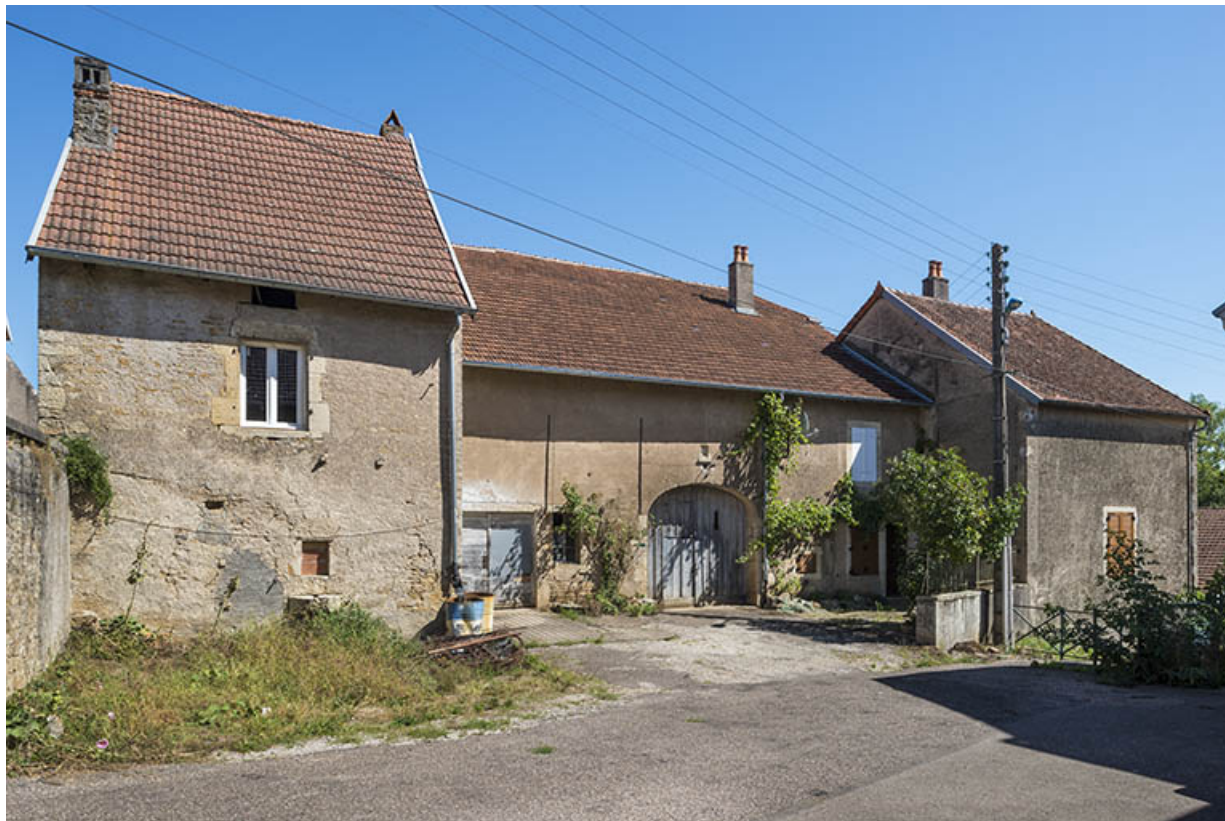
La façade antérieure.