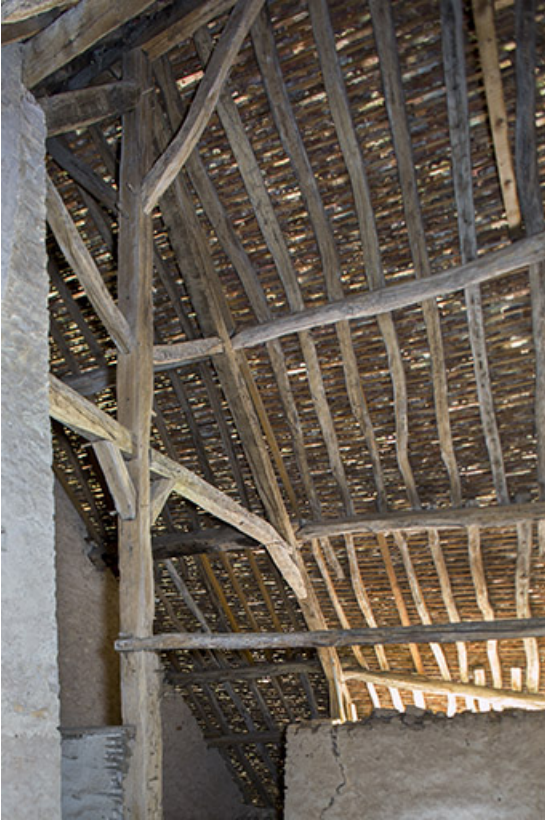
Intérieur : détail de la charpente.