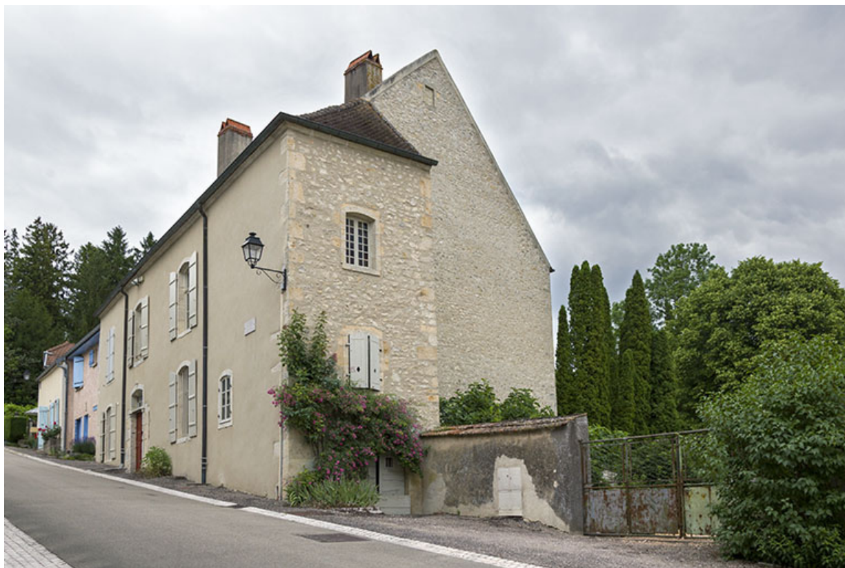
Vue générale depuis la rue du Château.