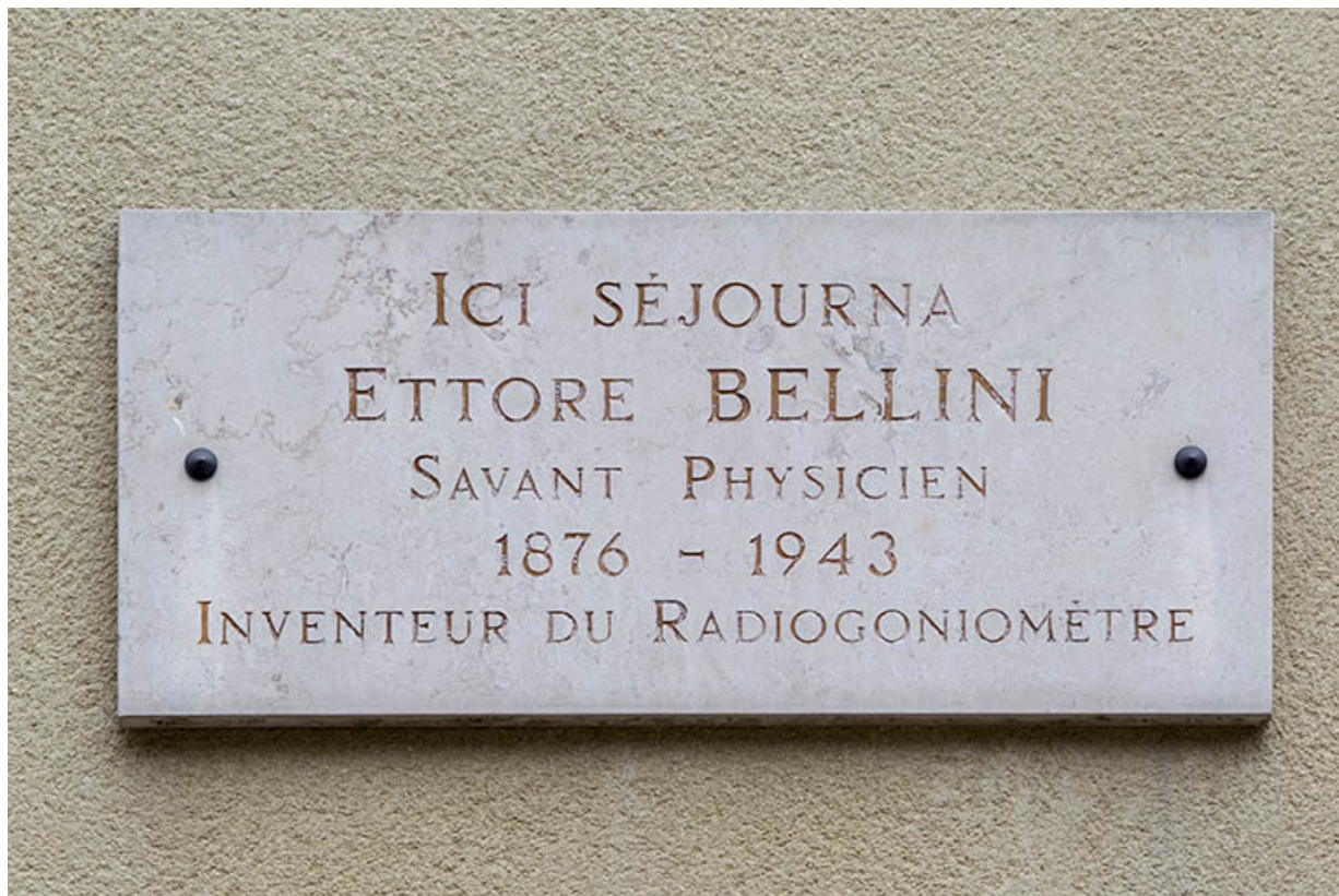
Plaque commémorative concernant Ettore Bellini, fixée sur la façade antérieure.