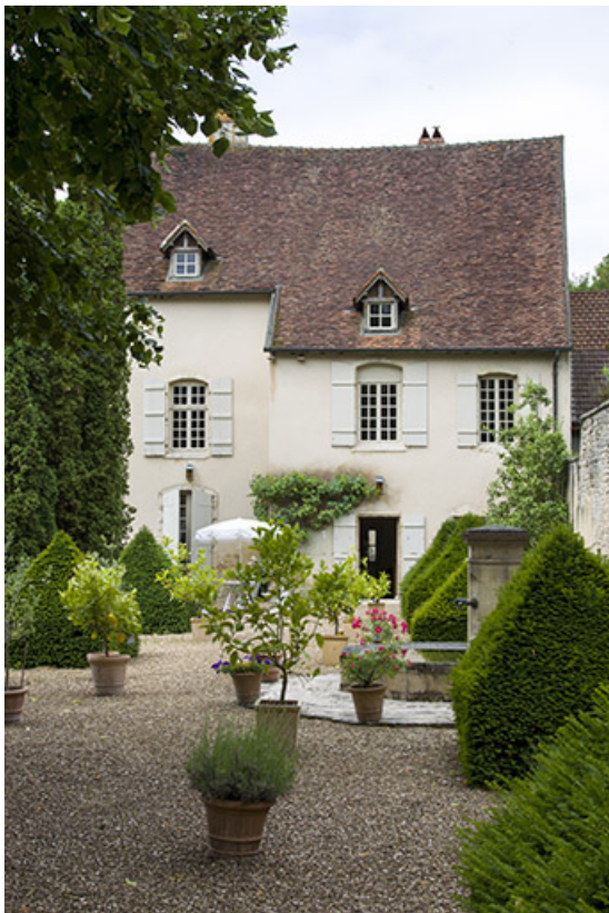
Façade postérieure donnant sur le jardin.