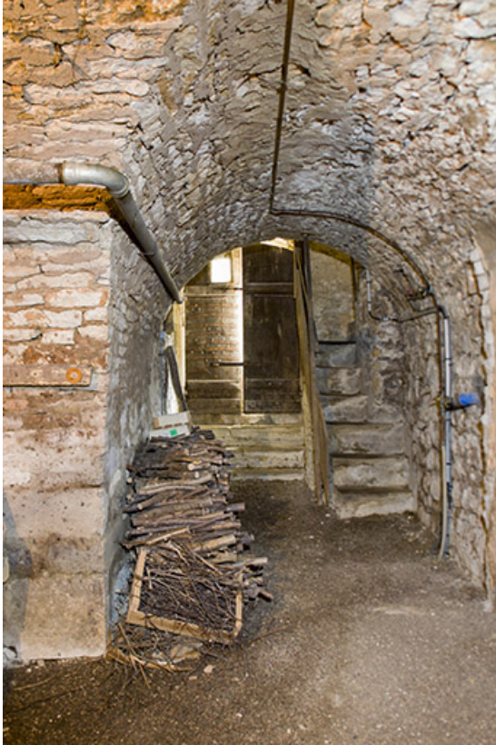
Intérieur : le sous-sol couvert d'une voûte en berceau.