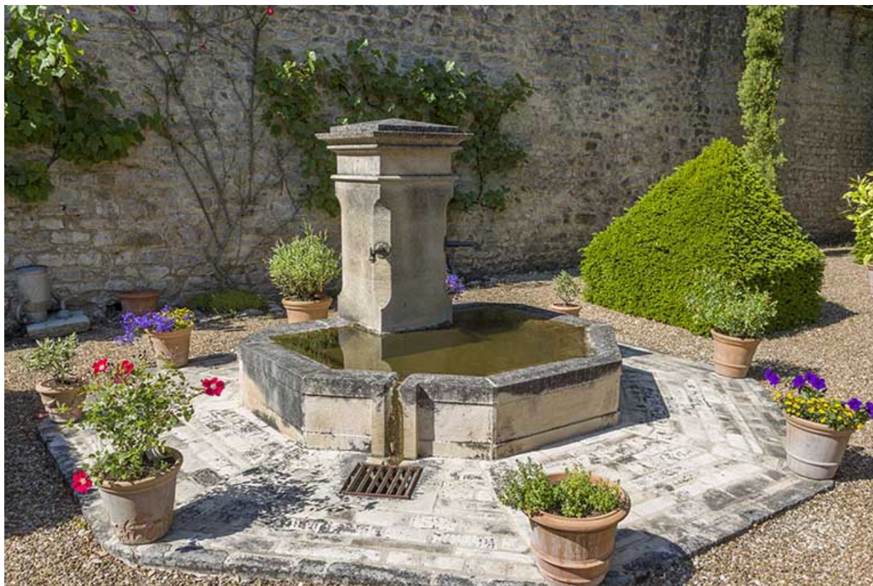
Fontaine réalisée en 2002 par le tailleur de pierre Bonnotte, d'après celle du village de Grandecourt (Haute-Saône). 70, Ray-sur-Saône, 8 rue du Château