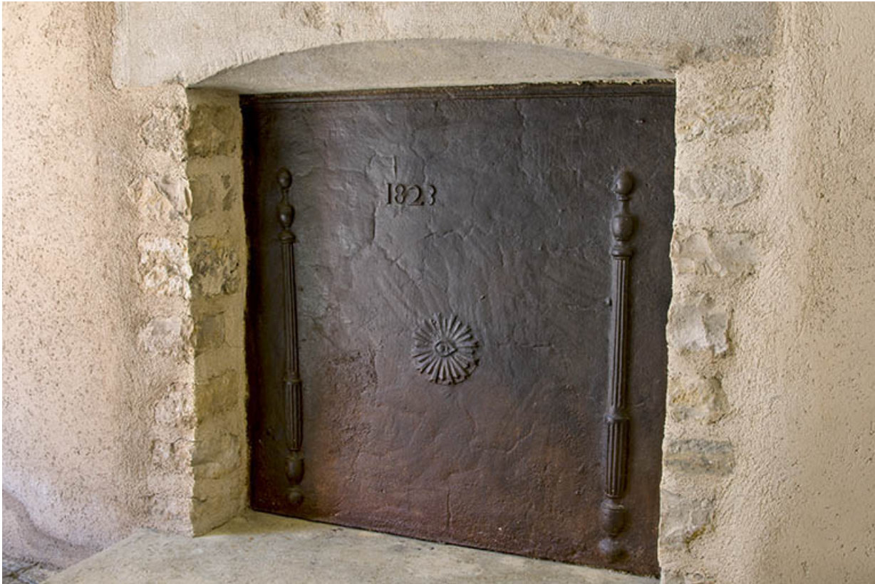
Plaque de cheminée portant la date 1823.