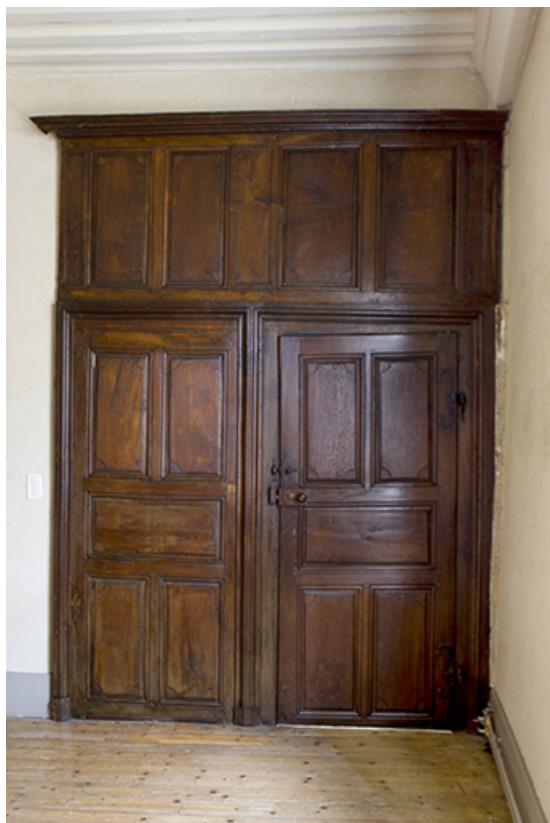
Intérieur : portes de placard et porte de communication.