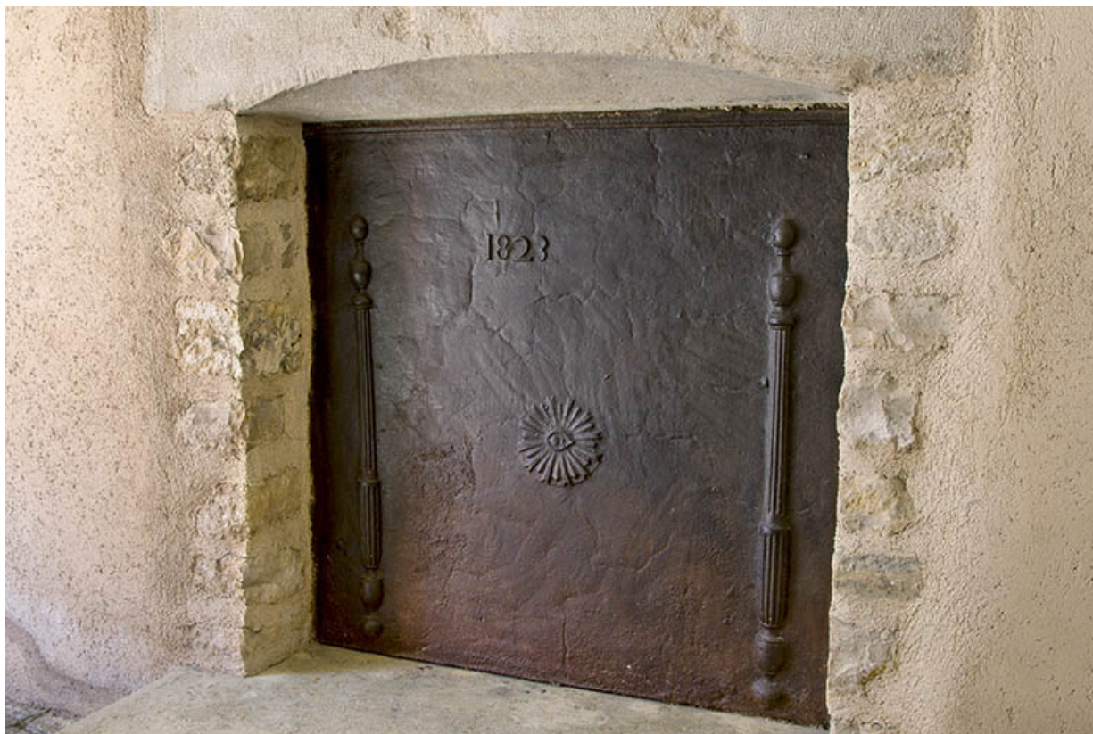
Plaque de cheminée portant la date 1823.