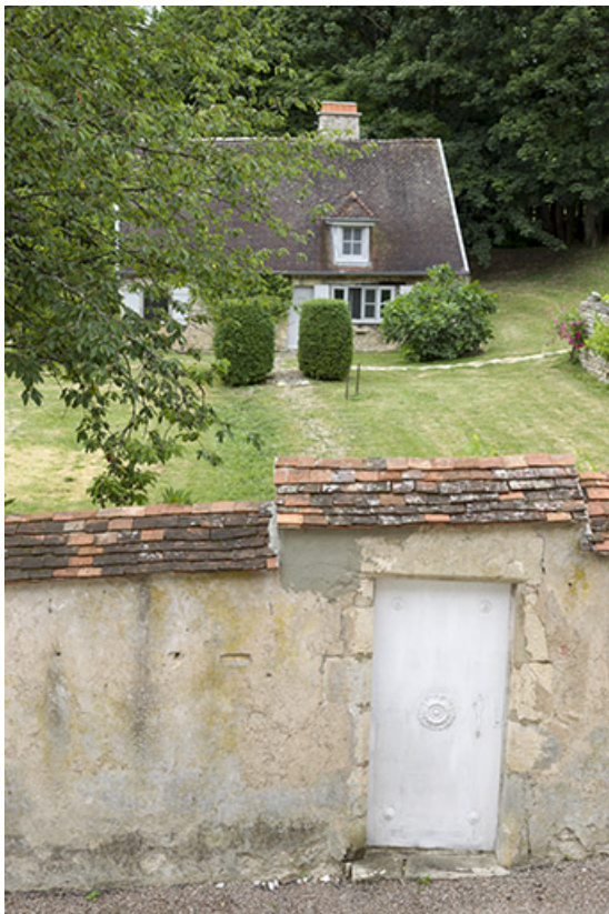
Maison rue du Château (cadastrée 1996 B 243) qui a abrité l'atelier du peintre Marcel Bellini, fils d'Ettore Bellini. 70, Ray-sur-Saône, 8 rue du Château