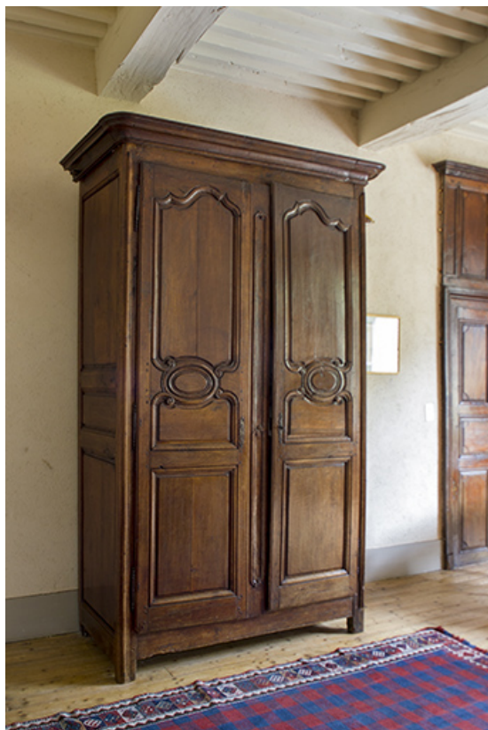
Intérieur : armoire.