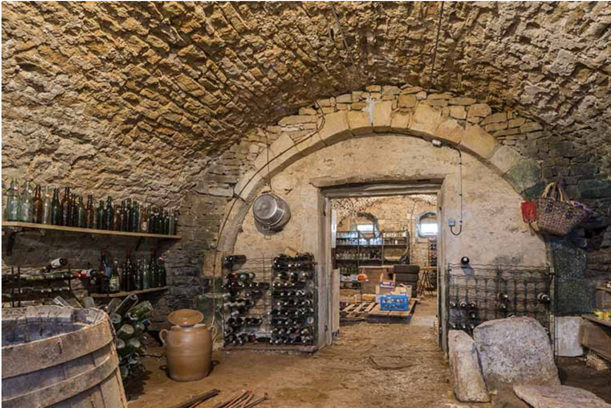
Cave voûtée, ferme de la Grande Vigne.