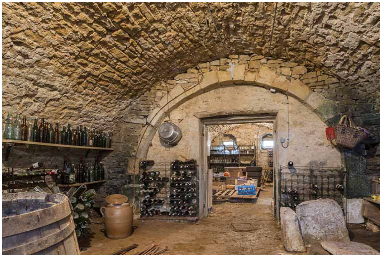
Cave voûtée, ferme de la Grande Vigne. 70, Purgerot