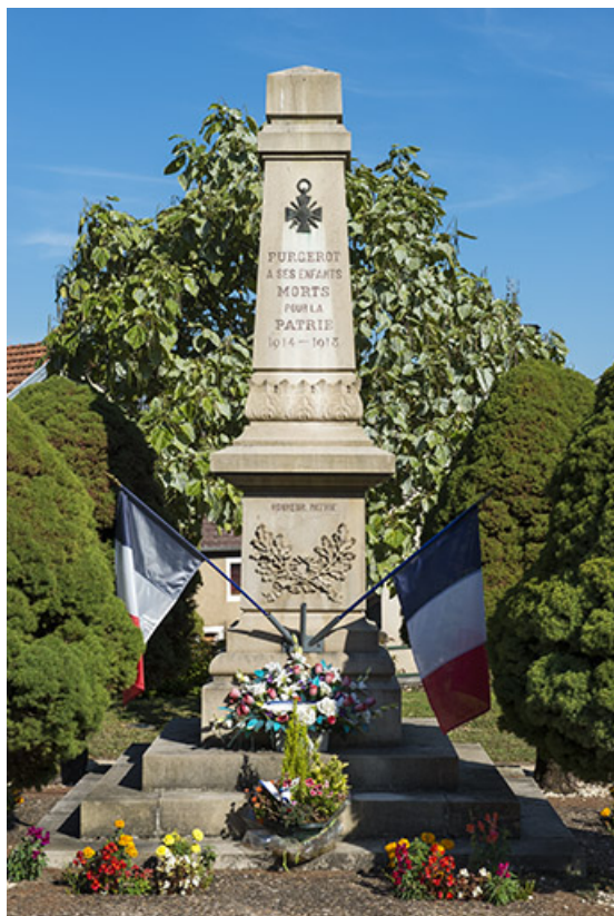
Le monument aux morts.