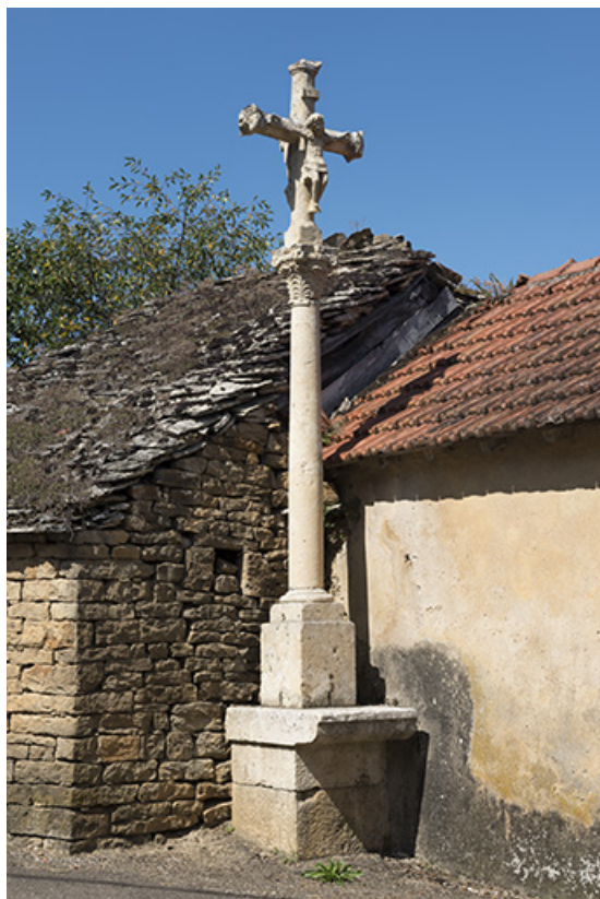
Croix située en haut du village.