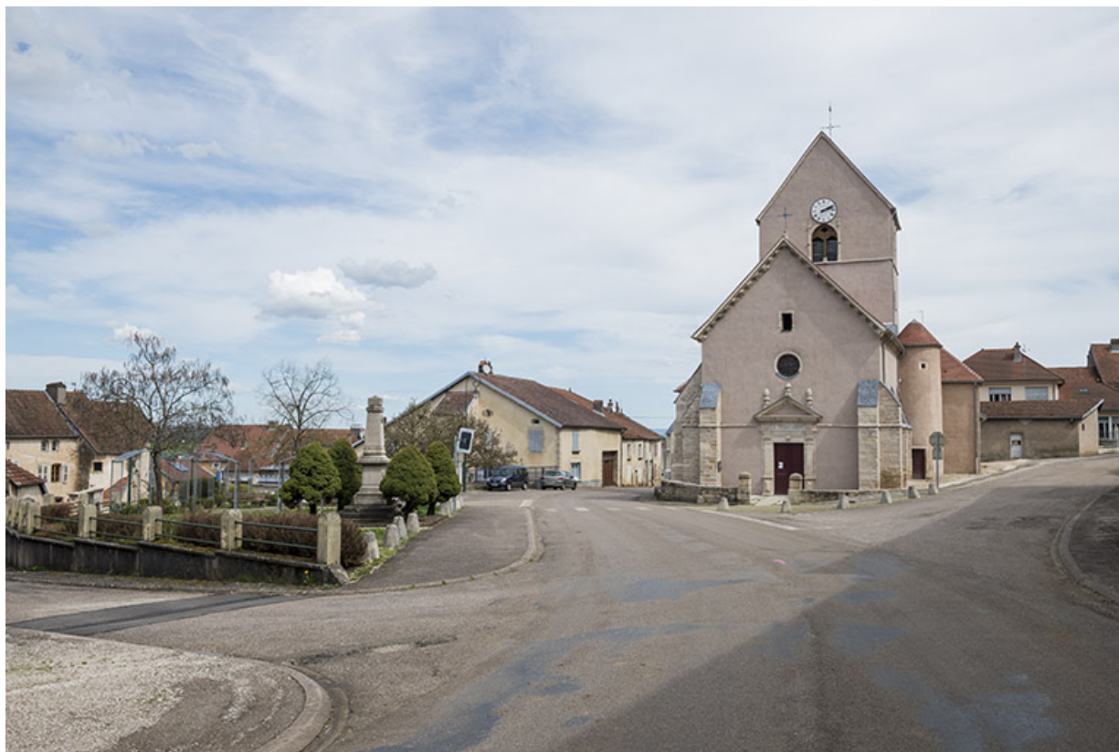
L'église et la place publique.