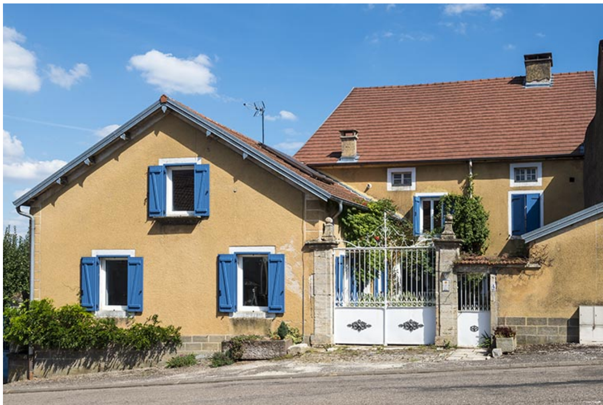
Ancien presbytère, rue du Vaux. 70, Purgerot