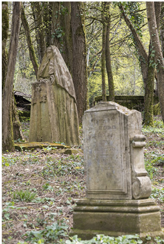
Tombes funéraires de l'ancien cimetière.