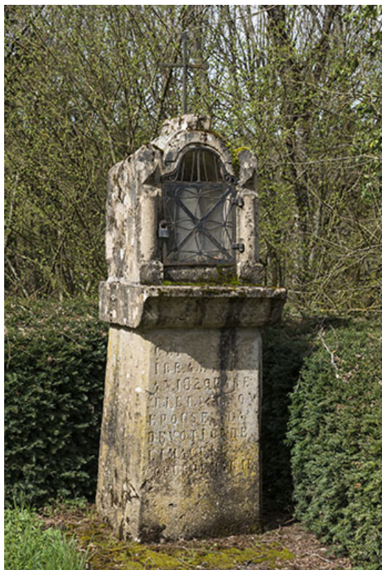
L'oratoire en direction d'Arbecsey. 70, Purgerot