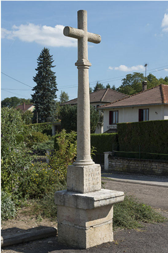
Croix, rue du Vaux.