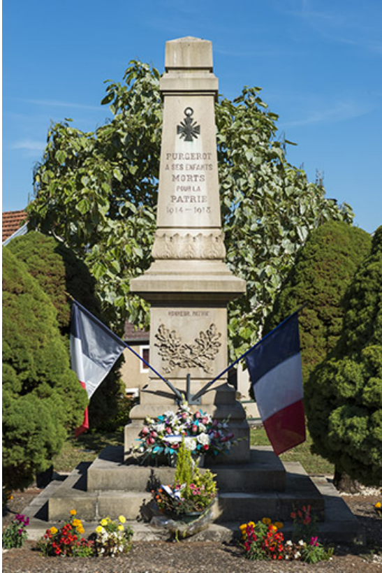
Le monument aux morts.