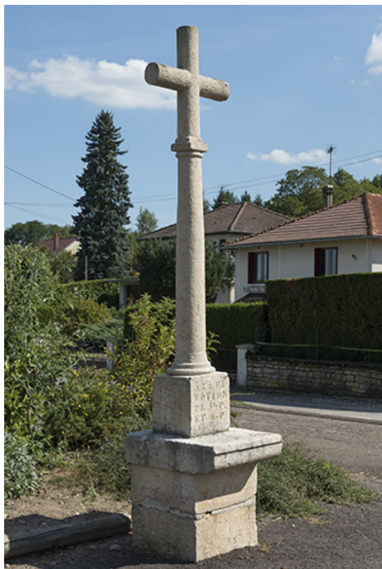
Croix, rue du Vaux. 70, Purgerot