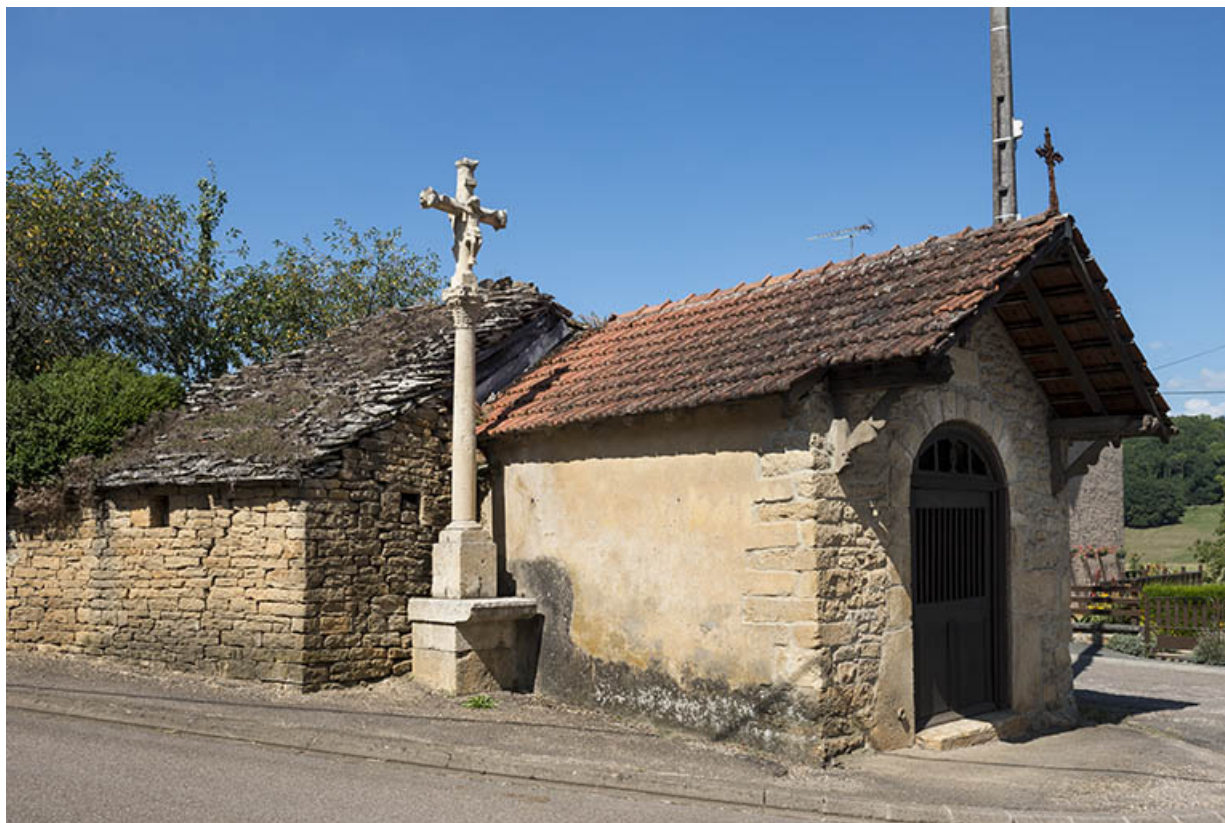
La chapelle dit de Jean d'Arosey. 70, Purgerot