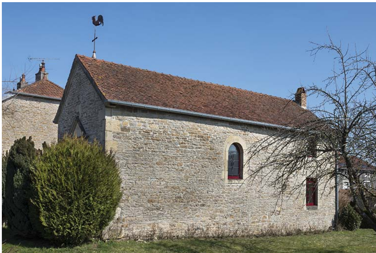
Chapelle à Port-d'Atelier. 70, Purgerot