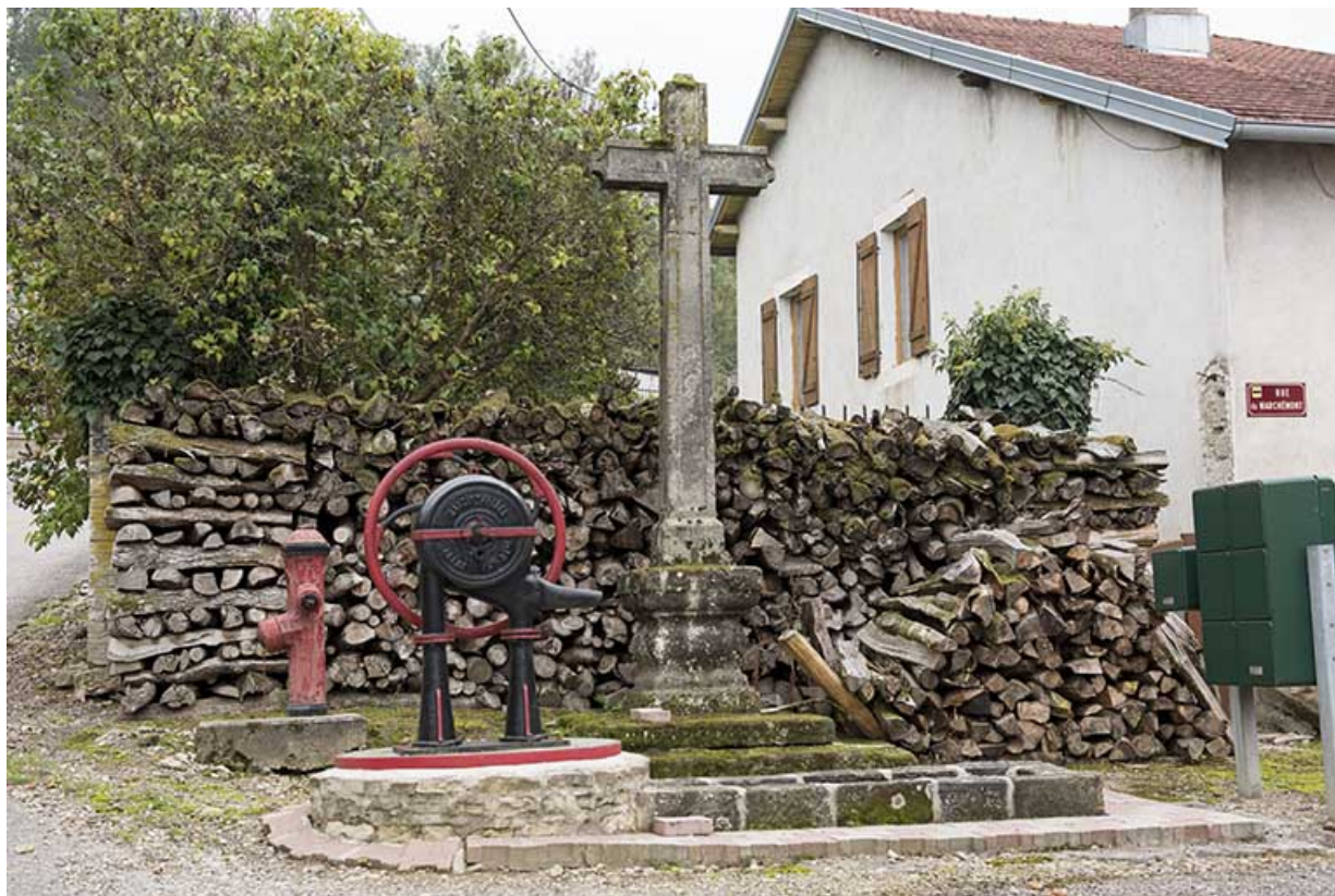
Croix érigée à l'angle du chemin du Marchemont et de la rue des Chenevières. 70, Demangevelle