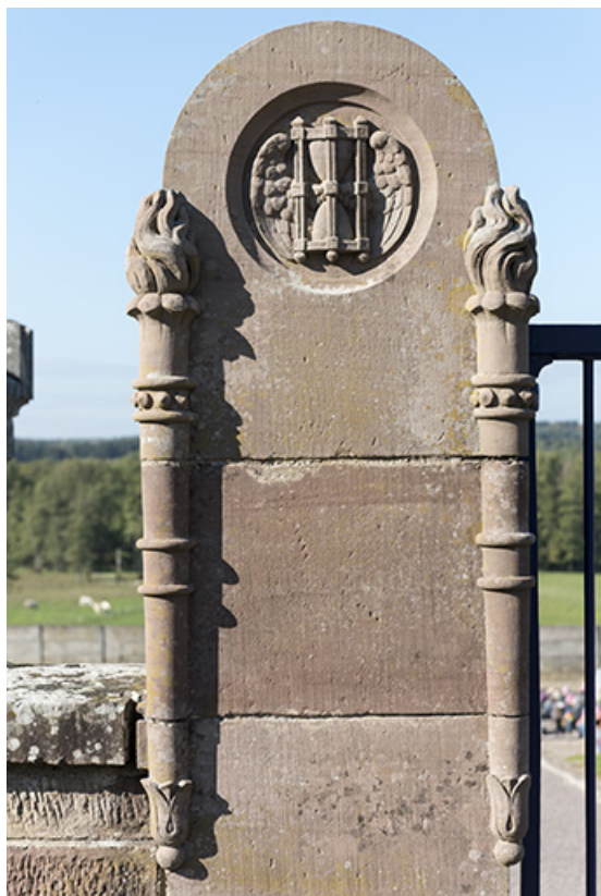
Détail du pilier gauche du portail d'entrée. 70, Demangevelle