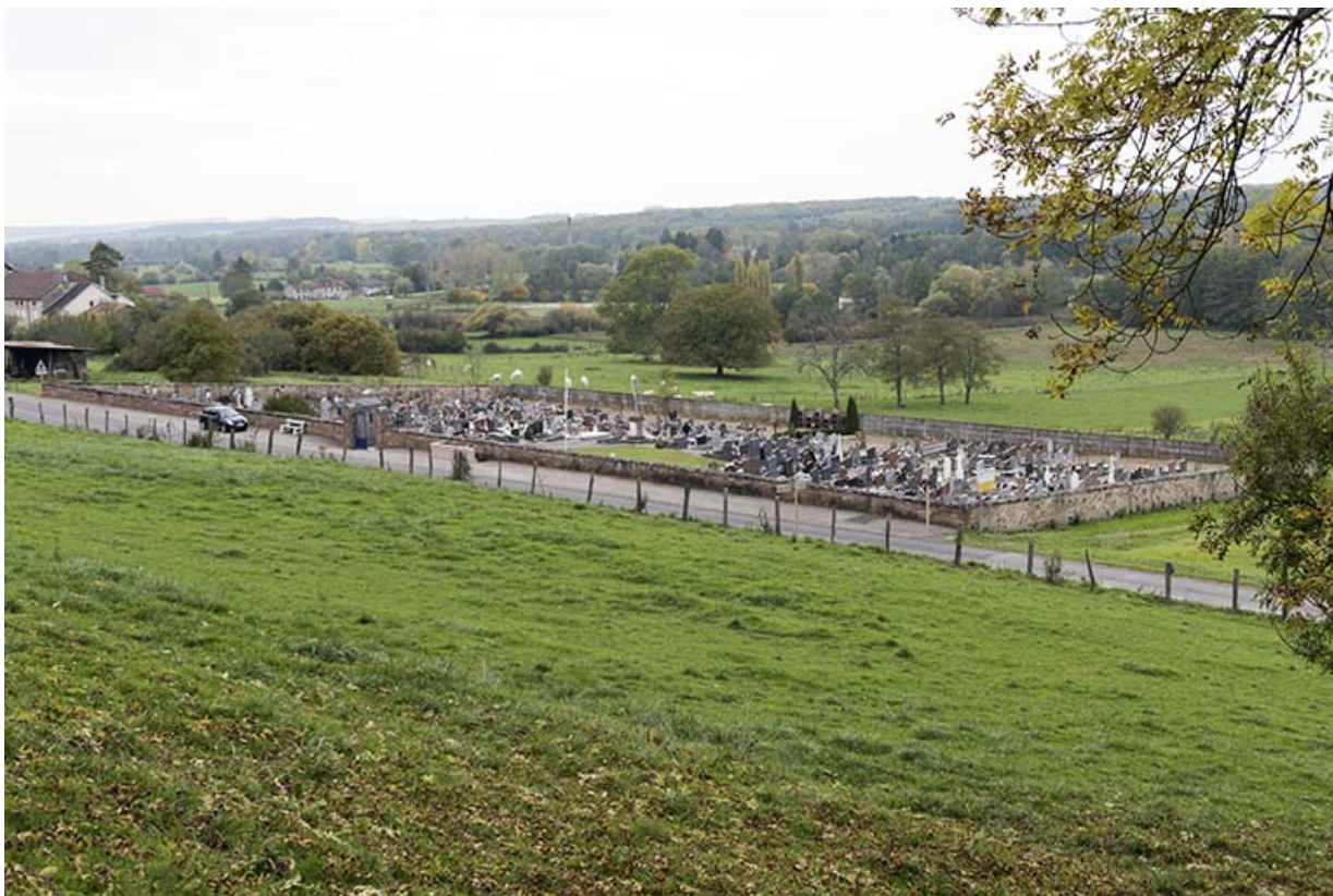
Le cimetière vu du sud-est. 70, Demangevelle