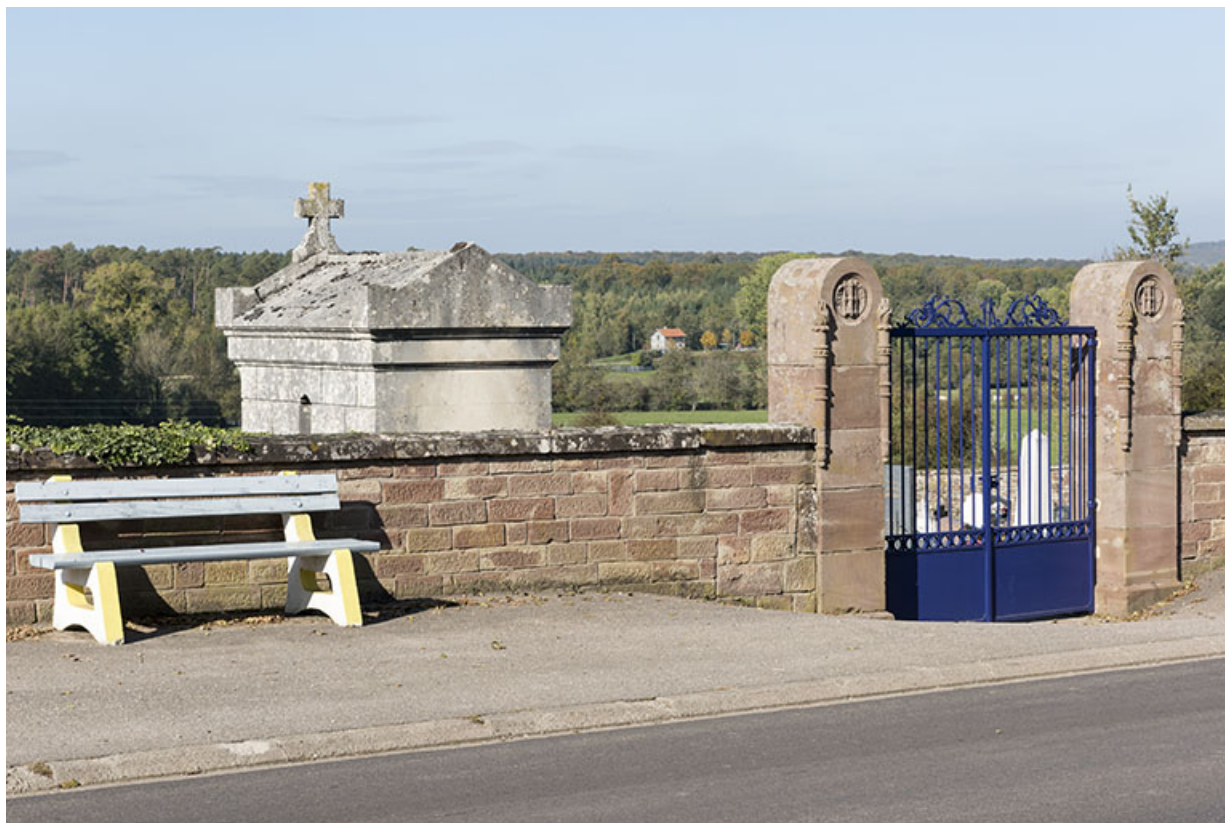
Entrée du cimetière.