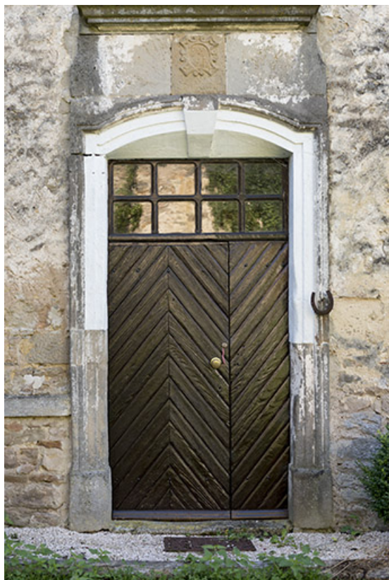
Détail de la porte d'entrée de la maison 11, rue des Marronniers. 70, Vouécourt