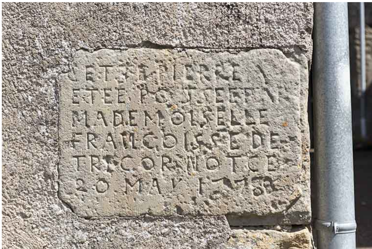
Inscription de fondation sur la maison 9 rue des Marronniers, par Françoise de Tricornot 20 may 1778 70, Vougécourt, 1 rue des Marronniers