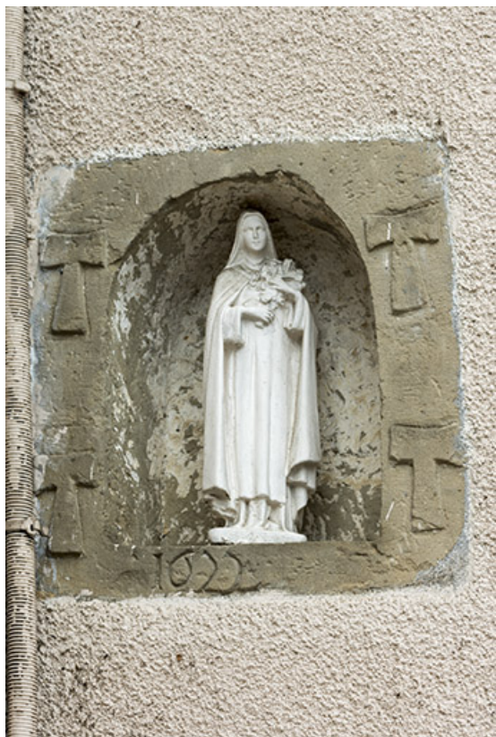
Niche entourée de quatre croix en tau et portant la date de 1622, 1 rue de la Corvée. 70, Vougécourt