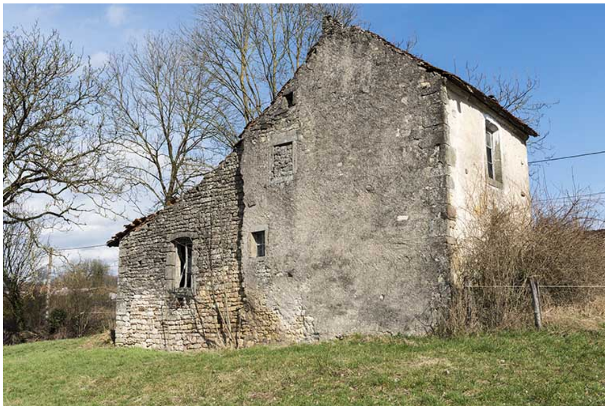
Maison à l'angle de la rue des Vosges et de la rue du moulin. Vue de trois-quart sud-ouest. 70, Vougécourt