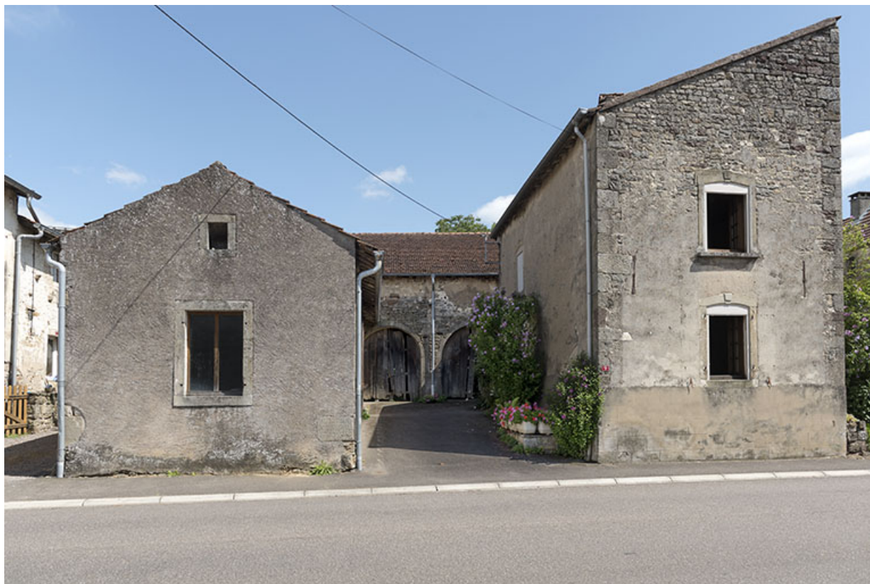
Maisons et fermes, 9 rue des Marronniers. 70, Vougécourt