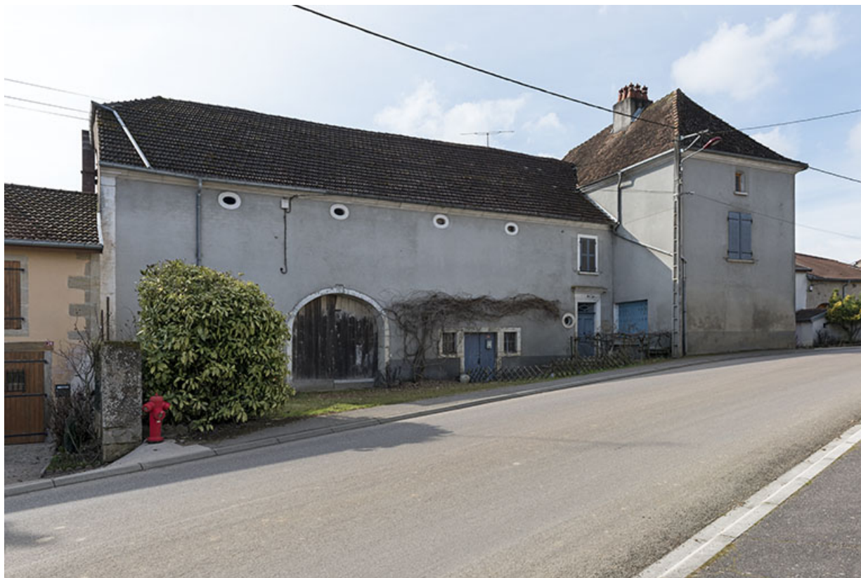
Façade sur rue d'une ferme à pavillon, 26 rue des Marronniers. Vue de trois-quart. 70, Vouécourt