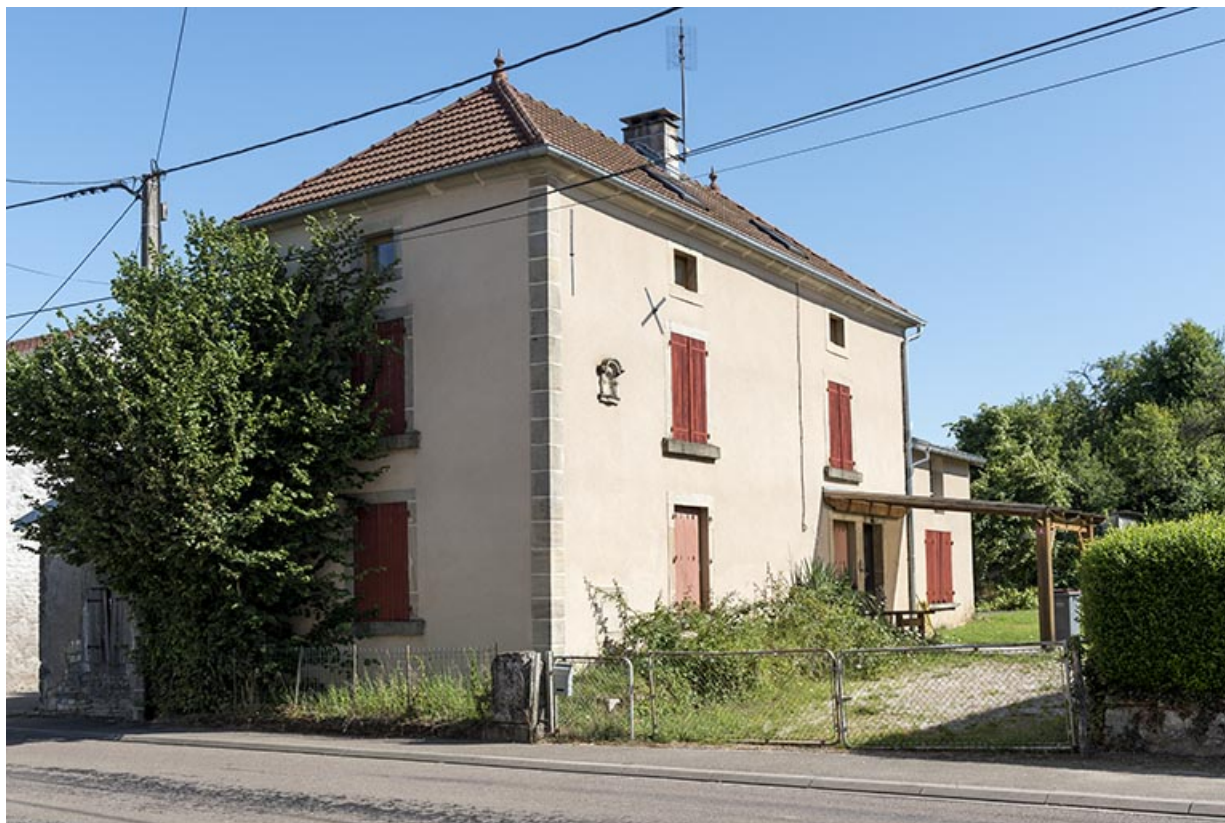
maison 6 rue des Vosges. Vue de trois-quart. 70, Vougécourt