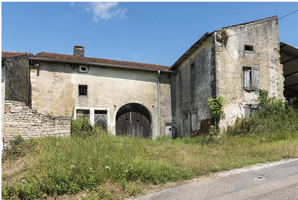
Ferme en retour d'équerre chemin de Seroux. 70, Vougécourt