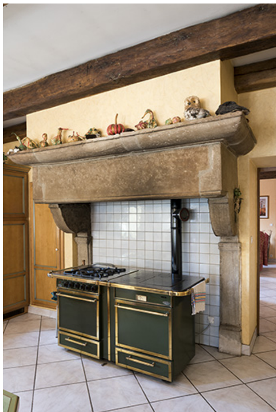
Cheminée vue de trois-quart dans la cuisine. (située dans l'ancienne épicerie) 70, Vougécourt