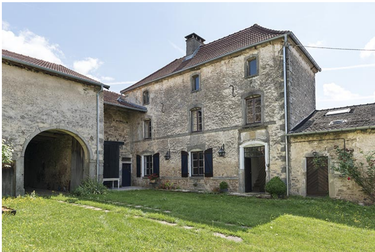
Vue de trois-quart de la maison 11, rue des Marronniers. 70, Vougécourt