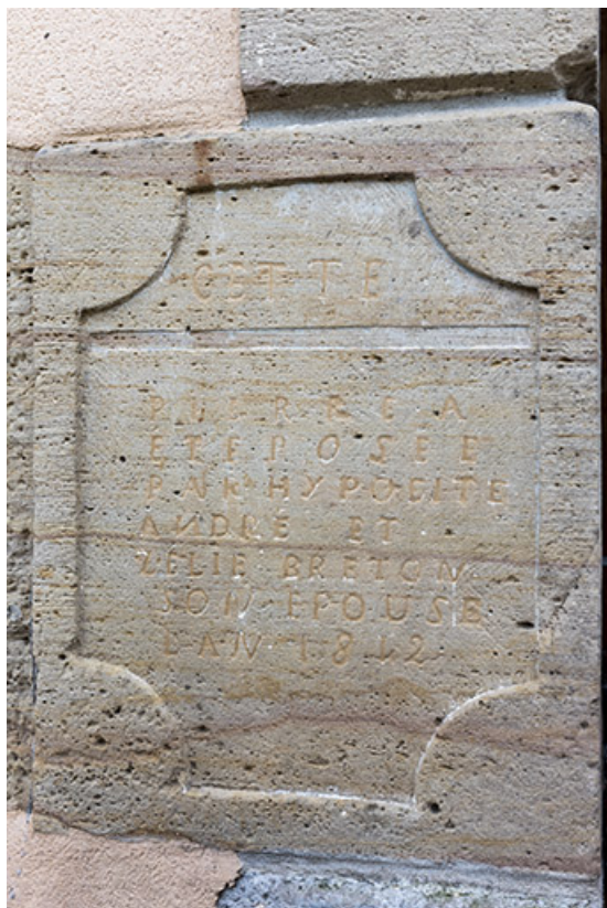
Vue de détail de la plaque de fondation et date portée (1842), 28 rue des Marronniers. 70, Vougécourt