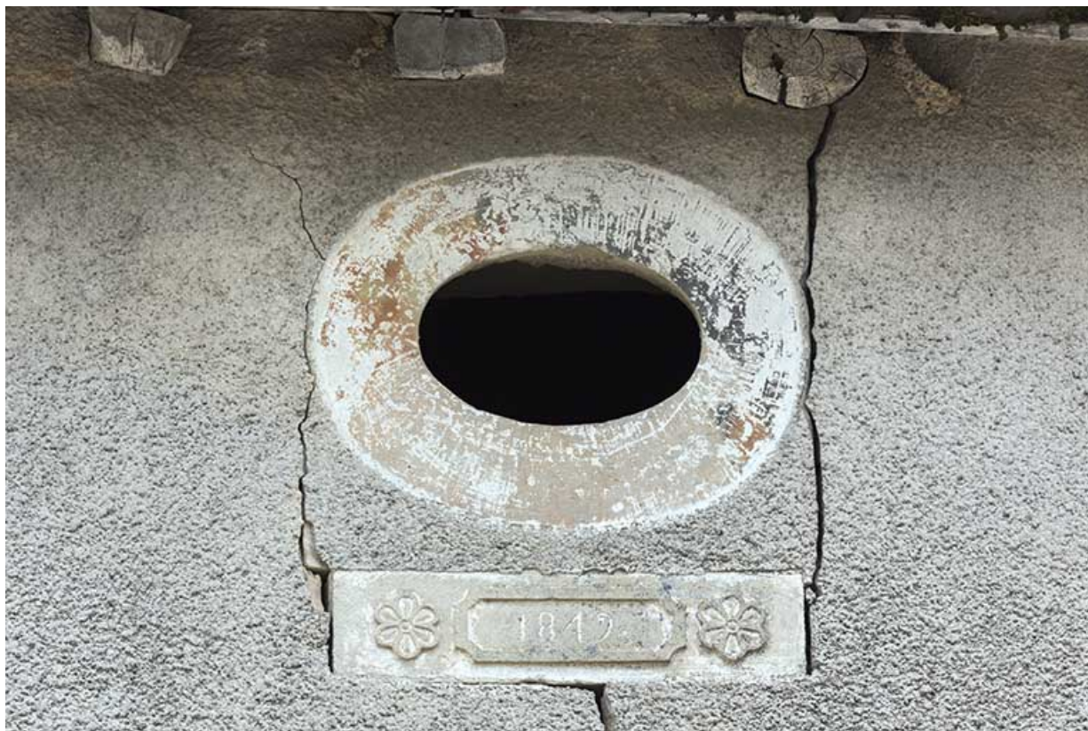
Date portée et oculus ovale oblong. (1849)