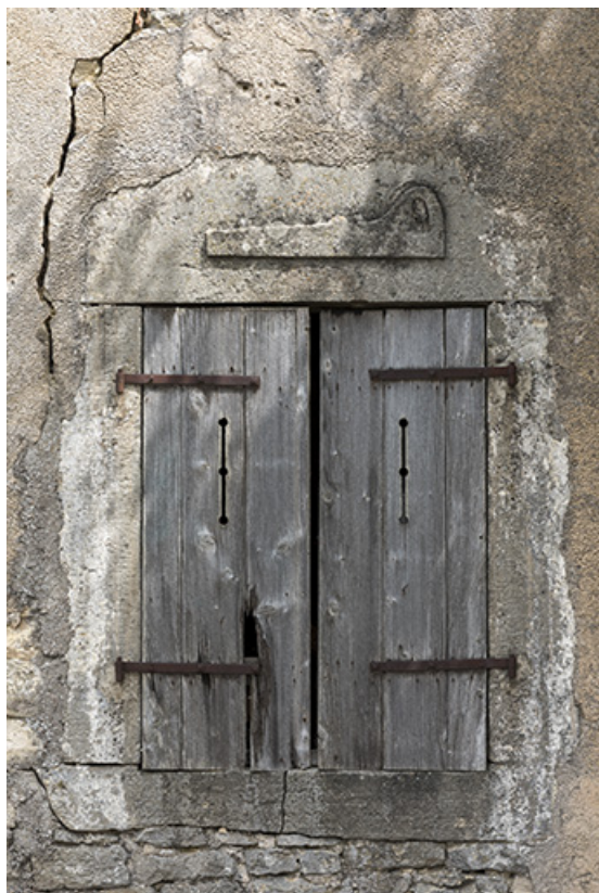
Détail de varlope sur l'appentis 8 rue des Vosges. 70, Vouécourt