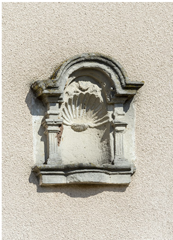
Détail de niche avec coquille sur la façade antérieure. 70, Vougécourt