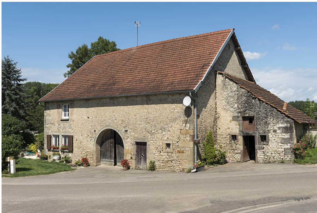
Ferme, ancien moulin, ancien four banal, 8 rue du Moulin. 70, Vougécourt