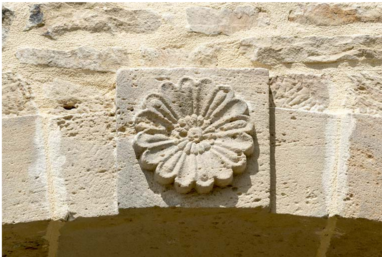
Détail sculpté sur la porte de grange : rosace.