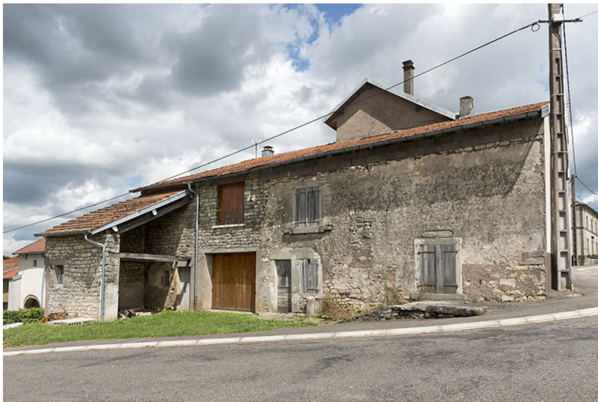
Maison place des Tilleuls. (Date portée 1839) 70, Vouécourt