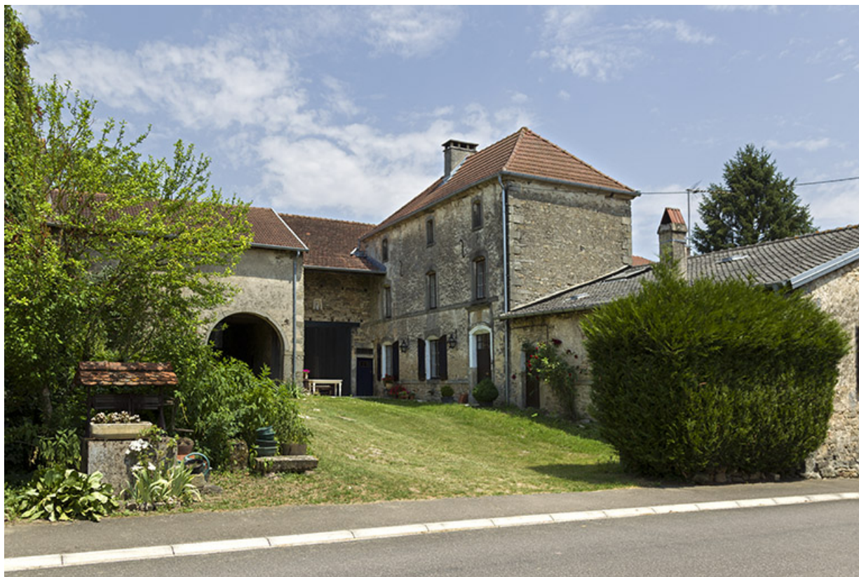
Maison et ferme, 11 rue des Marronniers. 70, Vougécourt