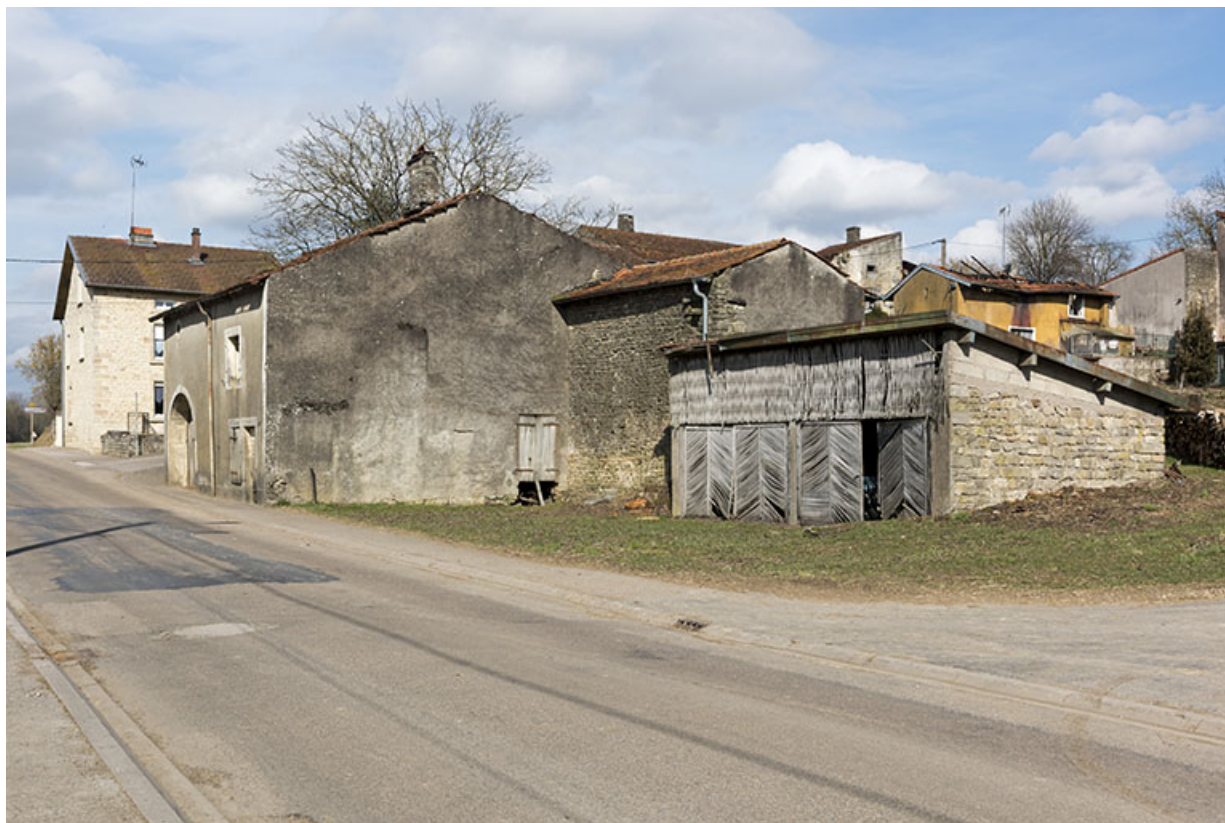
Appentis, 20 rue des Vosges. Travail de menuiserie des portes. 70, Vougécourt