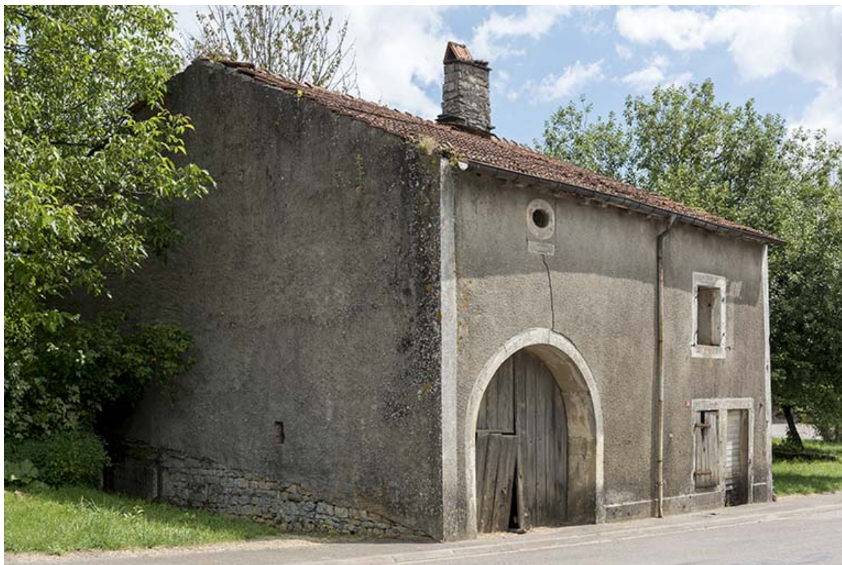
Maison bloc 20 rue des Vosges.