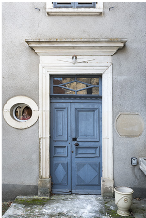
Porte, corniche, imposte, oculus, plaque de fondation : vue de face. 70, Vougécourt