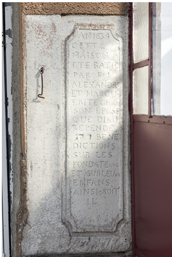
Pierre de fondation, 1 rue des Vergers. 70, Vougécourt