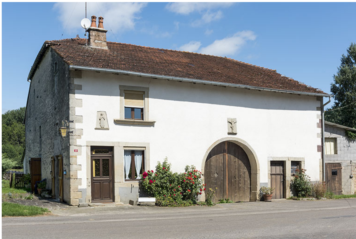
Ferme au 10 rue du Moulin : façade antérieure ornée de deux sculptures religieuses. 70, Vougécourt