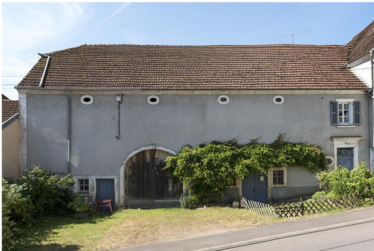
Façade sur rue d'une ferme à pavillon, 26 rue des Marronniers. Vue de face. 70, Vougécourt