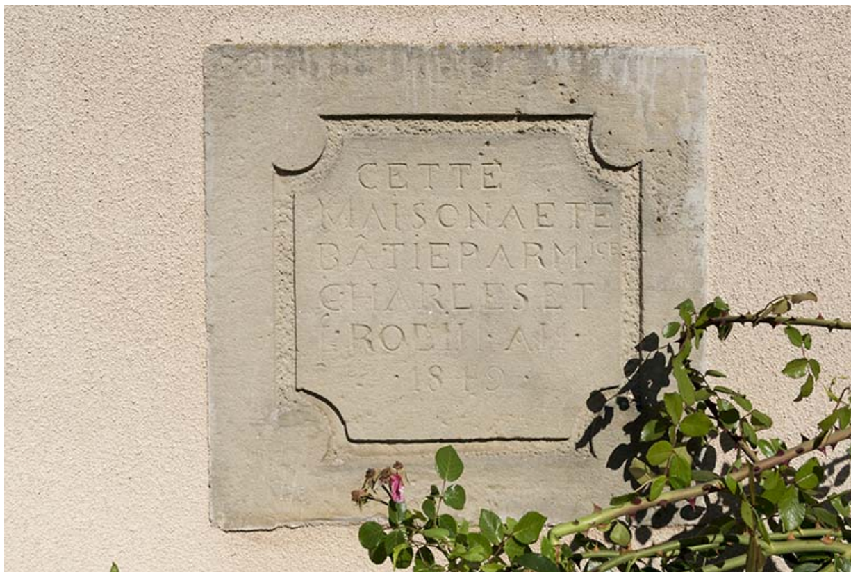
Inscription de fondation sur la façade antérieure. (1849) 70, Vougécourt