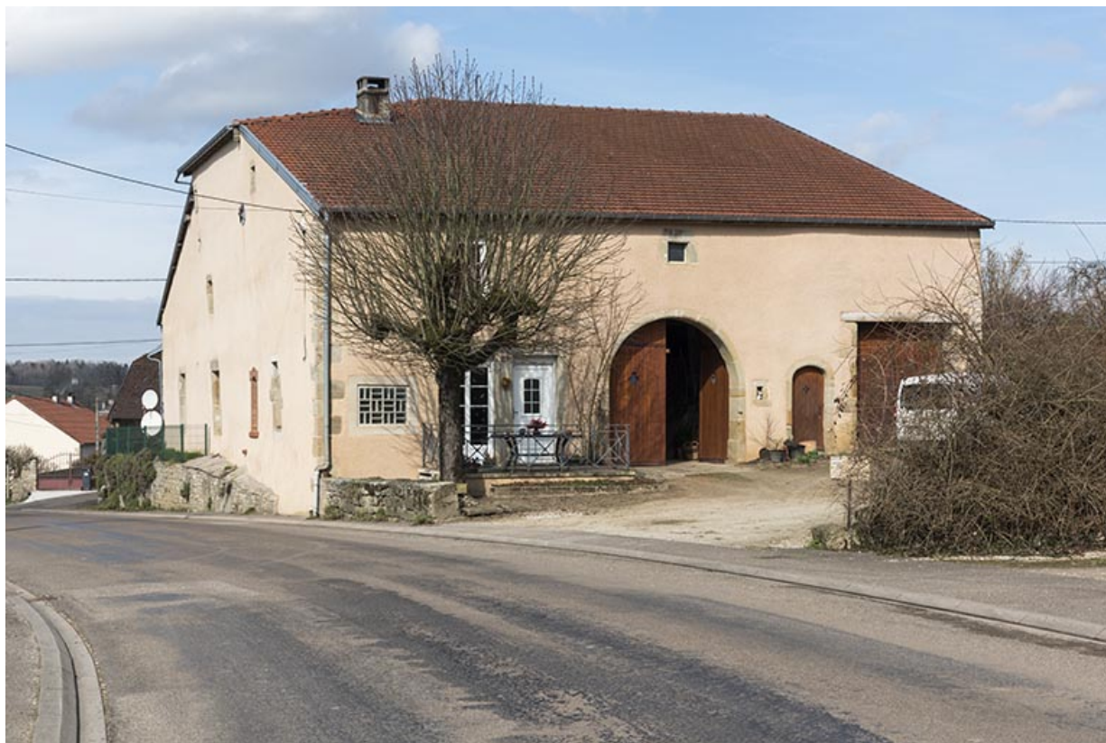
Ferme bloc : ancienne épicerie et ancien café. 12, rue des Vosges. 70, Vouécourt