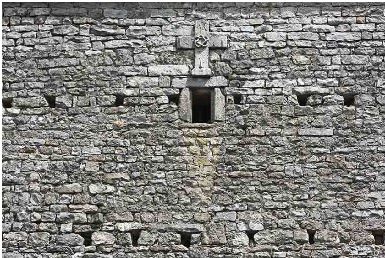
Croix sous la demi-croupe du mur pignon 16 rue des Vosges. 70, Vougécourt