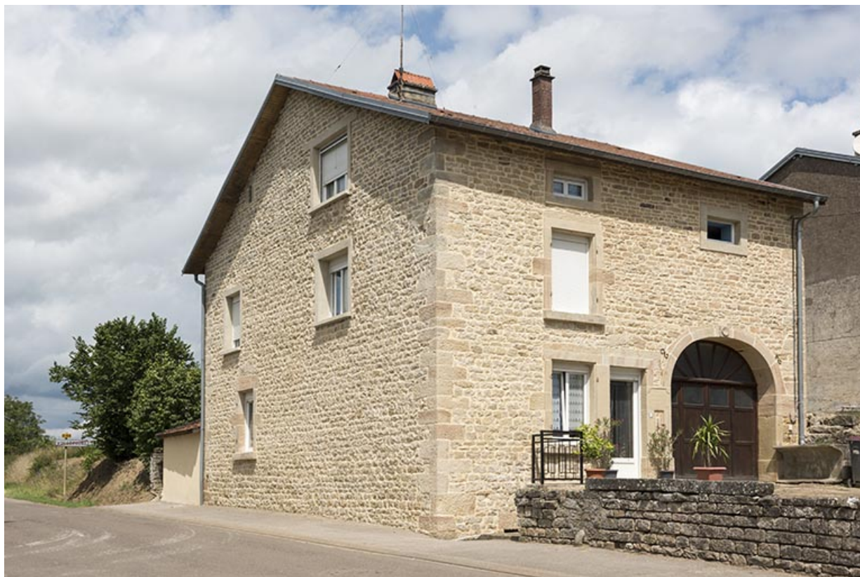
Ferme bloc chemin de Seroux.