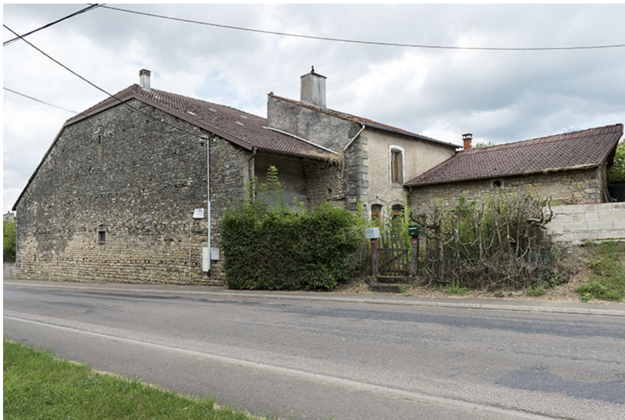
Maison 14,16 rue des Vosges.