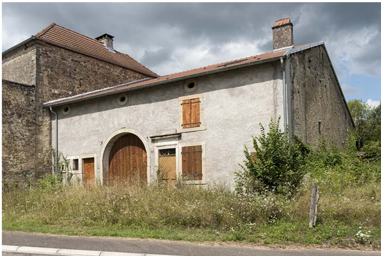
Maison ferme bloc, 13 rue des Marronniers. Vue de trois-quart. 70, Vougécourt