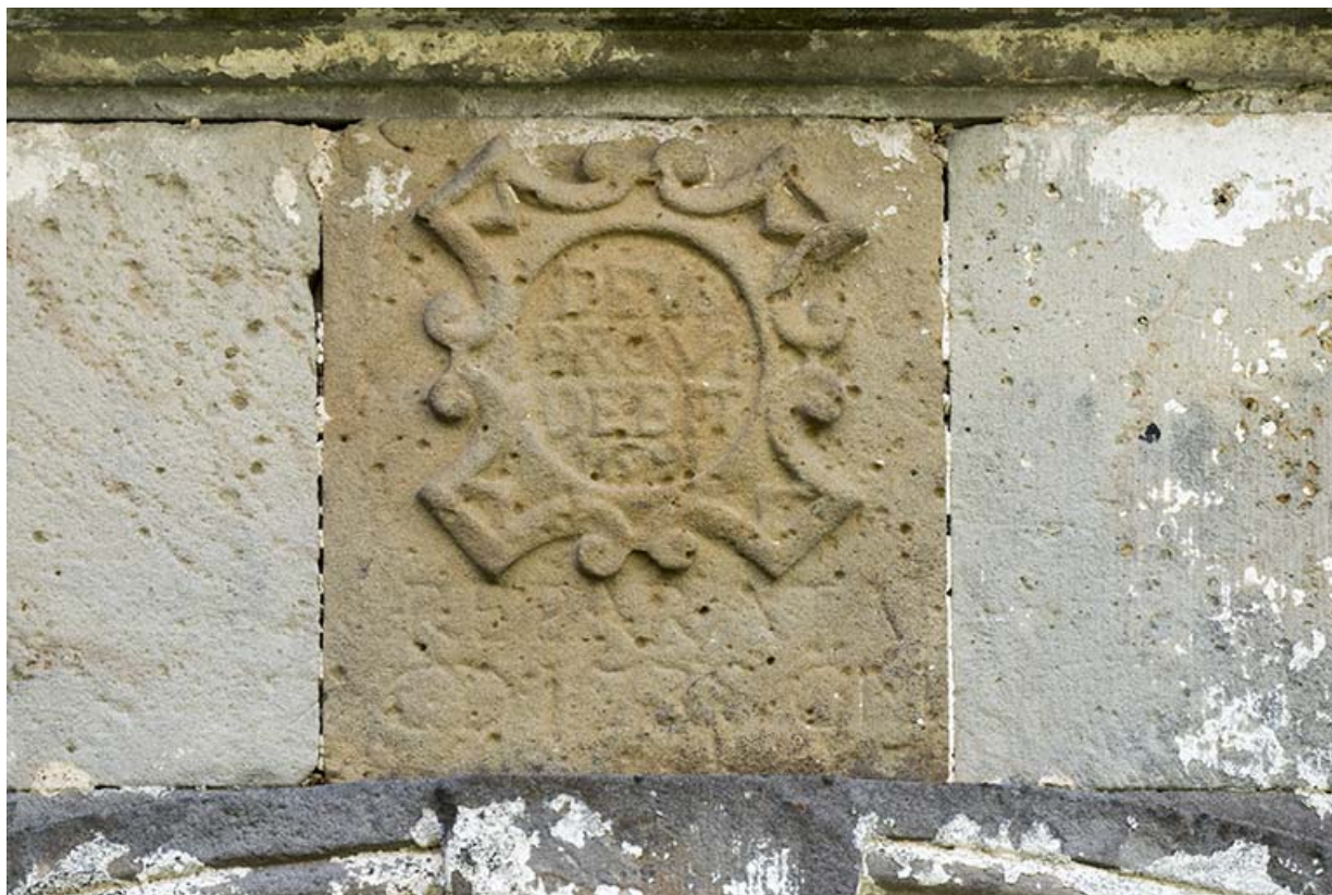
Détail du bas-relief surmontant la porte d'entrée. 11 rue des Marronniers. 70, Vougécourt