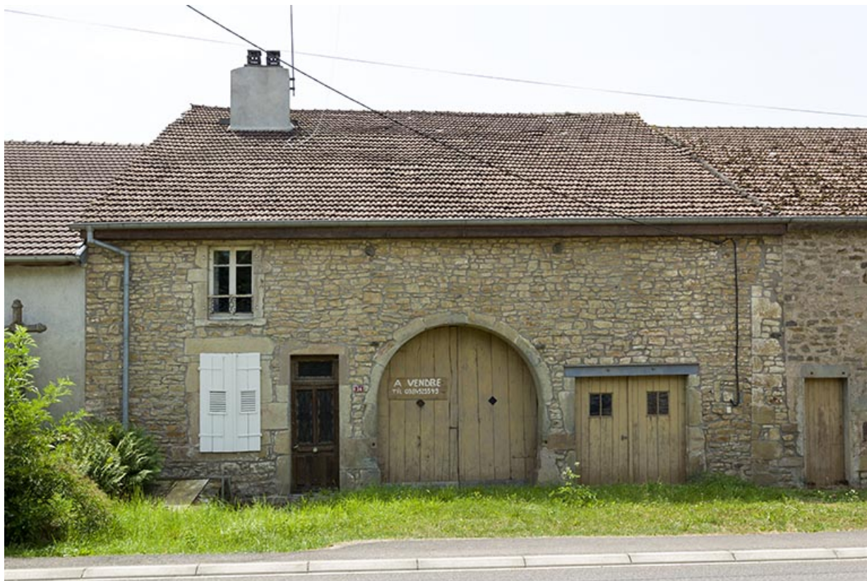
Maison ferme avec trappon de cave sur rue : 14, rue des Marronniers. 70, Vougécourt