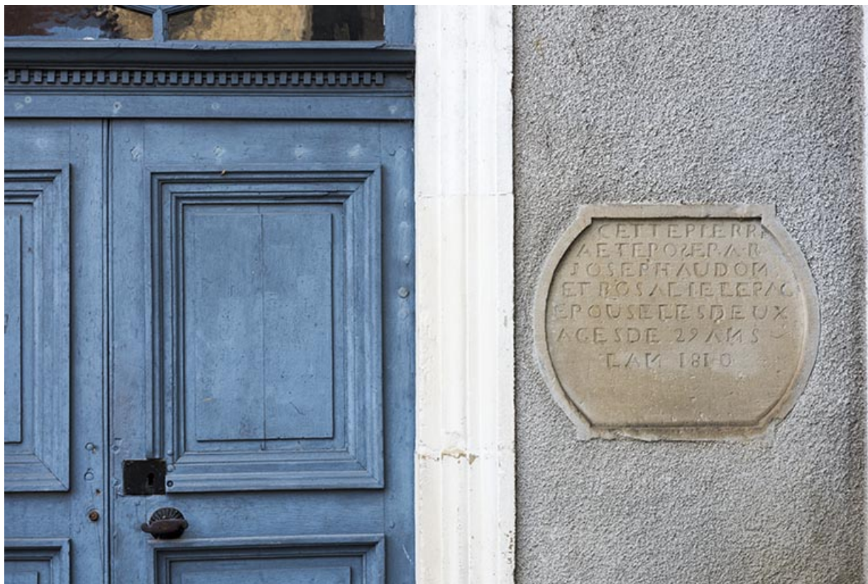
Détail de l'inscription et date portée. (1810)