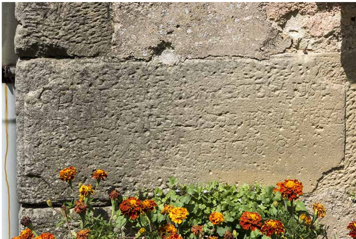
Détail : pierre de fondation (1788) (ancien moulin) 70, Vougécourt