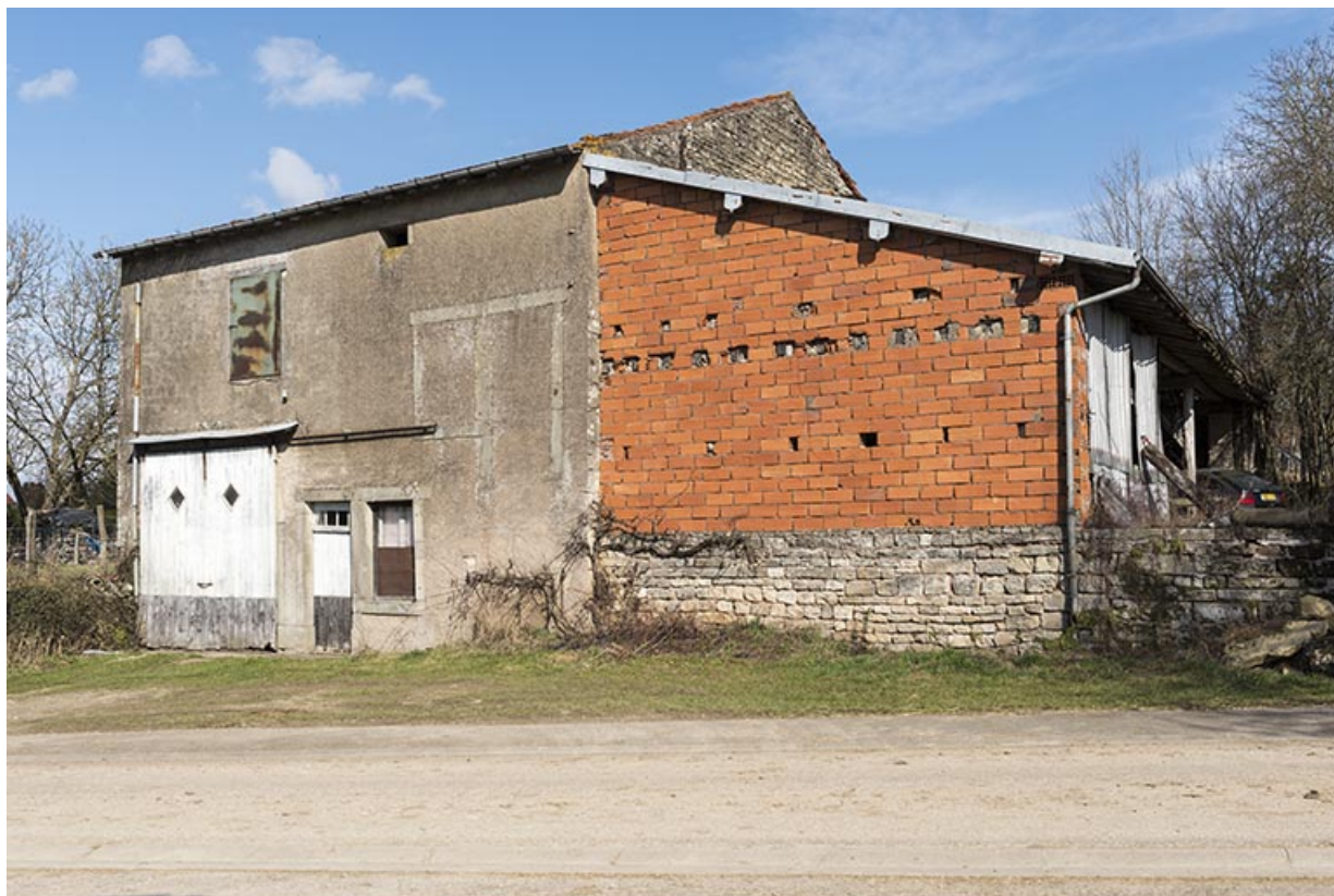
Maison rue des Canes.