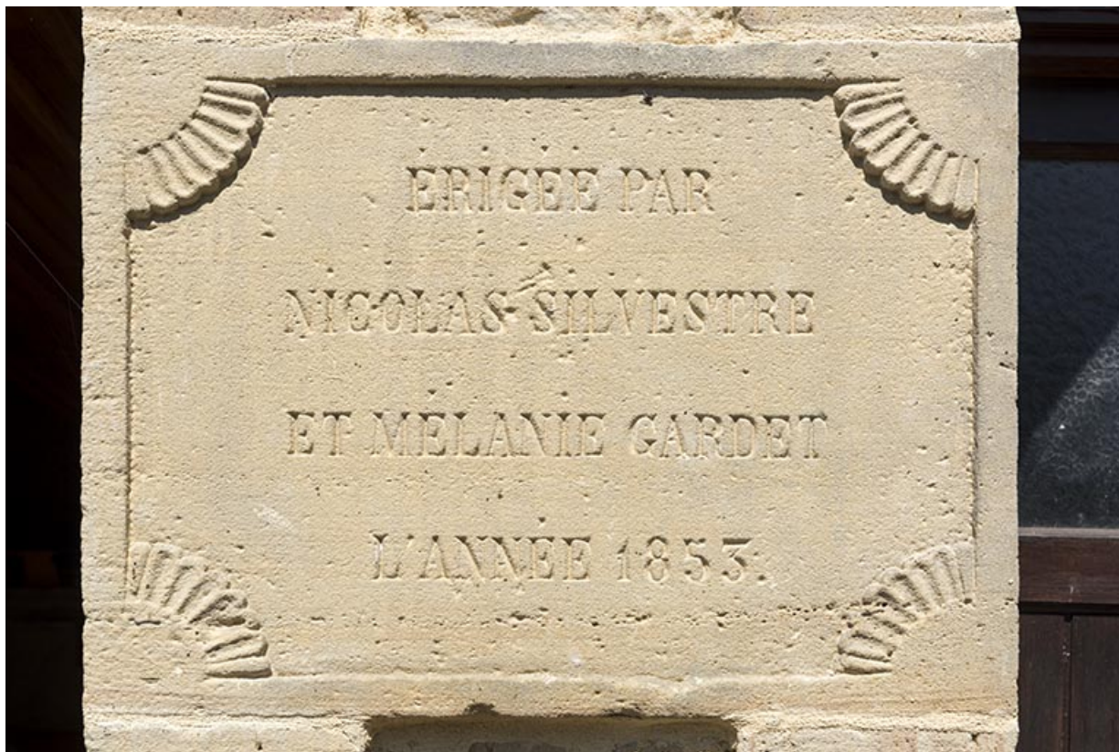
Inscription sur la façade. (1853)