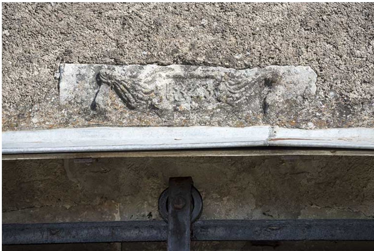
Date portée (1843?) sur un motif de linge tendu plissé. 70, Vougécourt