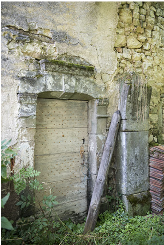
Maison à l'angle de la rue des Vosges et de la rue du moulin. Détail de la porte sur le pignon nord-est. 70, Vougécourt