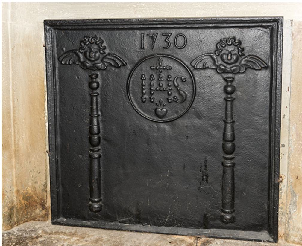
Détail : plaque de cheminée (1730), 10 rue du Moulin. 70, Vougécourt