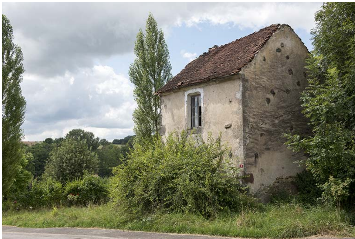
Maison à l'angle de la rue des Vosges et de la rue du moulin. Vue de trois-quart nord-est. 70, Vougécourt