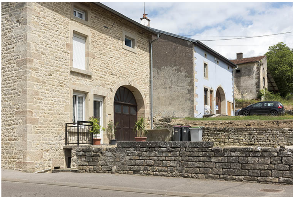
Alignement des fermes chemin de Seroux, vu de la rue des Vosges. 70, Vougécourt