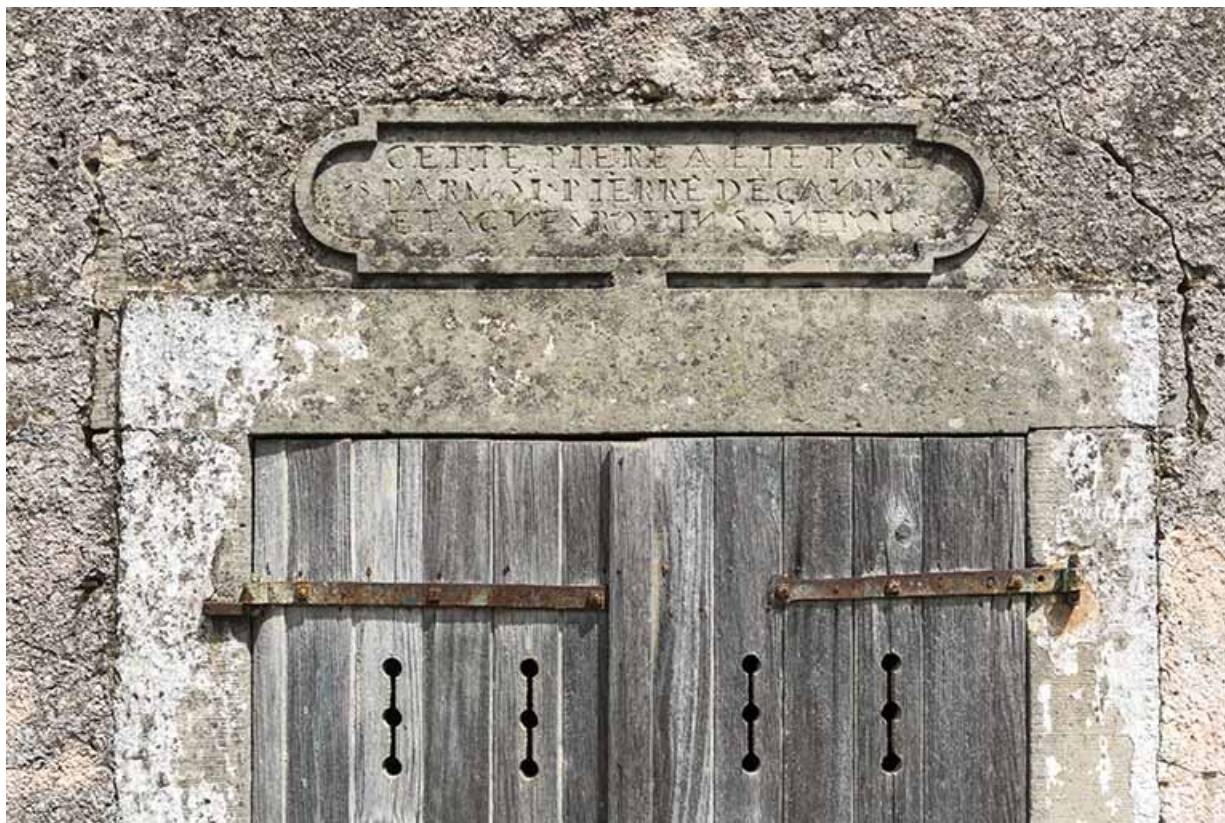
Détail d'inscription de fondation et date portée : 1839. 70, Vougécourt