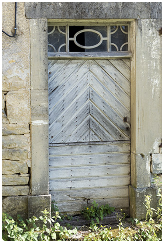
Détail de menuiserie et imposte de la porte piétonnière d'une ferme chemin de Seroux. 70, Vougécourt