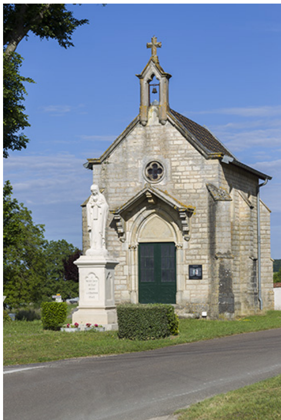
Chapelle Sainte-Anne et statue de la Vierge Libératrice de Ray. 70, Ray-sur-Saône rue Sainte-Anne, lieudit : Vignes Sainte-Anne