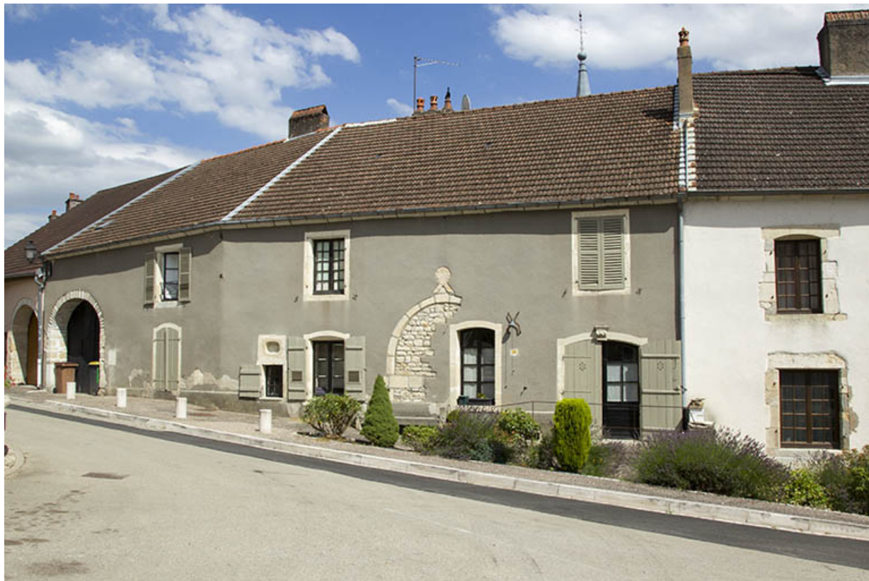
Maison 4 place Gabrielle de Salverte.