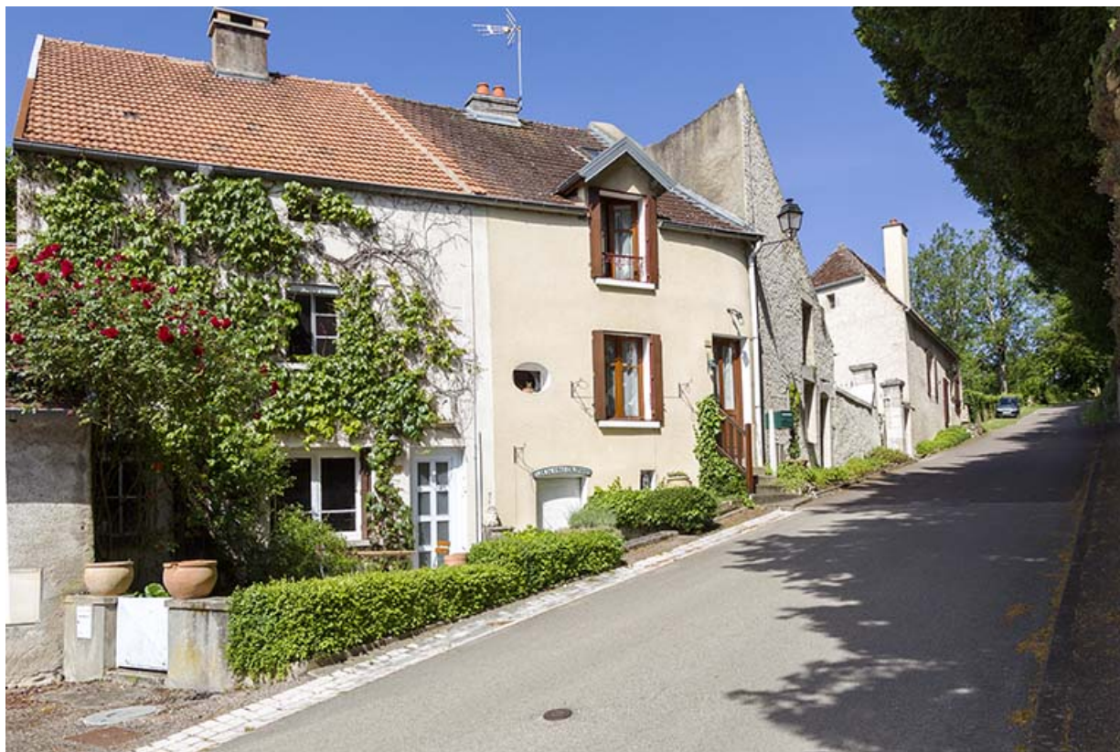
Maisons vigneronnes à l'extrémité de la rue du Château. Ces maisons se signalent par leur entrée de cave. 70, Ray-sur-Saône