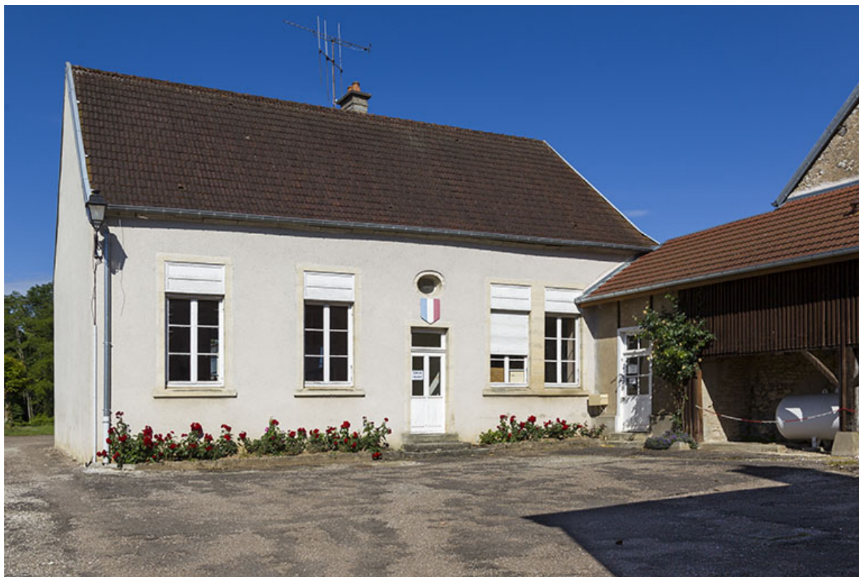
Ancienne école de garçons : façade antérieure, de trois quarts gauche. 70, Ray-sur-Saône