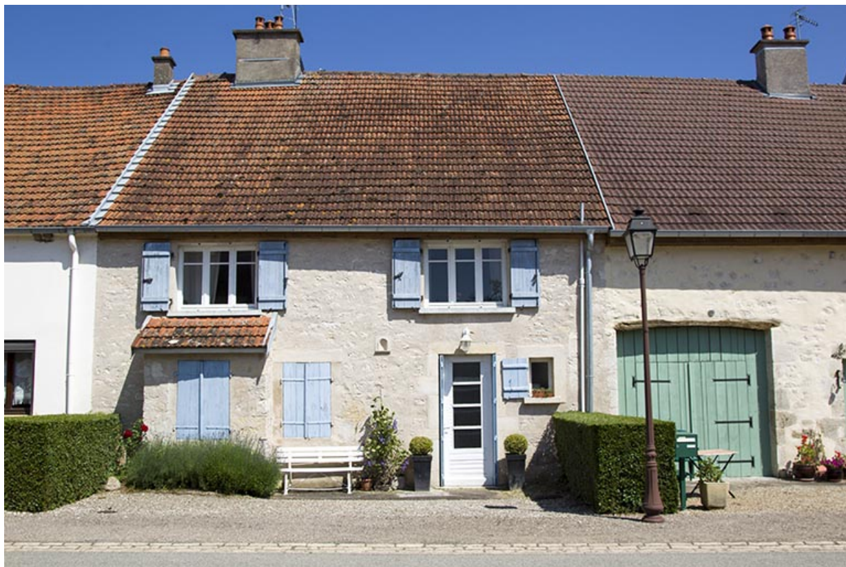
Maison au 43 Grande Rue.