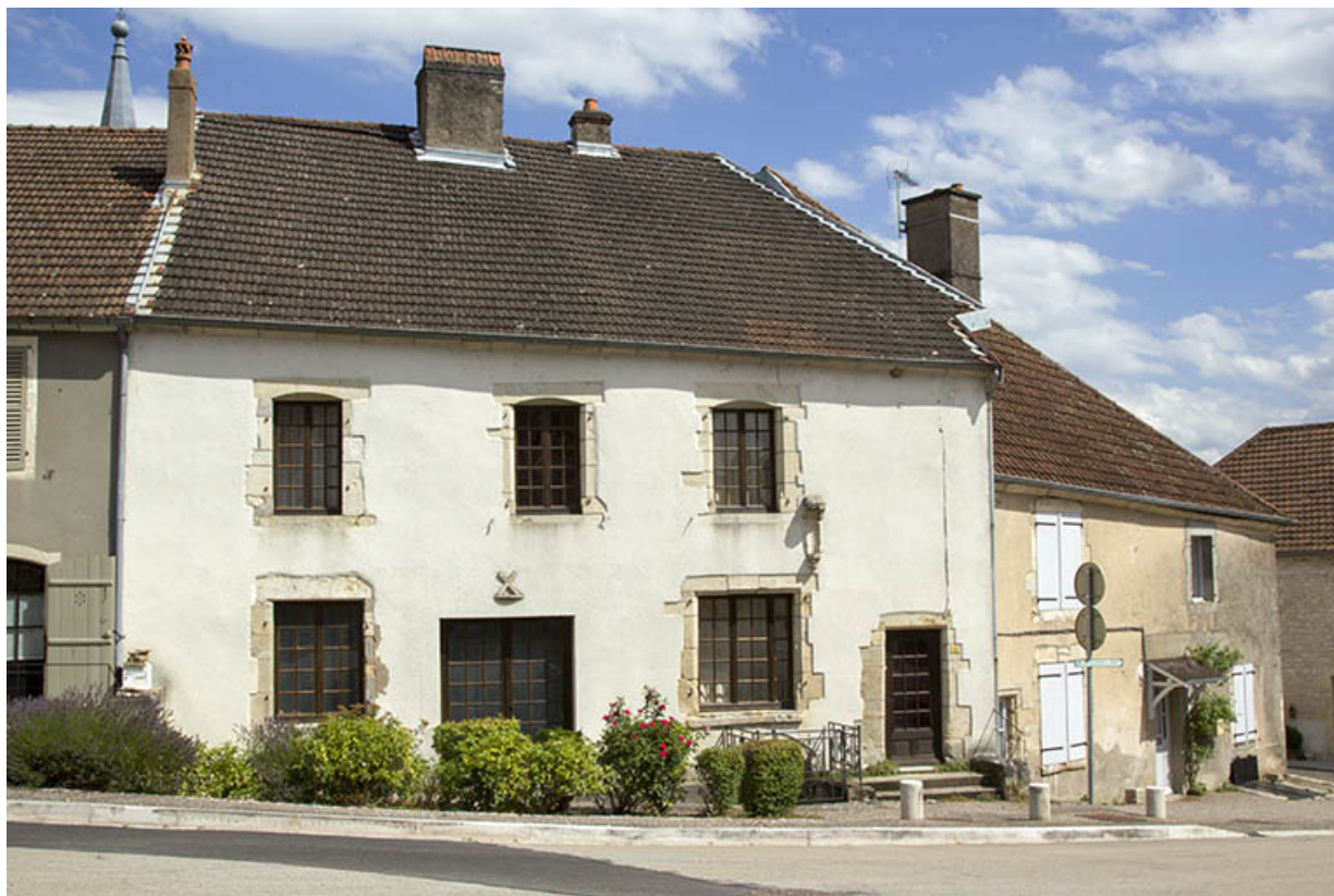
Maison 2 place Gabrielle de Salvete.