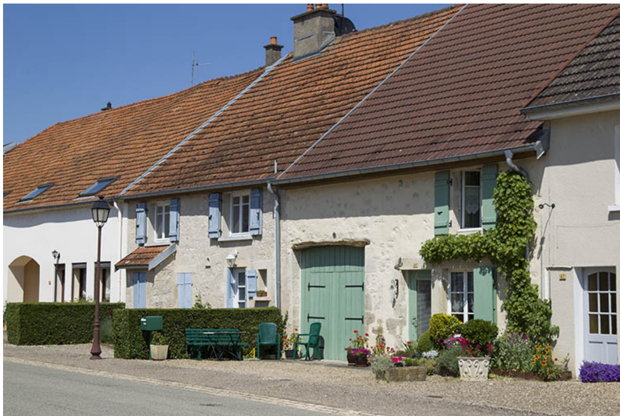
Exemple de fermes et maison situées "au bas du village", dans la Grande Rue. 70, Ray-sur-Saône