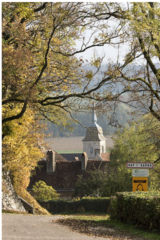
Le clocher depuis la rue du Château. 70, Ray-sur-Saône