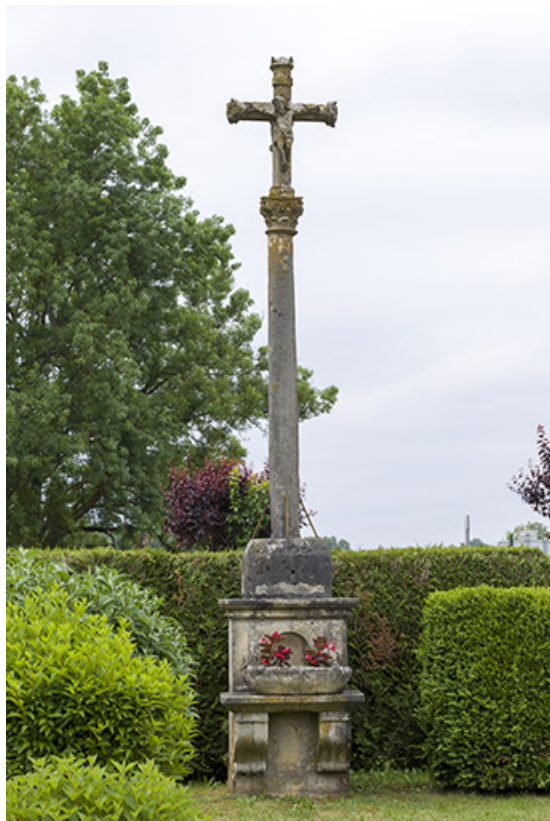
Vue d'ensemble. 70, Ray-sur-Saône