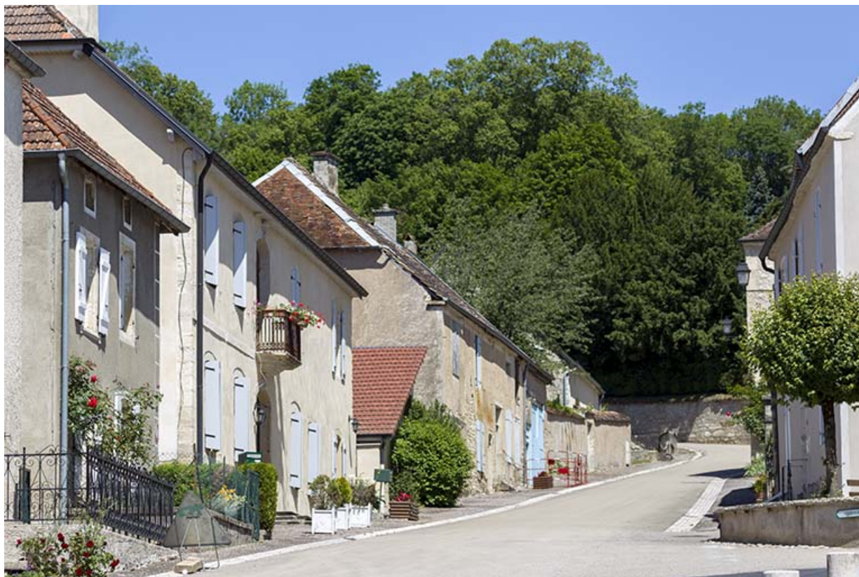
Vue partielle du haut de la rue du Château depuis la place Gabrielle de Salvete. 70, Ray-sur-Saône