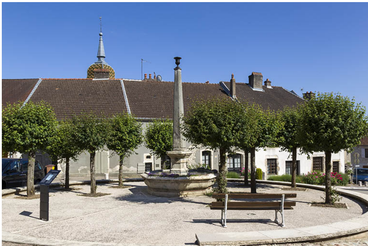
Vue de la fontaine et de la place Gabrielle de Salvete.

70, Ray-sur-Saône place Gabrielle de Salvete