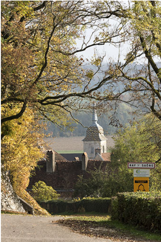
Le clocher depuis la rue du Château. 70, Ray-sur-Saône