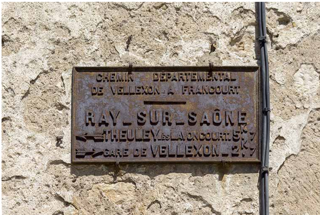
Plaque signalétique en fonte apposée sur la maison à l'angle de la Grande Rue et de la rue Sainte-Anne : CHEMIN DEPARTEMENTAL / DE VELLEUXON A FRANCCOURT / RAY-SUR-SAONE / THEULEY LES LAVONCOURT 5K7 / GARE DE VELLEUXON 2K7.