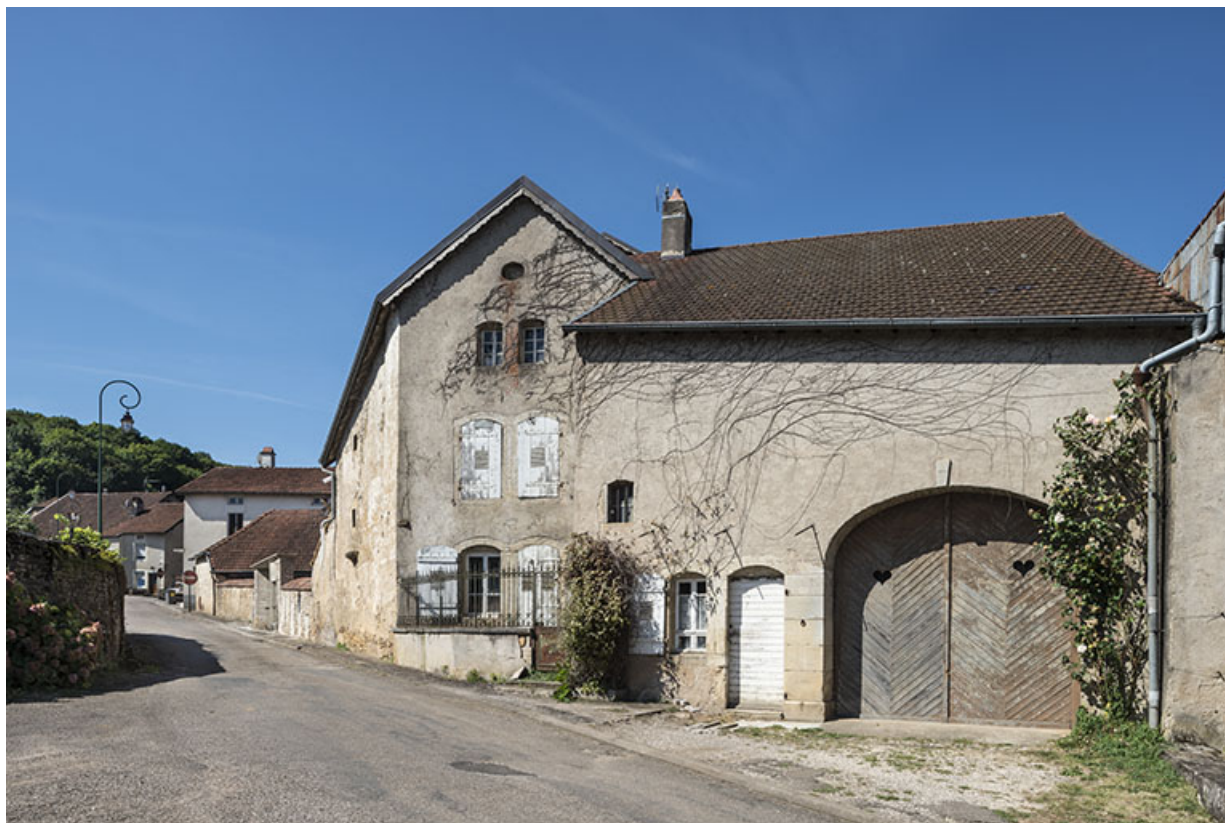
Vue depuis le bas de la rue.