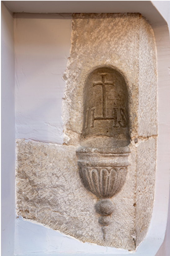
Bénitier taillé dans le calcaire de l'encadrement d'une fenêtre, premier étage. 70, Purgerot rue de la Fontaine carrée