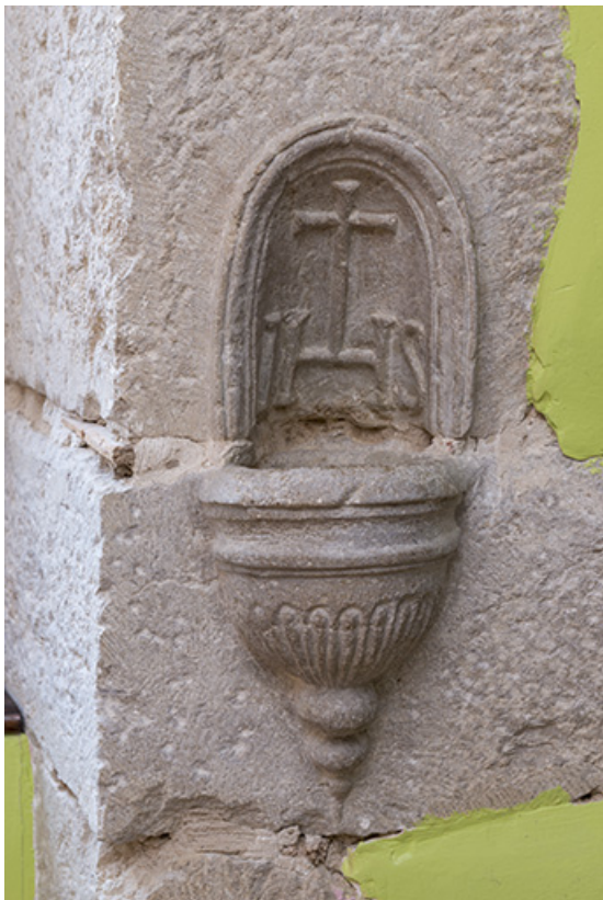
Bénitier taillé dans le calcaire de l'encadrement d'une fenêtre, premier étage (dans une autre chambre). 70, Purgerot rue de la Fontaine carrée