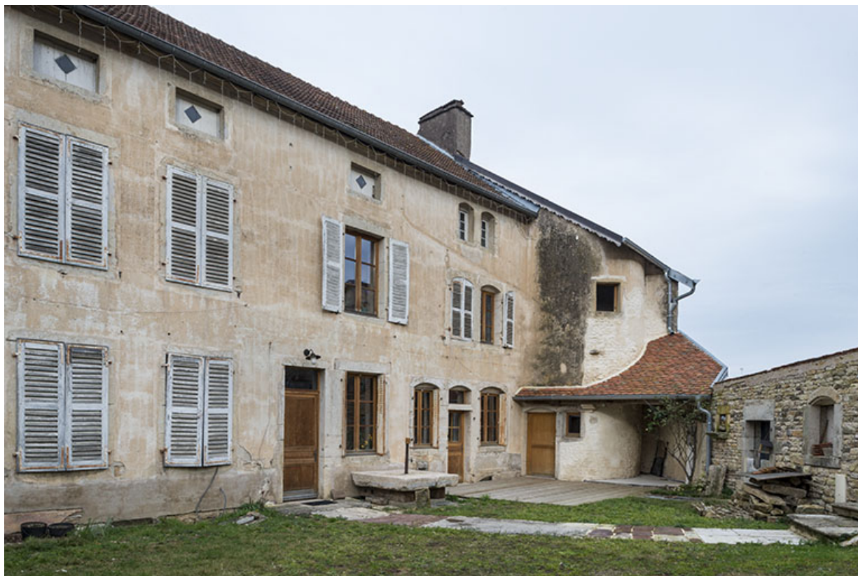
La façade antérieure depuis la cour.