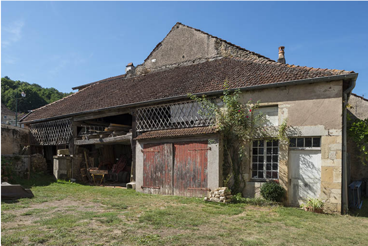
La remise et le four à pain.