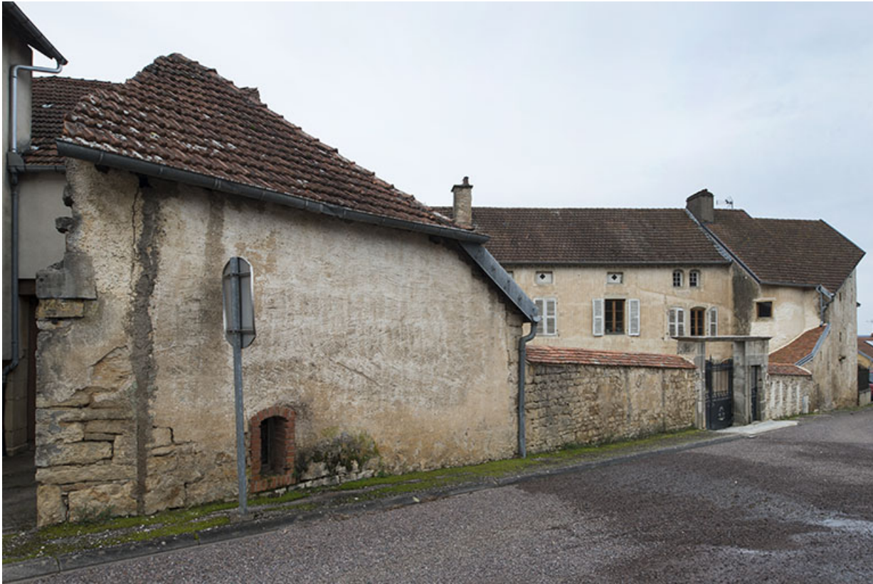
Vue depuis le haut de la rue de la Fontaine carré.