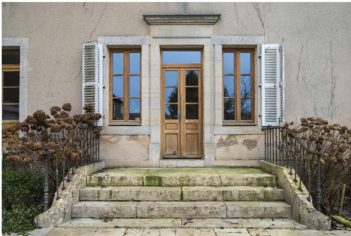
Détail de la façade postérieure.