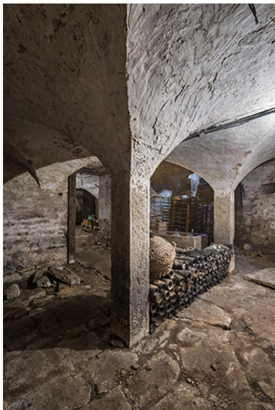
Détail d'une colonne supportant les voûtes. 70, Purgerot rue de la Fontaine carrée