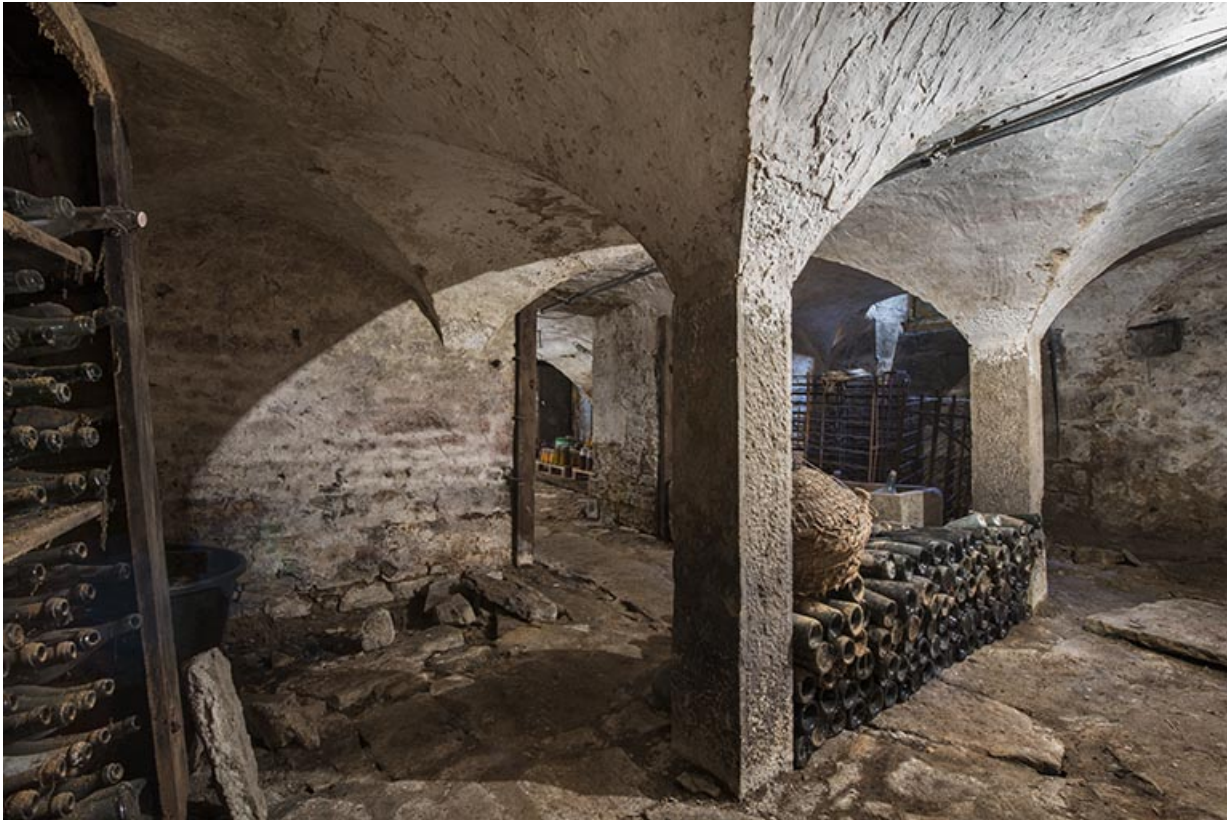
La cave, partie voûtée sur colonnes. 70, Purgerot rue de la Fontaine carrée