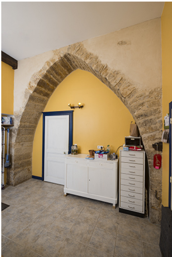
Voûte en tiers-point, arrière cuisine. 70, Purgerot rue de la Fontaine carrée