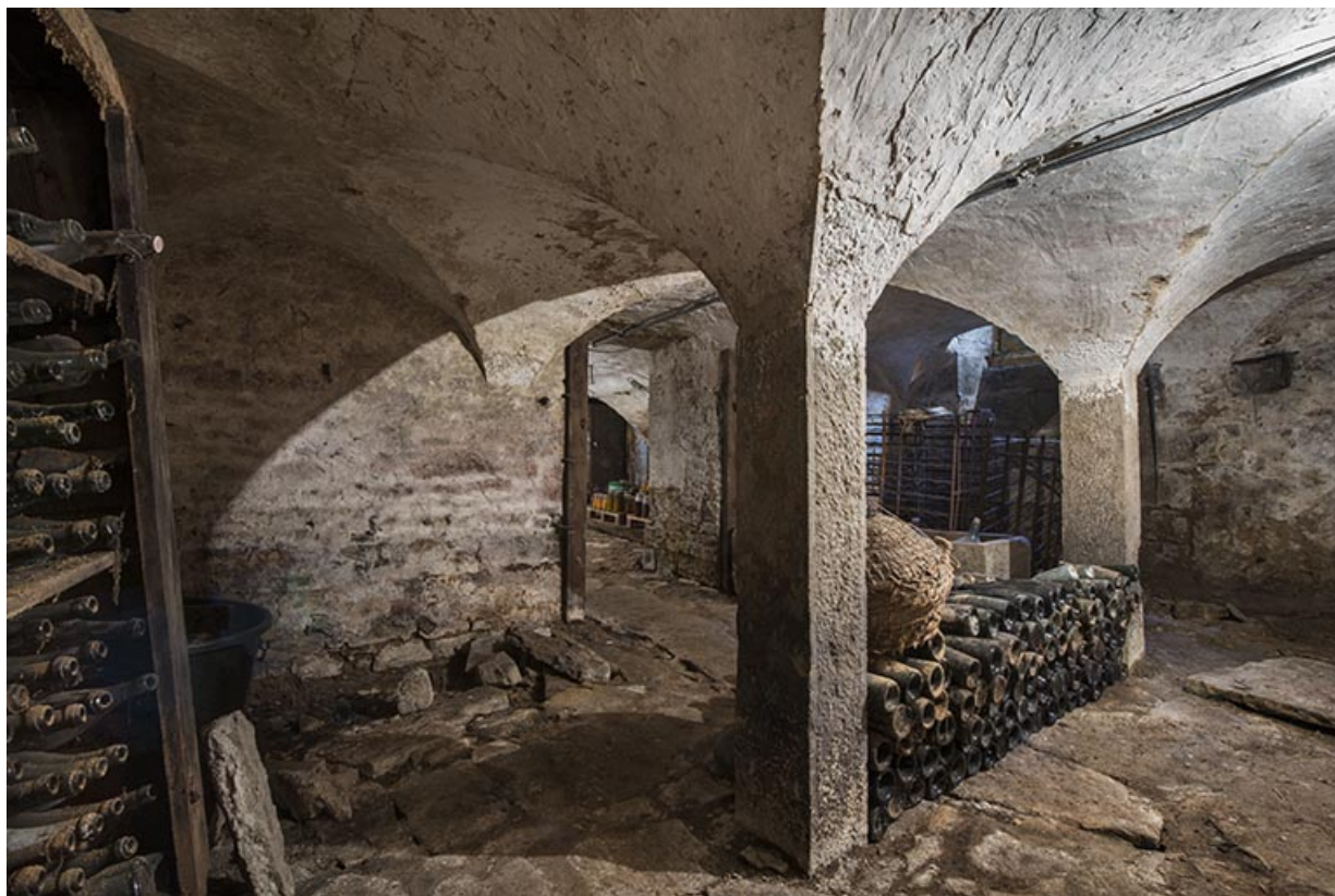
La cave, partie voûtée sur colonnes. 70, Purgerot rue de la Fontaine carrée