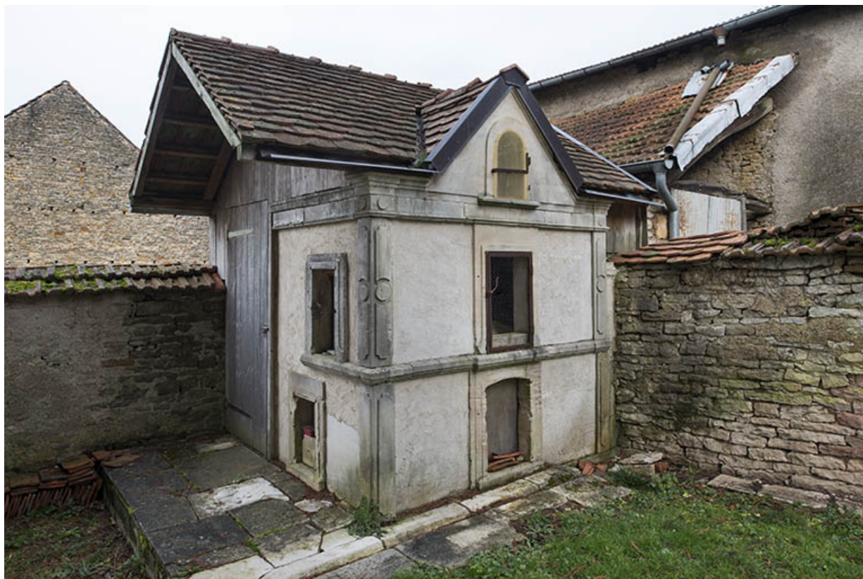
Petit édifice dans le jardin (ayant pu servir de pigeonnier).