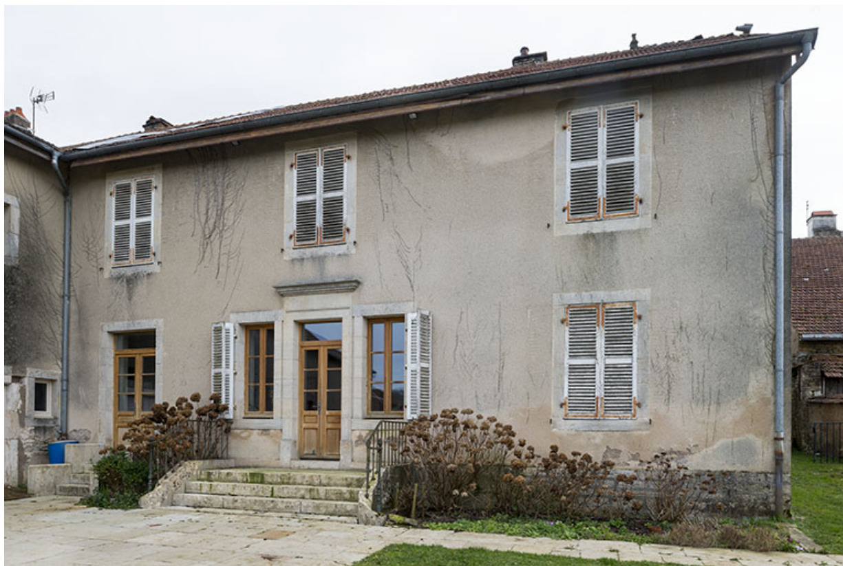
Façade postérieure, vue générale.