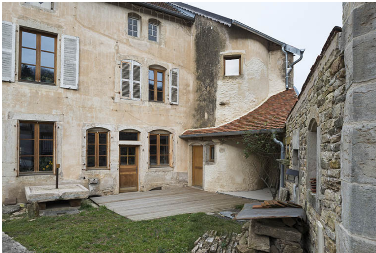
La tour d'escalier, vue extérieure.