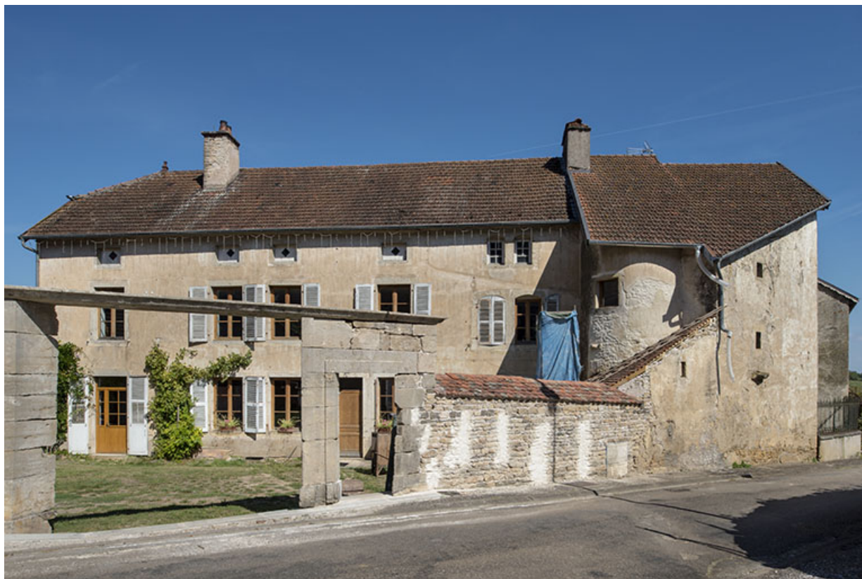
La façade antérieure depuis la rue.