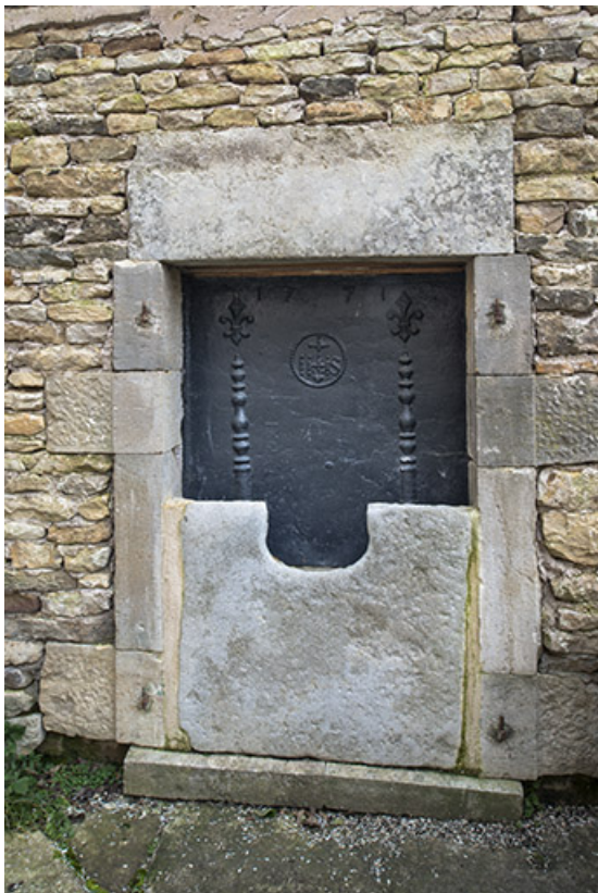
Une des deux planques de cheminée de la demeure entreposée dans la cour. 70, Purgerot rue de la Fontaine carrée