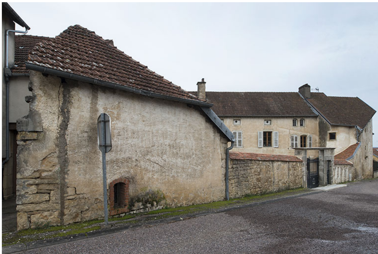
Vue depuis le haut de la rue de la Fontaine carré.