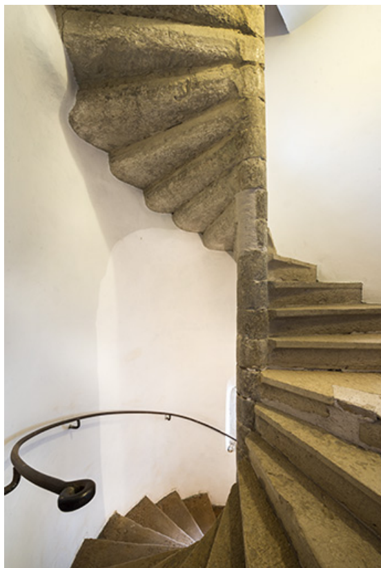
L'escalier à vis dans la tour.