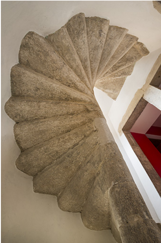
Vue en contre-plongée de l'escalier. 70, Purgerot rue de la Fontaine carrée