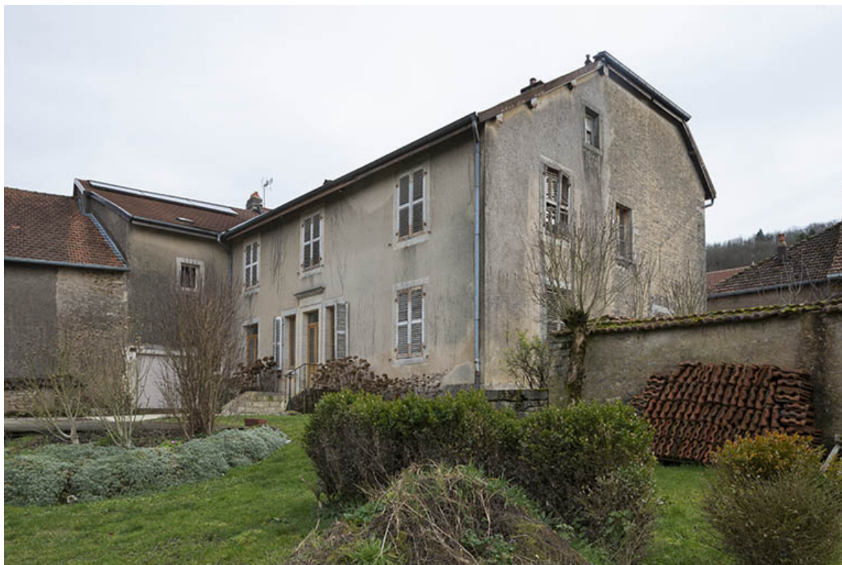
Vue de trois-quart depuis le jardin.