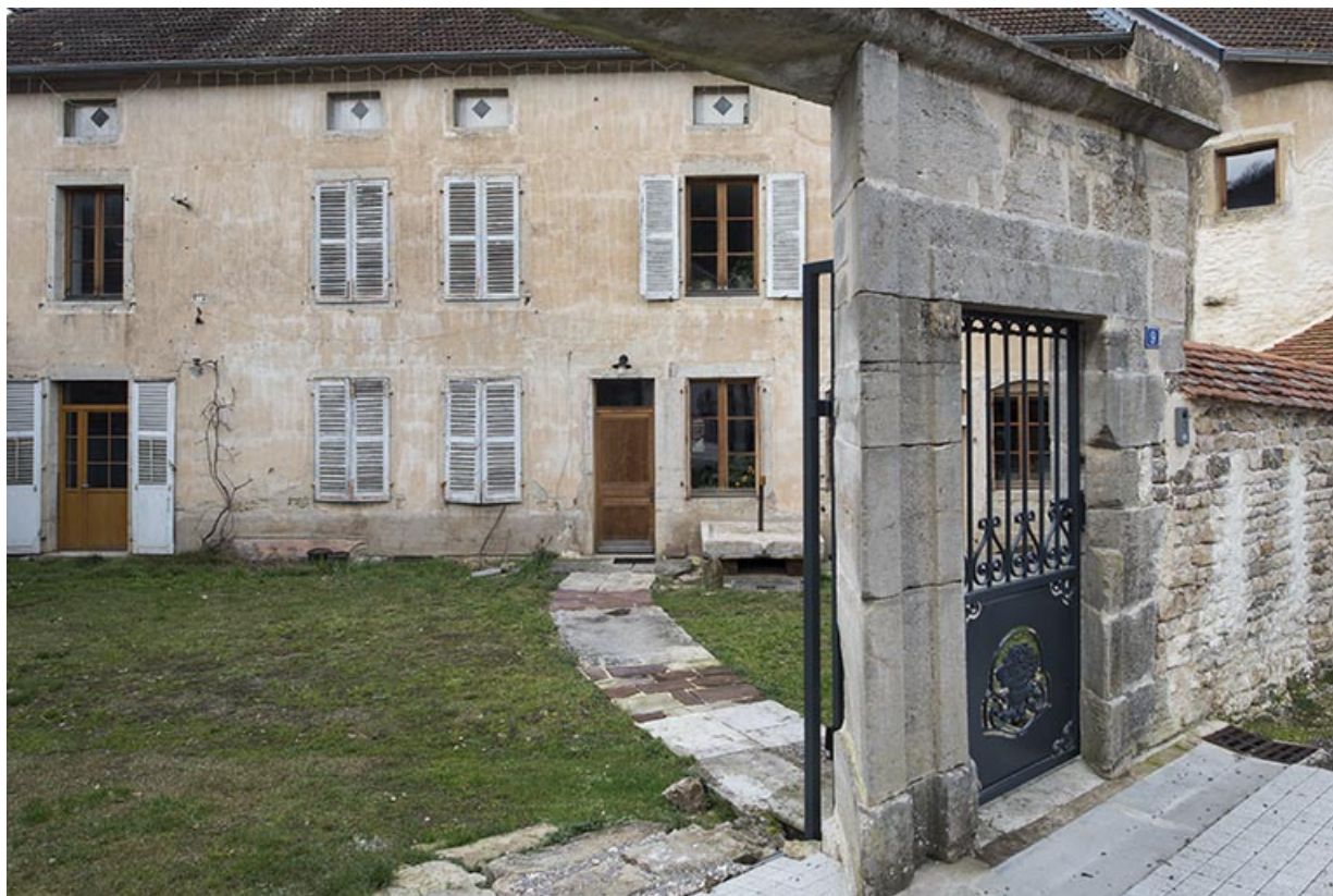
La façade antérieure et une partie du portail. 70, Purgerot rue de la Fontaine carrée