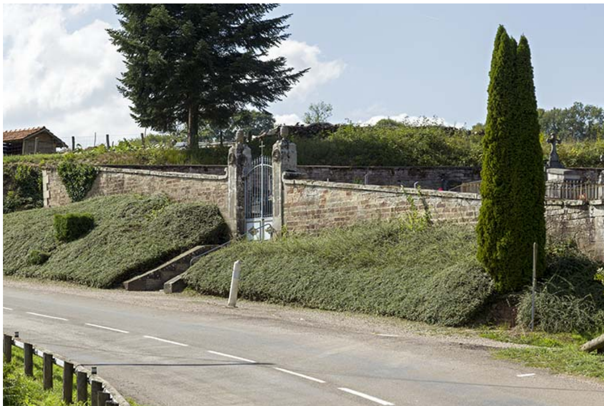
Le cimetière d'Ambiévillers.