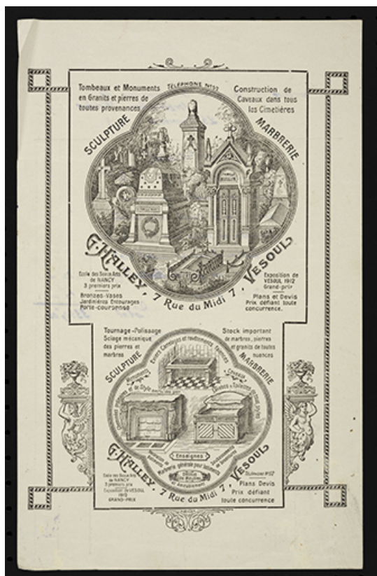
Catalogue proposant des modèles de monument aux morts. 70, Ambiévillers