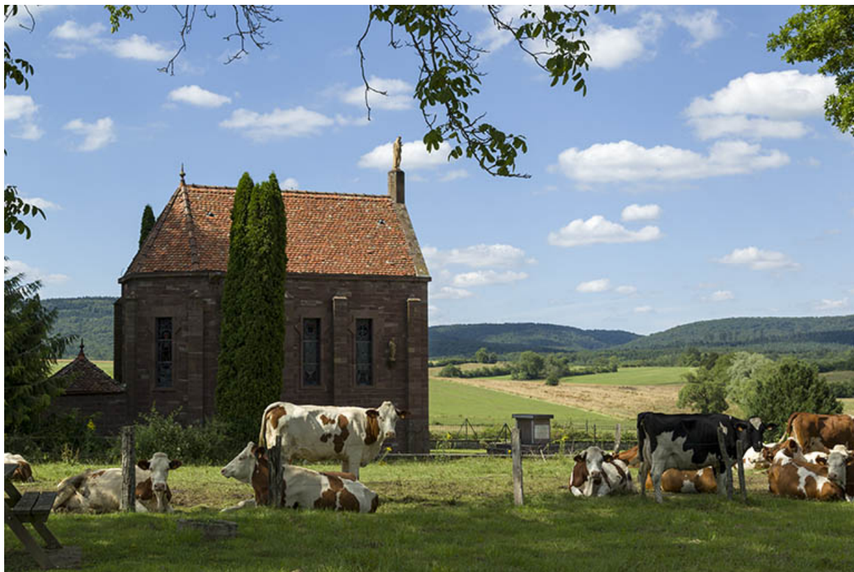
La chapelle des Martyrs. 70, Ambiévillers