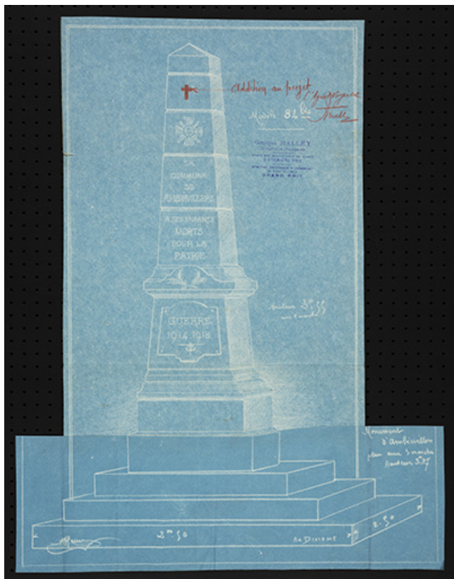
Projet de construction du monument aux morts. 70, Ambiévillers