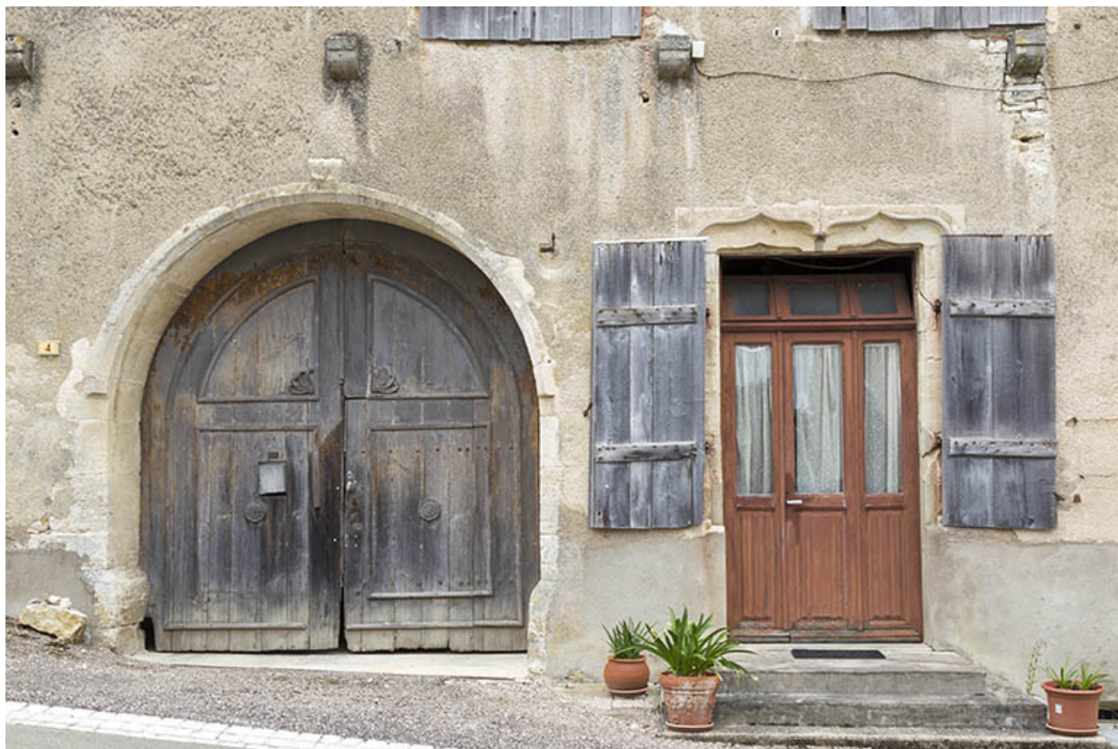
Façade antérieure : porte cochère et baie modifiée avec linteau en accolade. 70, Ray-sur-Saône, 6 rue du Château