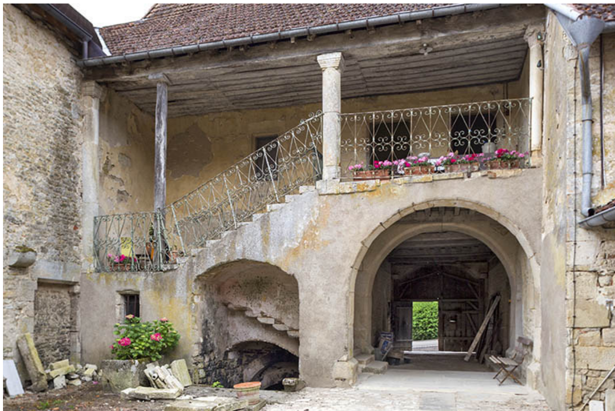
Demeure dite le Chapitre au 6 rue du Château, façade sur cour. 70, Ray-sur-Saône, 6 rue du Château