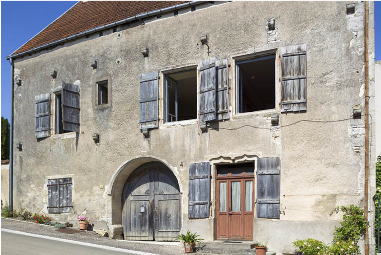
Demeure remarquable (dite du Chapitre), au 6 rue du Château, classée au titre des Monuments historiques. 70, Ray-sur-Saône, 6 rue du Château