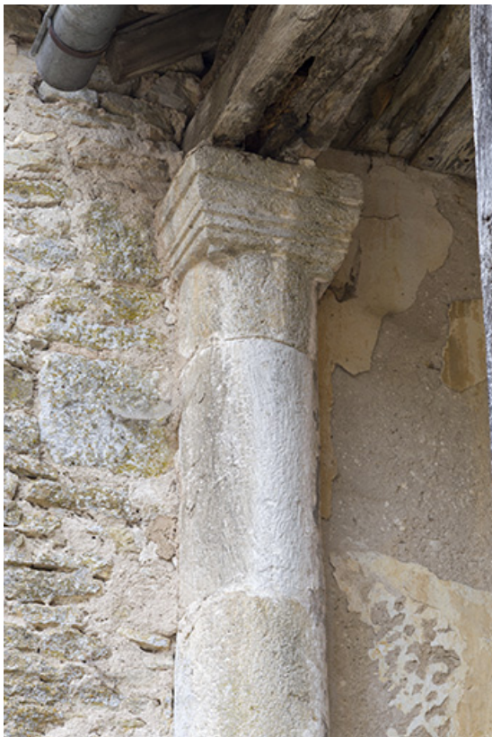
Colonne adossée au mur du premier palier.