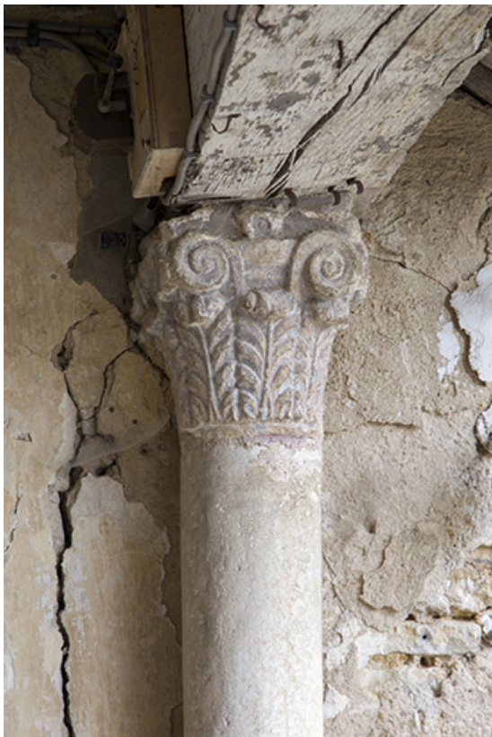
Colonne adossée au mur du deuxième palier.