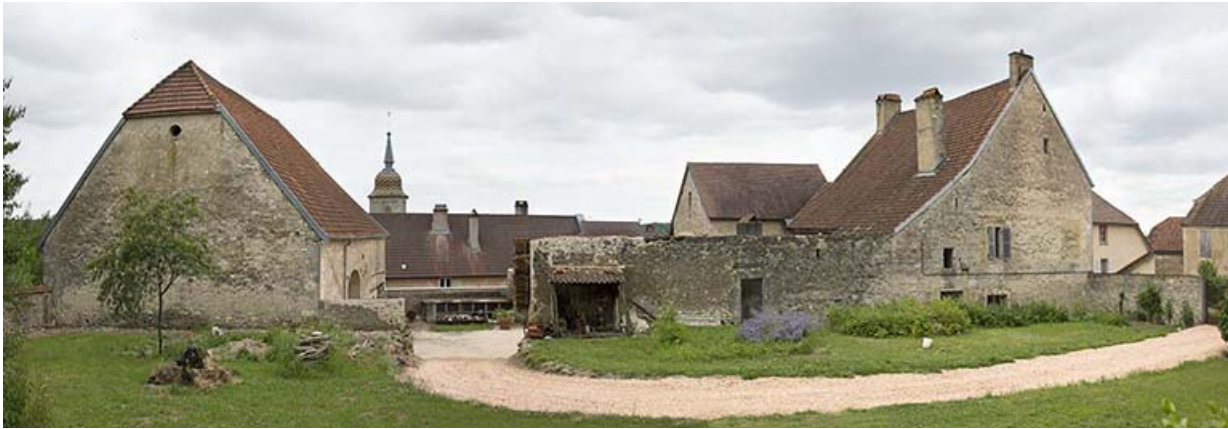
Vue générale des bâtiments autour de la cour : grange à gauche et demeure à droite.