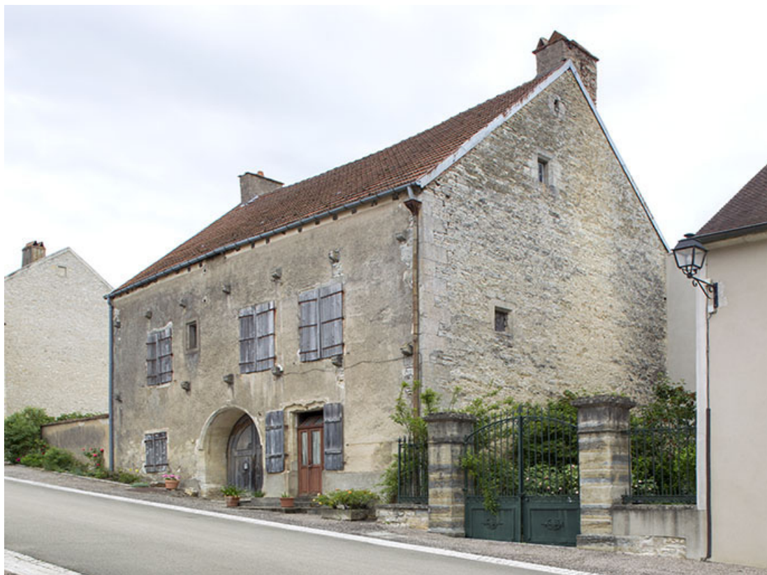
Demeure dite le Chapitre au 6 rue du Château.