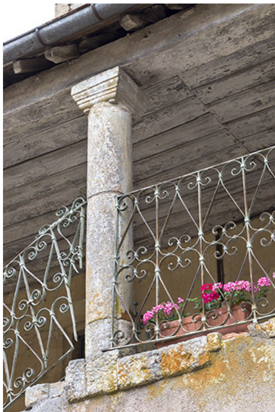
Colonne centrale du deuxième palier.