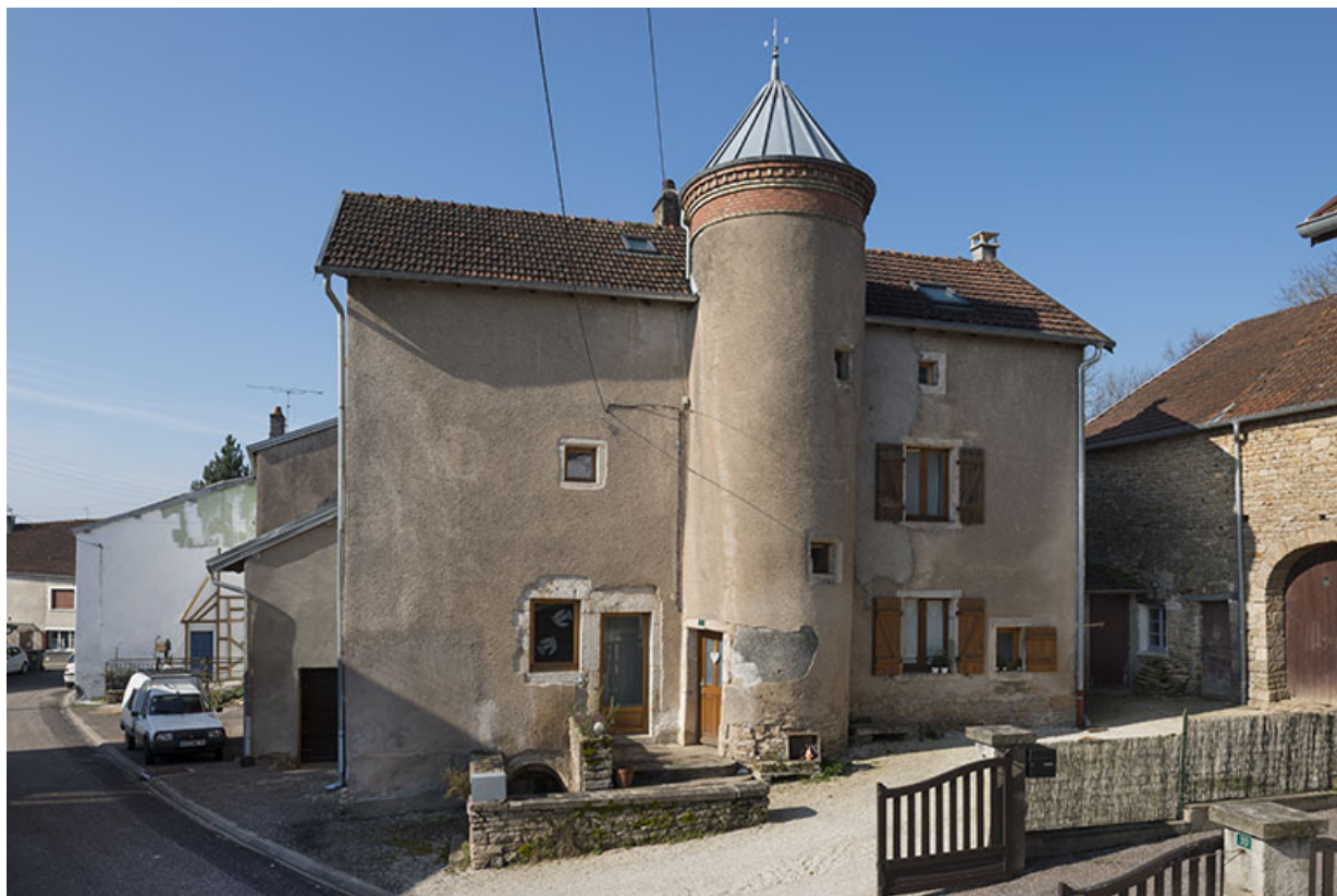
Façade antérieure de la maison.