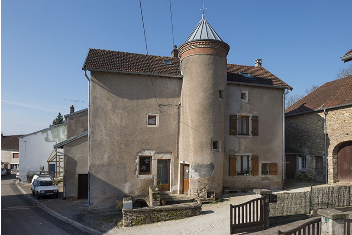
Façade antérieure de la maison.