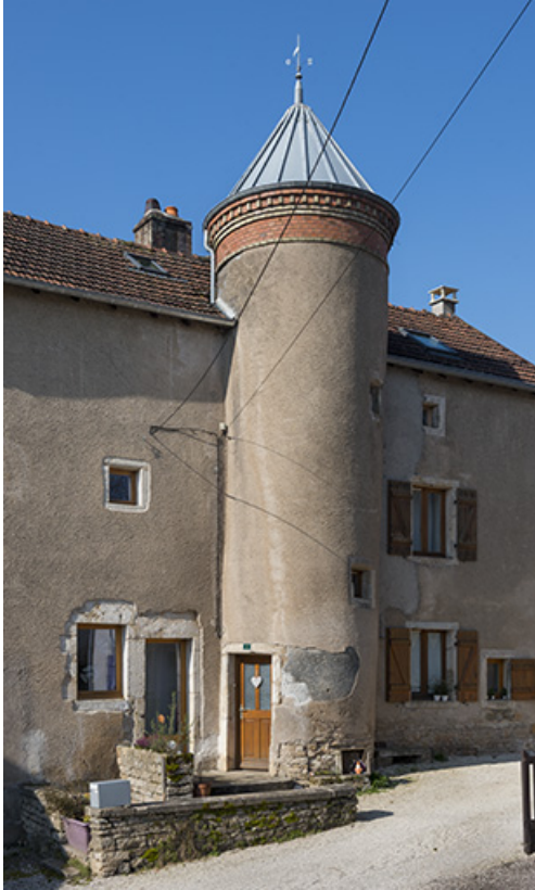
La tour abritant l'escalier.