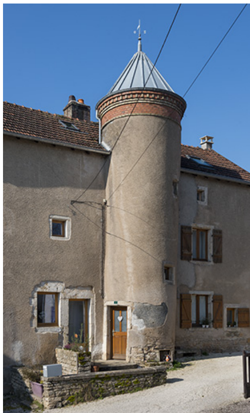
La tour abritant l'escalier.