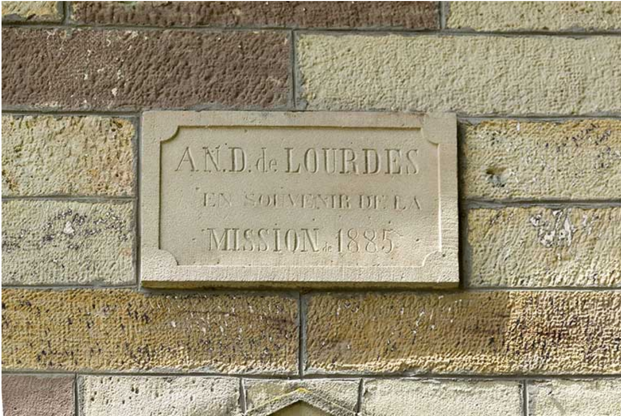
Plaque indiquant l'année de construction de la chapelle.