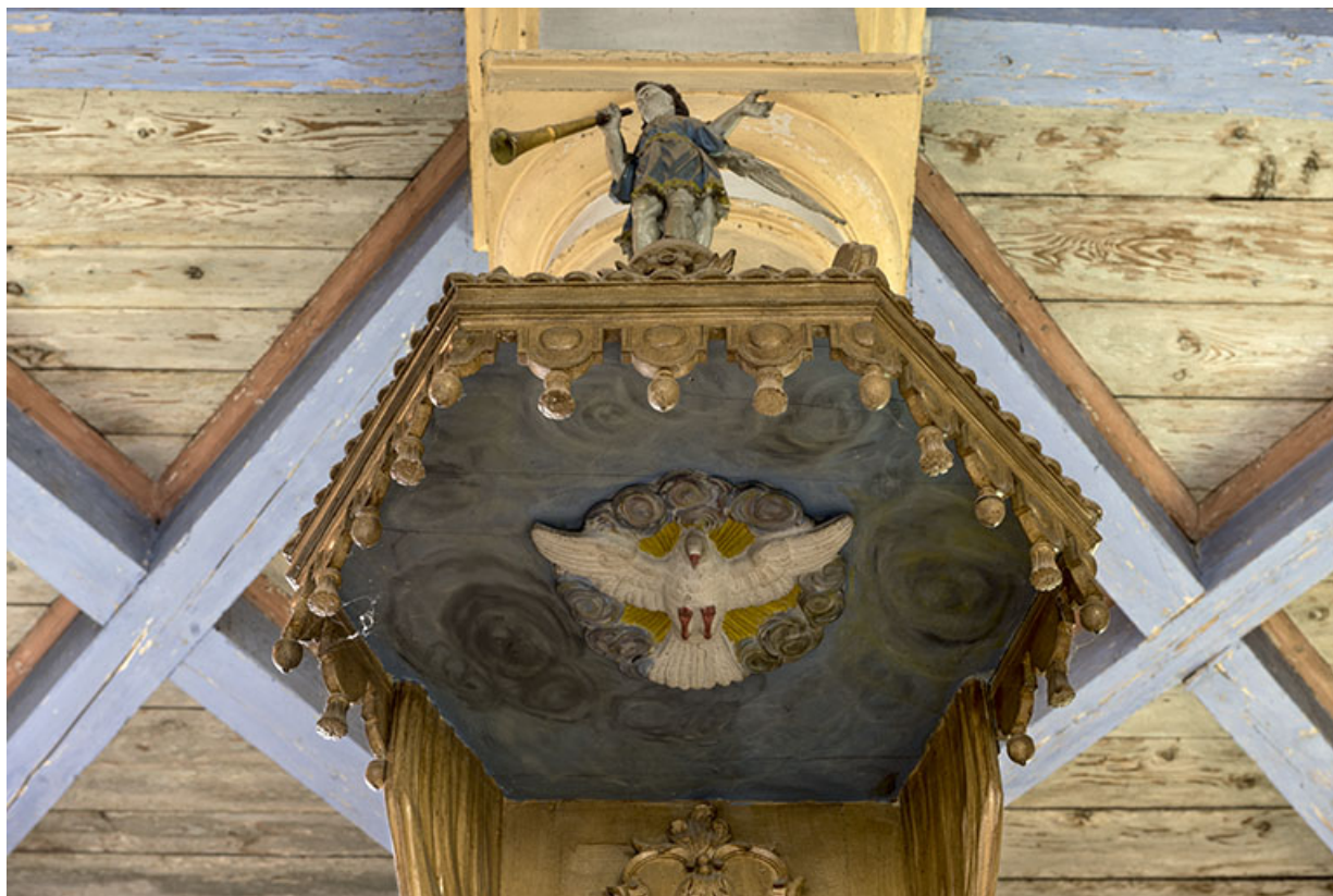
Détail de la chaire.