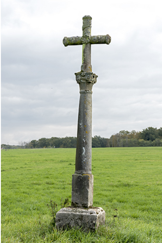
Croix de chemin.