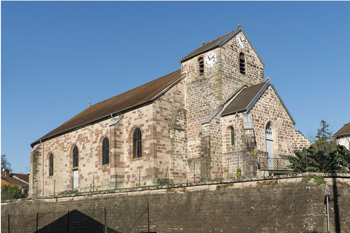
Eglise de l'Assomption.