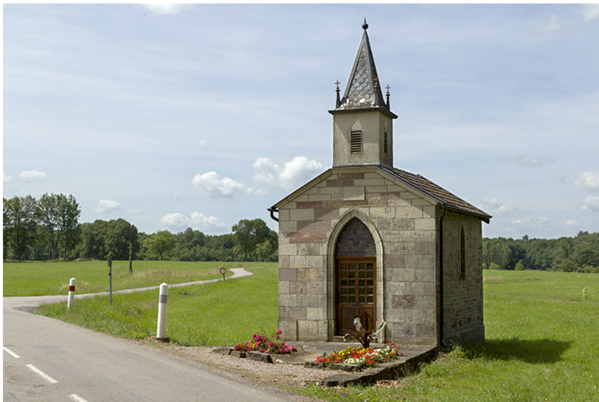
Chapelle Notre-Dame de Lourdes. 70, Selles