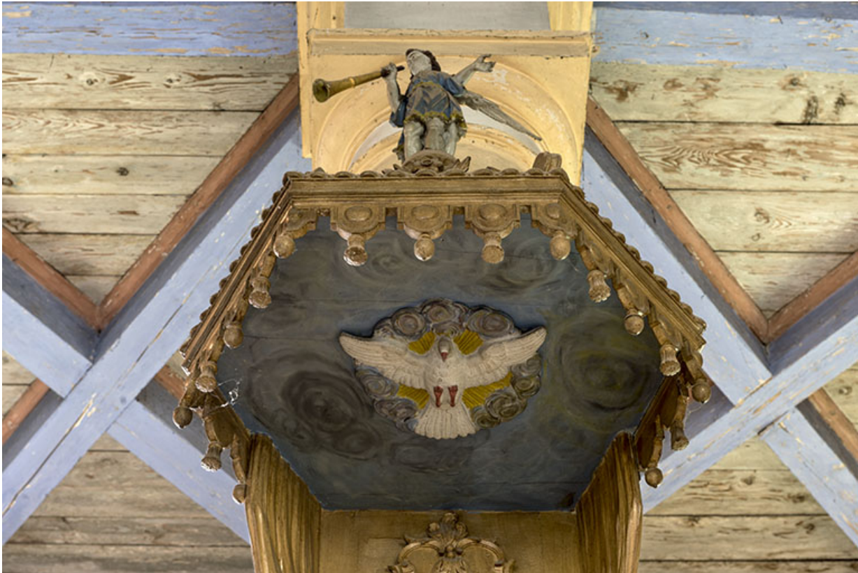
Détail de la chaire.