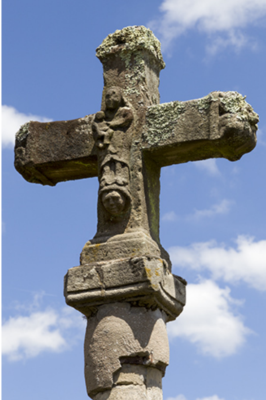
Détail de la croix située rue des Capucines : la Vierge. 70, Selles