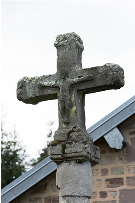
Détail de la croix située rue des Capucines : le Christ. 70, Selles