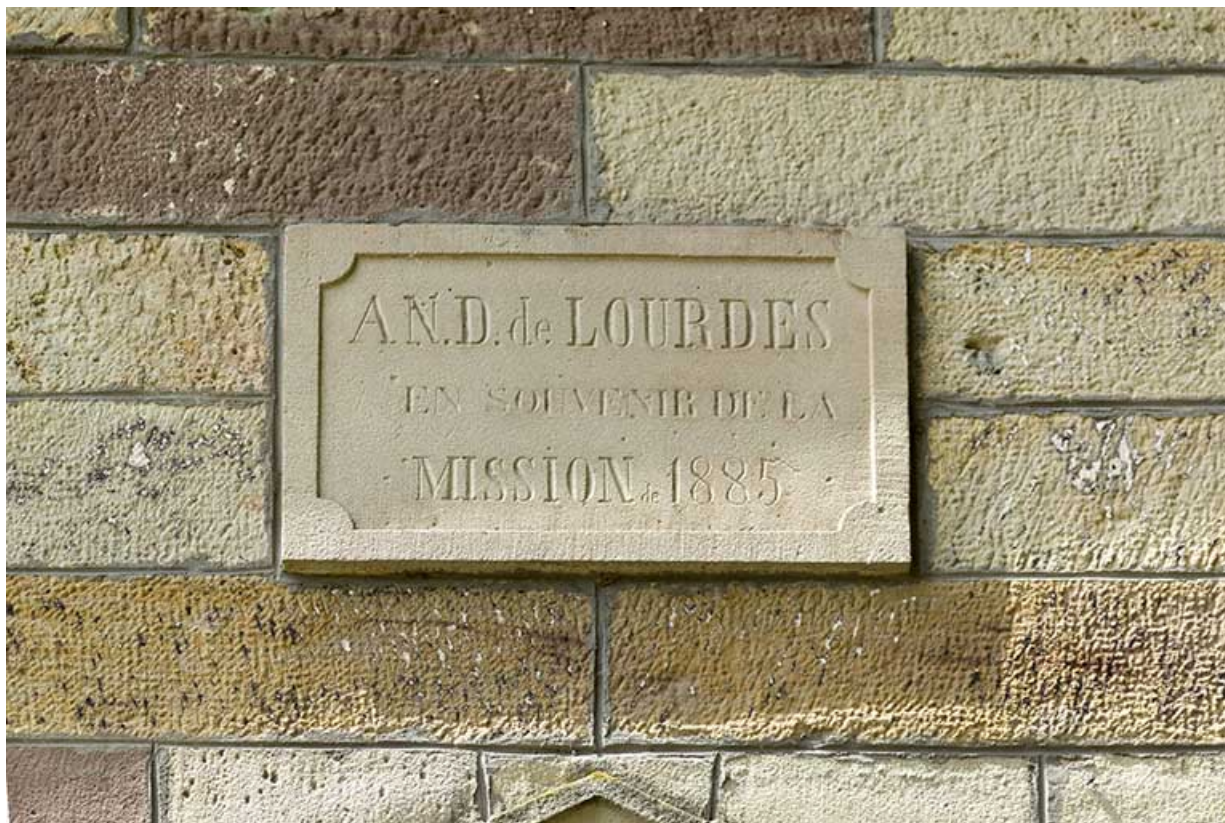
Plaque indiquant l'année de construction de la chapelle.