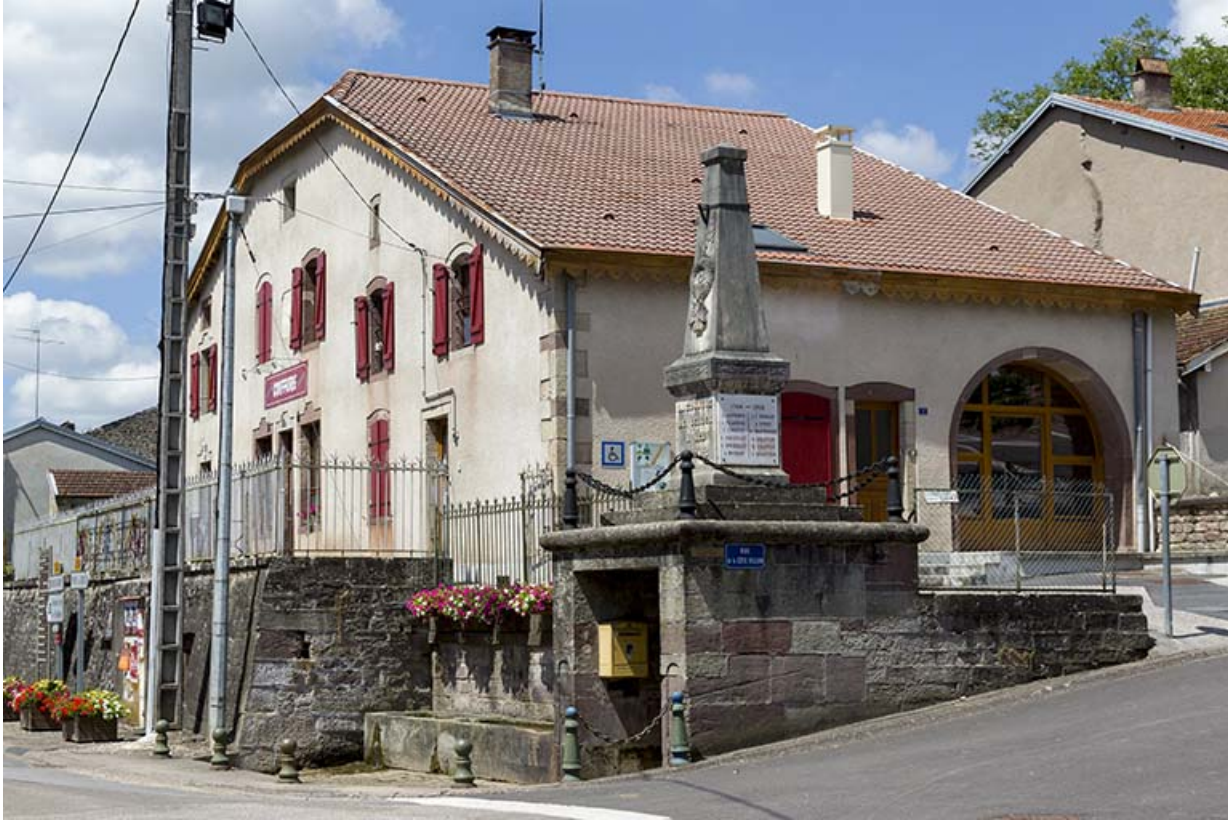
Le monument aux morts.