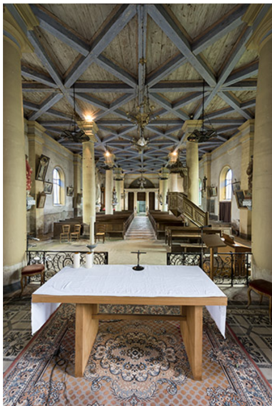
Vue intérieure de l'église de l'Assomption. 70, Selles