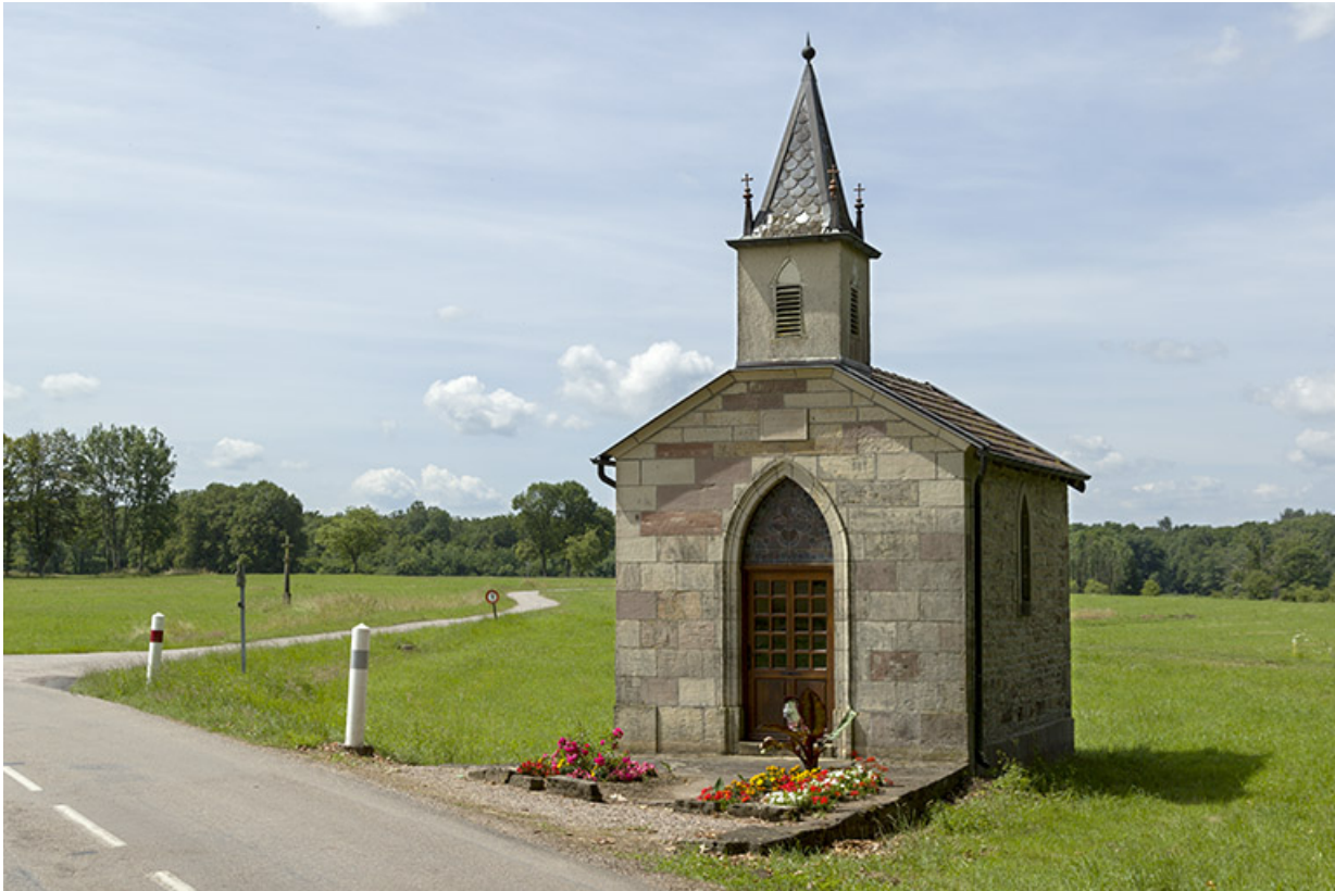
Chapelle Notre-Dame de Lourdes.