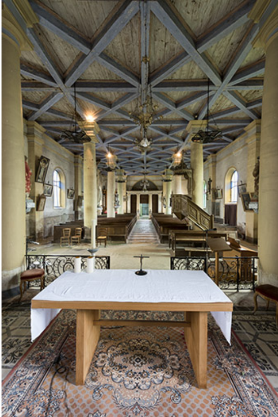
Vue intérieure de l'église de l'Assomption.