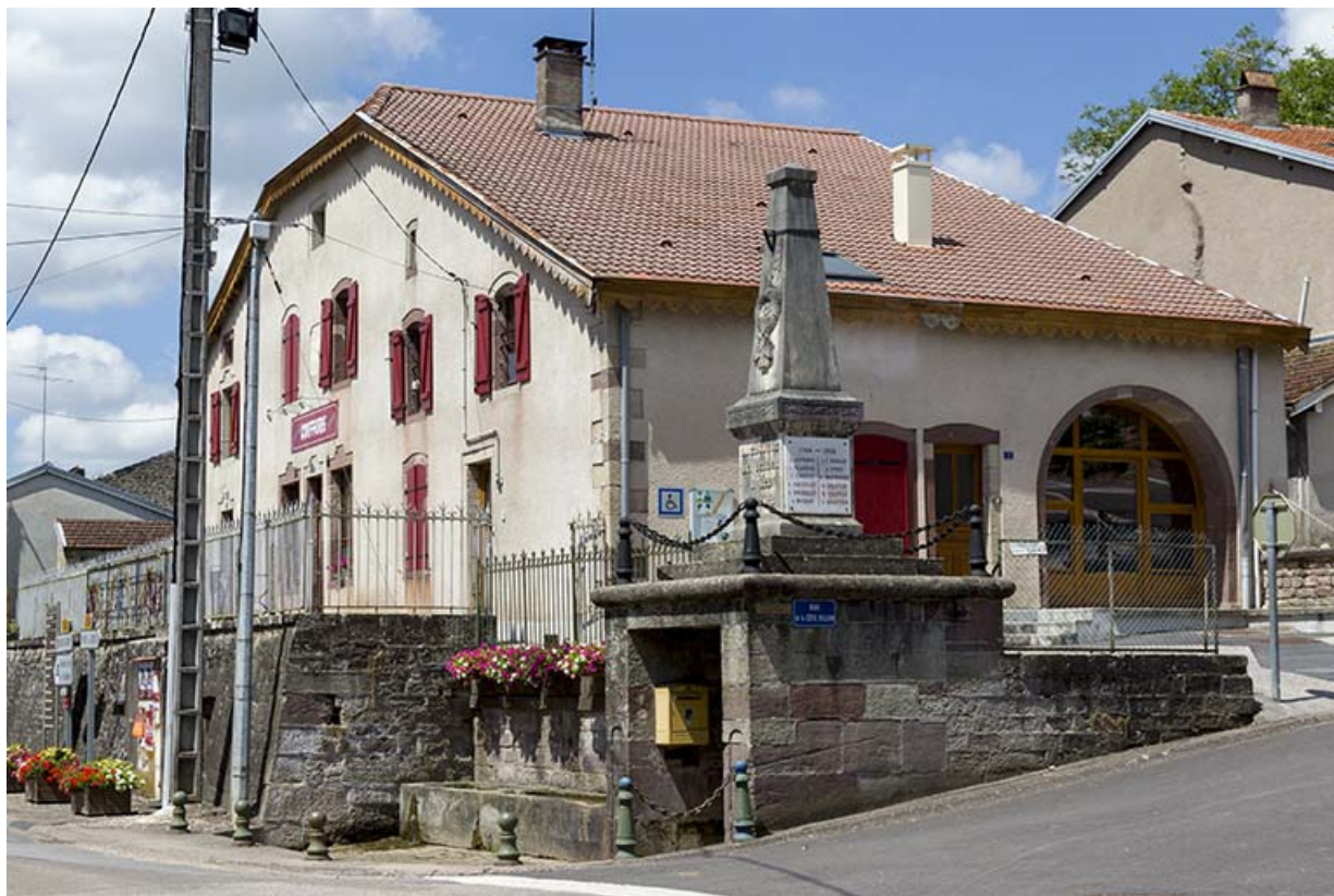
Le monument aux morts.