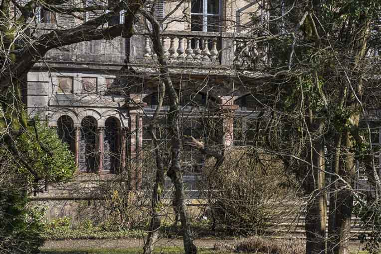
Vue du rez-de-chaussée, façade sud-ouest. 70, Conflandey