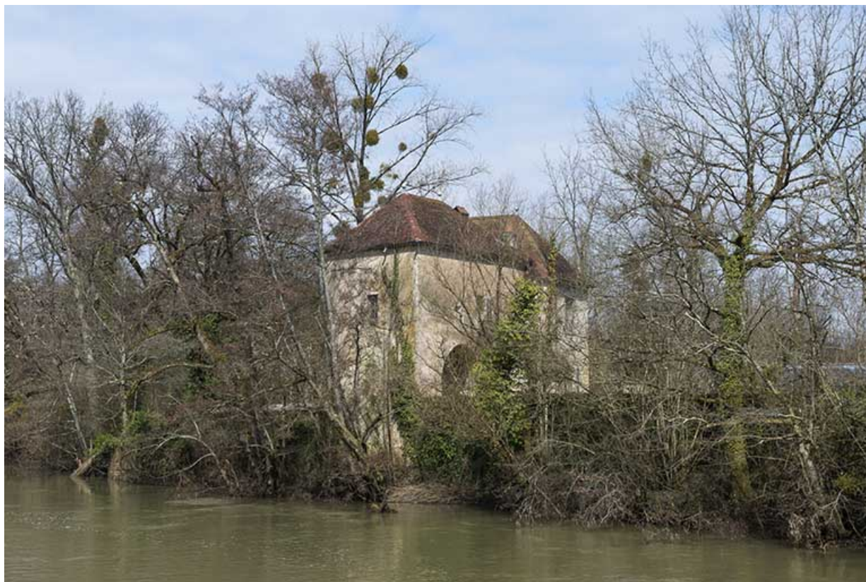
La porte septentrionale.