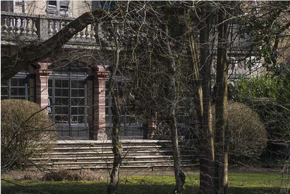
Détail du rez-de-chaussée, façade sud-ouest. 70, Conflandey