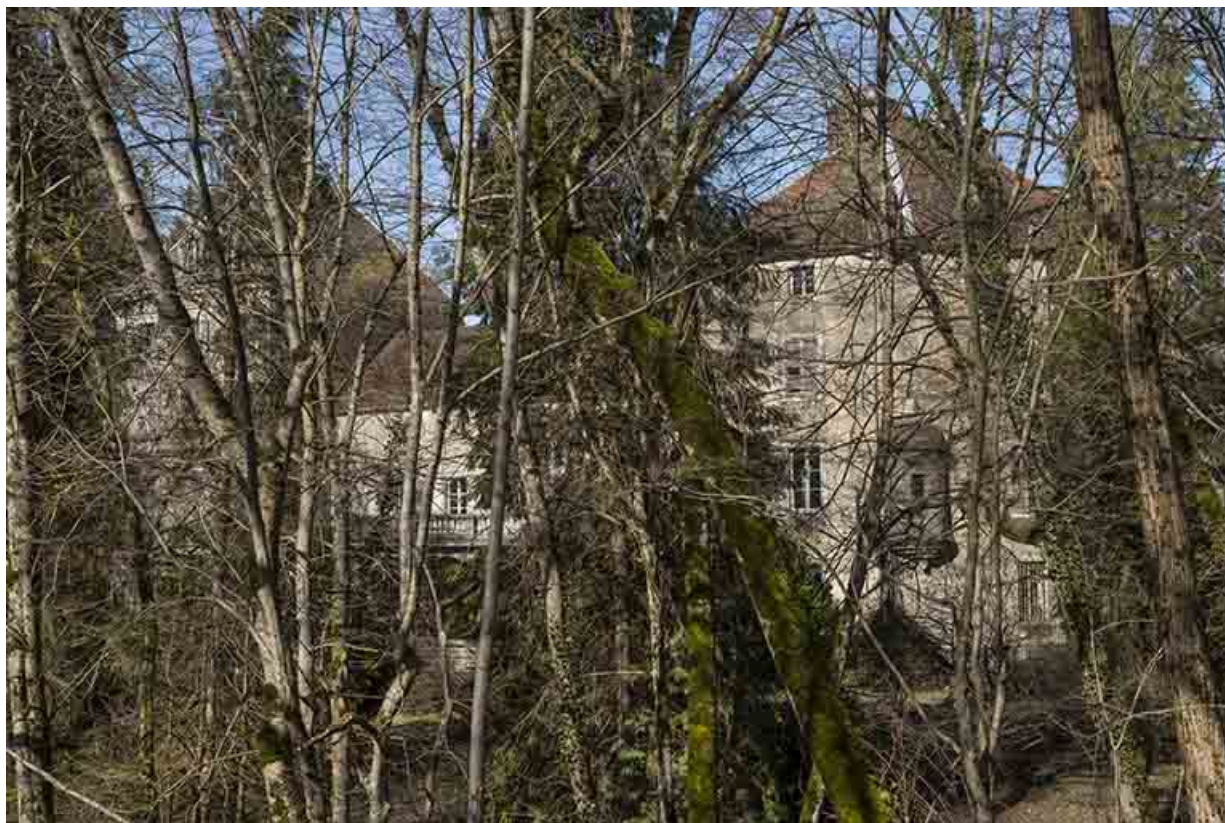
La pavillon oriental et son échauguette, façade sud-ouest. 70, Conflandey