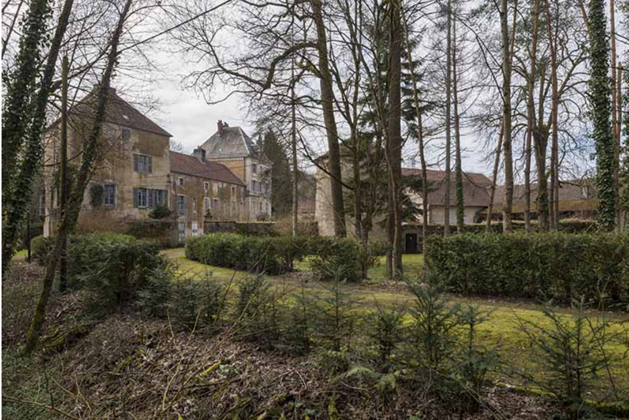
Vue générale depuis le chemin menant à l'usine. 70, Conflandey