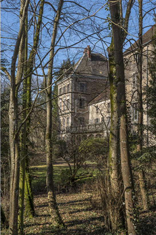
La façade sud-ouest, vue depuis le parc. 70, Conflandey