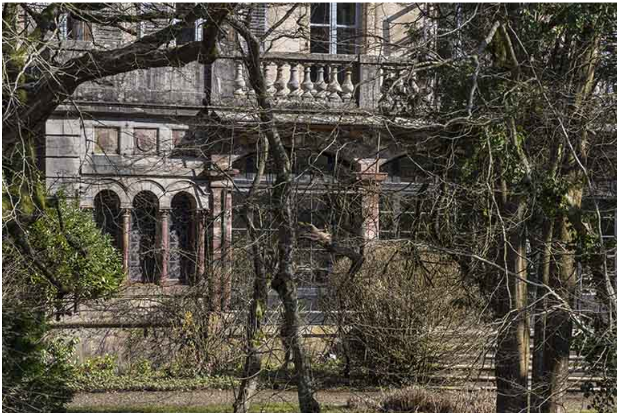
Vue du rez-de-chaussée, façade sud-ouest. 70, Conflandey