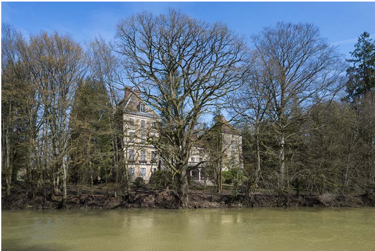
La façade sud-ouest depuis la rue du Moulin rouge.