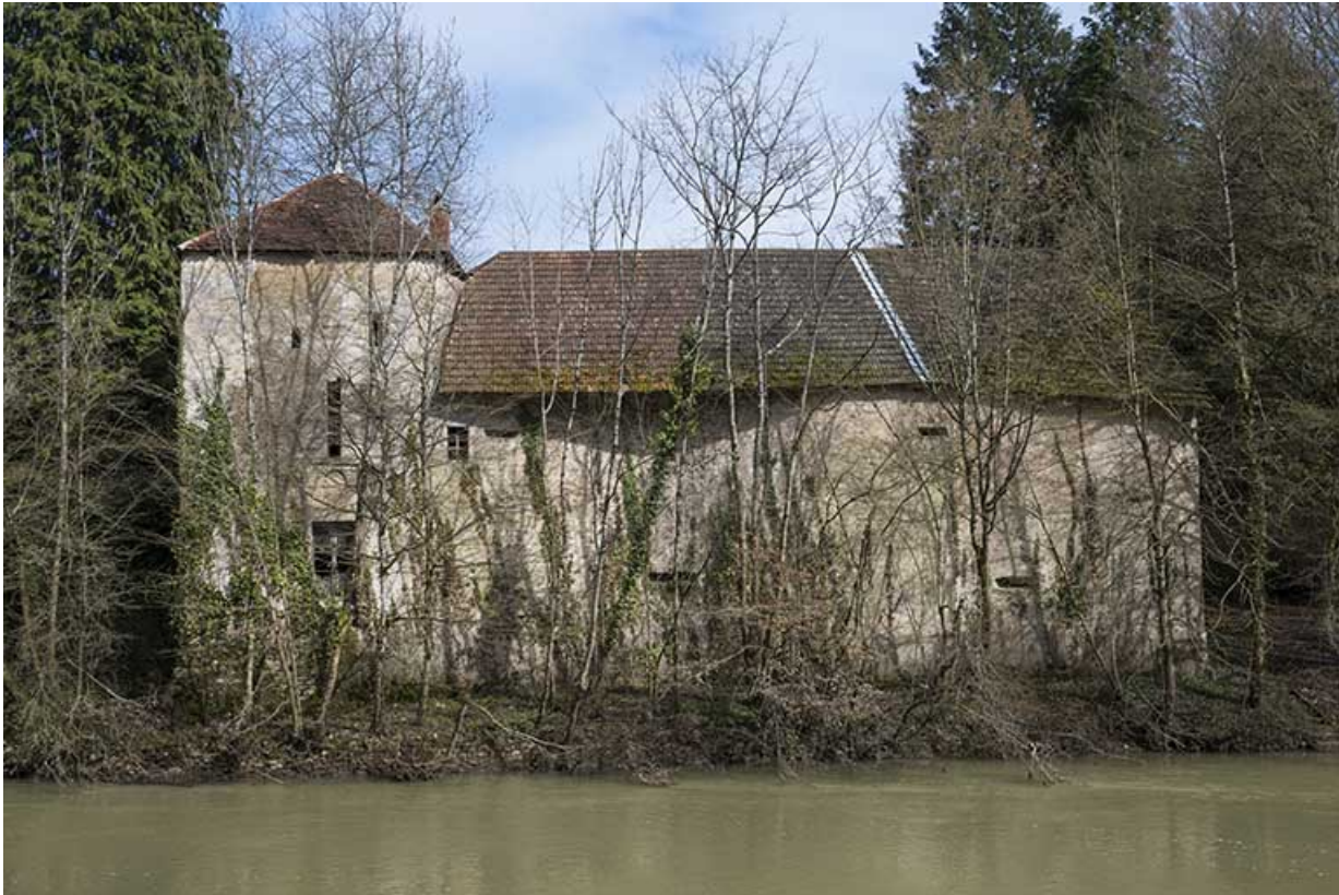
Les communs, vue de détail.