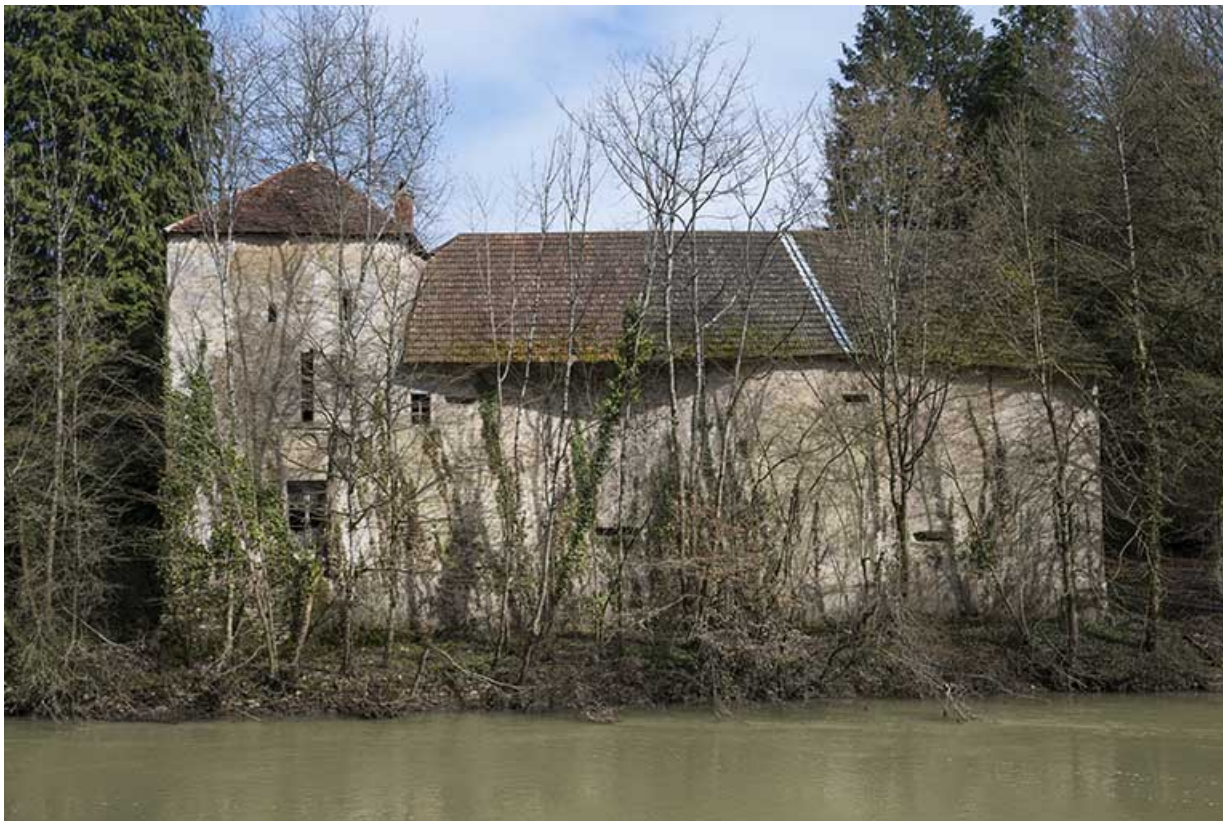
Les communs, vue de détail.