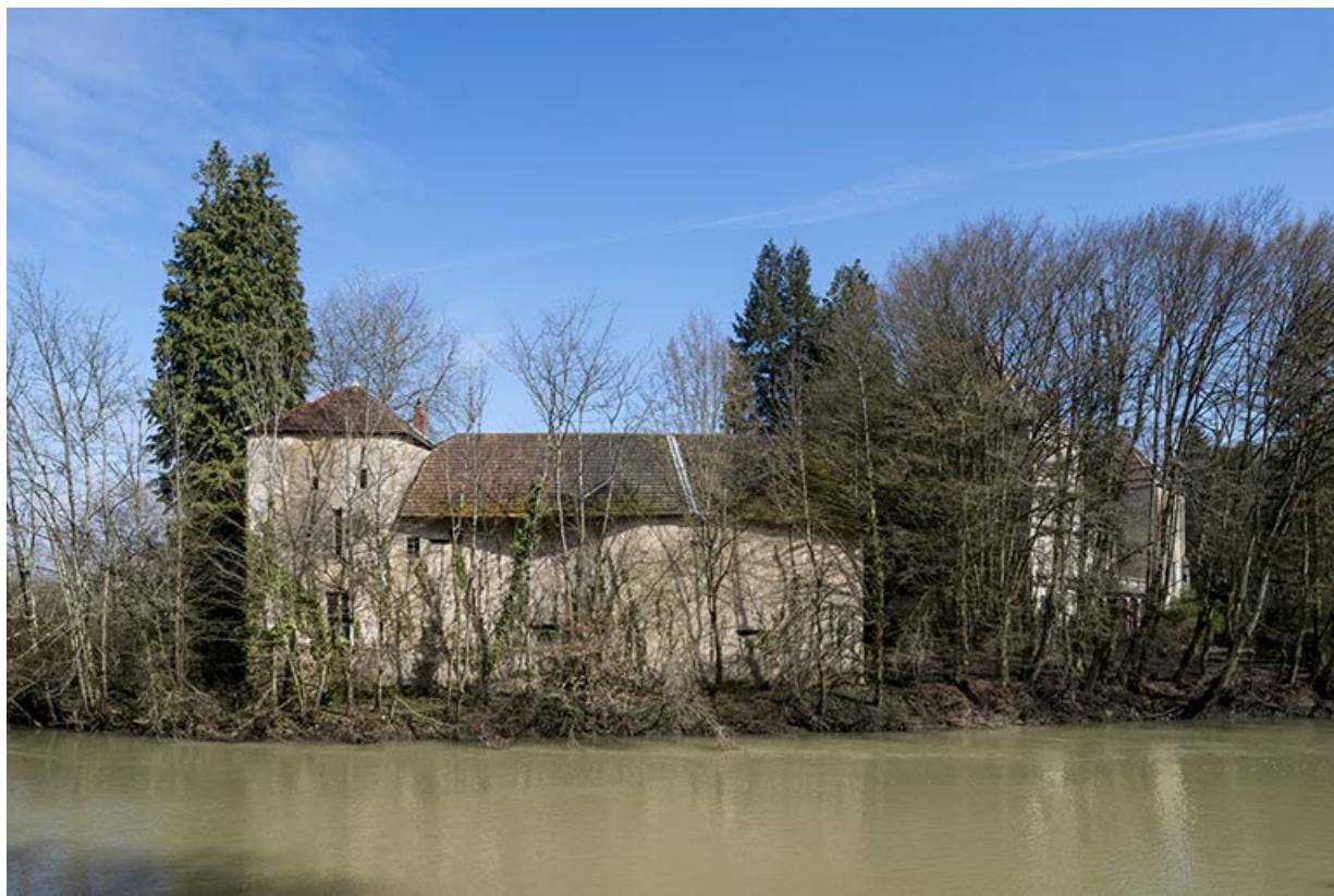
Communs du château, vue depuis la rue du Moulin rouge.