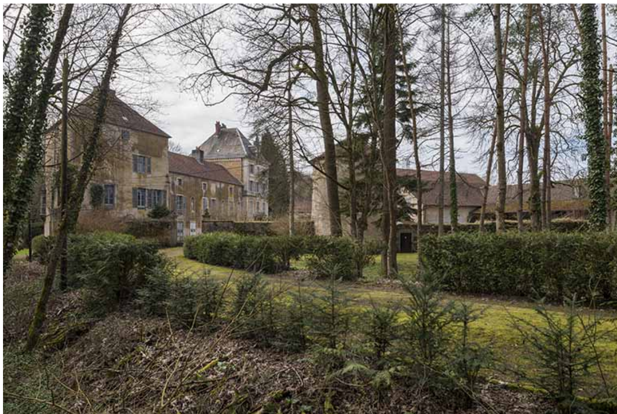
Vue générale depuis le chemin menant à l'usine. 70, Conflandey