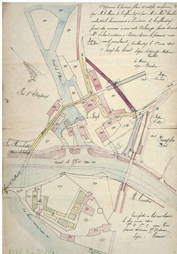
Le château et l'ancienne forge : état des lieux en 1900. 70, Conflandey