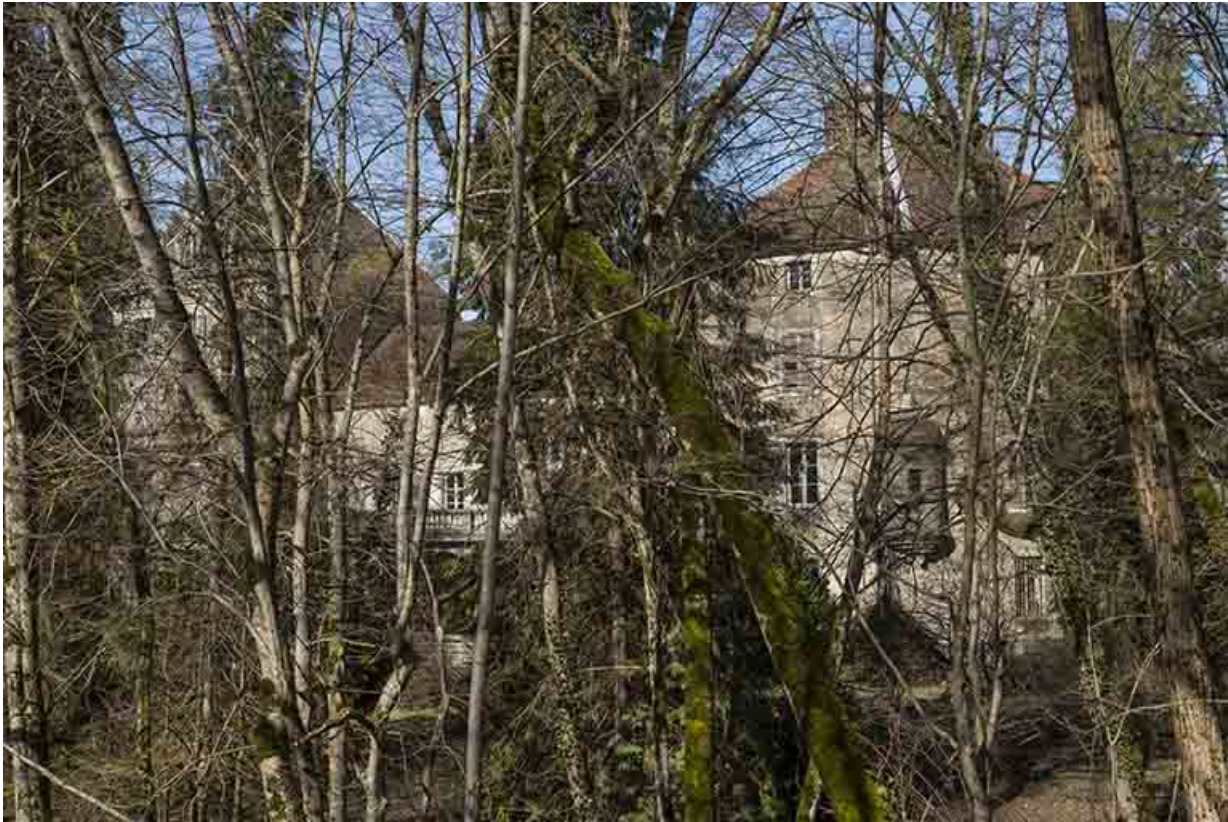
La pavillon oriental et son échauguette, façade sud-ouest.