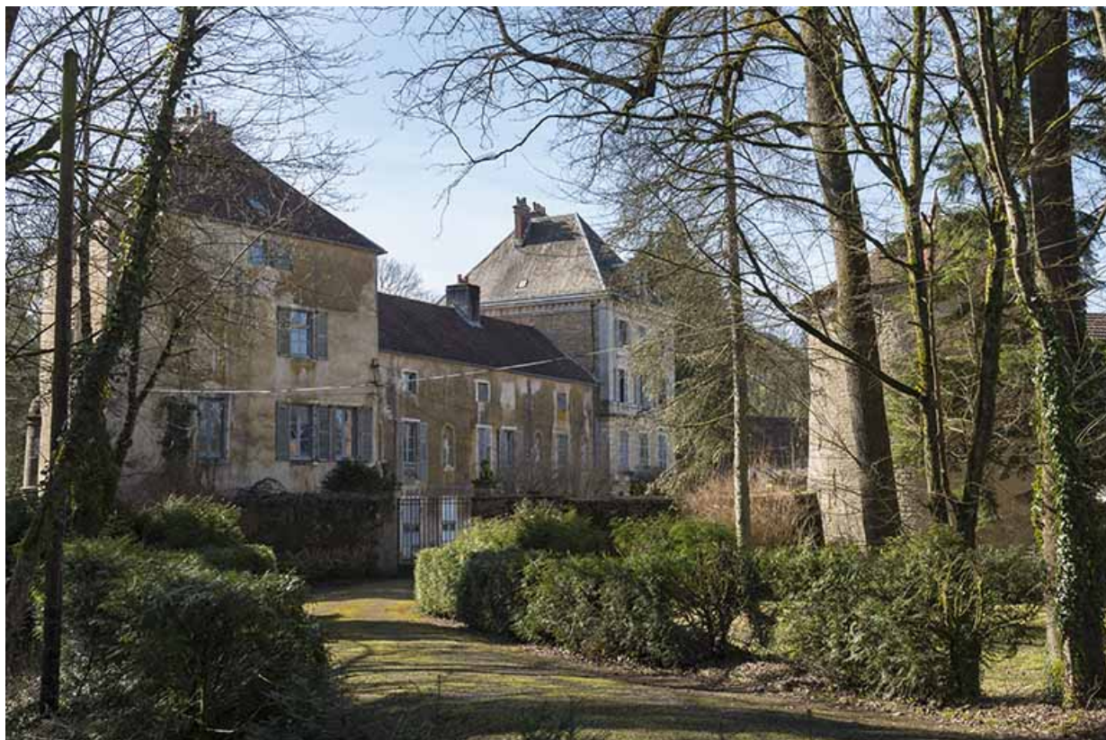
Le corps de logis et ses deux pavillons.