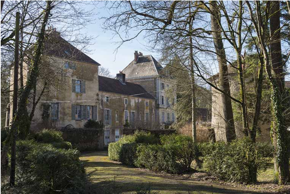
Le corps de logis et ses deux pavillons.