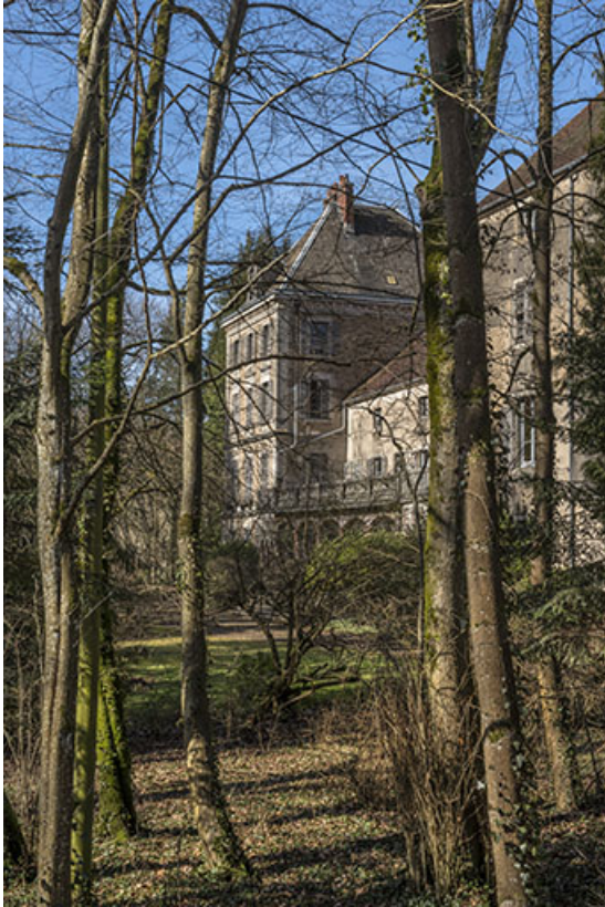
La façade sud-ouest, vue depuis le parc.