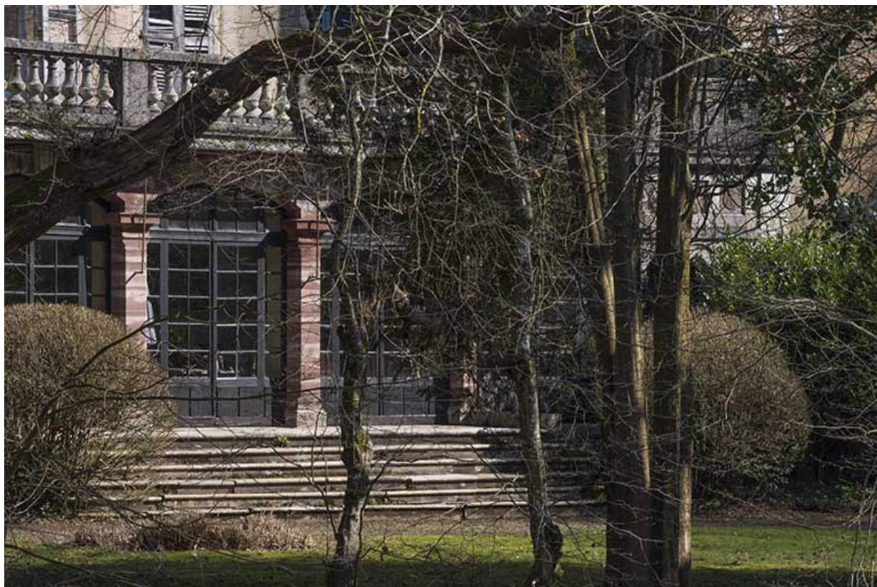
Détail du rez-de-chaussée, façade sud-ouest. 70, Conflandey