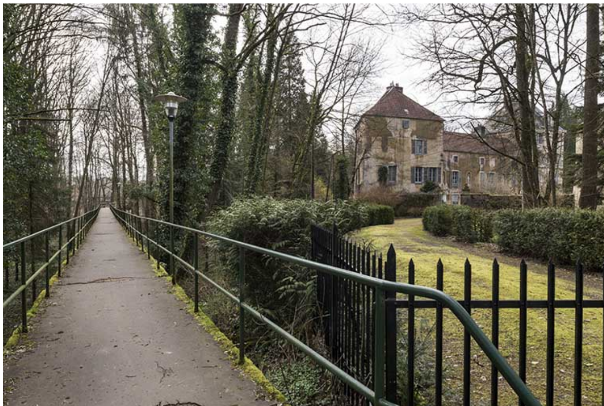
La passerelle reliant le village à l'usine.