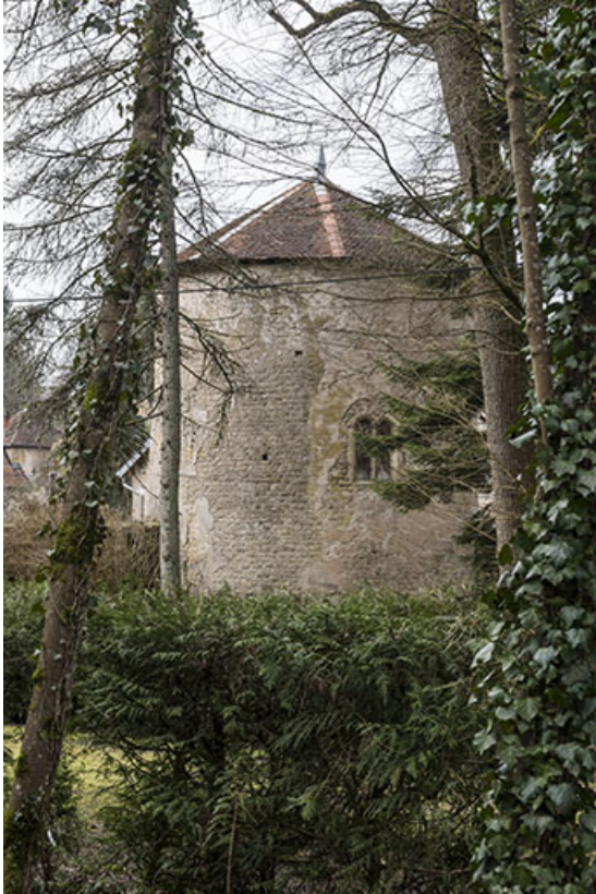
Tour située dans la cour du château.