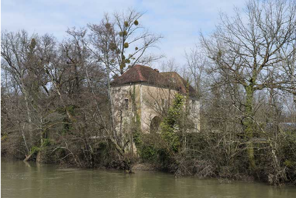
La porte septentrionale. 70, Conflandey