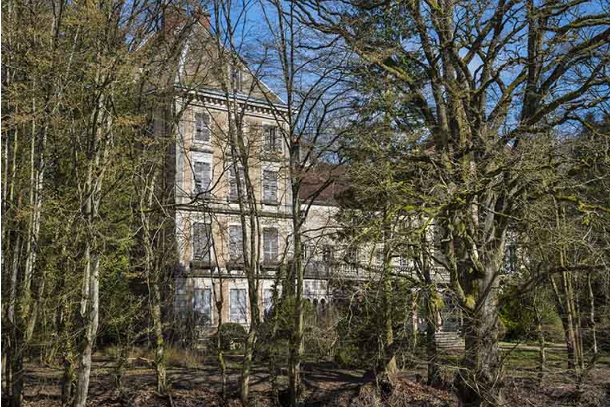
Le pavillon occidental, façade sud-ouest. 70, Conflandey