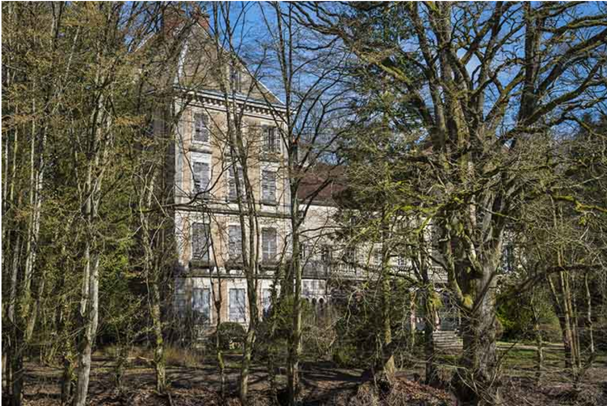
Le pavillon occidental, façade sud-ouest. 70, Conflandey