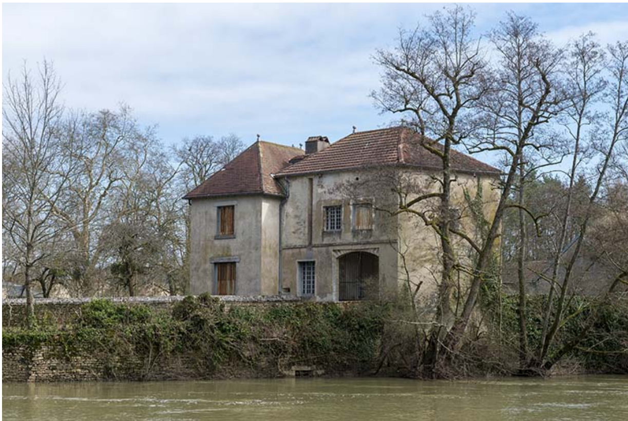
La porte septentrionale et l'ancien pont-levis.