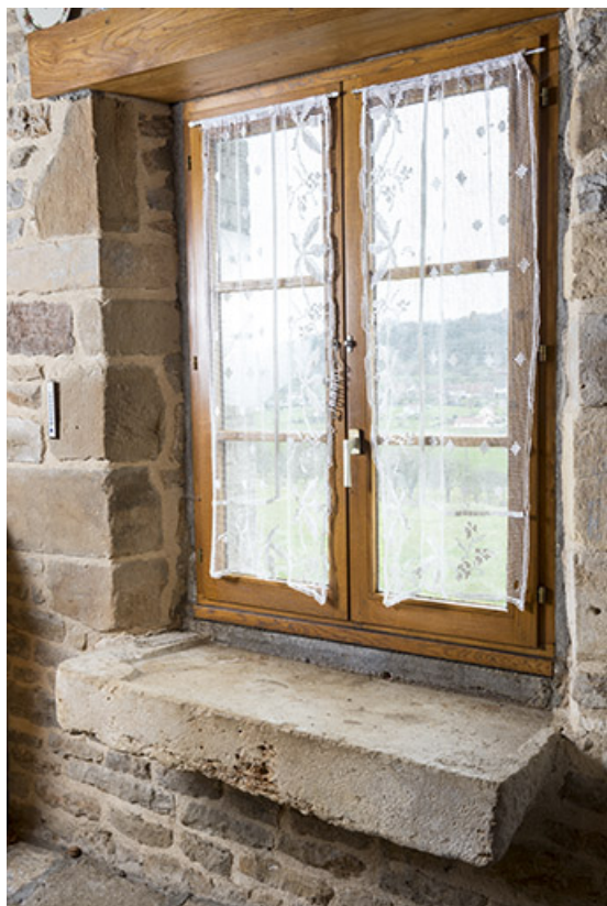
Pierre à évier, salle à manger.