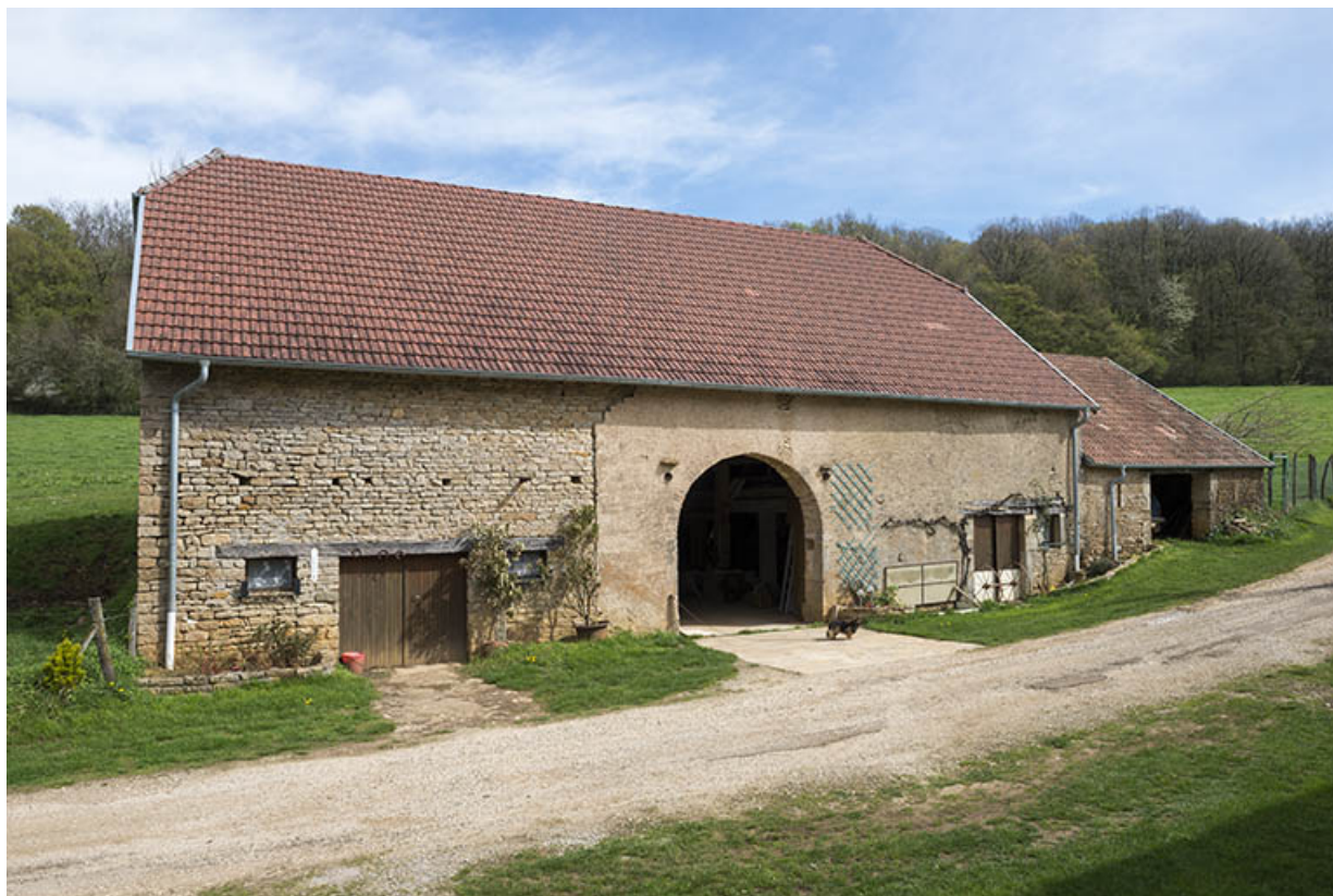
façade antérieure de la grange.