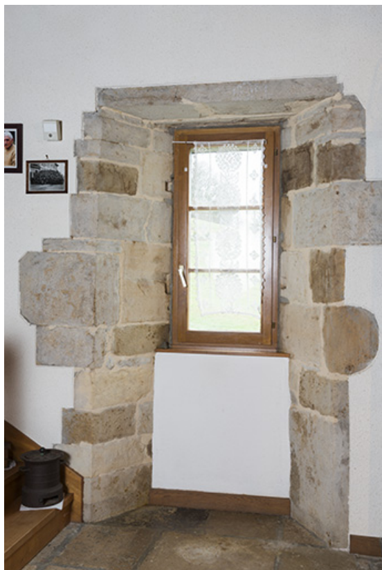
Encadrement d'une fenêtre, salle à manger.