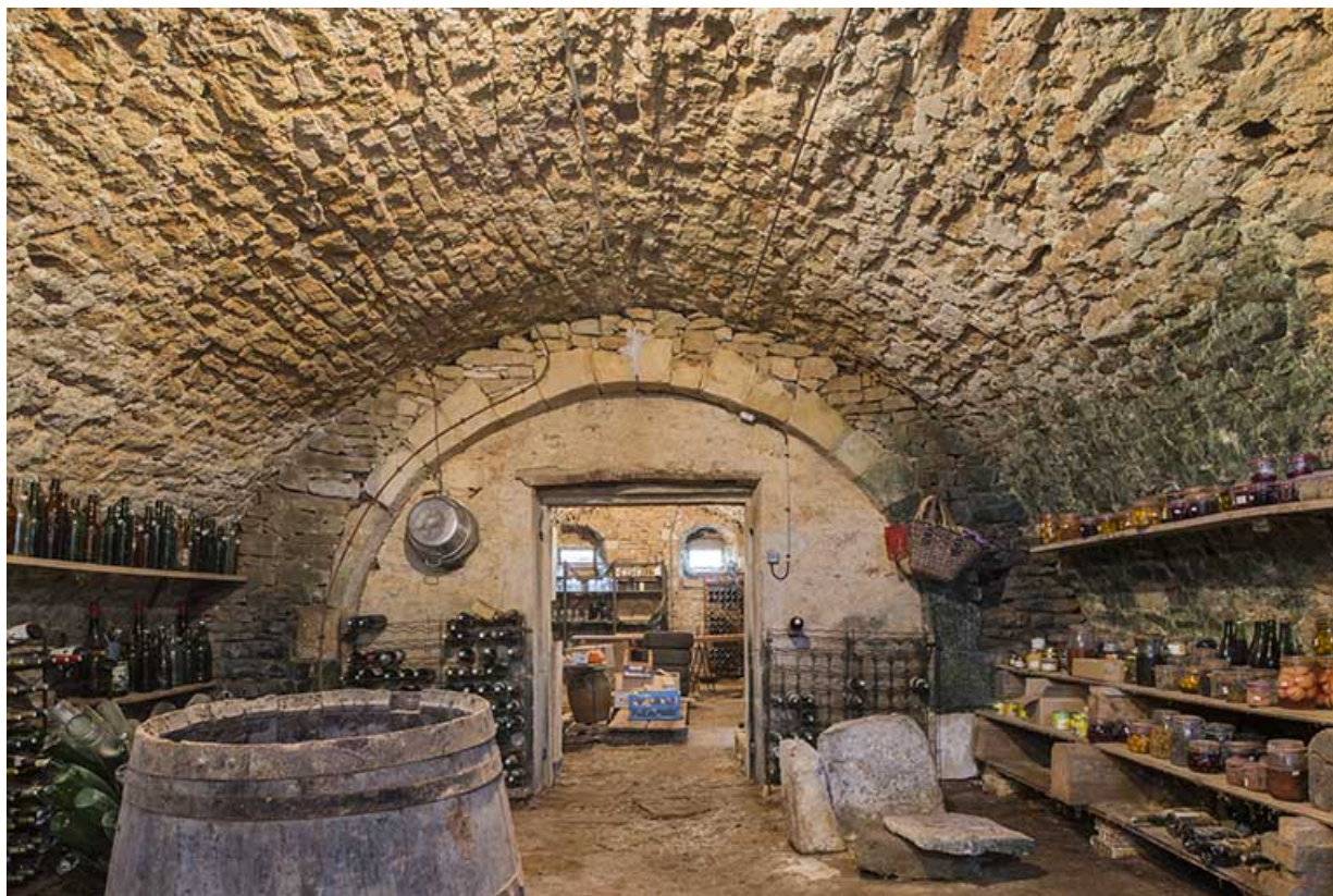
La cave voutée, vue générale.