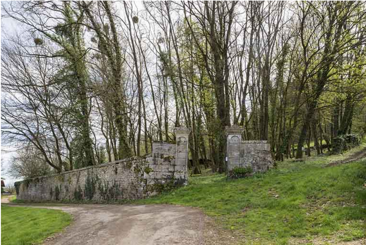
Le cimetière en haut de la rue des Bournaux.