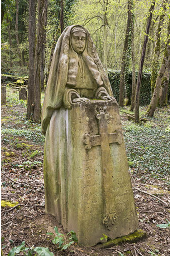
Détail de la statue.