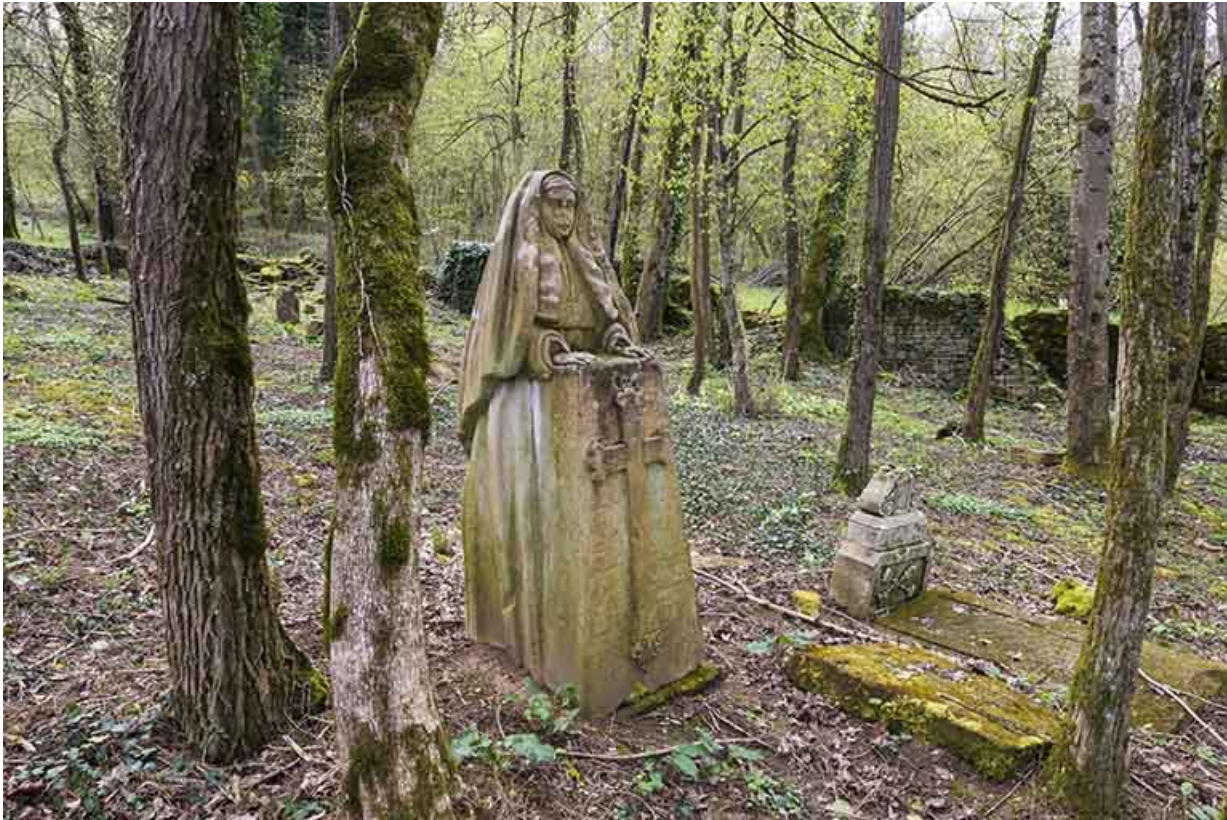
Statue représentant la soeur Philomène.