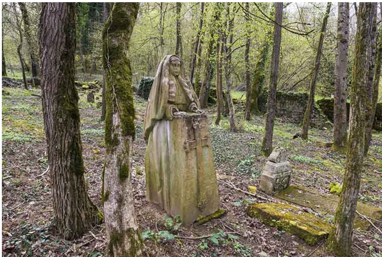
Statue représentant la soeur Philomène.