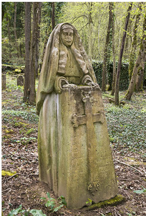
Détail de la statue.