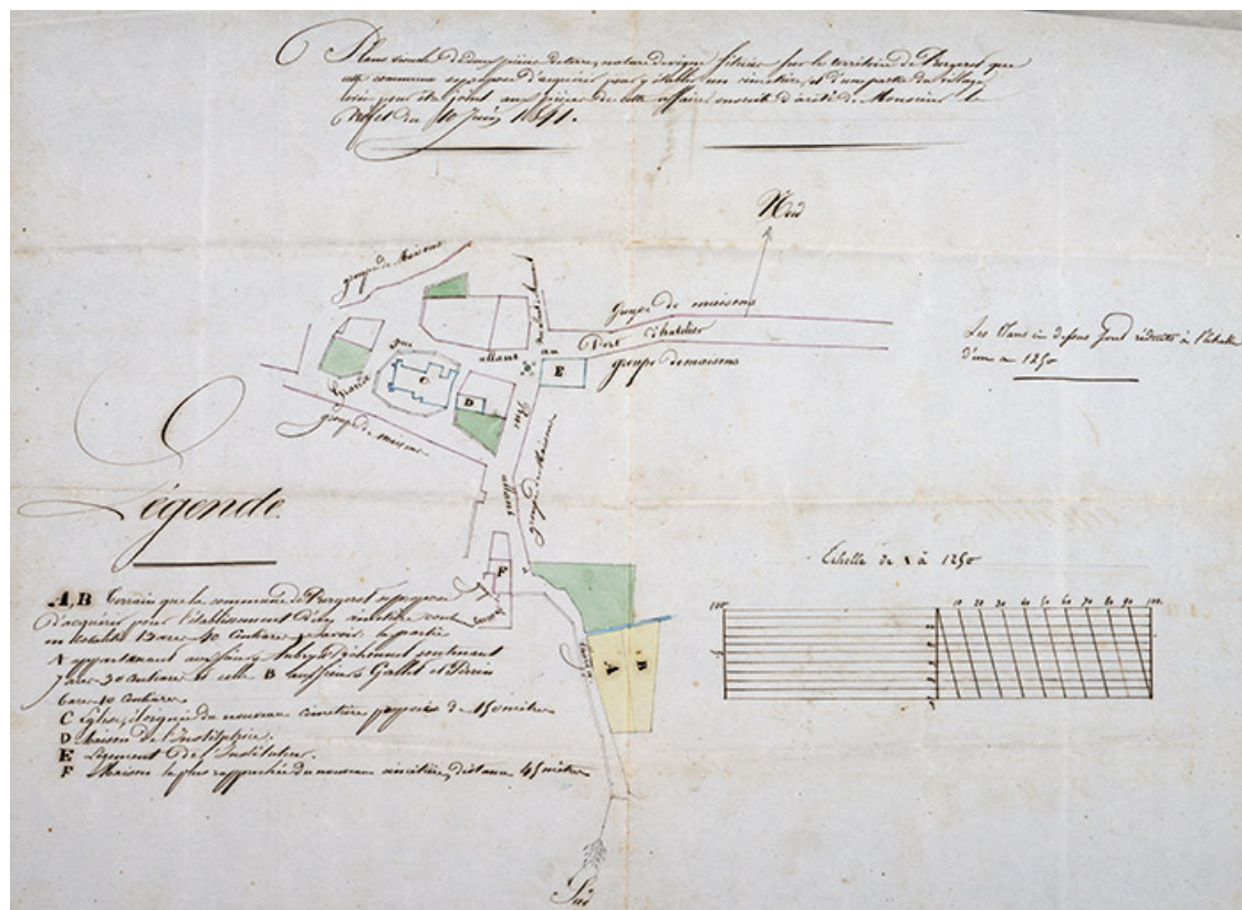
Plan de situation du cimetière projeté en 1841.