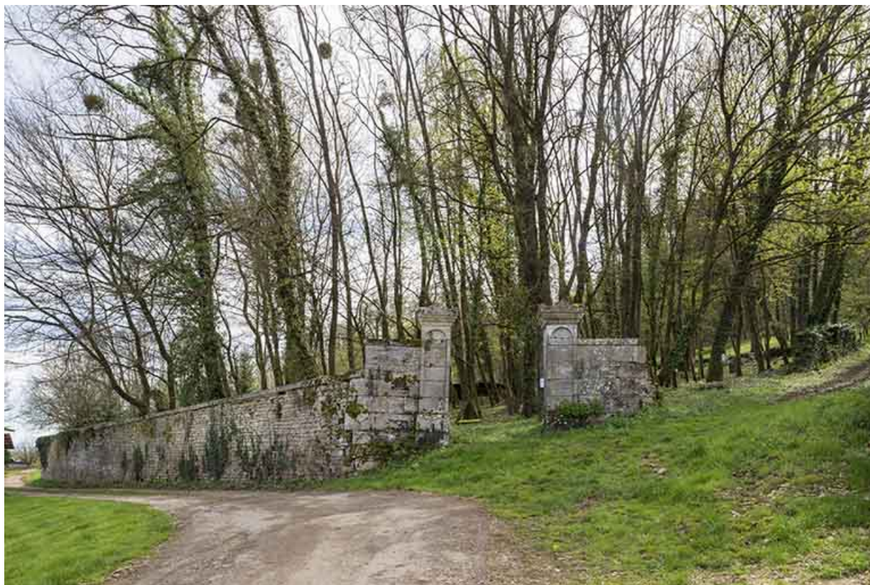
Le cimetière en haut de la rue des Bournaux. 70, Purgerot rue des Bournaux