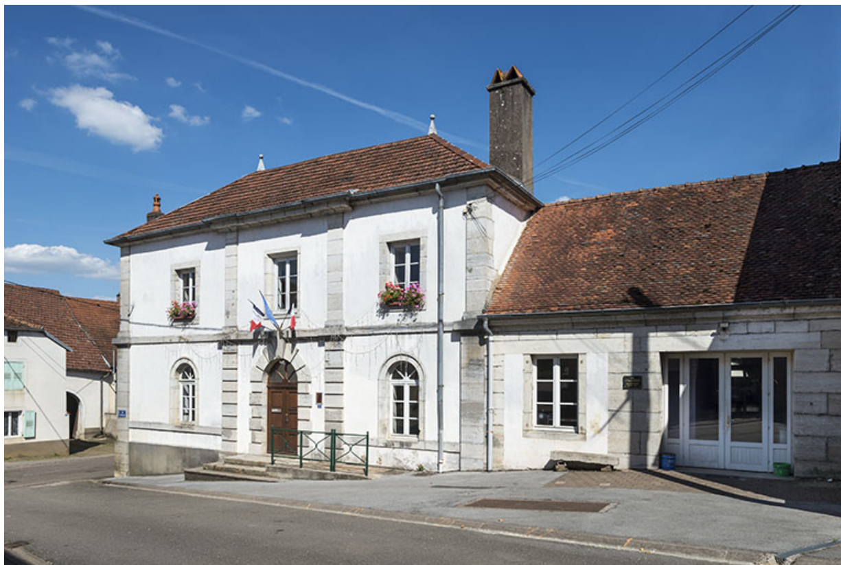
Vue de trois-quart.