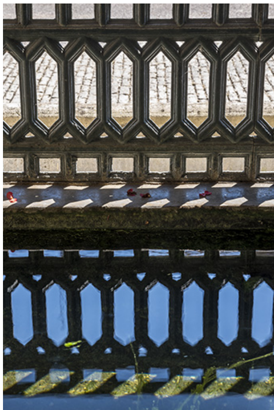
L'ombre du garde-corps dans le bassin.