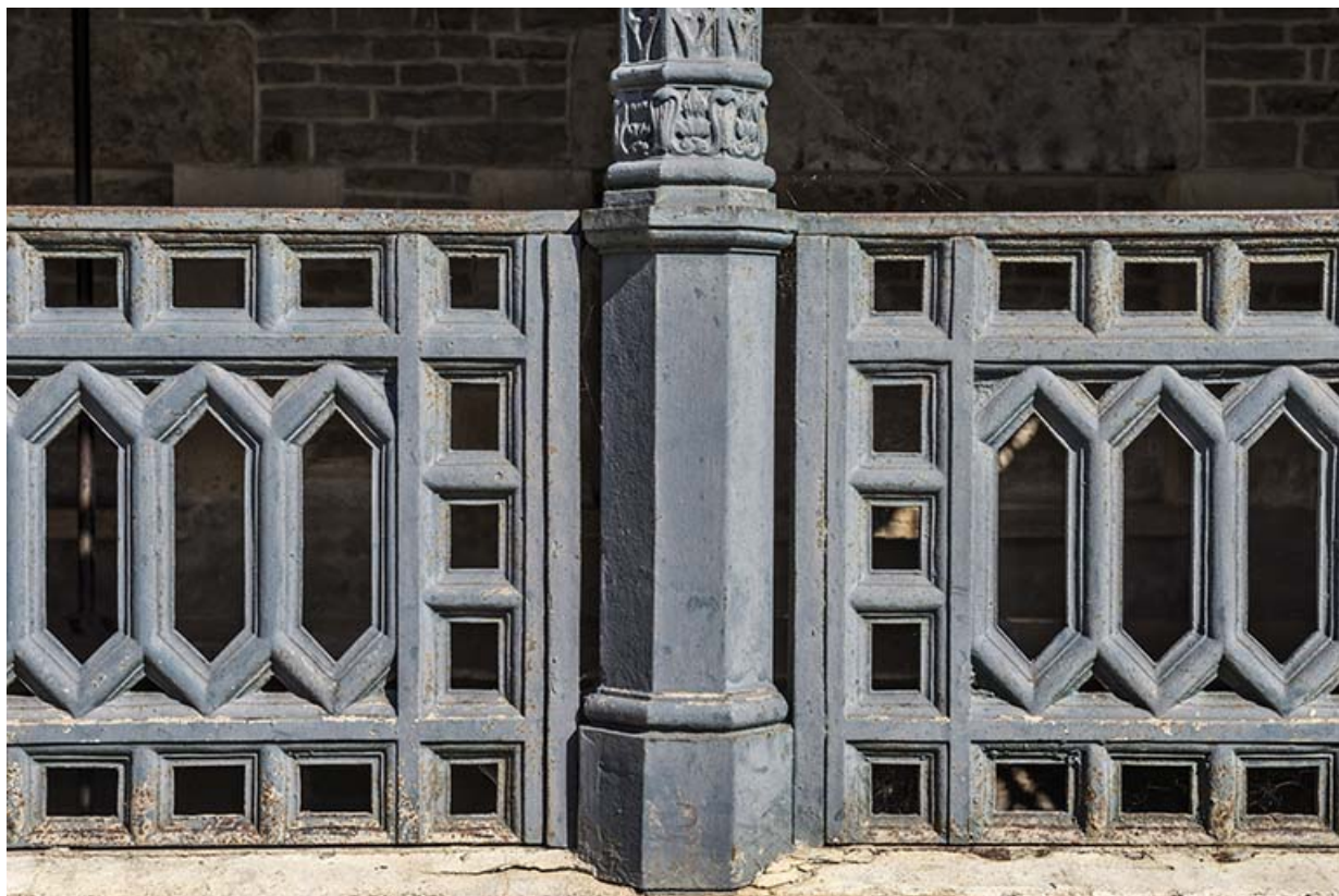
Détail du garde-corps et d'une colone.