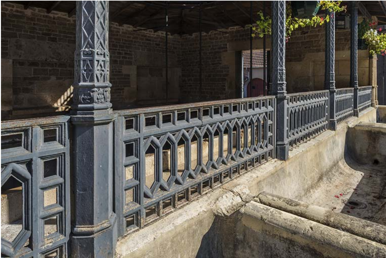
Le garde-corps en fonte. 70, Purgerot rue du Vaux