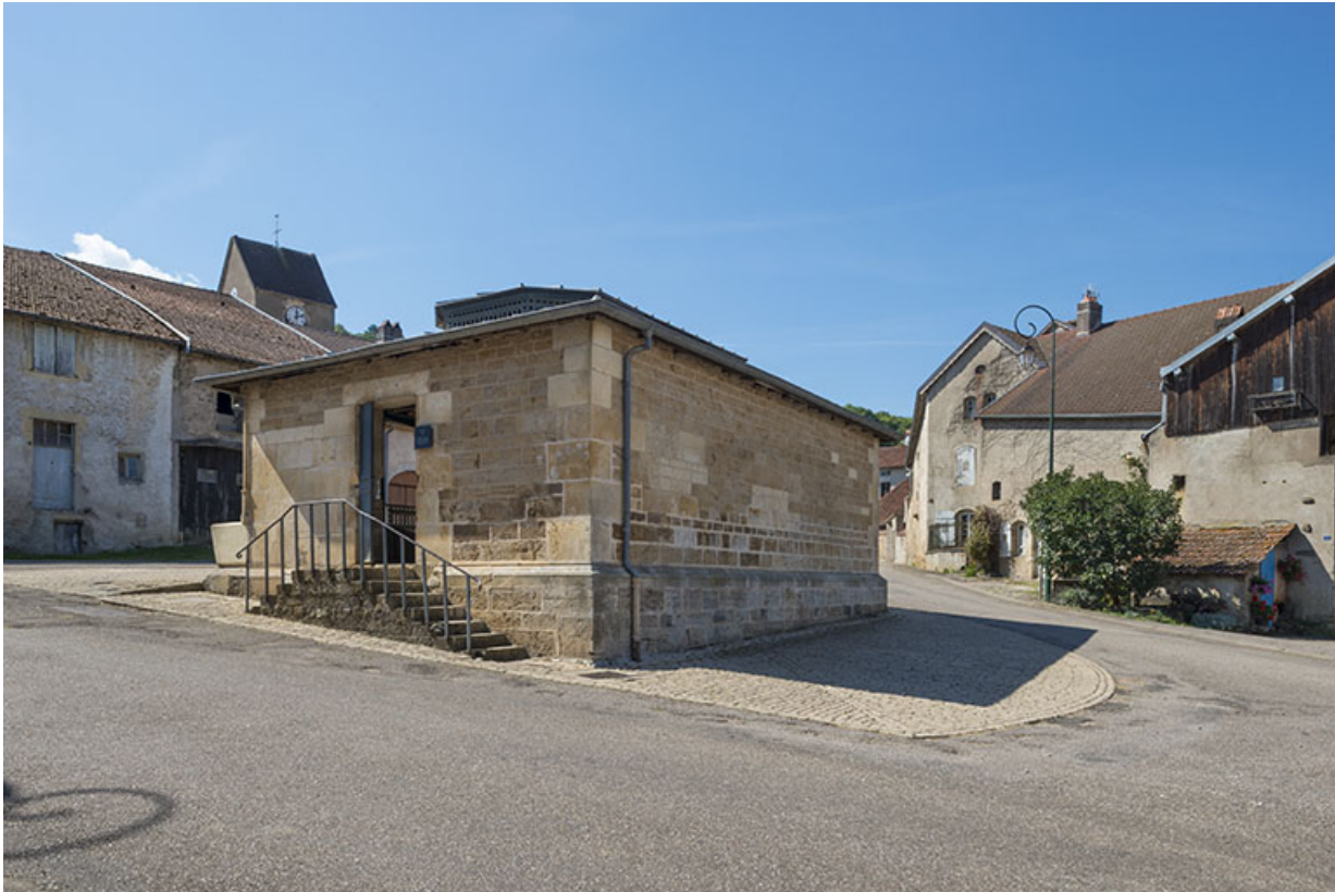
Vue de trois-quart.