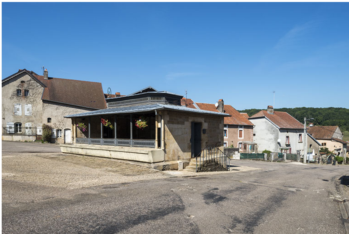
Vue depuis le haut de la rue du Vaux.