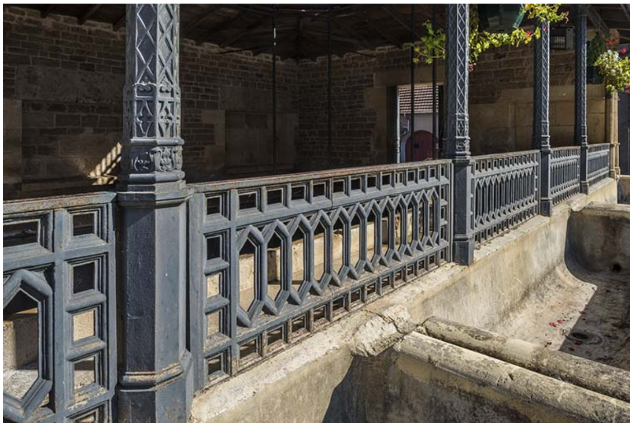
Le garde-corps en fonte. 70, Purgerot rue du Vaux