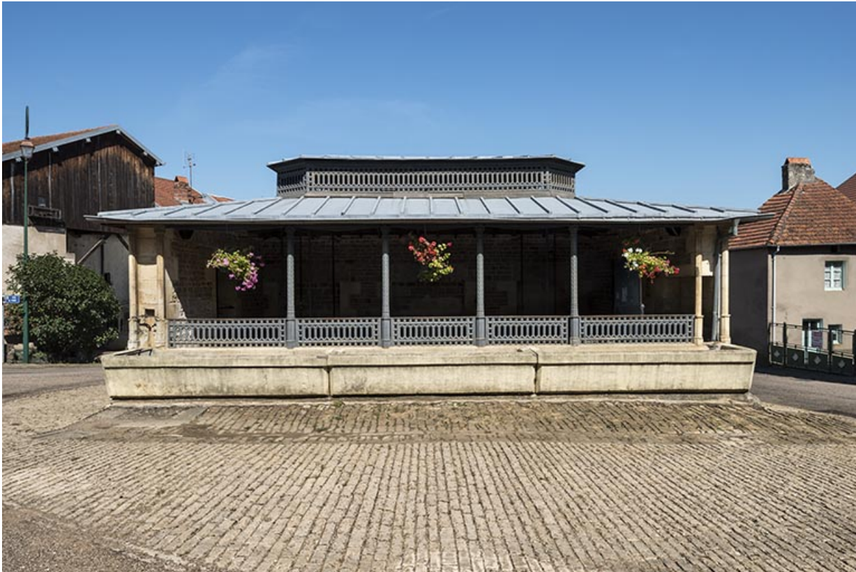
La façade antérieure de l'édifice.