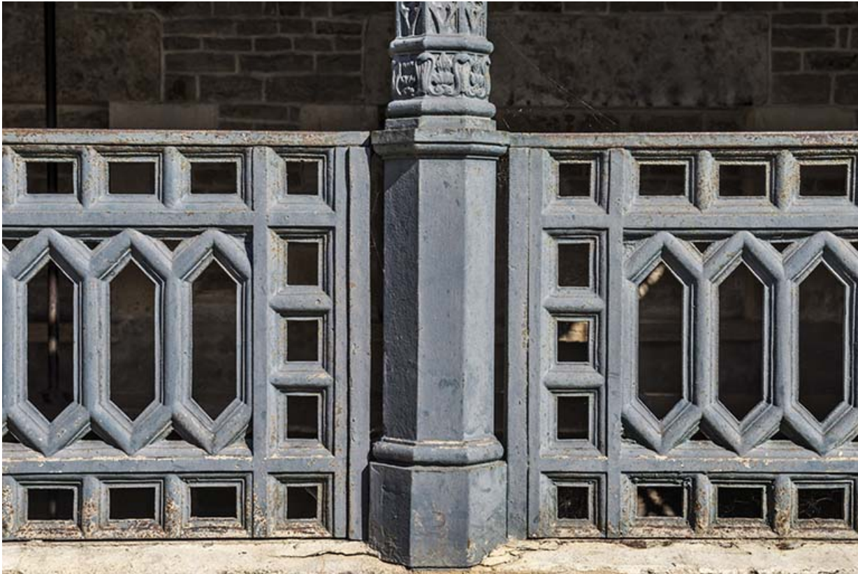
Détail du garde-corps et d'une colonne.