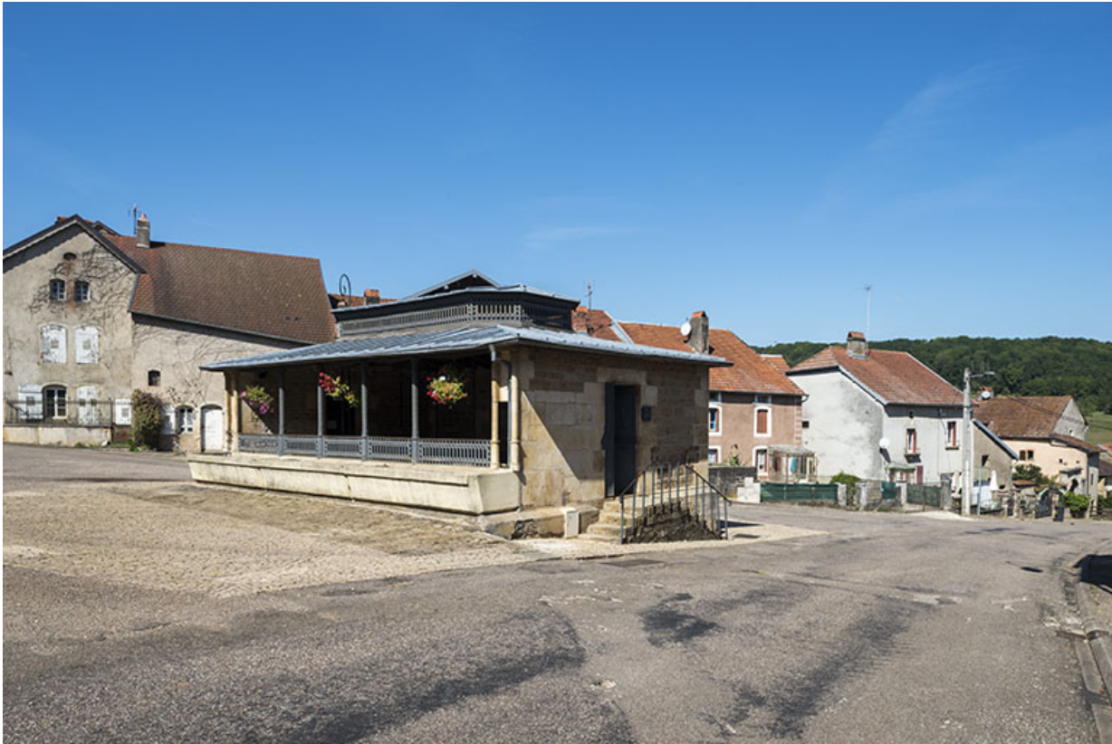
Vue depuis le haut de la rue du Vaux.