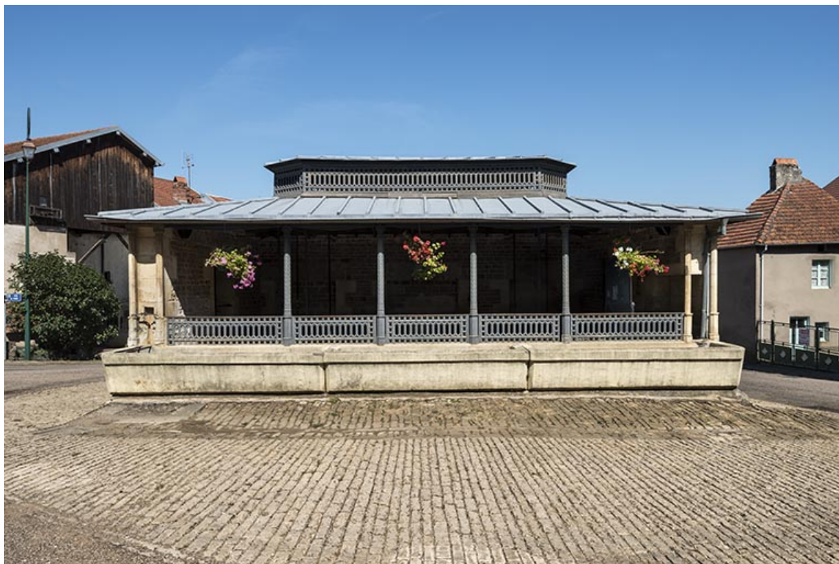
La façade antérieure de l'édifice.