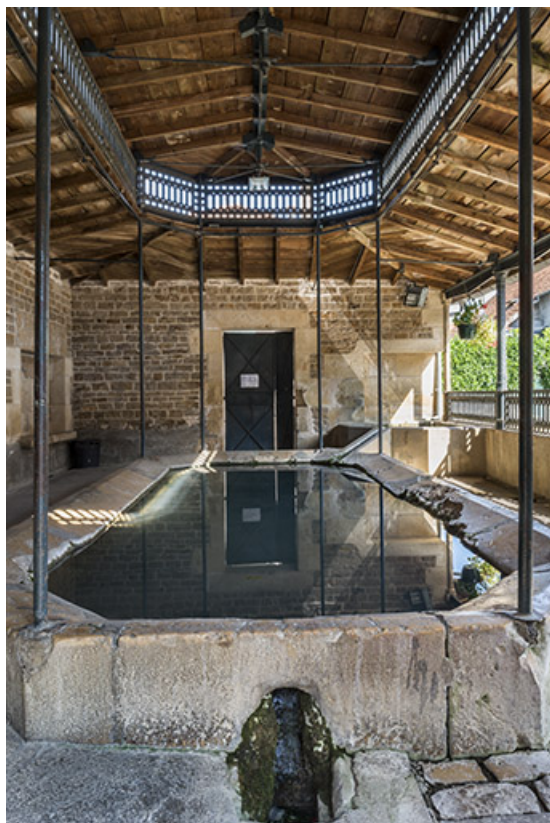
Le bassin du lavoir.