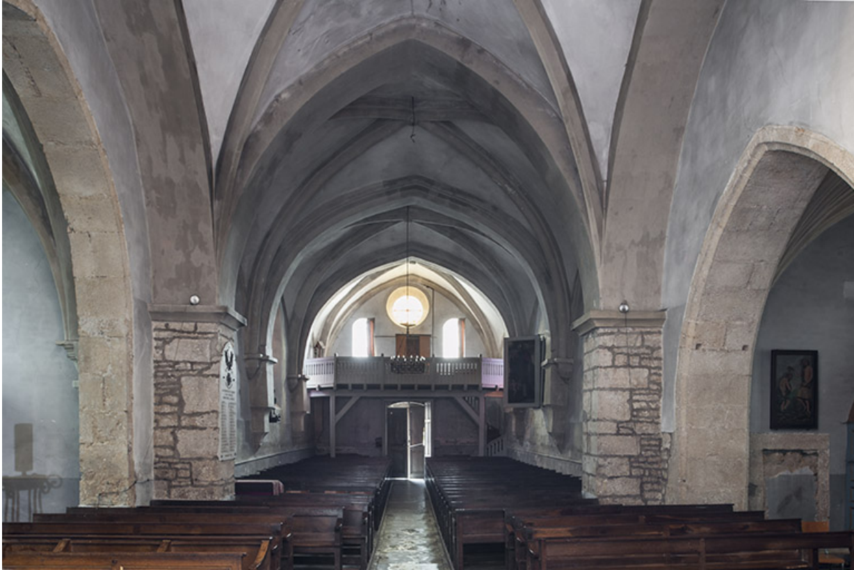
Vue intérieure depuis le chœur.