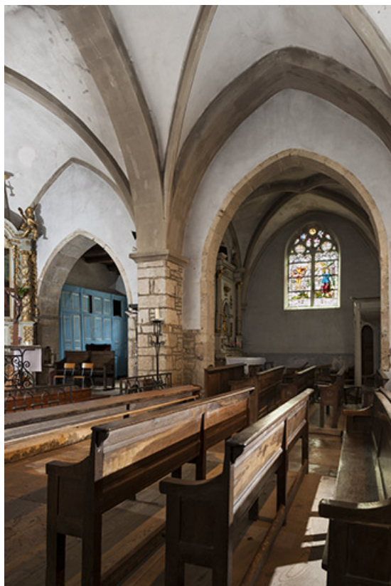
Vue au niveau du transept avec une des chapelles en arrière-plan. 70, Purgerot Grande Rue