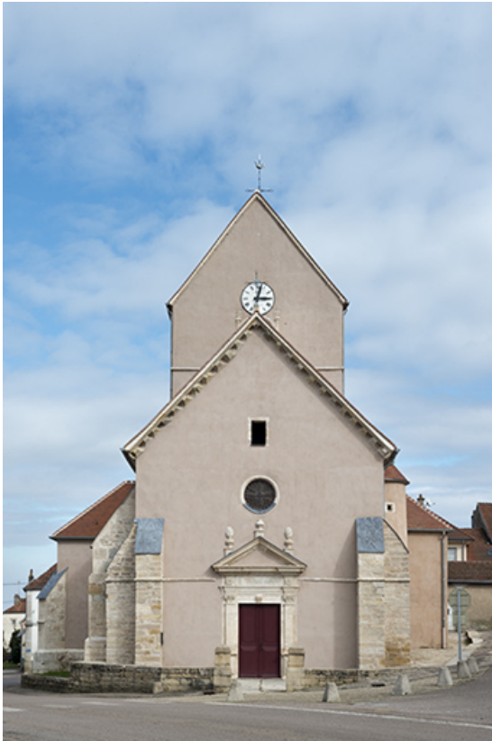
La façade occidentale. 70, Purgerot Grande Rue