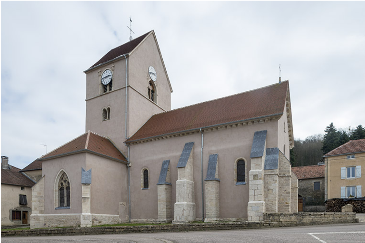
Vue latérale depuis la Grande rue.