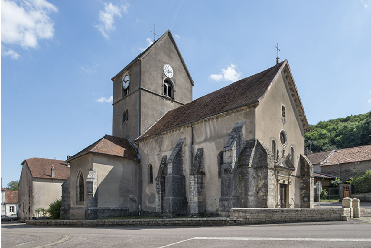
Vue avant restauration (2016).