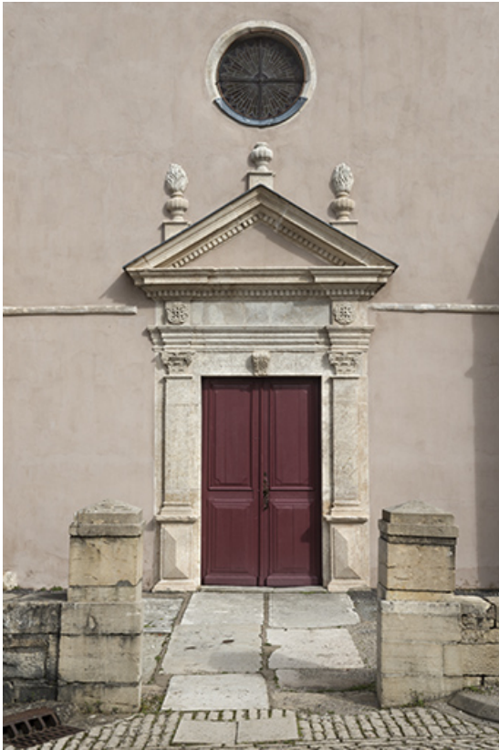
Le portail d'entrée.