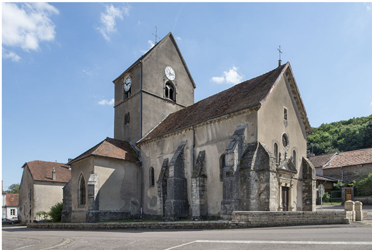
Vue avant restauration (2016).