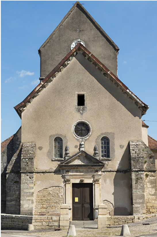
Vue avant restauration (2016).