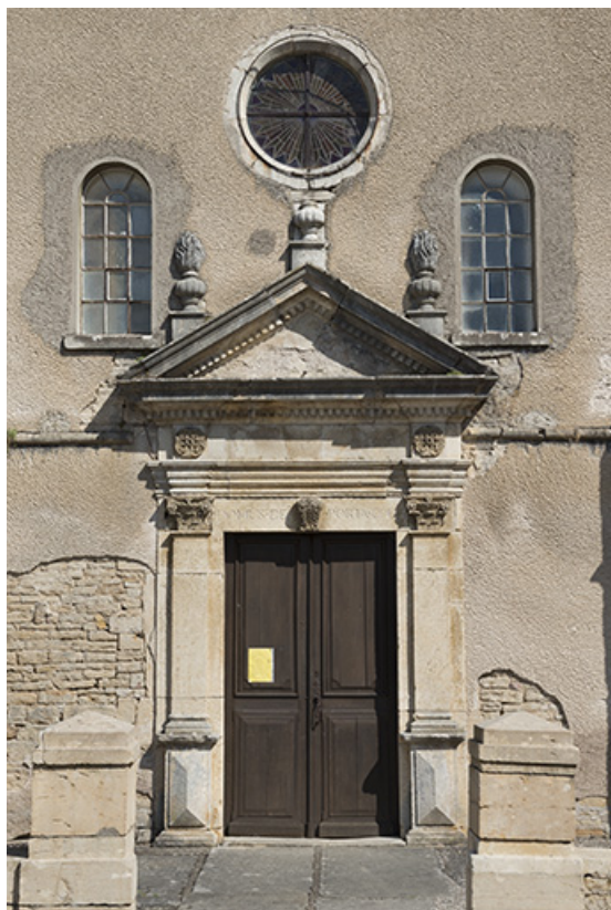
Vue avant restauration (2016).