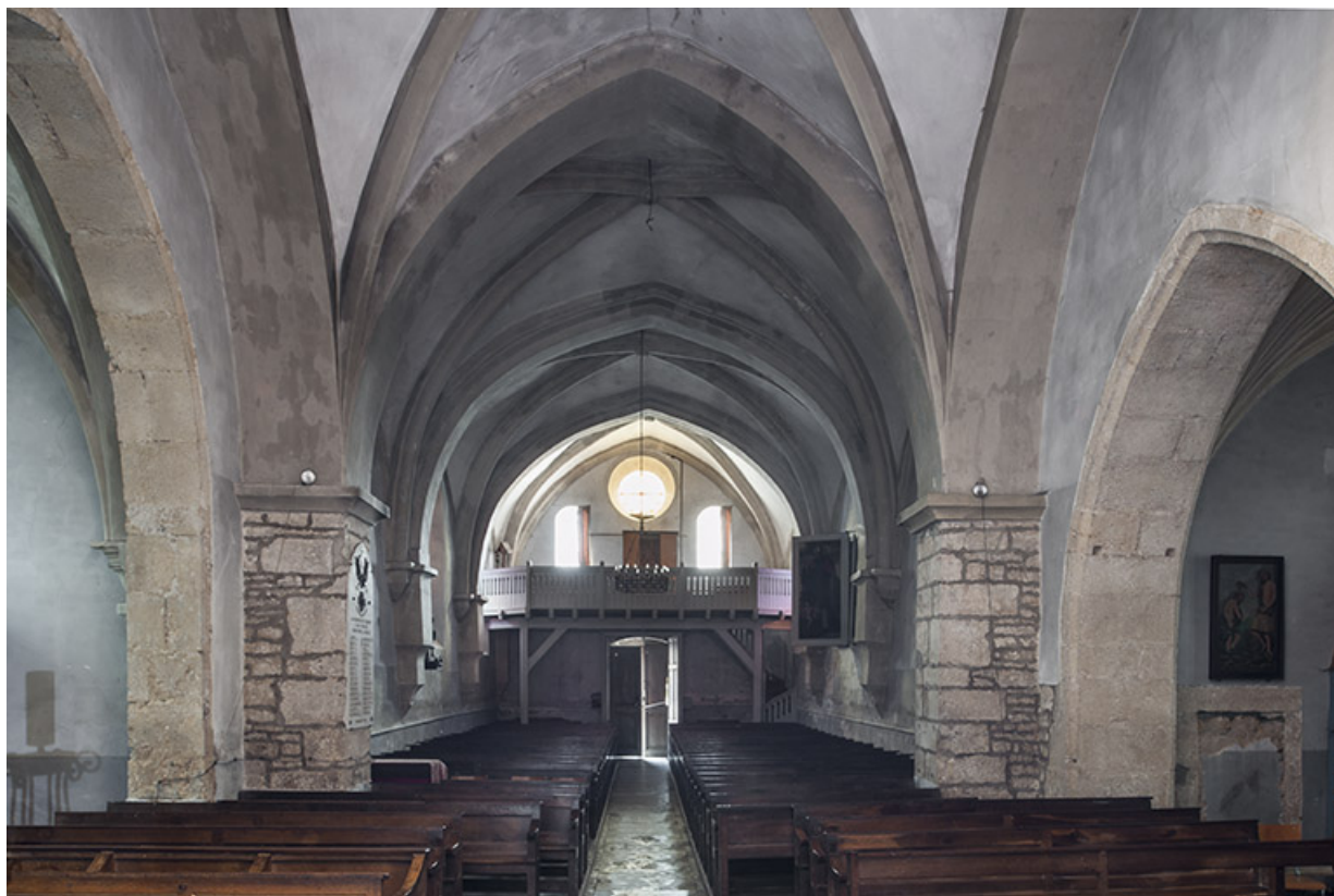
Vue intérieure depuis le chœur.