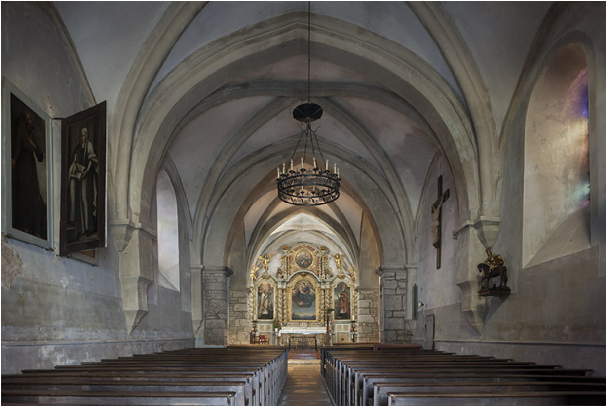
Vue intérieure depuis le porche d'entrée.