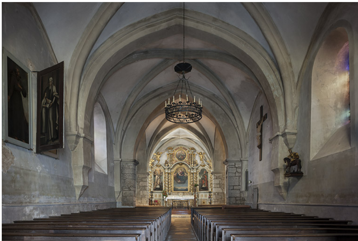
Vue intérieure depuis le porche d'entrée.