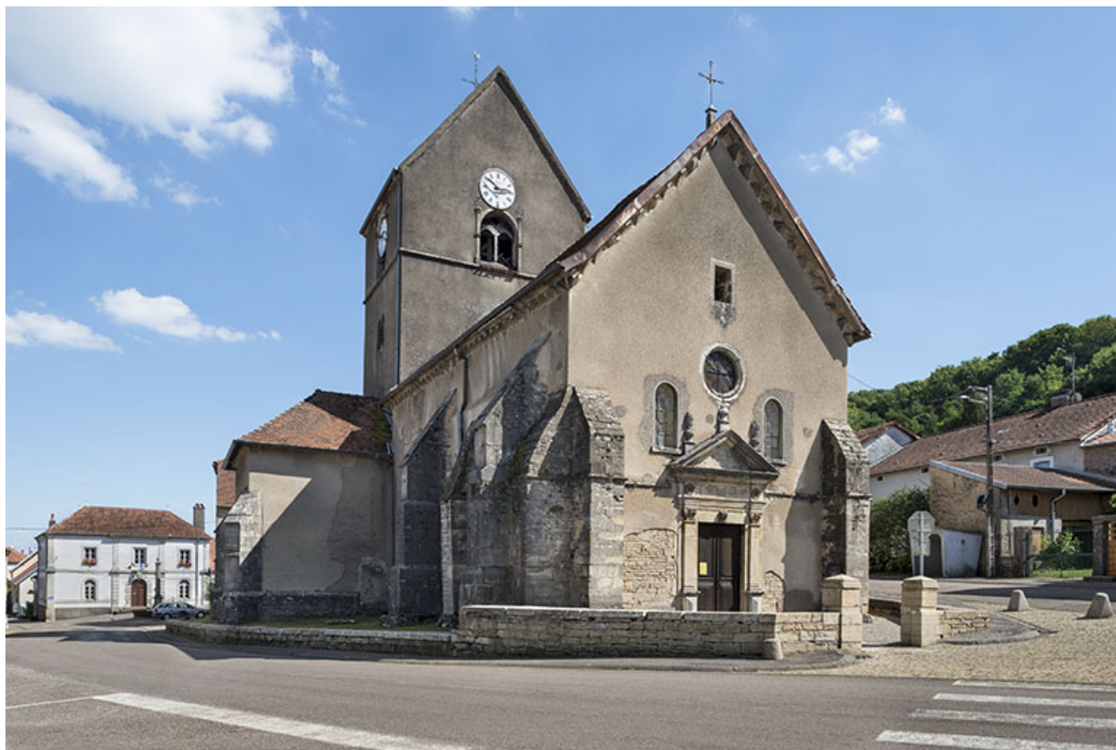
Vue avant restauration (2016).