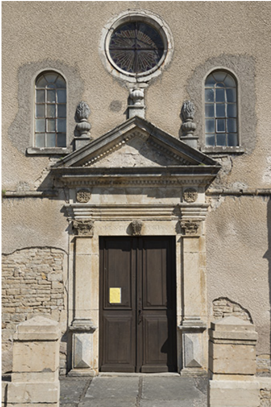
Vue avant restauration (2016).