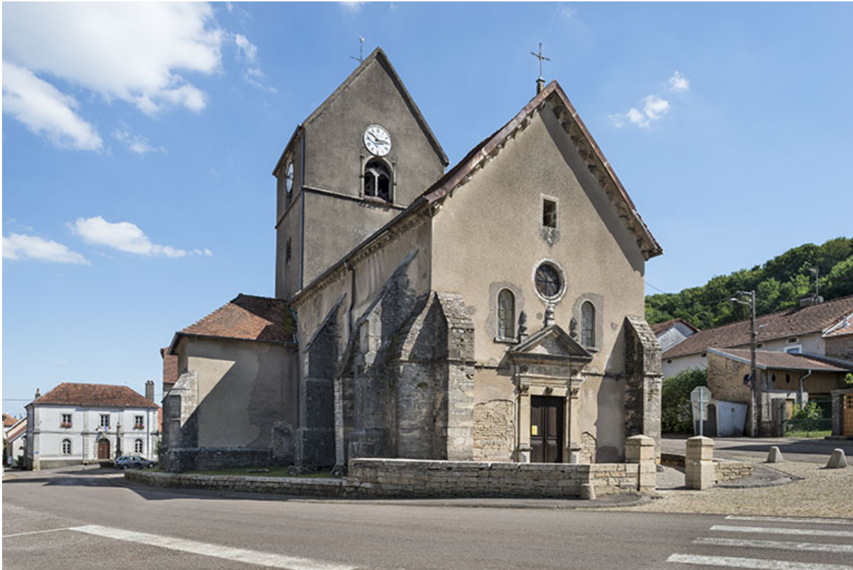
Vue avant restauration (2016).