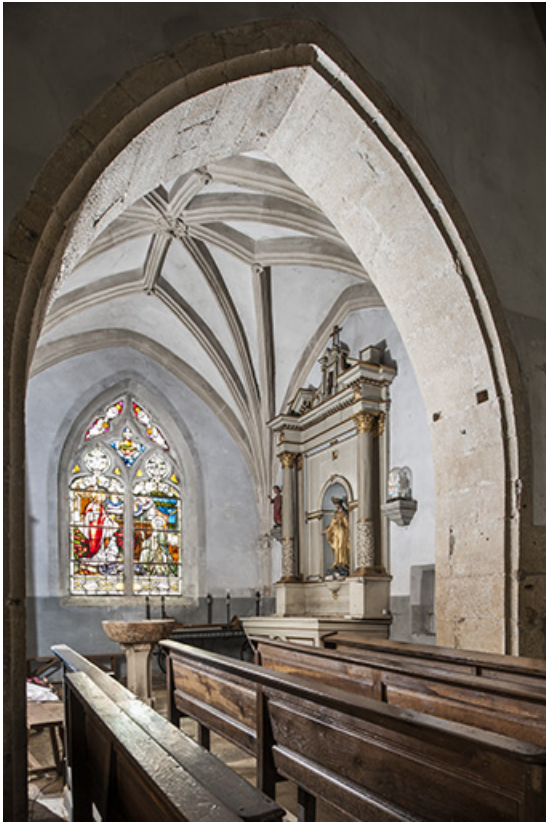
La chapelle latérale nord et sa voûte à nervures multiples. 70, Purgerot Grande Rue