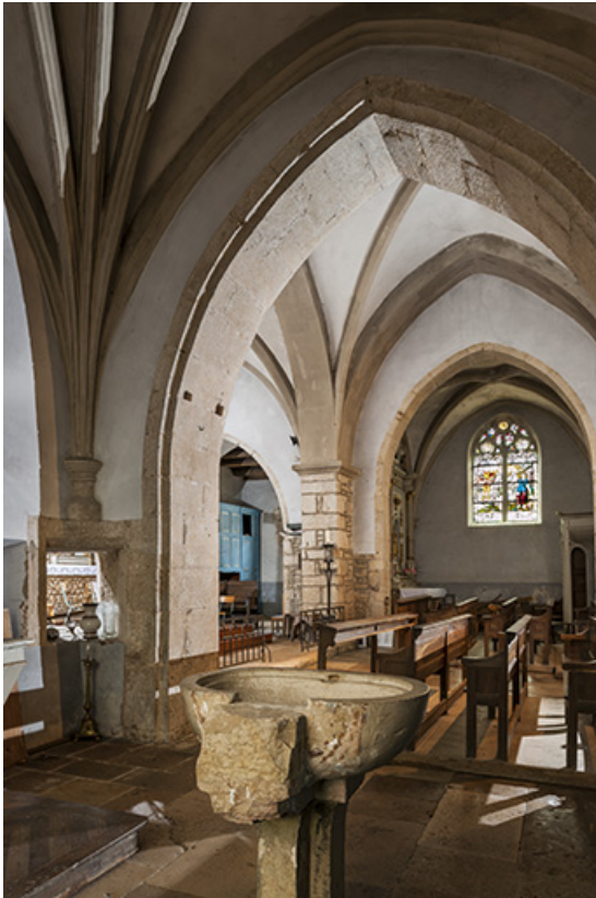
Vue depuis la chapelle latérale nord.