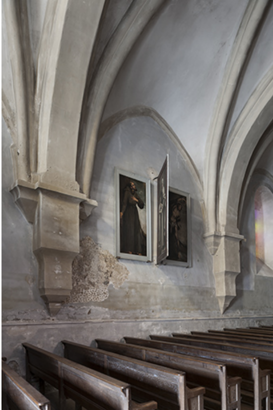
Une des trois travées de la nef.