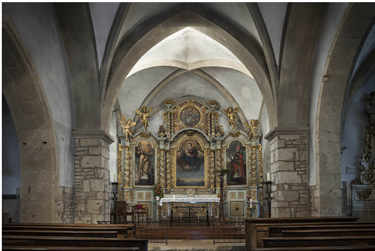
Le retable et le chœur. 70, Purgerot Grande Rue