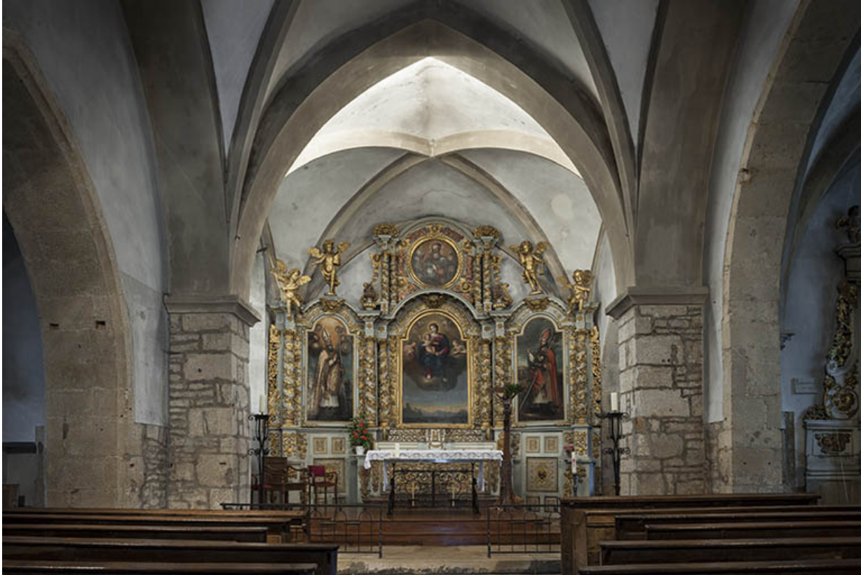
Le retable et le chœur.