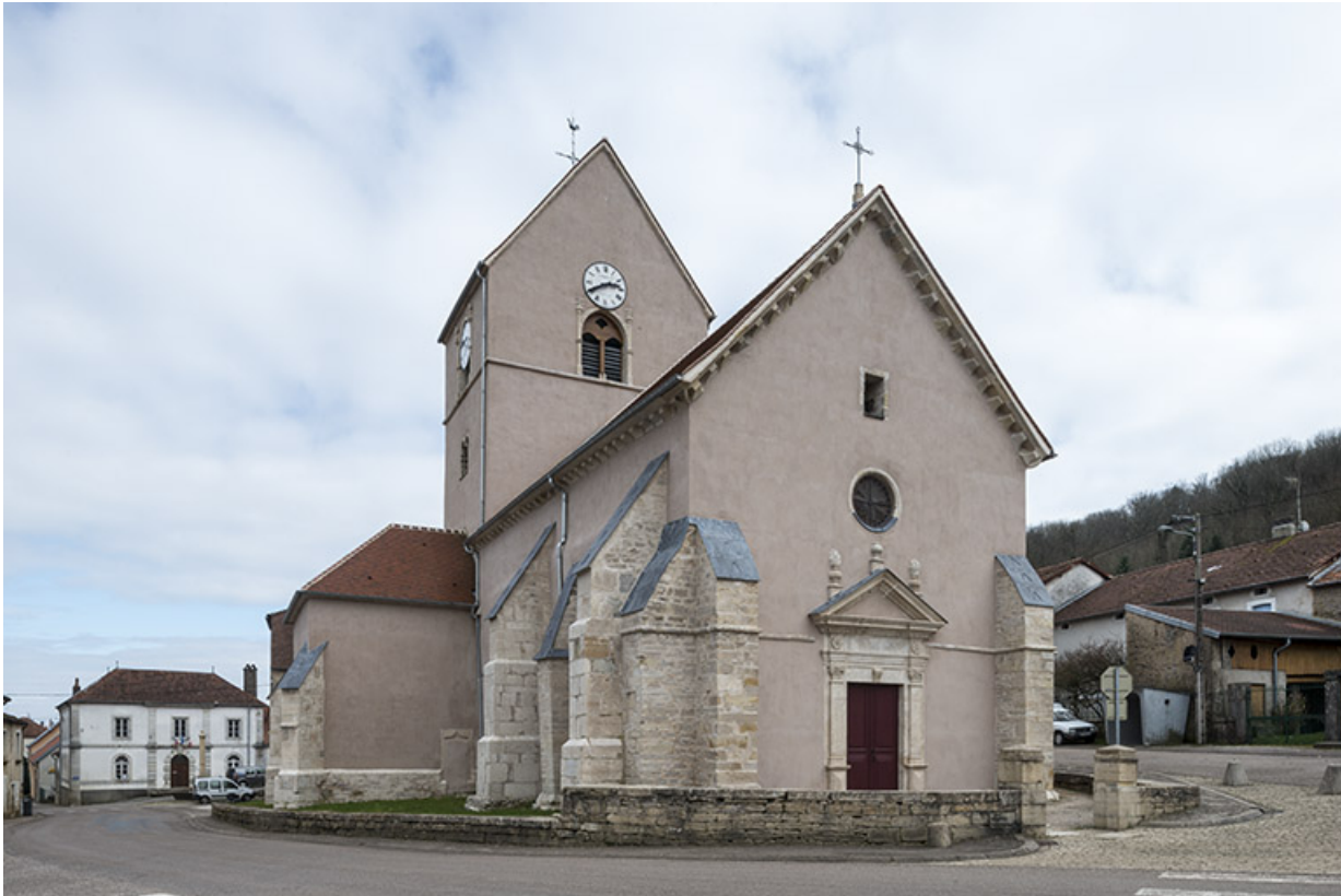
Vue depuis la place publique.