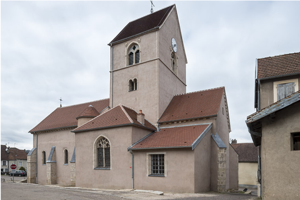
Vue latérale depuis la rue des Ecoles.