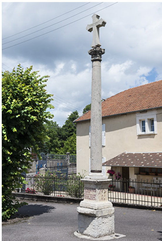
La croix, vue d'ensemble.

70, Port-sur-Saône rue François Mitterrand