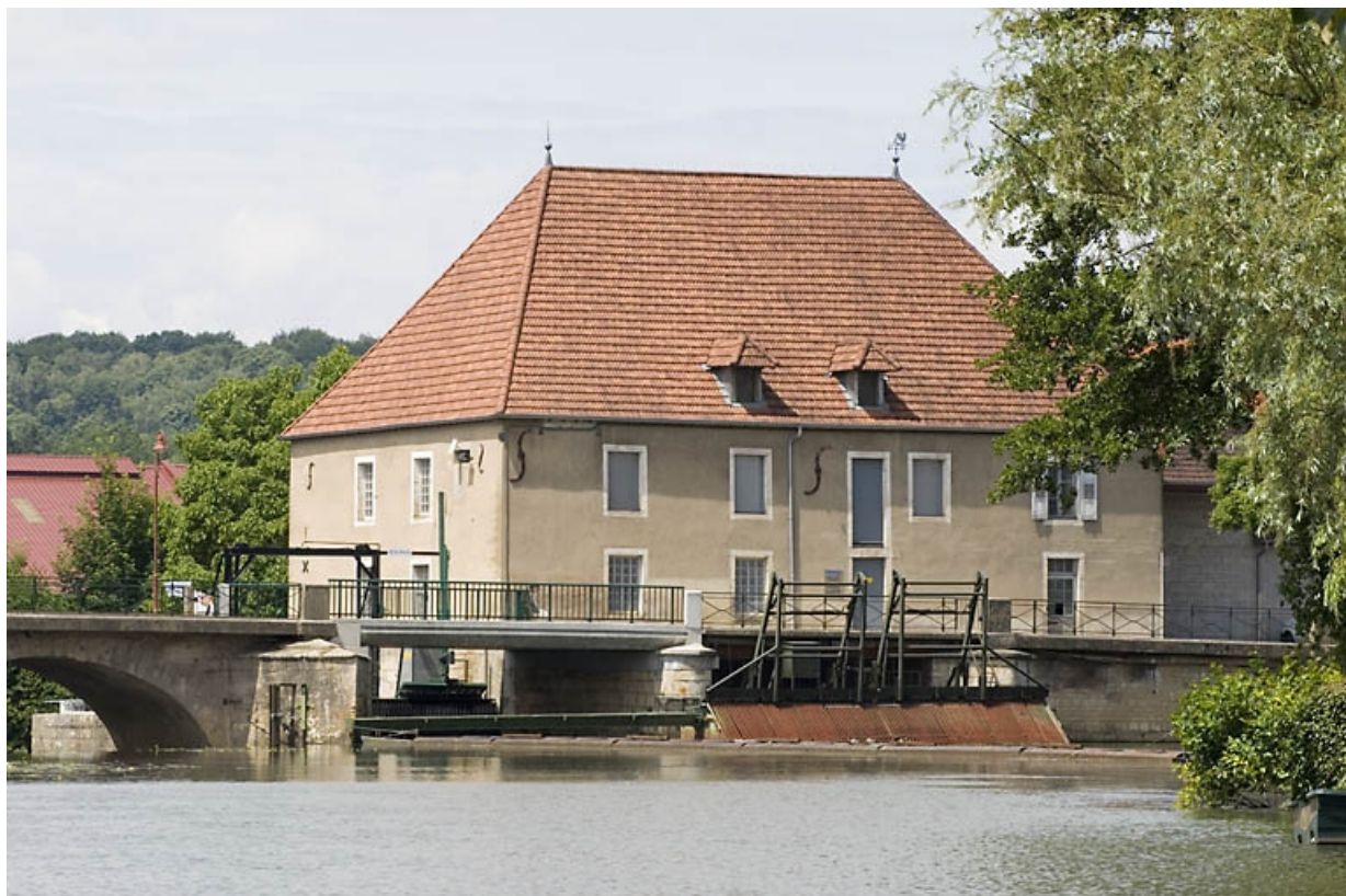
Vue d'ensemble en amont de la Saône.