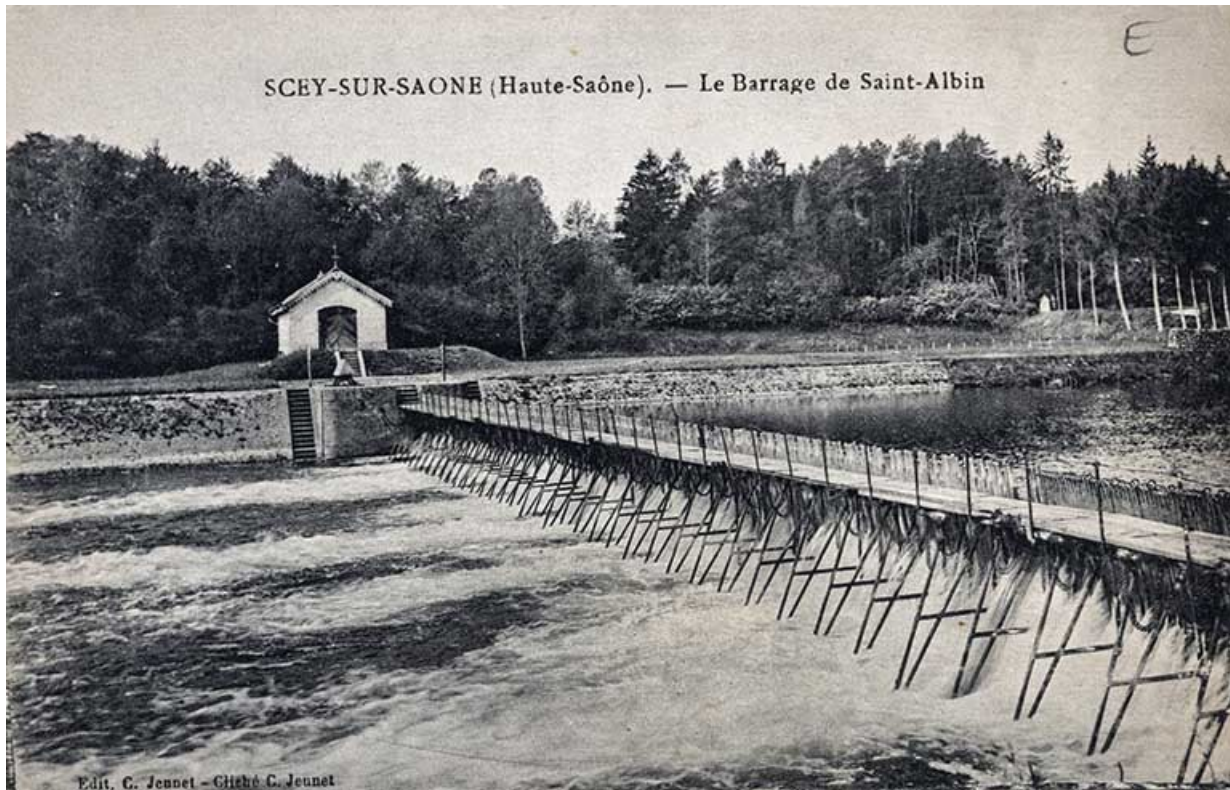
Le barrage à aiguilles de Saint-Albin, carte postale.