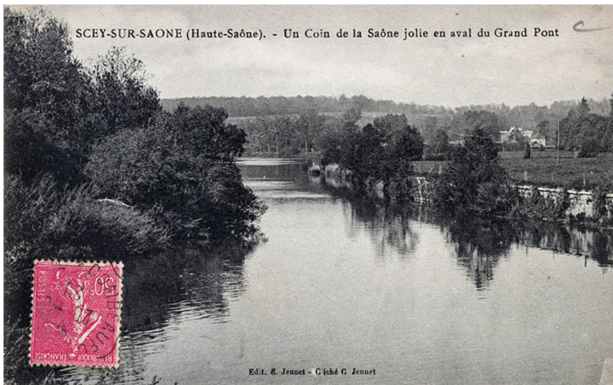
La Saône en aval du pont, carte postale.