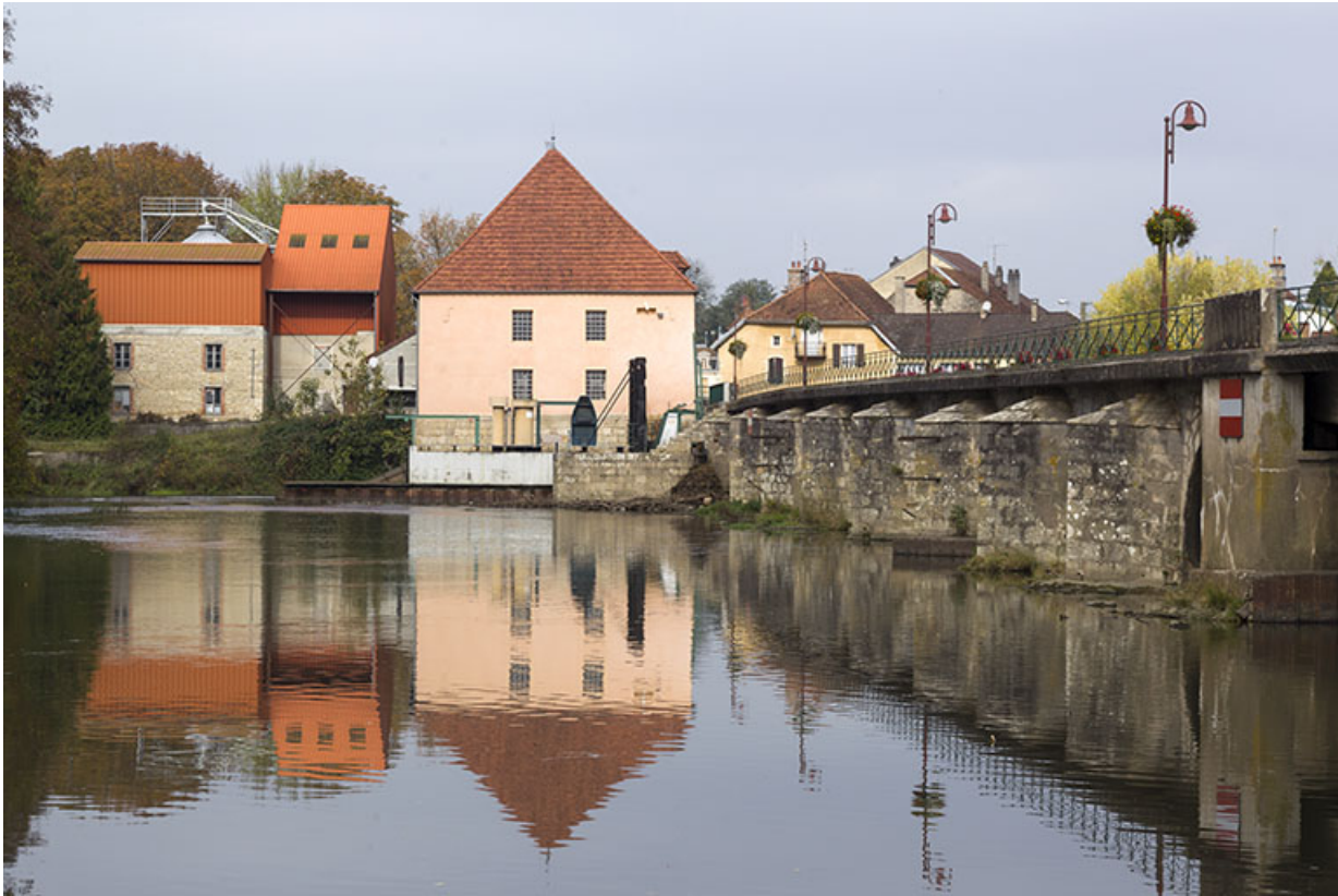
La Saône, le pont et la centrale hydroélectrique.