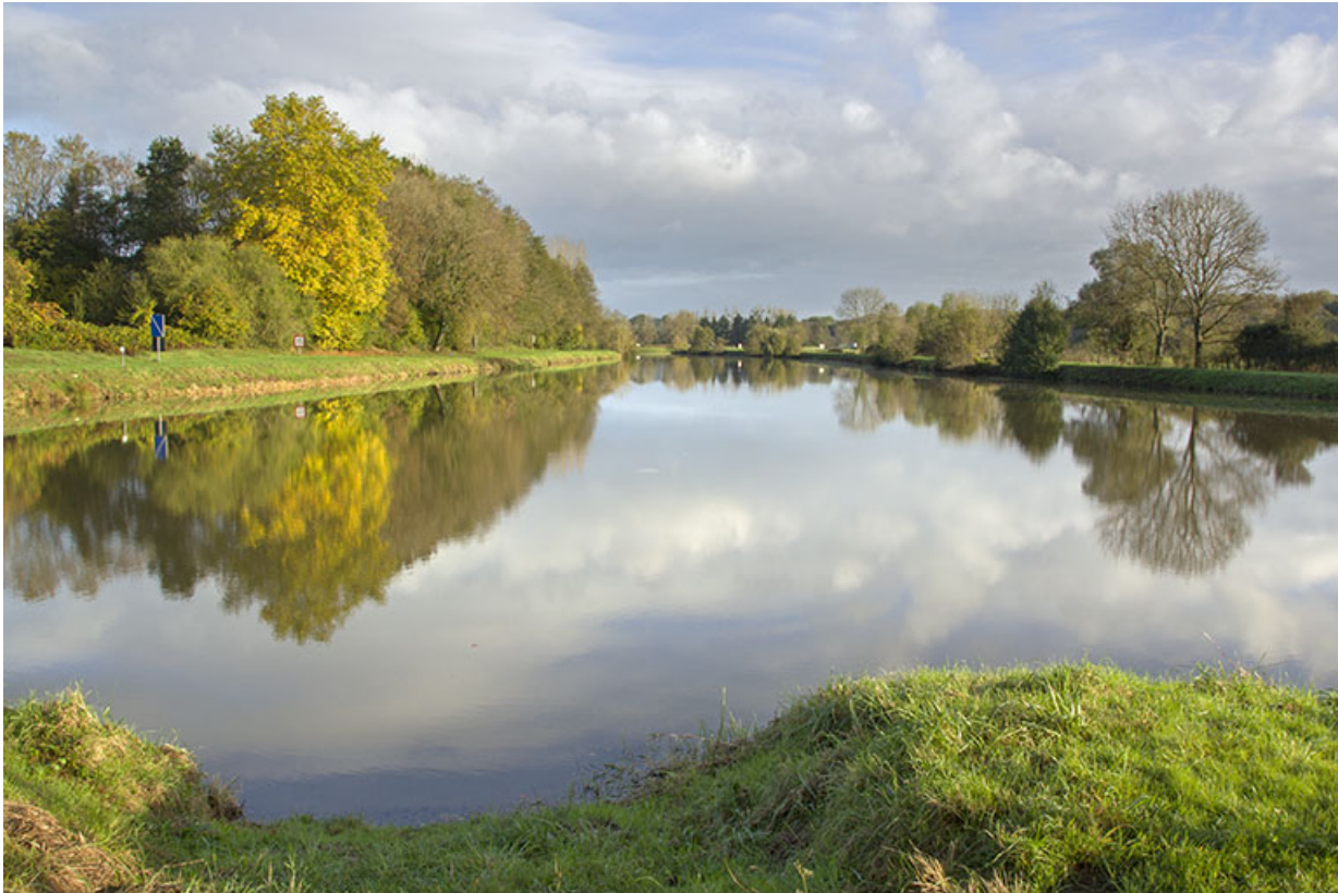
La Saône à hauteur de Saint-Albin.