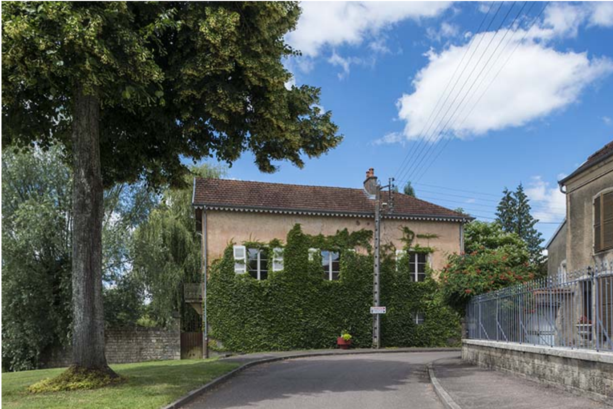
Ancienne tannerie, grande rue du Bourg. 70, Scey-sur-Saône-et-Saint-Albin