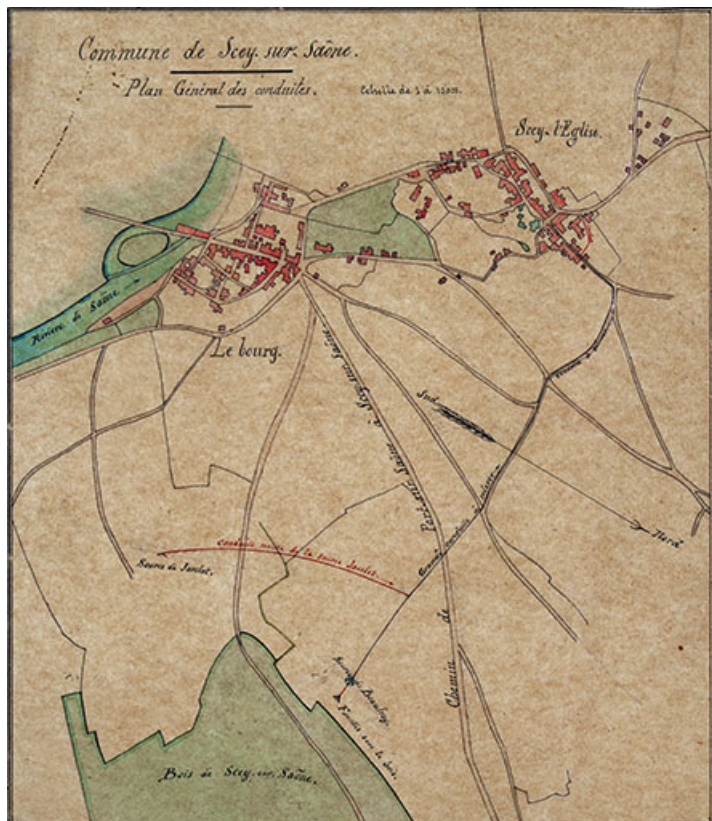
Plan montrant l'implantation du bâti à Scey-sur-Saône (1862). 70, Scey-sur-Saône-et-Saint-Albin