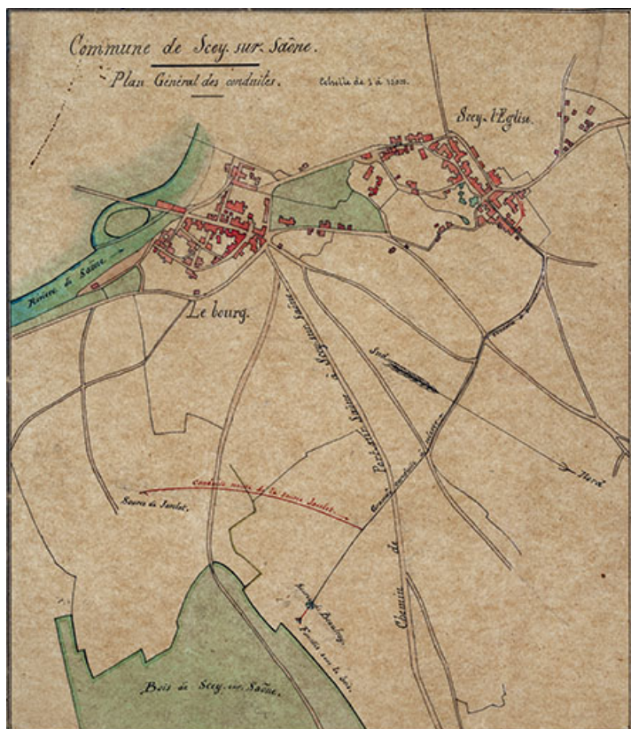
Plan montrant l'implantation du bâti à Sceaux-sur-Saône (1862). 70, Sceaux-sur-Saône-et-Saint-Albin