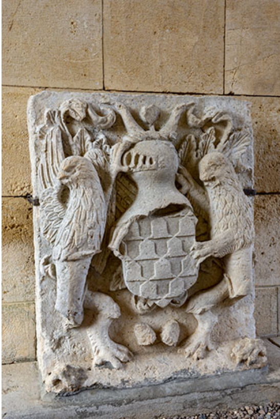
Pierre avec relief représentant les armoiries de la famille de Bauffremont. 70, Scey-sur-Saône-et-Saint-Albin