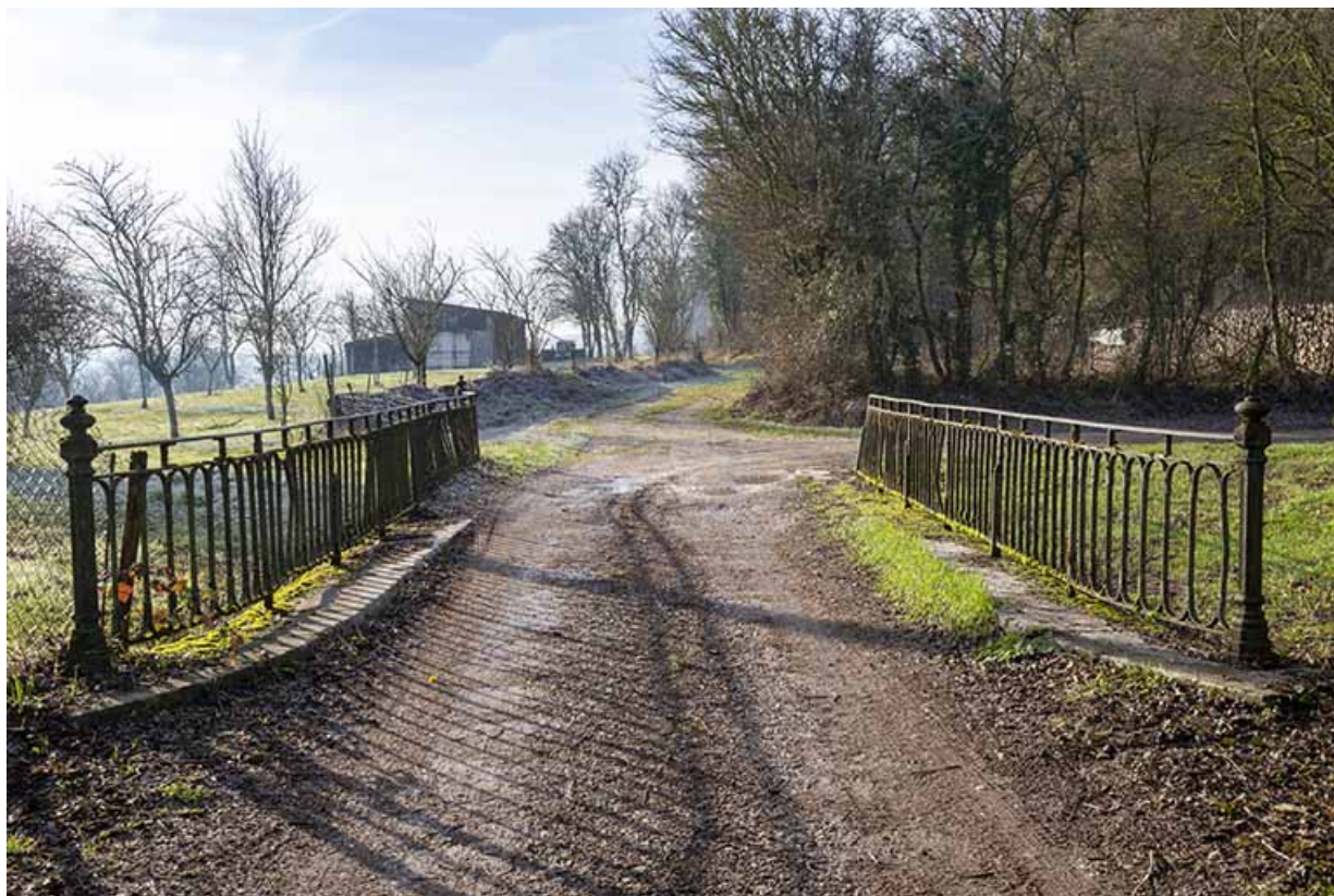
Pont franchissant la tranchée de la voie ferrée (aujourd'hui comblée) dans le quartier de l'Église.