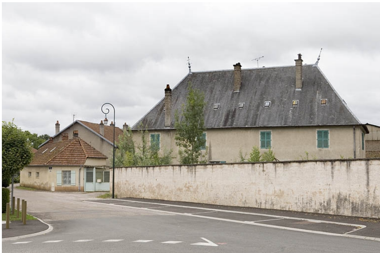
Conciergerie et logement patronal depuis le nord. 70, Scey-sur-Saône-et-Saint-Albin