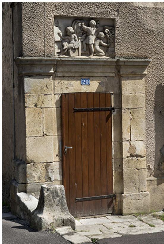
Maison Lempereur, rue de l'Eglise.