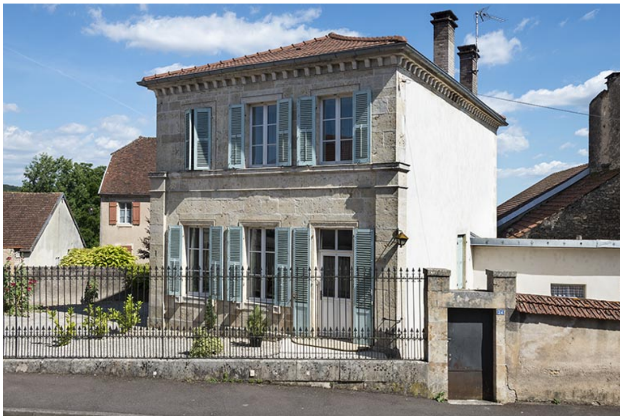
Ancienne école des filles, quartier de l'église. 70, Sceaux-sur-Saône-et-Saint-Albin