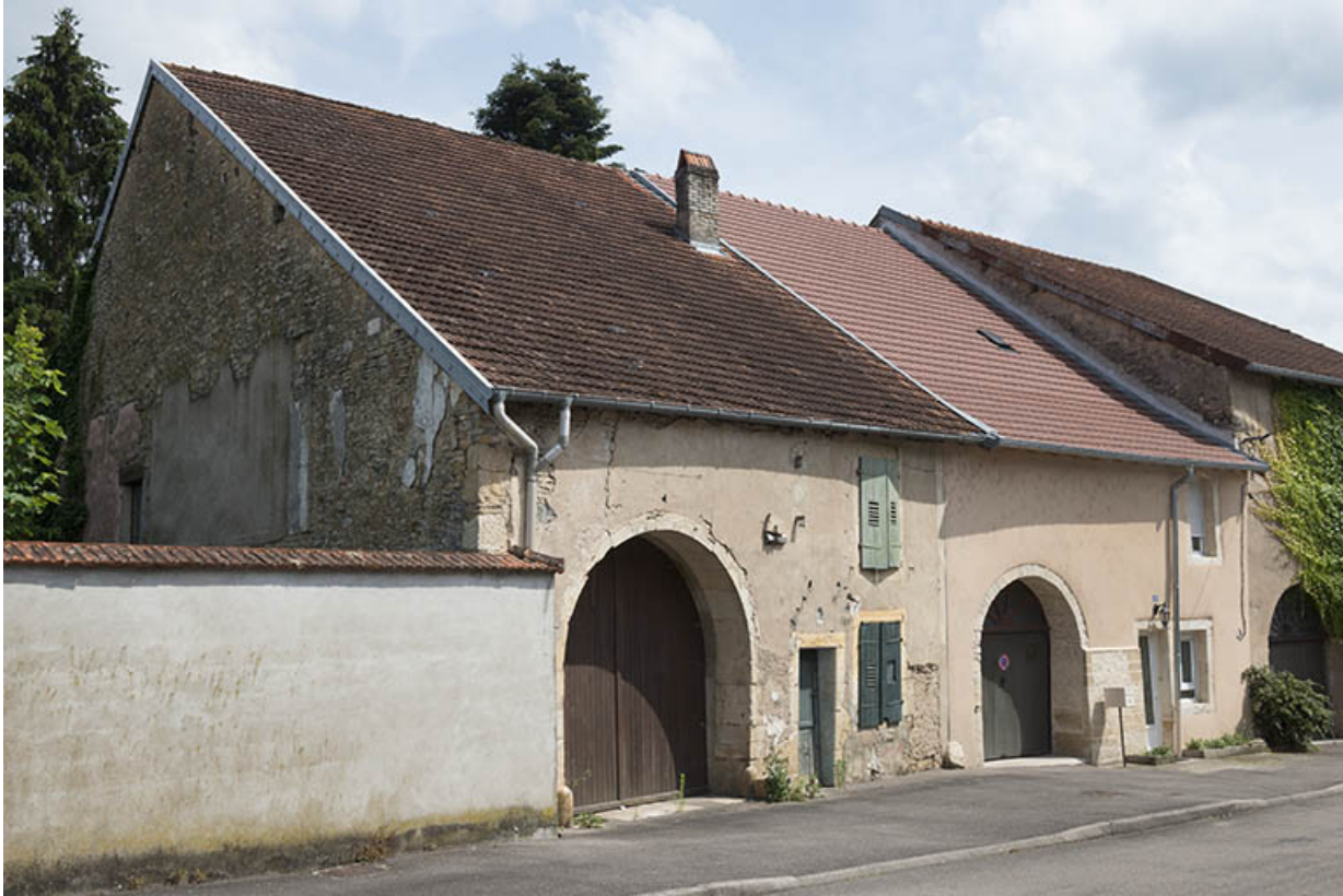
Ensemble de deux fermes, Grande rue du Bourg.