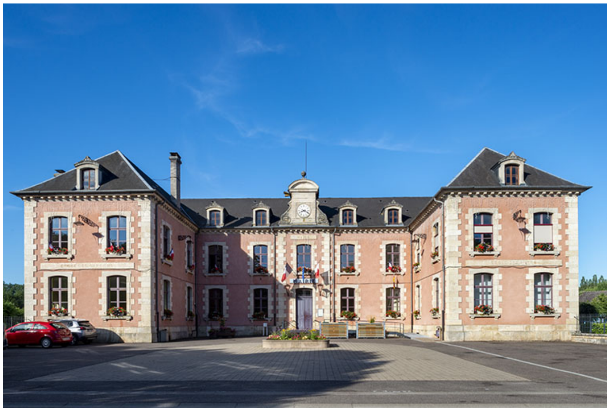
Maison commune, justice de paix et école de la seconde moitié du 19e siècle. 70, Sceaux-sur-Saône-et-Saint-Albin