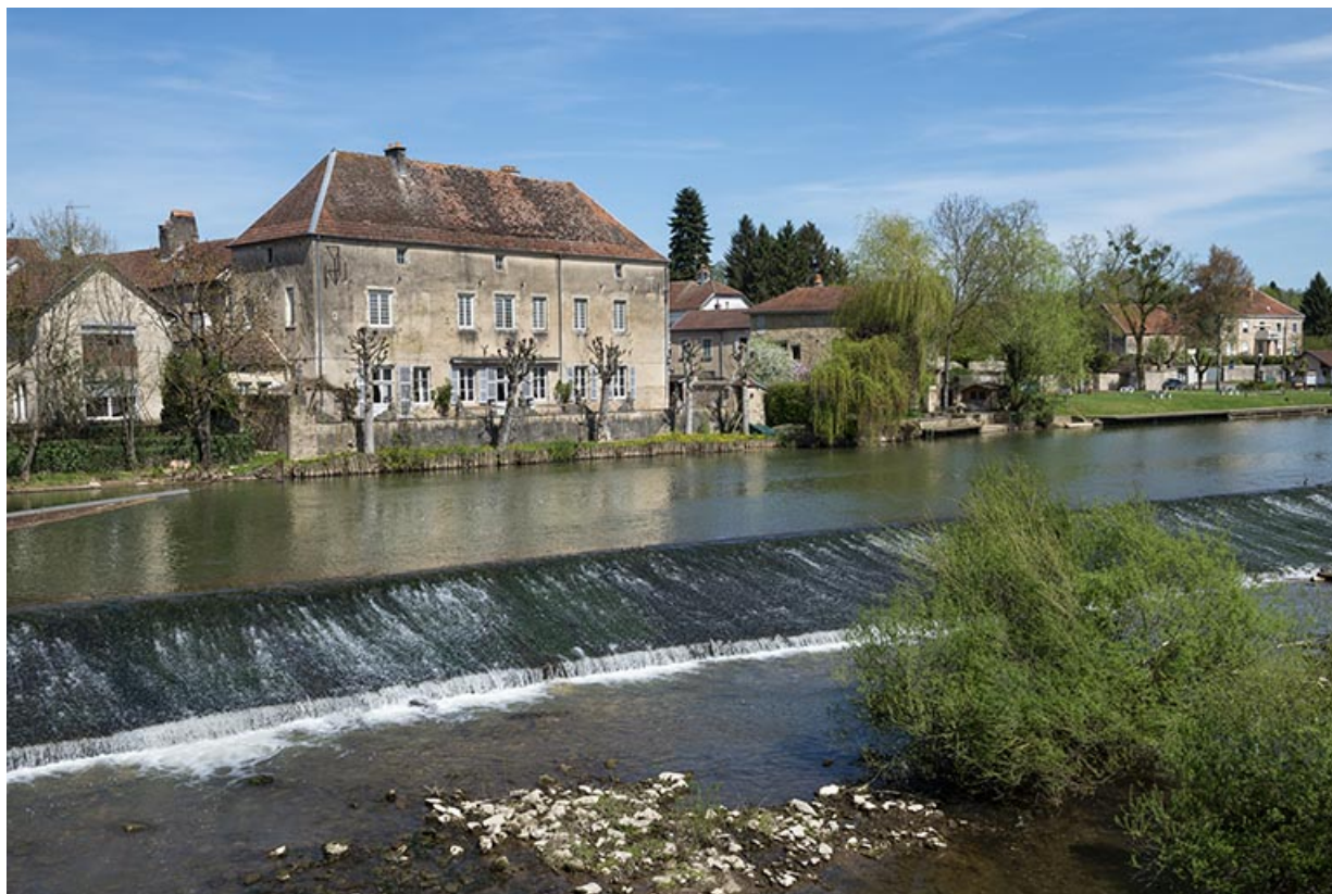
Le barrage dans le méandre de la Saône.

70, Scey-sur-Saône-et-Saint-Albin, 8-10 rue de l' Enfer