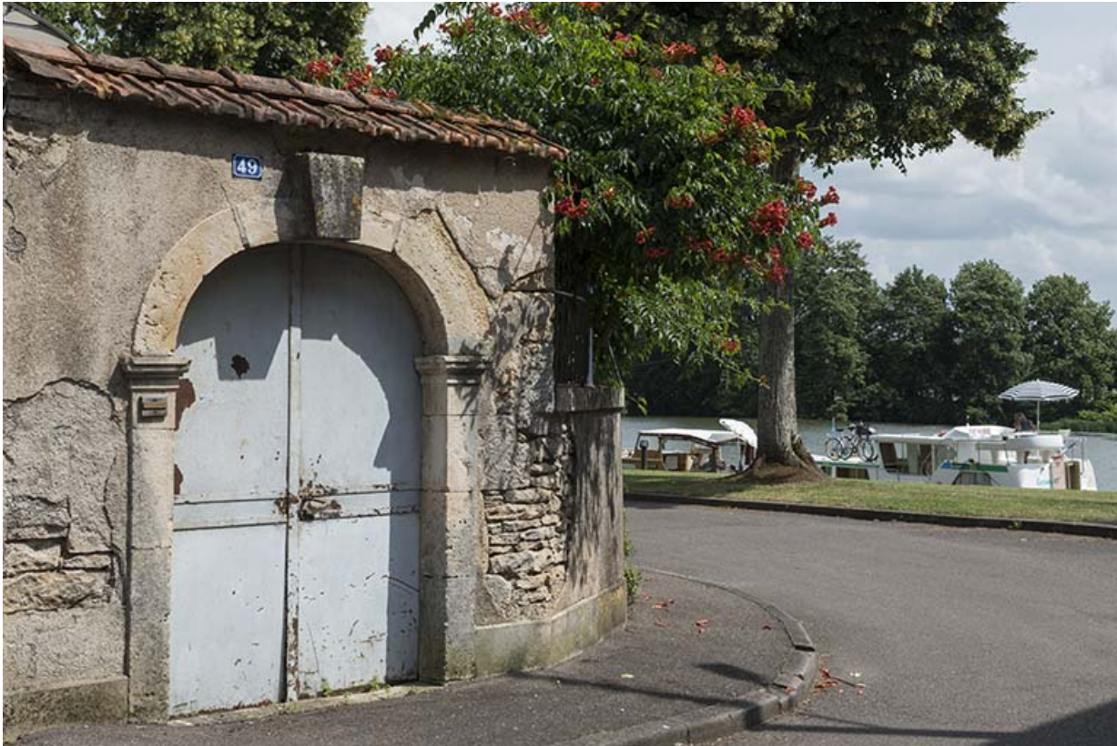
Portail, Grande rue du Bourg, et la Saône en arrière plan.