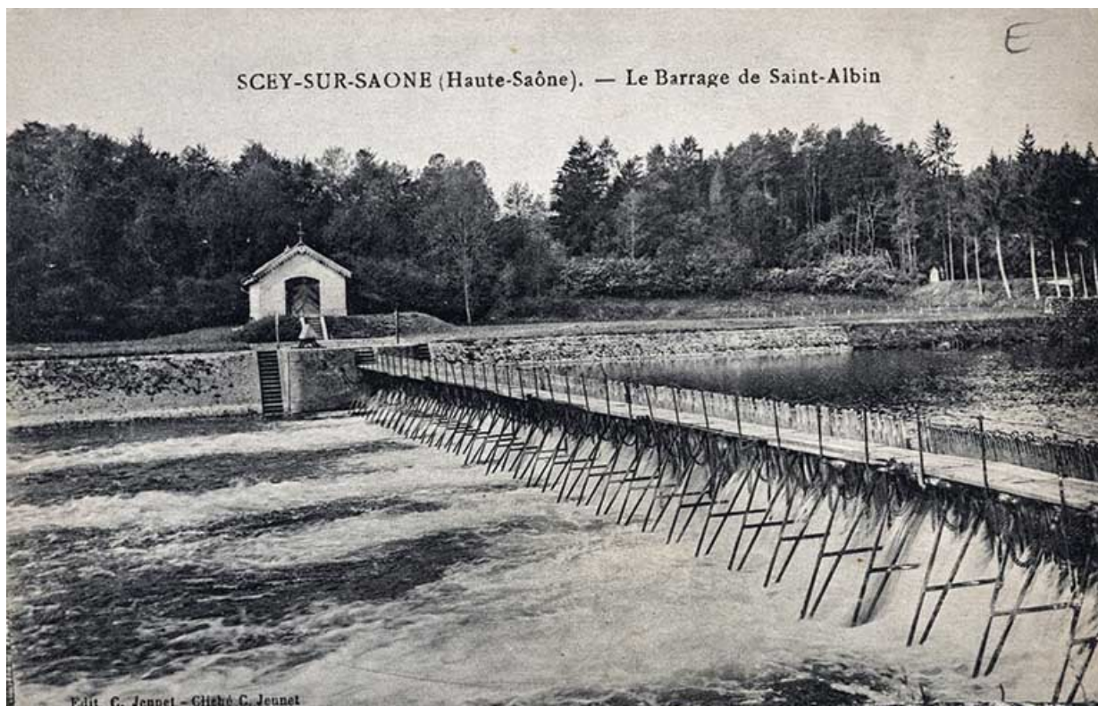
Le barrage à aiguilles de Saint-Albin, carte postale.