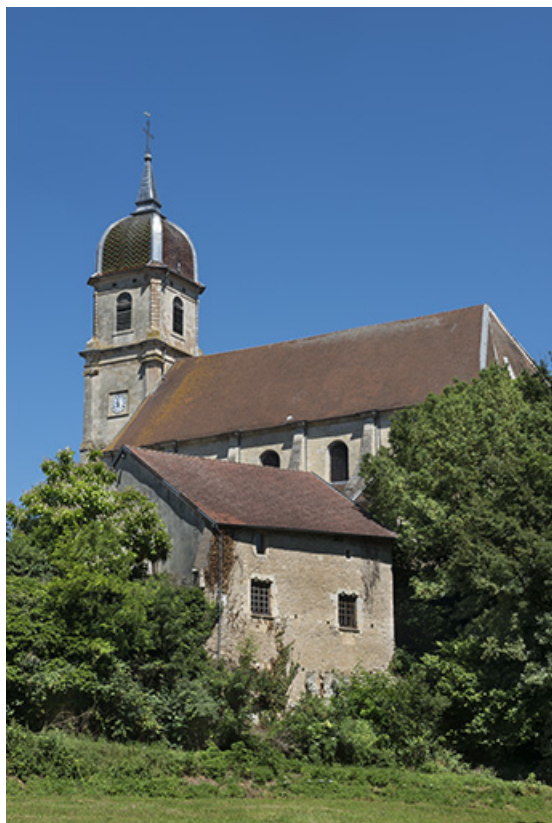
Église paroissiale Saint-Martin. 70, Scey-sur-Saône-et-Saint-Albin