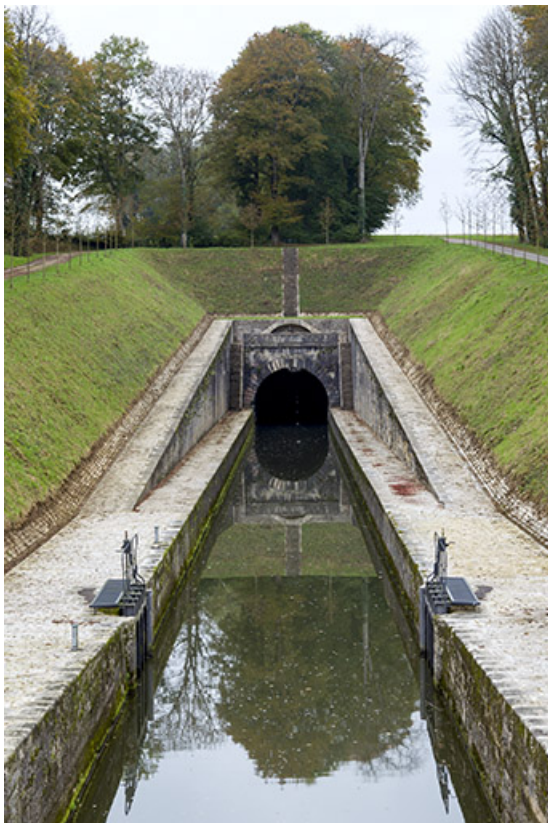
Entrée amont du tunnel de Saint-Albin.