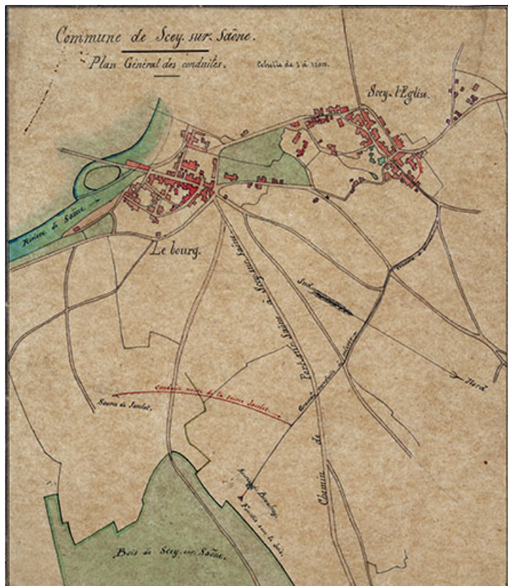
Plan montrant l'implantation du bâti à Scey-sur-Saône (1862).