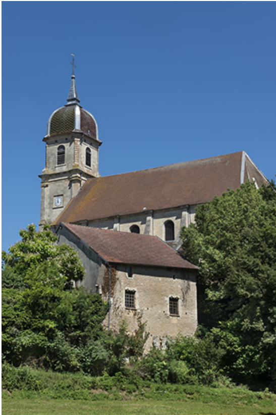
Église paroissiale Saint-Martin. 70, Scey-sur-Saône-et-Saint-Albin