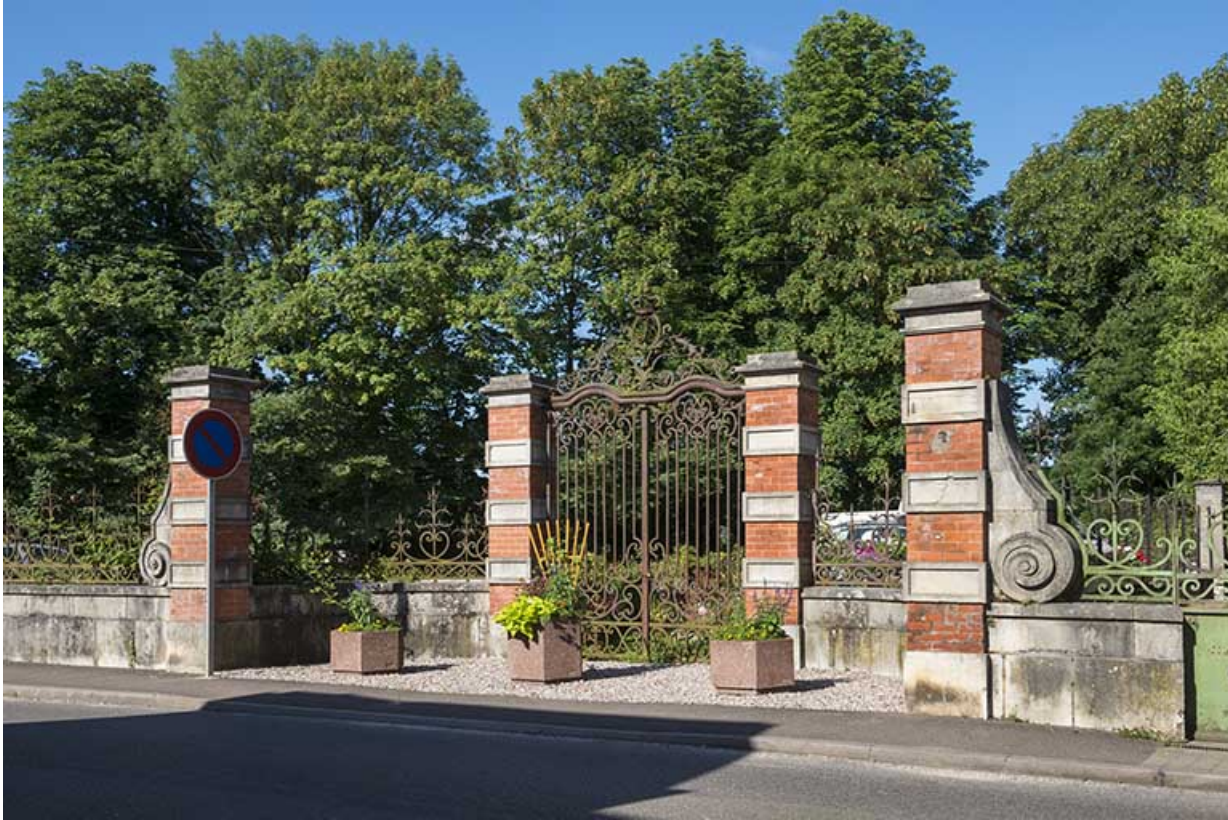
Clôture (grille) sur la rue Armand Paulmard. 70, Scey-sur-Saône-et-Saint-Albin