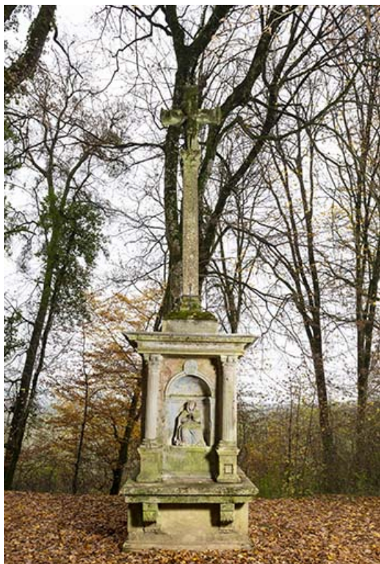
Vue d'ensemble, de face.

70, Scey-sur-Saône-et-Saint-Albin chemin de défrèvement, lieudit : écart de Saint-Albin