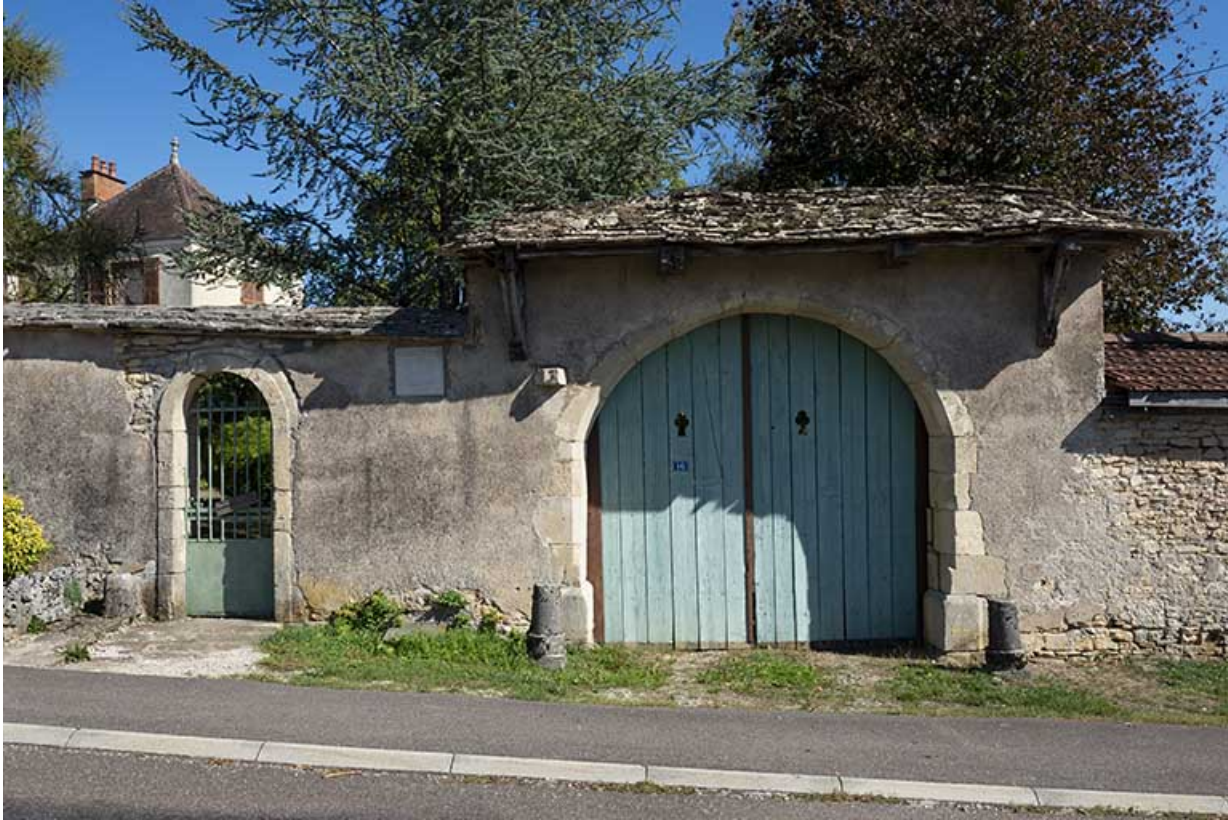
Demeure des Macon d'Esboz, rue de Duez. 70, Scey-sur-Saône-et-Saint-Albin