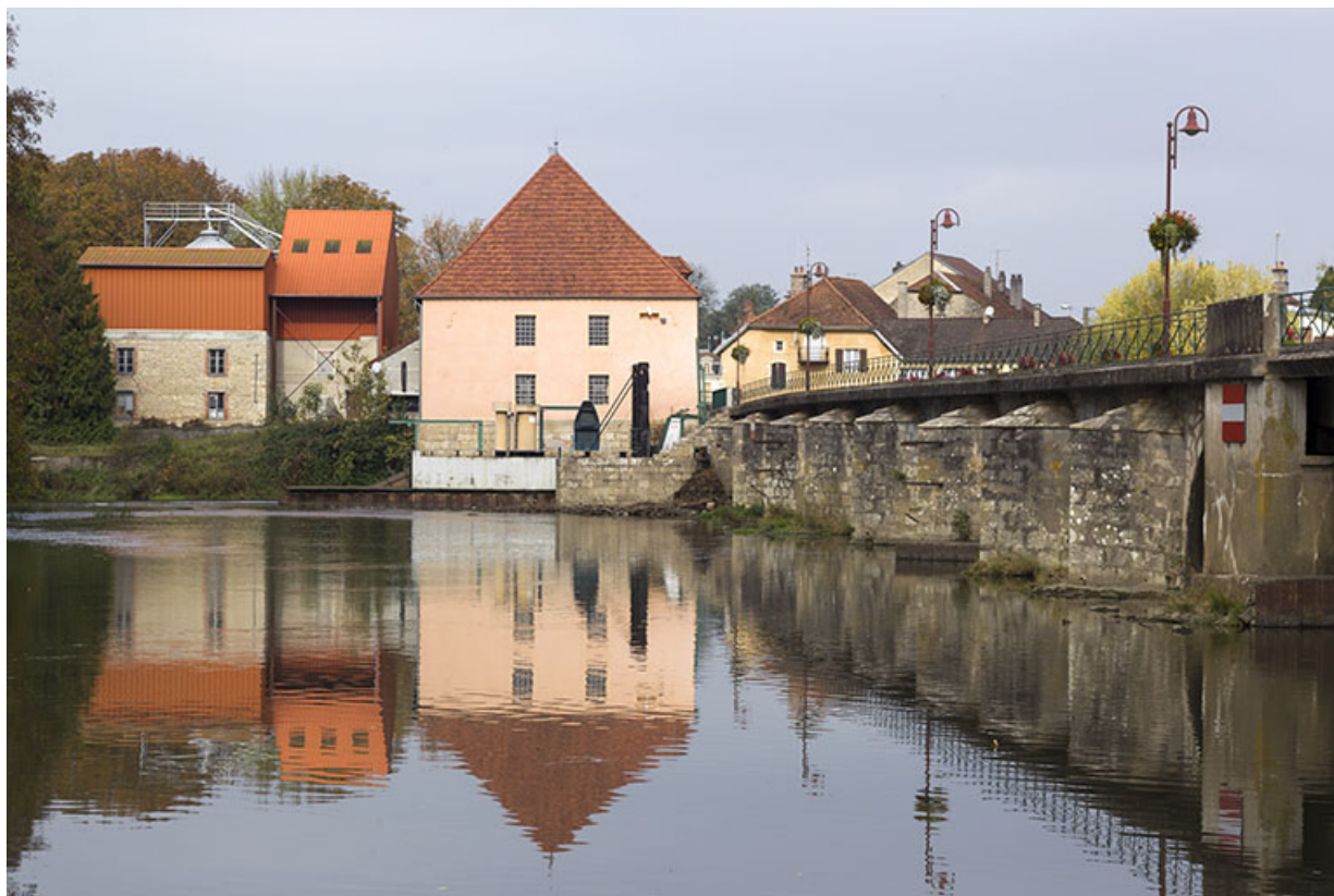
La Saône, le pont et la centrale hydroélectrique.