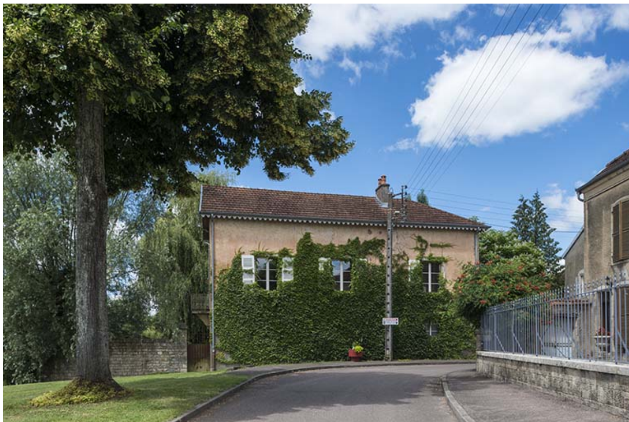
Ancienne tannerie, grande rue du Bourg. 70, Sceaux-sur-Saône-et-Saint-Albin