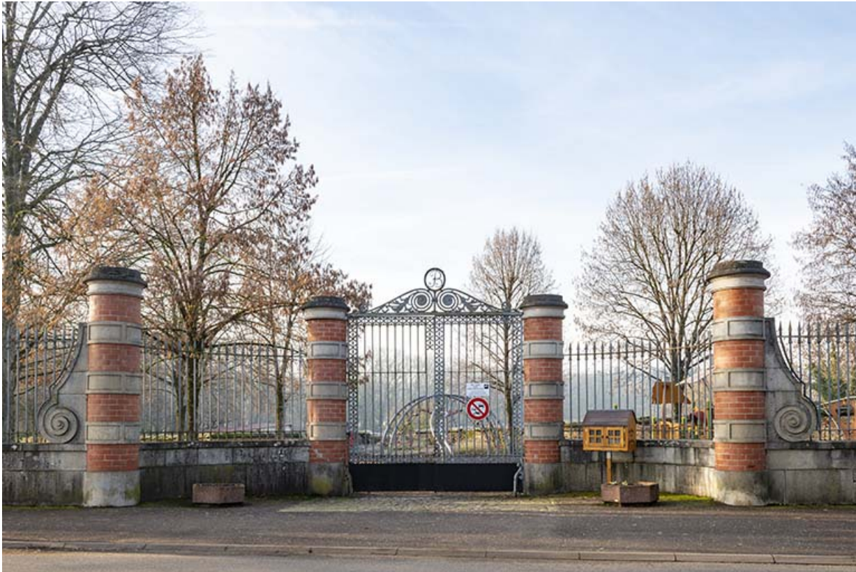
Clôture (grille) sur l'avenue des Pâtis.