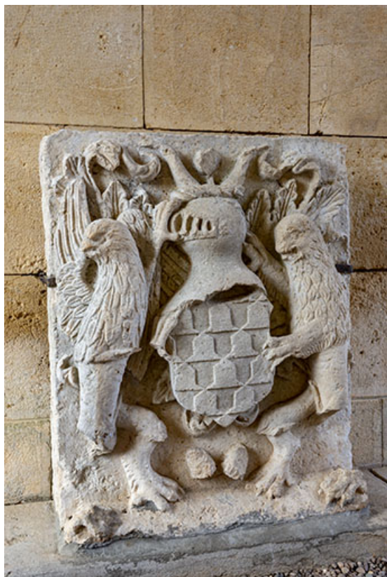
Pierre avec relief représentant les armoiries de la famille de Bauffremont. 70, Scey-sur-Saône-et-Saint-Albin