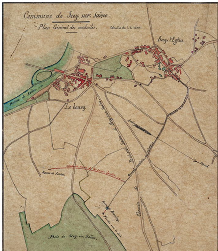
Plan montrant l'implantation du bâti à Sceaux-sur-Saône (1862). 70, Sceaux-sur-Saône-et-Saint-Albin