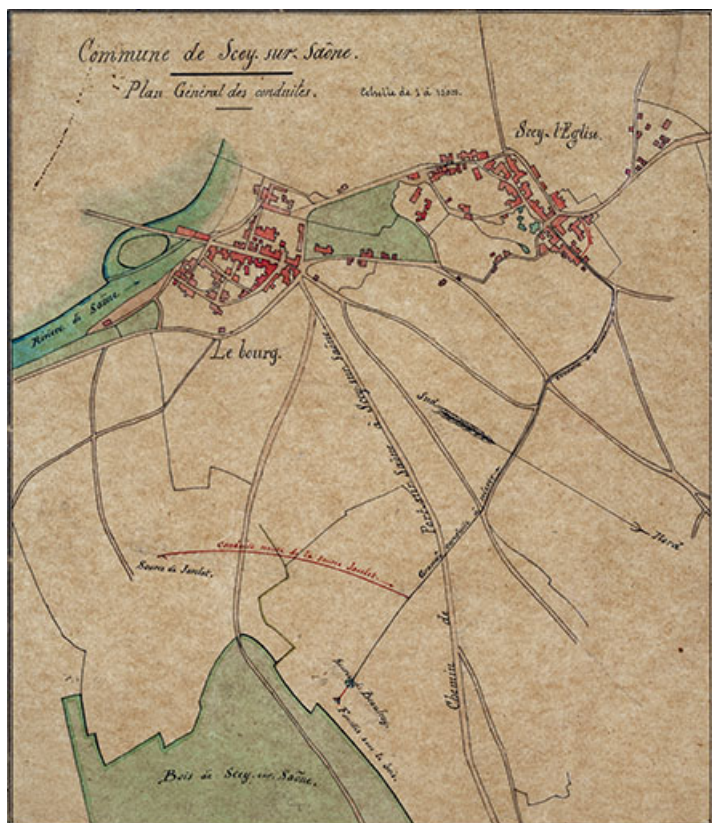
Plan montrant l'implantation du bâti à Scey-sur-Saône (1862). 70, Scey-sur-Saône-et-Saint-Albin