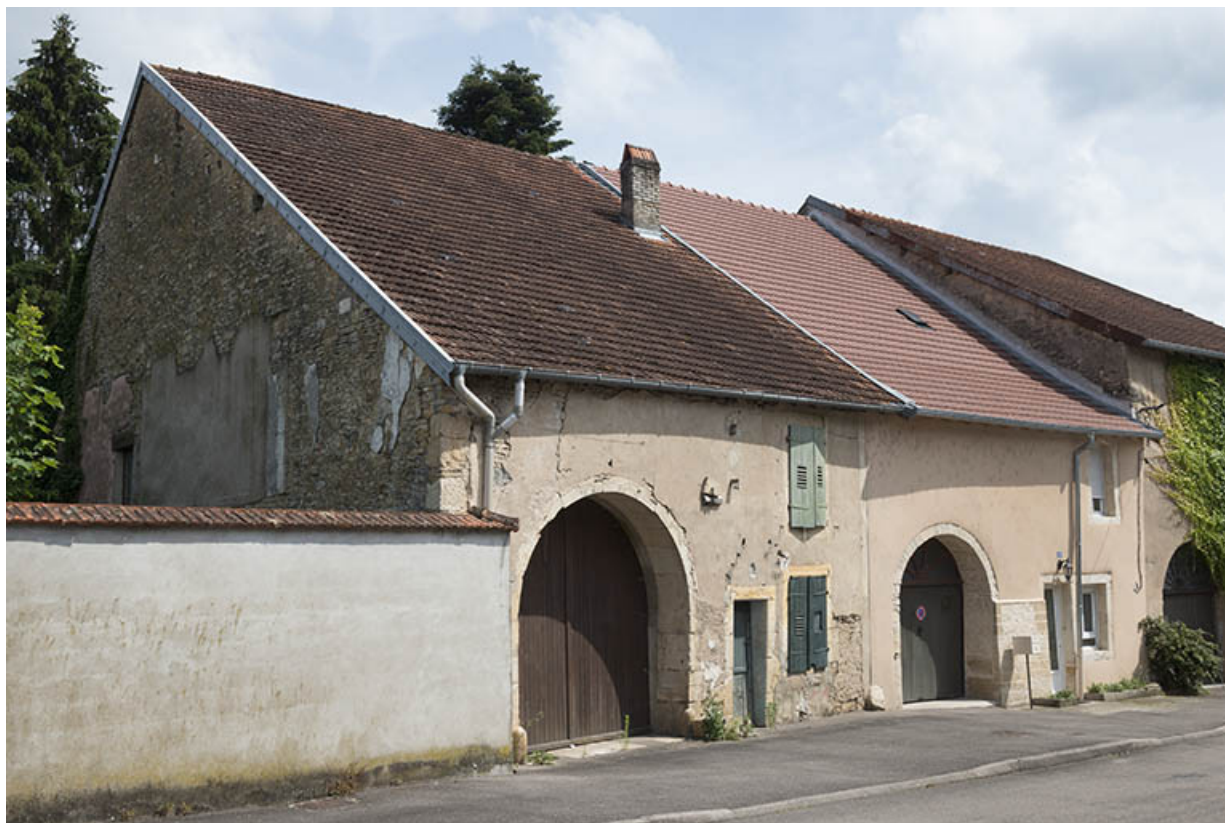
Ensemble de deux fermes, Grande rue du Bourg. 70, Sceaux-sur-Saône-et-Saint-Albin