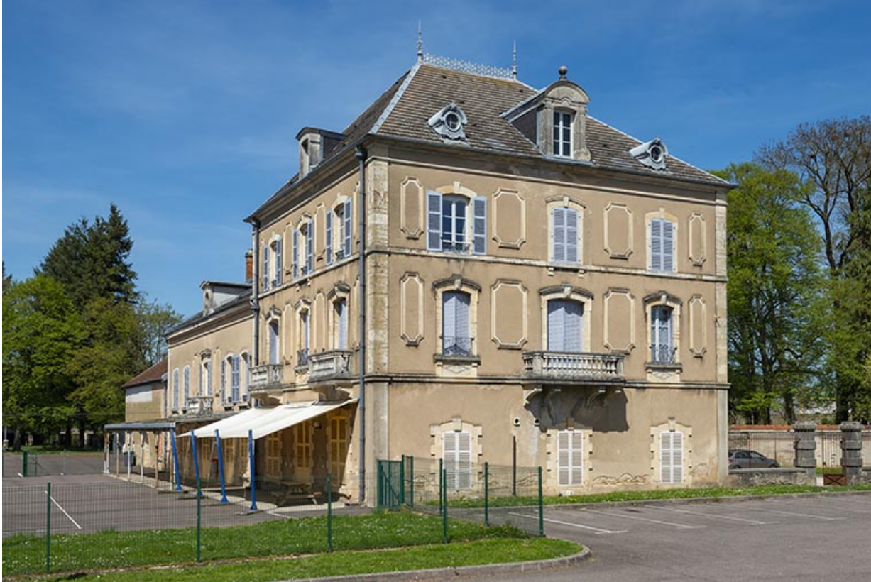
Demeure n°1 rue de Duez dite Château Rance. 70, Scey-sur-Saône-et-Saint-Albin