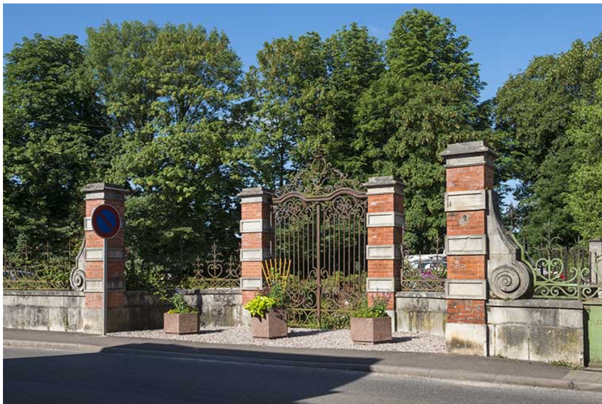
Clôture (grille) sur la rue Armand Paulmard. 70, Scey-sur-Saône-et-Saint-Albin