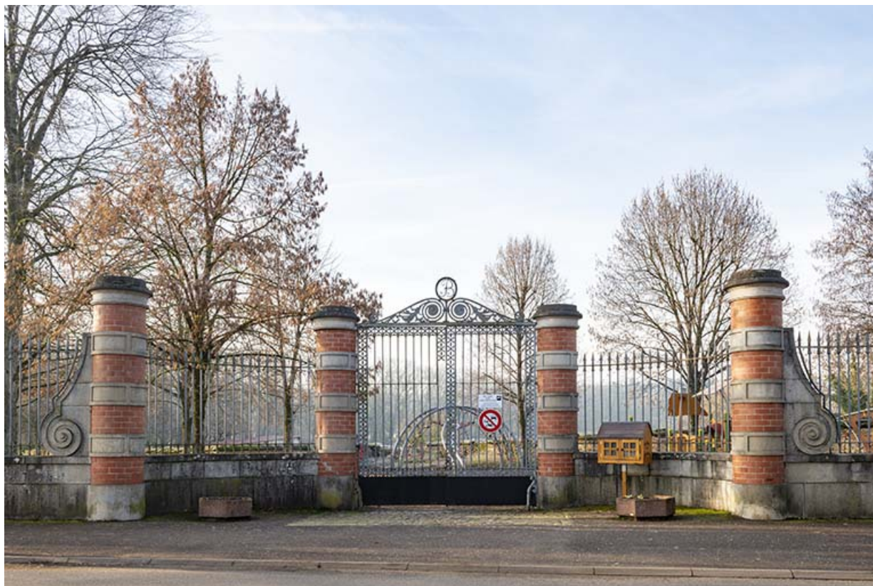
Clôture (grille) sur l'avenue des Pâtis.