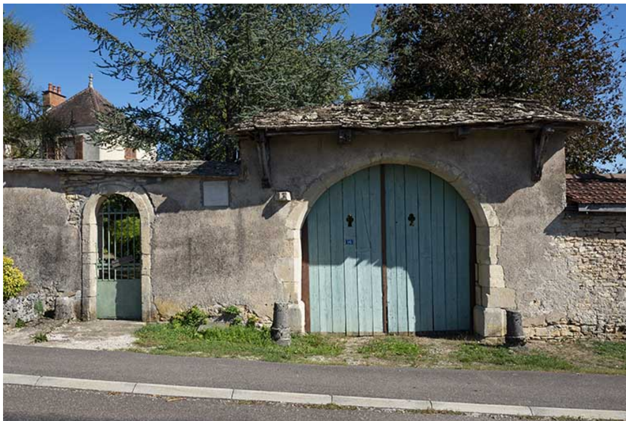
Demeure des Maçon d'Esboz, rue de Duez. 70, Scey-sur-Saône-et-Saint-Albin