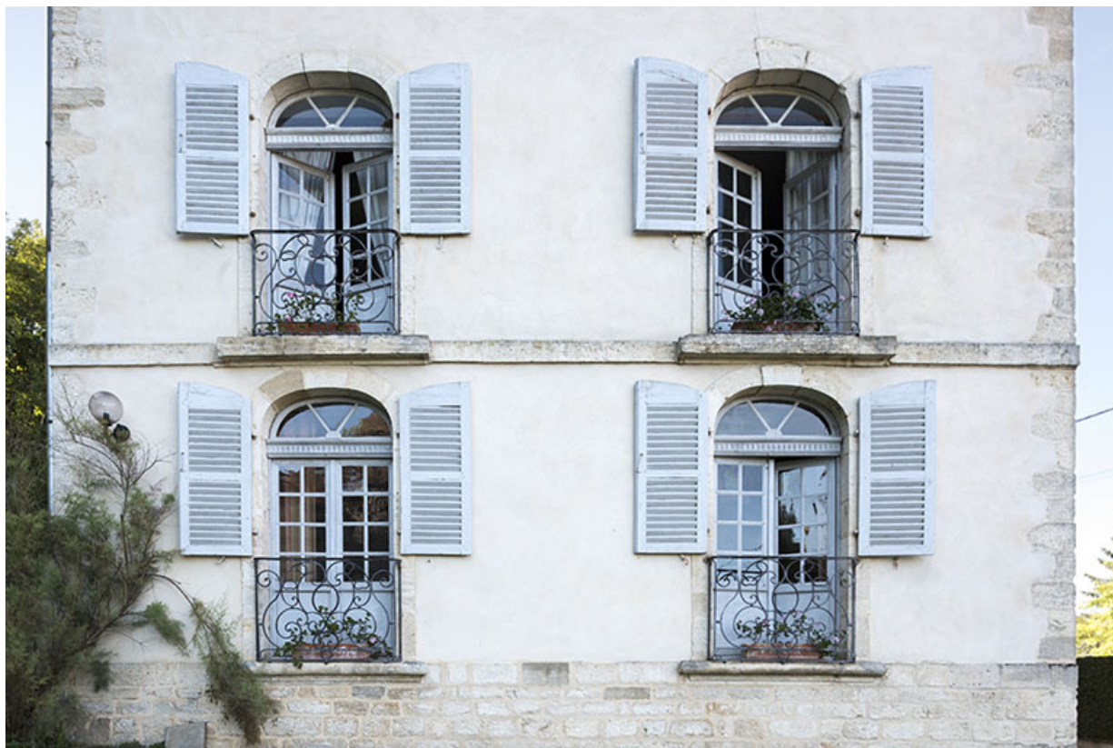
Ensemble des baies de la façade latérale droite.