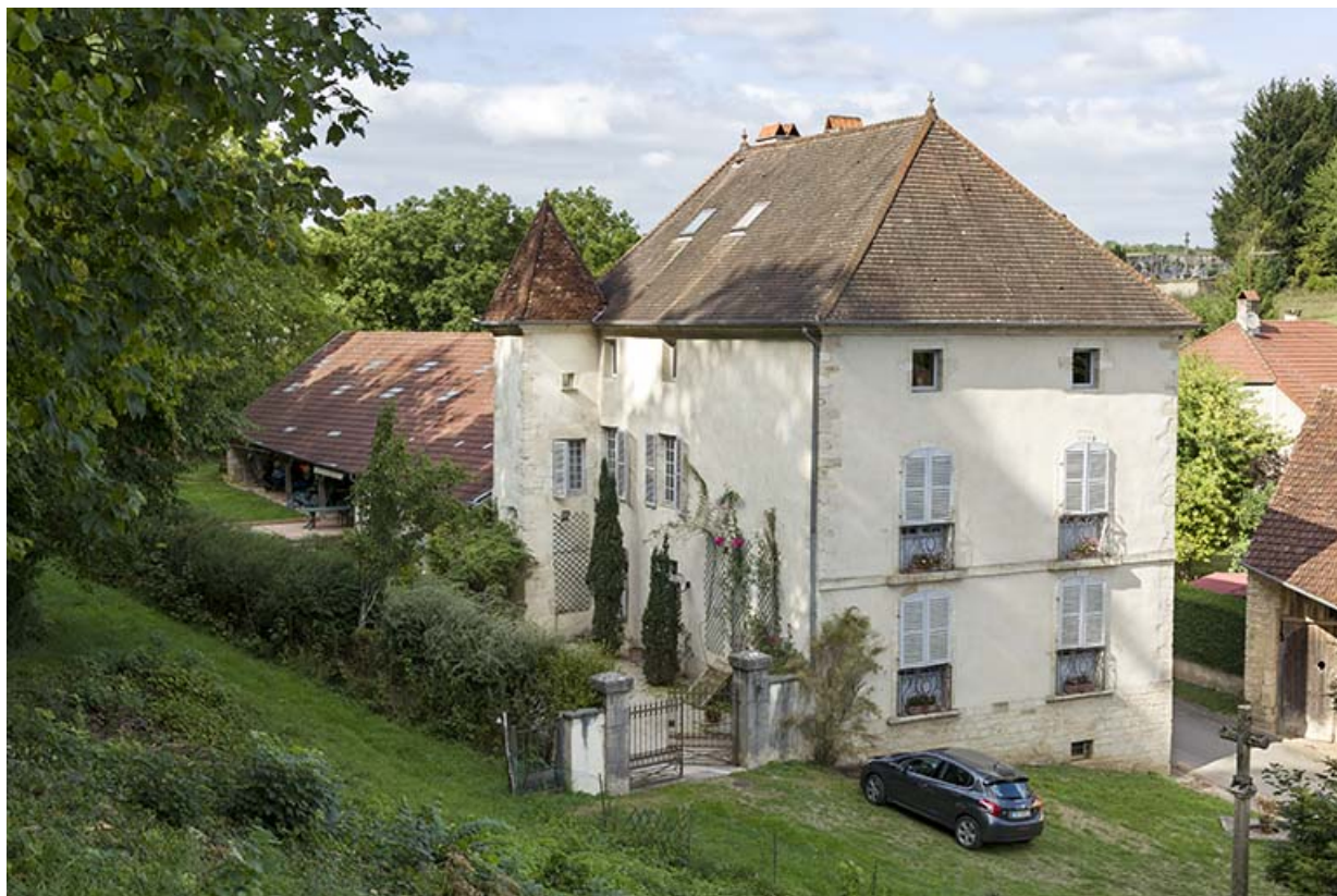
Vue générale de trois quart de la façade antérieure, avec la tourelle et l'ancien "grangeage". 70, Rupt-sur-Saône, 3 rue de la Garenne